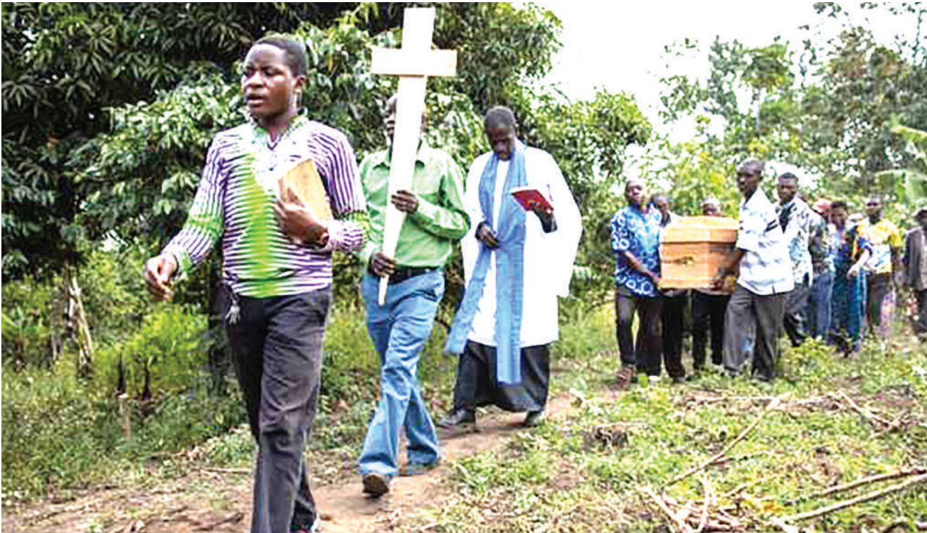
Baadhi ya wakazi wa Kijiji cha Mpondwe nchini Uganda wakishiriki mazishi ya mmoja wa wanafunzi waliouawa katika Shule ya Sekondari ya Lhubiraha, baada ya waasi kuvamia na kuchoma moto mabweni na kuua wanafunzi 42.