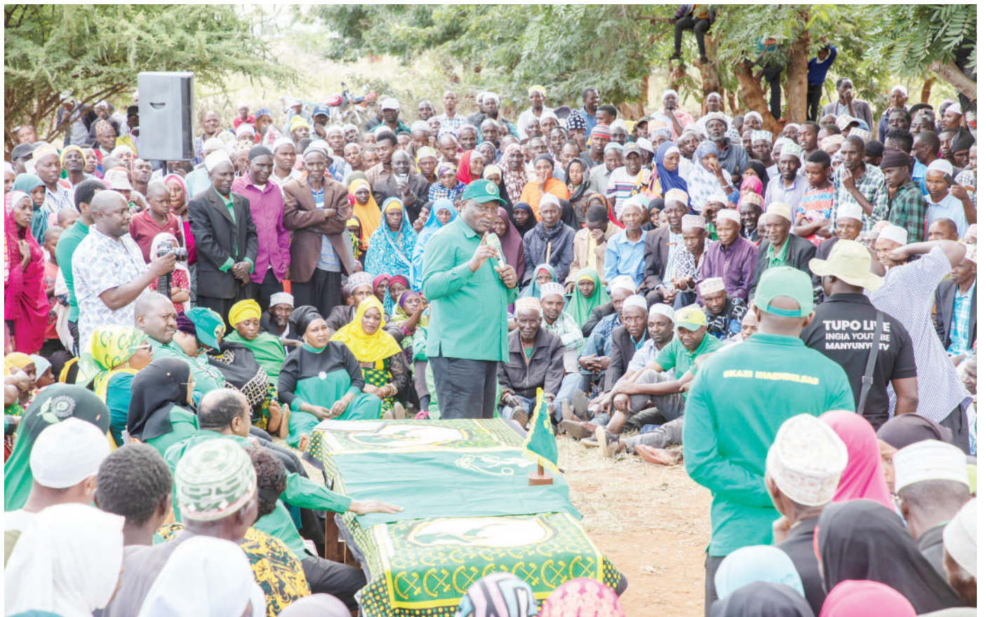
Katibu Mkuu wa Chama Cha Mapinduzi, Daniel Chongolo, akizungumza wakati wa kikao cha nje na wakazi wa Kata ya Keikei, Kondo mkoani Dodoma.