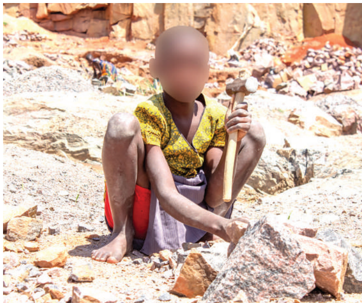
Katiba mpya imalize umaskini na maisha duni ya Watanzania.

Kuhakikisha wananchi wakuwa na maisha bora mijini na vijijini ni suala la masilahi ya taifa. Maisha bora kwa kila Mtanzania ni suala muhimu sana ikiwa ni pamoja na uhakika wa chakula na makazi bora. Turejee kwenye misingi ya mwasisi wa