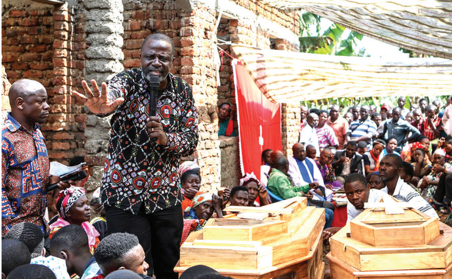
Mazishi ya baadhi ya wanafunzi wa Sekondari ya Lhubiriha waliouawa na ADF.