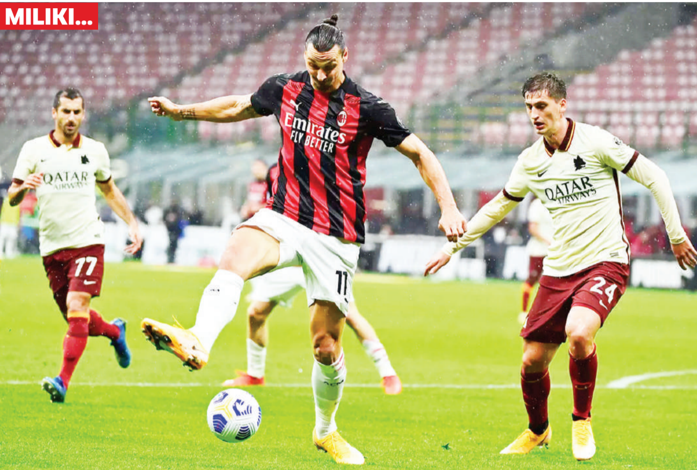
Mshambuliaji wa AC Milan, Zlatan Ibrahimovic, akimiliki mpira dhidi ya mabeki wa AS Roma wakati wa mechi ya Ligi Kuu Italia, Serie A iliyopigwa Uwanja wa Giuseppe Meazza juzi na timu hizo kutoka sare ya mabao 3-3. Kwa mabao hayo sasa yanamfanya Ibrahimovic kukaa kileleni mwa orodha ya wafungaji katika ligi hiyo.