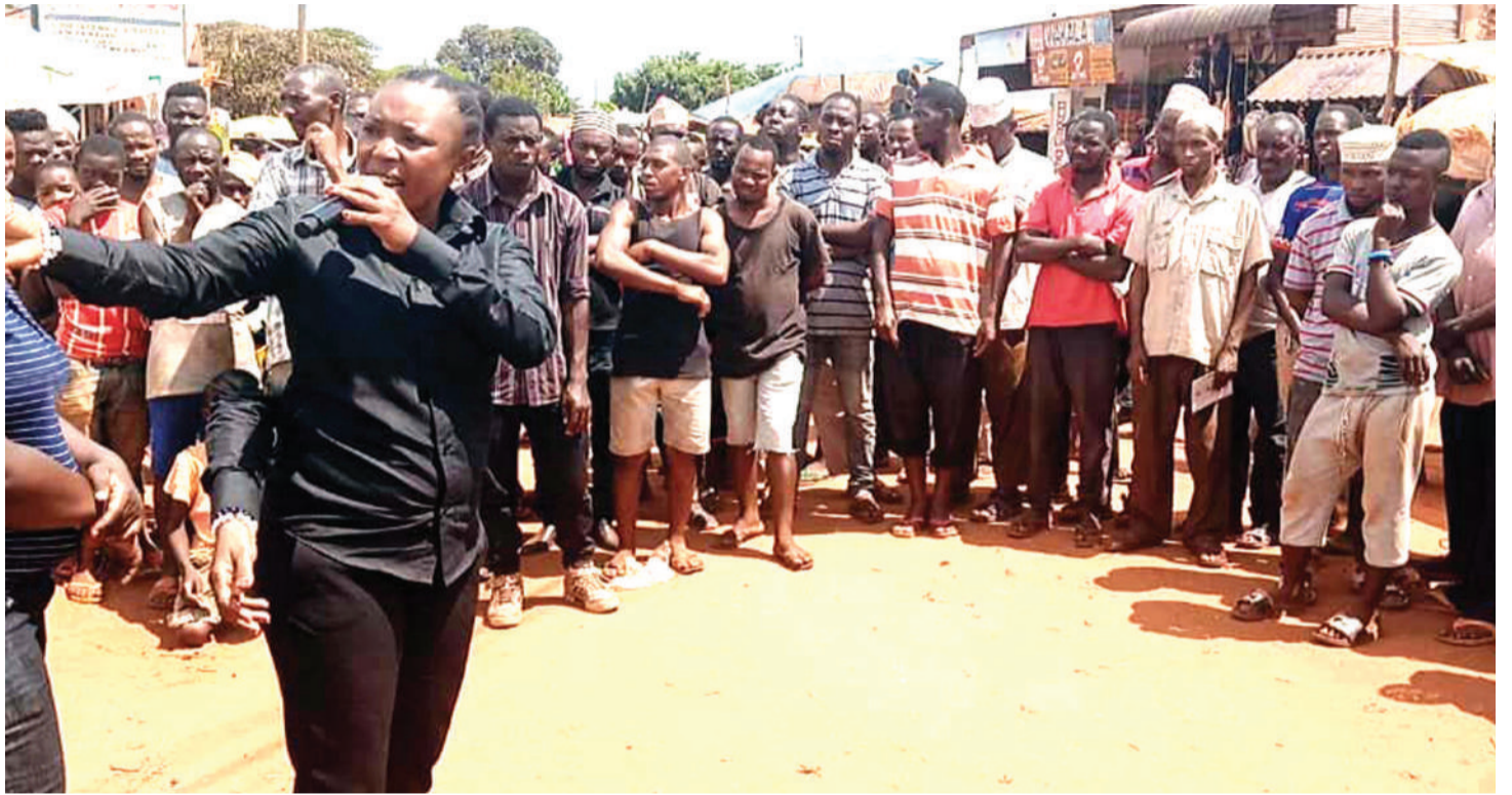
Mgombea urais kwa tiketi ya ADC Queen Sendiga, akifanya kampeni mitaani.