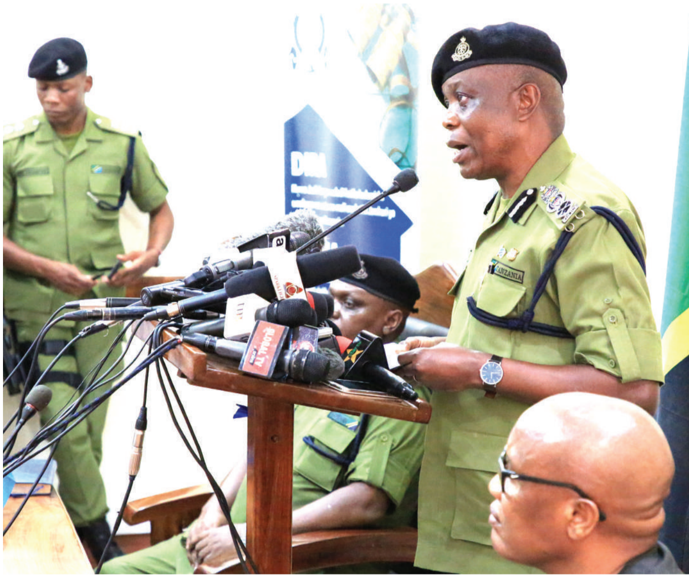
Mkuu wa Jeshi la Polisi nchini, (IGP) Simon Sirro, akizungumza na waandishi wa habari, jijini Dar es Salaam jana, akiwataka wananchi kudumisha amani wakati wa kupiga kura katika uchaguzi mkuu unaofanyika leo nchini kote.