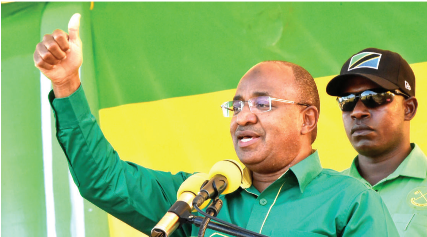
Mgombea urais Zanzibar, Dk. Hussein Mwinyi, katika kampeni za uchaguzi mwaka huu. Aidha, alitumia fursa hiyo kukutana na makundi mbalimbali kusikiliza maoni yao badala ya kuwahutubia.