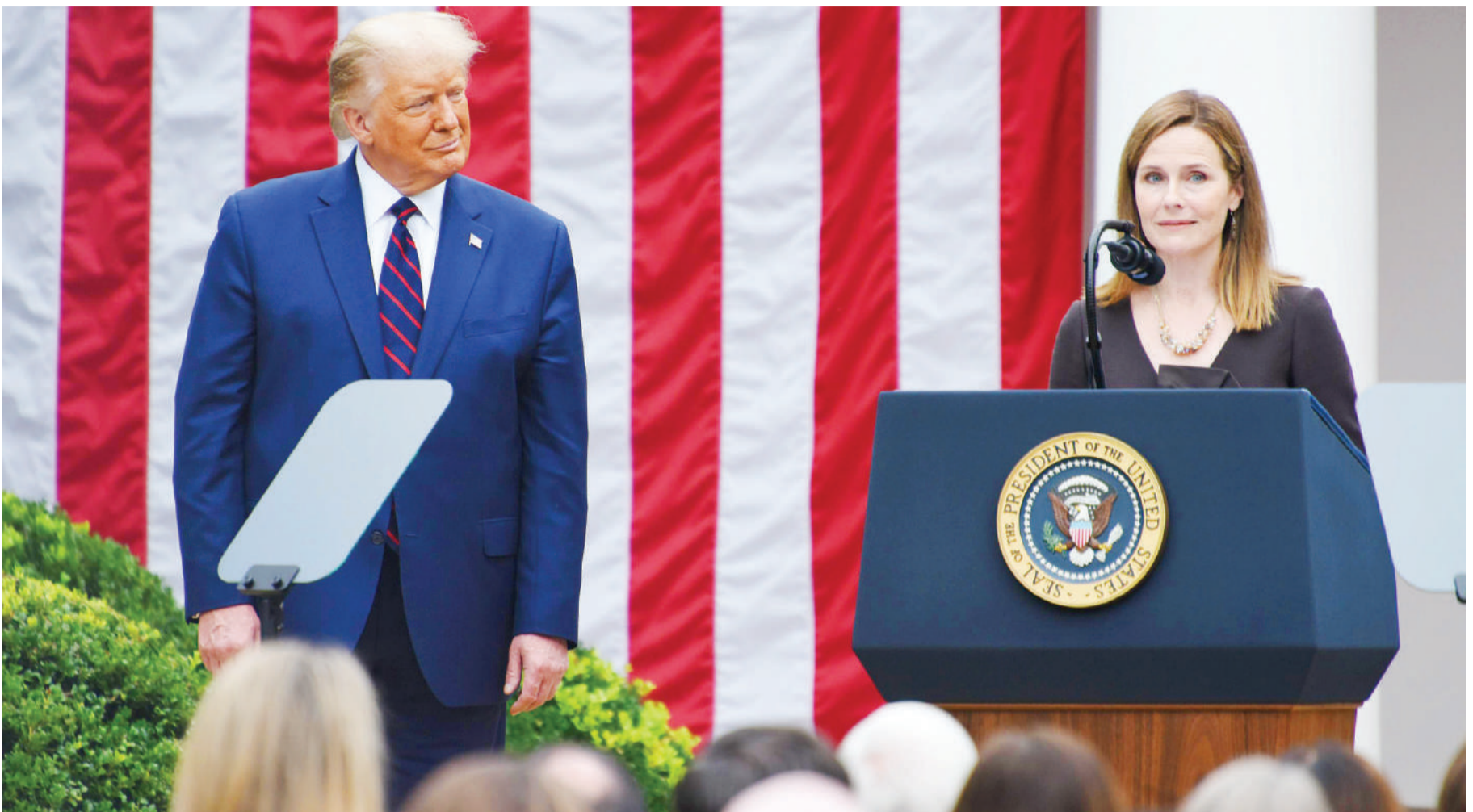
Donald Trump akiwa na Jiji Mkuu mpya.