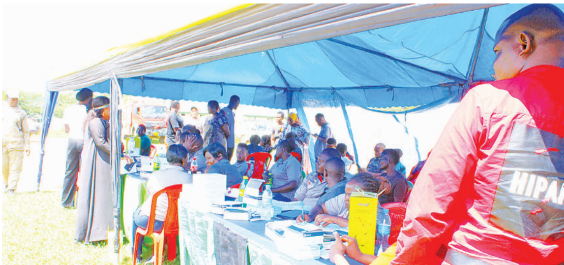
Maadhimisho ya kilele cha Siku ya Ukimwi Duniani yakiendana na huduma mbalimbali zinazohusiana.

Waziri Mkuu anahitimisha nasaha zake kwa kauli: "Serikali, haitosita kuchukua hatua kwa yeyote atakayebainika kujihusisha na vitendo vya unyanypaa na ubaguzi," anasema.