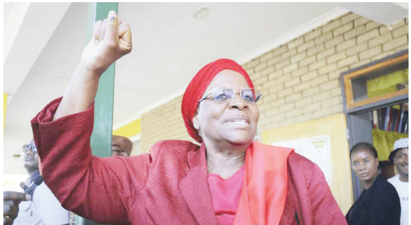
Rais mteule wa Namibia, Netumbo Nandi-Ndaitwah, akiongoza ngumi kama ishara ya ushindi baada ya kutangazwa kwa matokeo ya kura katika uchaguzi uliofanyika nchini humo.