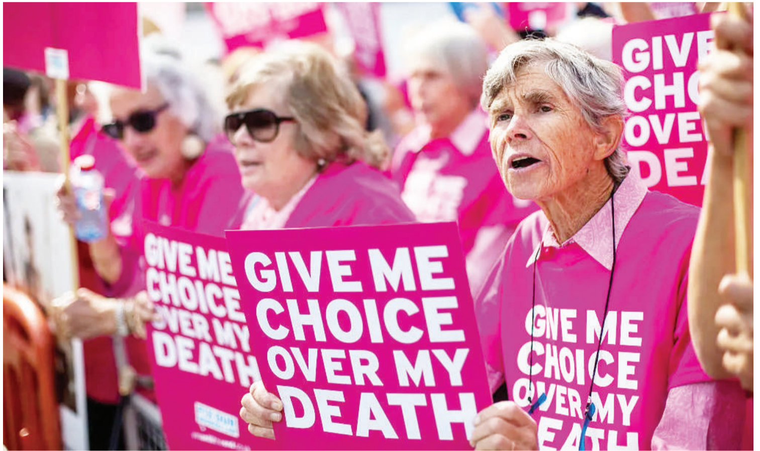
Wanaharakati wa nchini Uingereza, katika kampeni ya kumruhusu mgonjwa aliyeelemewa, aruhusiwe kuchagua kifo kwa hiari

Kuua kumuonea huruma mgonjwa kwa ndugu, kunafafanuliwa na wenye taaluma kuwa ni kufanyika uamuzi ya kusitisha uhai kwa sababu ya maumivu