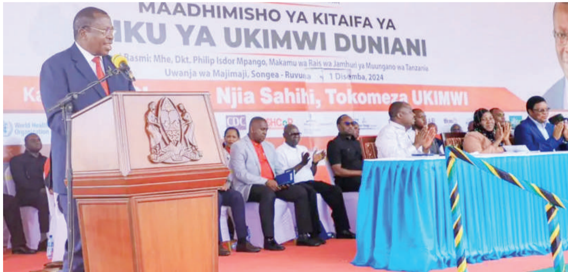
Makamu wa Rais, Dk. Philip Mpango, akihitubia kwenye kilele cha Siku ya Ukimwi Duniani, mjini Songea, Ruvuma, mnamo Desemba Mosi.

Ili kufikia Azimio la Kutokomeza Ukimwi Ifikapo mwaka 2030, kutoka Shirika la Umoja wa Mataifa linaloshughulikia Watu (UNAIDS) kuna ufafanuzi