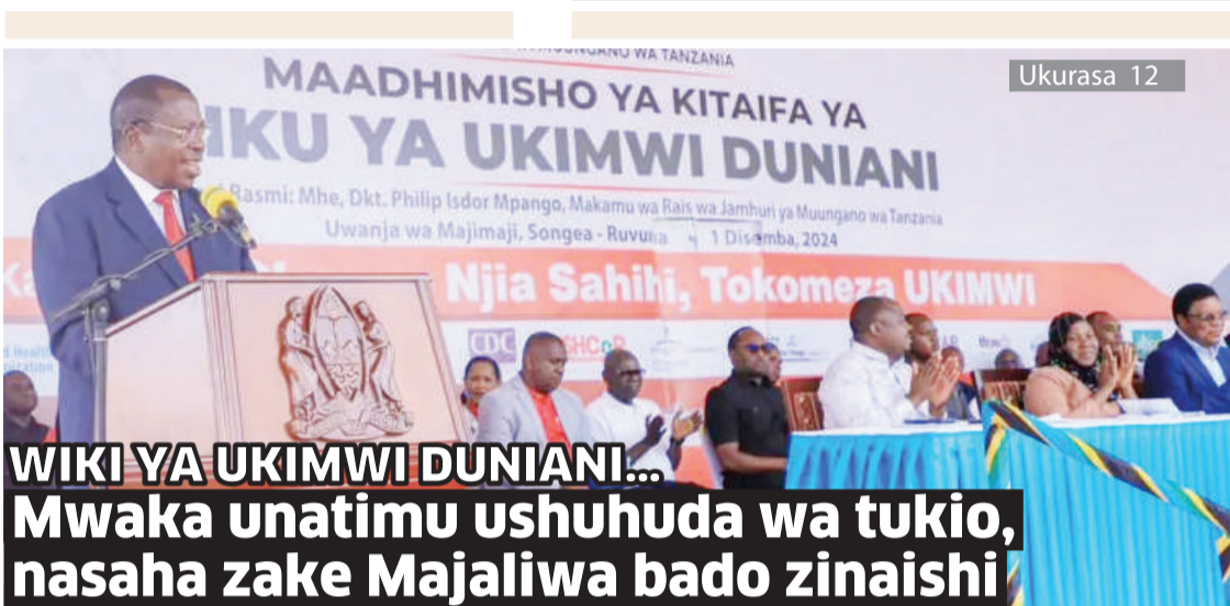
WIKI YA UKIMWI DUNIANI... Mwaka unatimu ushuhuda wa tukio, nasaha zake Majaliwa bado zinaishi