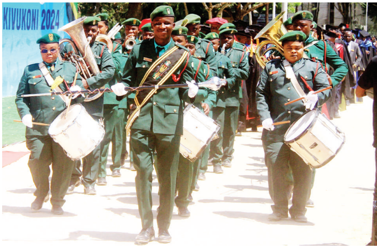
Brasi bendi ya Jeshi la Wananchi la Tanzania (JWTZ), ikitumbuiza katika sherehe za Mahafali ya 19 ya Chuo cha Kumbukumbu ya Mwalimu Nyerere cha jijini Dar es Salaam hivi karibuni.

Aliongeza marathon hiyo imekuwa na mchango mkubwa katika kuinua vipaji vya wananchi wa Rombo na kutoa fursa kufanyika michezo mingine kama mashindano ya mpira wa miguu kupitia Mkenda Cup.