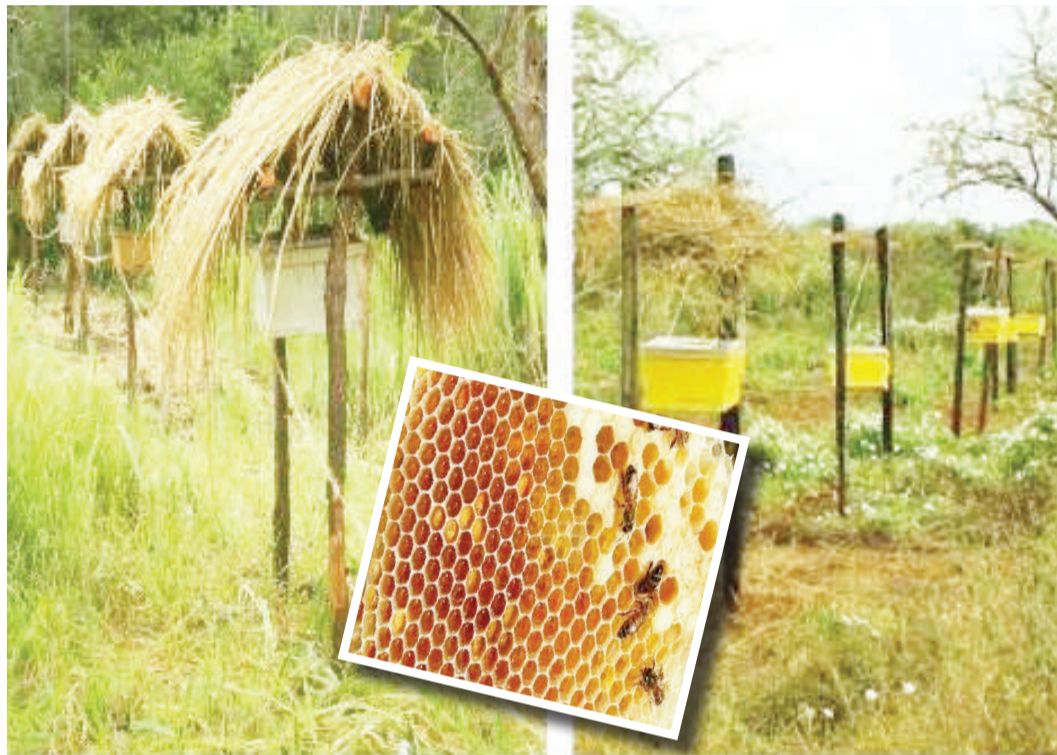
Nyuki wakitengeneza asali.

Bayoanuwai hiyo ina mtazamo wa kuunga mkono aina mbalimbali za wanyama, kuhakikisha makazi yanabaki imara na sala-