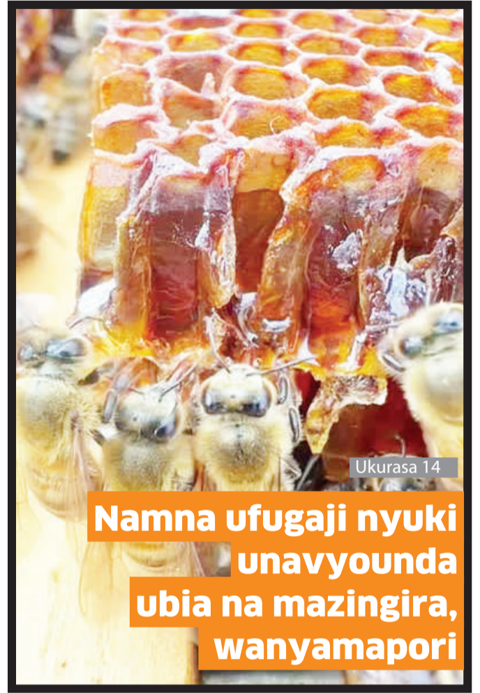
Namna ufugaji nyuki unavyounda ubia na mazingira, wanyamapori