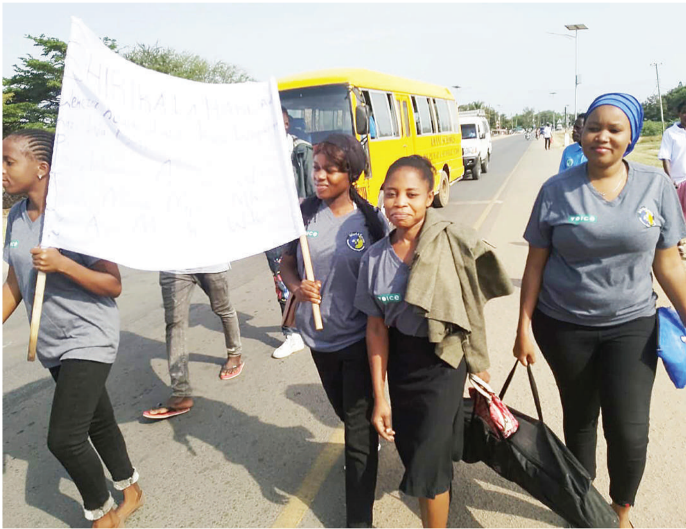
Baadhi ya wanachama wa Shirika la Haki Sawa kwa Wote lenye maskani yake, mjini Musoma, mkoani Mara, wakiwa katika maandamano ya amani juzi, kuadhimisha Siku 16 za Kupinga Ukatili wa Kijinsia.

Masanja, alisema amekuwa akiwakumbusha kufuata maelekezo ya wataalamu wa kilimo ili kupata mavuno ya kutosha na tumbaku yenye ubora na kukabiliana na ushindani katika soko la kimataifa.