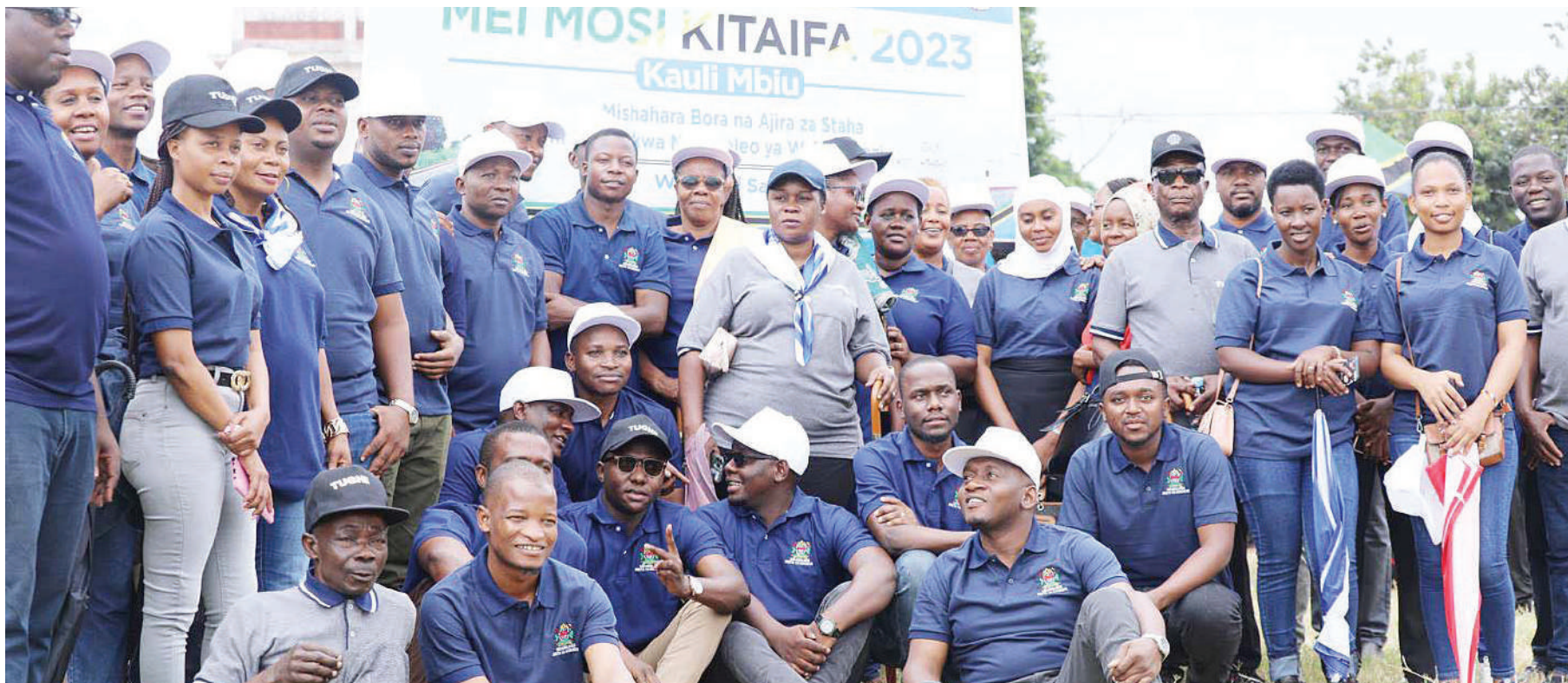
Wafanyakazi wa sekta ya Uchukuzi wakishiriki katika maadhimisho ya sherehe za Mei Mosi, jana jijini Dodoma.