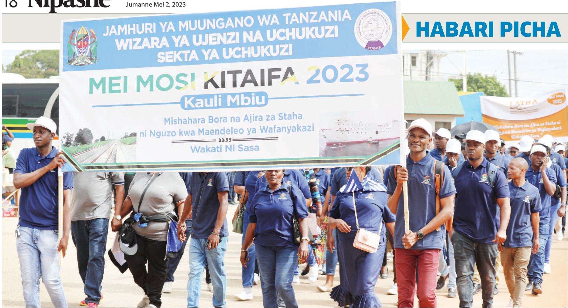
Wafanyakazi wa Wizara ya Ujenzi wakipita na bango lao katika maadhimisho ya Mei Mosi .