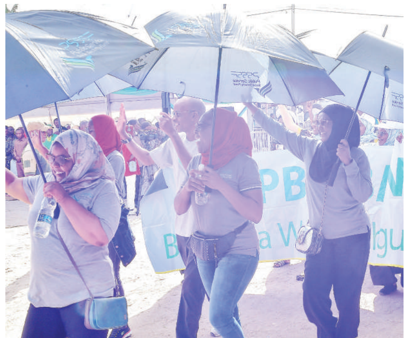
Wafanyakazi wa PSSSF wakiwa katika Maandamano ya Sherehe za Maadhimisho ya Siku ya Wafanyakazi Duniani, wakipita mbele ya mgeni rasmi Rais wa Zanzibar na Mwenyekiti wa Baraza la Mapinduzi, Dk.Hussein Ali Mwinyi.