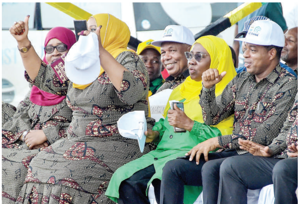
Baadhi ya Mawaziri wa SMZ wakishangilia wakati Rais wa Zanzibar na Mwenyekiti wa Baraza la Mapinduzi Dk. Hussein Ali Mwinyi (hayupo pichani) akihutubia.