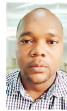
Na Halfani Chusi