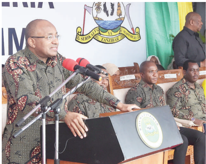
RAIS wa Zanzibar na Mwenyekiti wa Baraza la Mapinduzi, Dk. Hussein Ali Mwinyi, akihutubia katika Sherehe za Maadhimisho ya Siku ya Wafanyakazi Duniani, katika viwanja vya Nungwi, Mkoa wa Kaskazini Unguja jana.