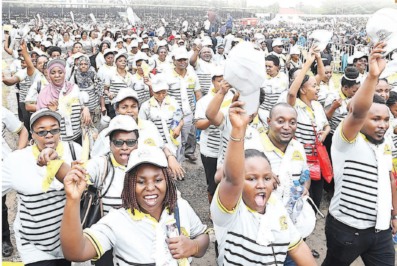
Wafanyakazi kutoka Wizara, Taasisi mbalimbali za Serikali na Binafsi, wakipita mbele ya Jukwaa Kuu kutoa ujumbe kuhusiana na masuala mbalimbali ya Wafanyakazi wakati wa Maadhimisho ya Serehe za Siku ya Wafanyakazi Duniani Mei Mosi, ambapo Kitaifa yamefanyika Mkoani Morogoro jana.

ACT yatangaza utayari wake timu maalum hali siasa Z'bar