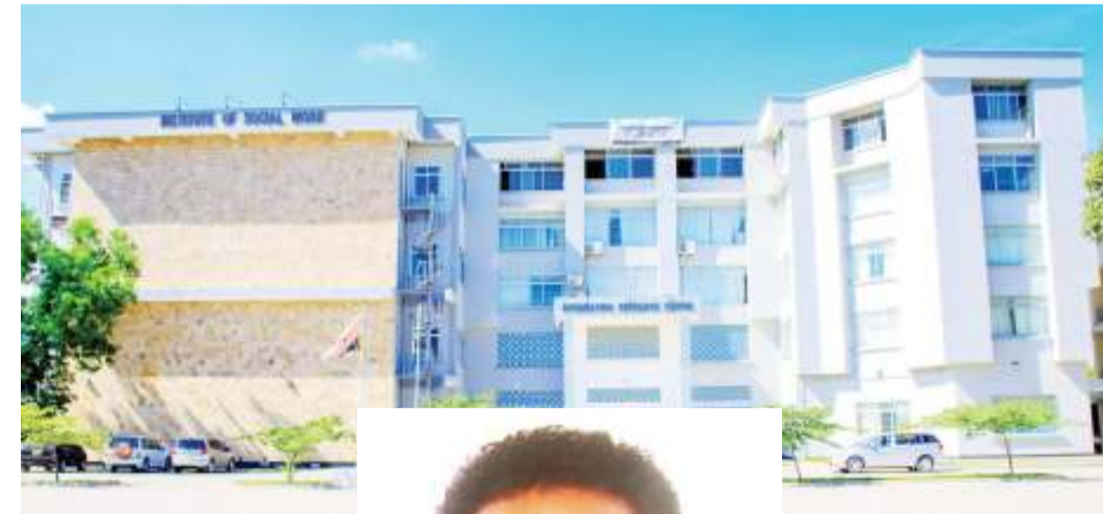
Jengo la Utawala la ISW.

...Wahitimu huandaliwa ili waweze kutengeneza programu zenye tija kwa makundi mbalimbali yakiwamo makundi maalum ili yaweze kuwa na mchango katika maendeleo.