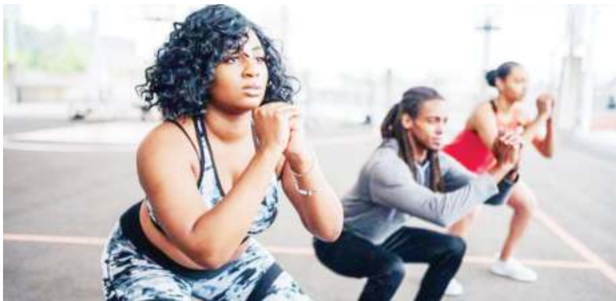
Mazoezi ya mwili ni moja ya njia za kupunguza hatari ya kupata maradhi ya kiakili

K ARIBU kila mmoja anaweza kupunguza ugonjwa wa matatizo yanayotokana na kuathirika kwa akili (dementia), hata kama ni ya kurithi katika familia, kulingana na utafiti wa maisha ya kiafya.