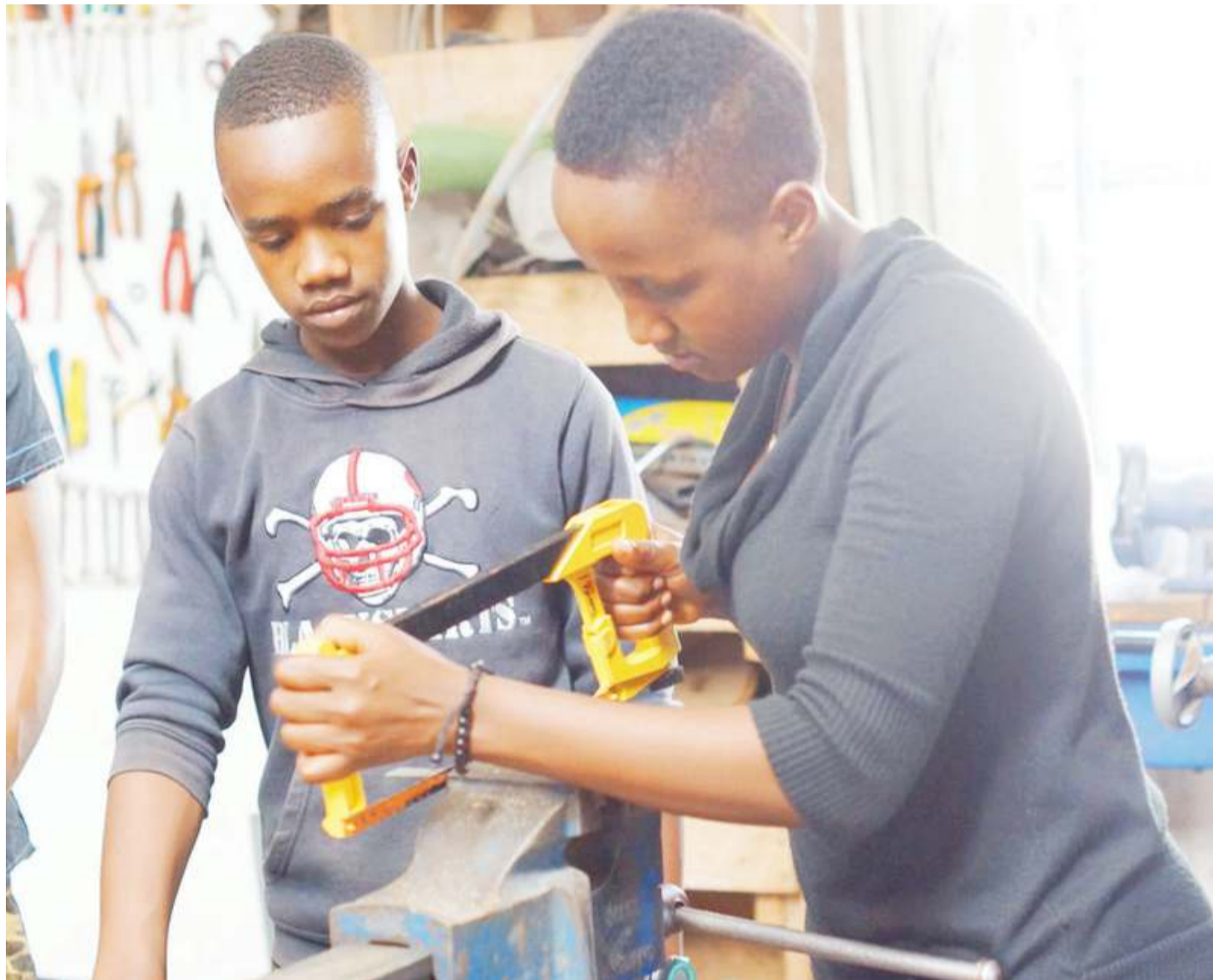
Mmoja wa wanasayansi (kulia), akikata chuma kwa ajili ya kujitengenezea kifungua chupa (opener).

Kutokana na ukweli kuwa wabunifu wapo wengi na serikali imeonyesha kuwajali na kuwaunga mkono katika kazi zao, kasi ya uvumbuzi na uandaaji wa kazi zilizo bora utaongezeka na hapo ndipo ukuaji wa sayansi na teknolo-