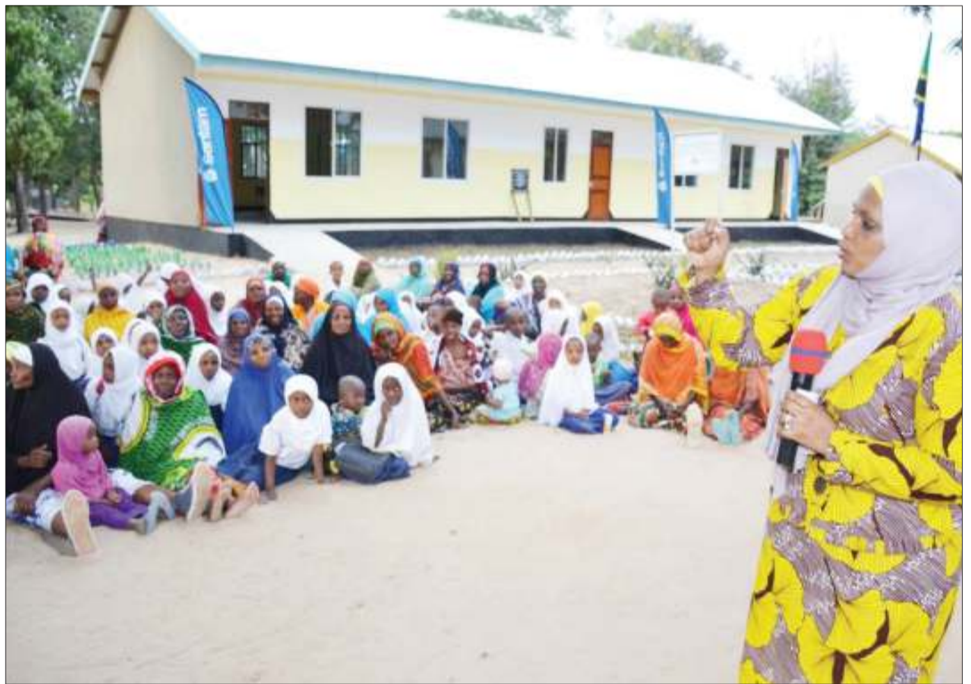
Naibu Waziri wa Fedha na Mipango, Dk. Ashatu Kijaji, akihutubia katika uzinduzi pamoja na makabidhiano ya madarasa mawili na ofisi ya walimu ya Shule ya Msingi Lusangi yaliyojengwa kwa msaada wa Kampuni ya Bima ya Sanlam kwa gharama ya Sh. milioni 49, shuleni hapo, Tarafa ya Pahi, Wilaya ya Kondoa, mkoani Dodoma mwishoni mwa wiki.

Kaimu mkurugenzi huyo aliwataka watumishi hao kuheshimu sheria na kuwawaadilifu katika utumishi wao kwani tofauti na hivyo, watapoteza sifa ya kuwa watumishi wa serikali kwa sababu serikali inahitaji watumishi wenye maadili.