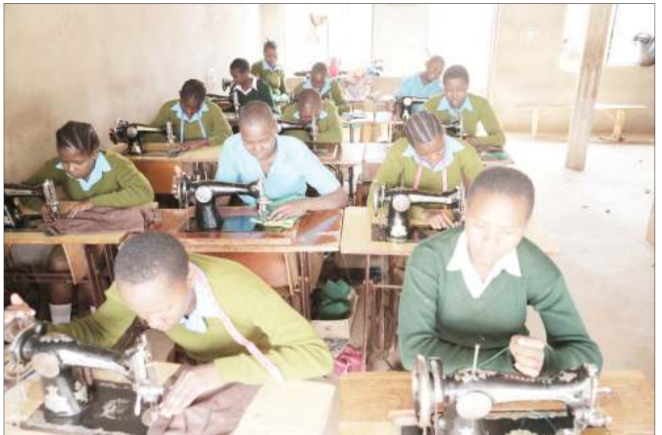
Wanafunzi wa ushonaji kituo cha Mama Arno, Mji Mdogo wa Kibaigwa mkoani Dodoma, wakifanya mafunzo kwa vitendo kituoni hapo, jana.

Aliwataka waumini wa kanisa hilo kuepuka na imani ambazo zimekuwa zikinyoshewa vidole ambazo zimekuwa zikipotosha jamii.