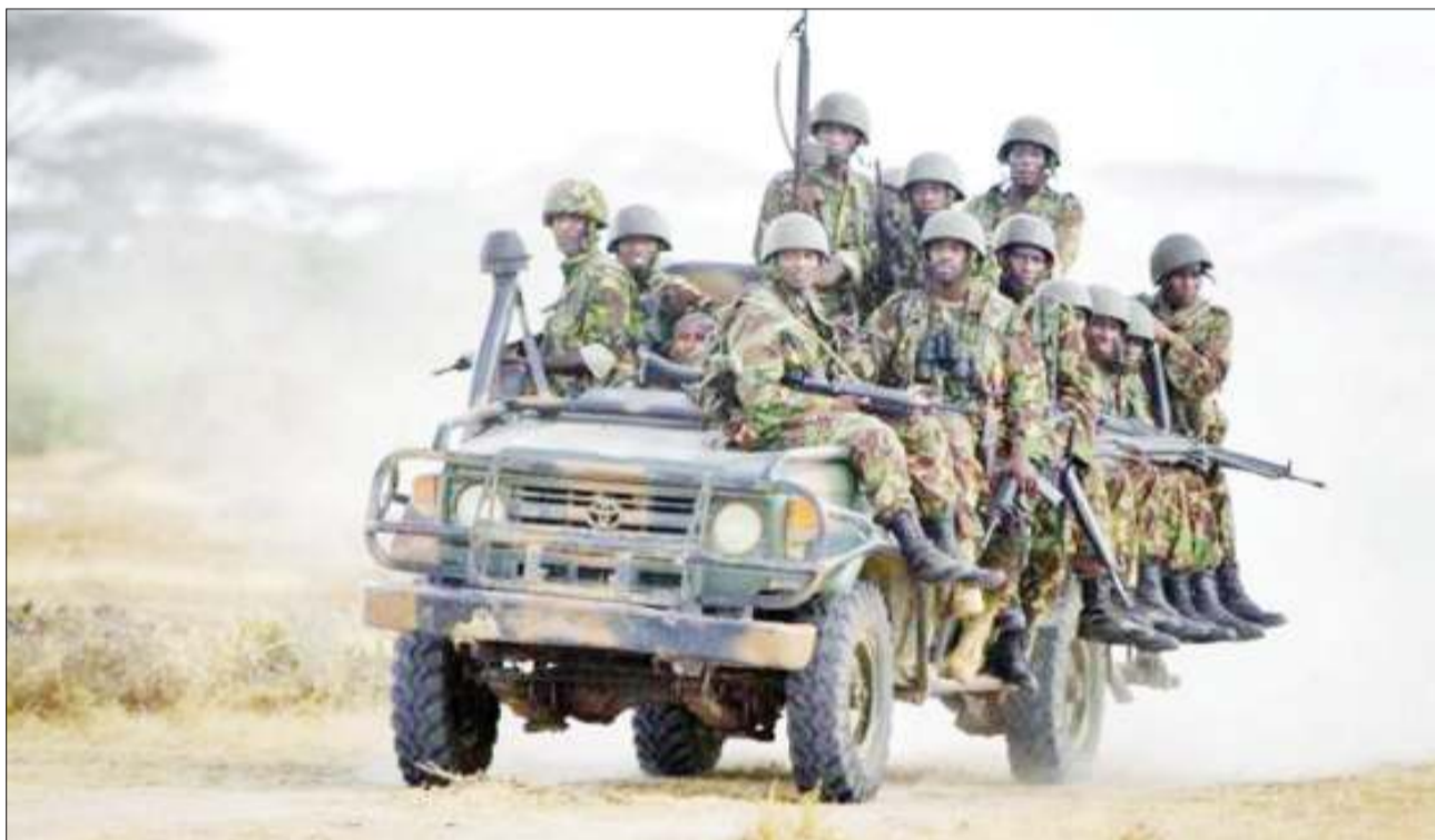
Wanajeshi wa Kenya wakiwa katika operesheni ya kuwasaka wanajeshi wa kikundi cha kigaidi cha Al-Shabaab nchini Somalia.

Wakati bwawa hilo likitengezwa, maofisa sasa wanafunga vifaa maalum baadhi ya samaki hao ili kufuatilia myenendo yao baada ya kuokolewa. BBC