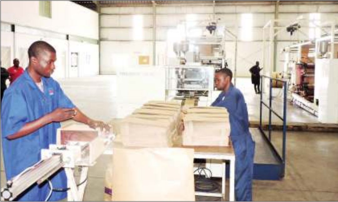
Wafanyakazi wa Kampuni ya Azam Paper Craft International jijini Dar es Salaam, wakiendelea na shughuli za kutengeneza mifuko mbadala ya karatasi kiwandani hapo, katika Mamlaka ya Ukanda Maalumu wa Uwekezaji nchini (EPZA), jijini Dar es Salaam wikiendi, ili kukabiliana na upungufu wa mifuko hiyo, baada ya serikali kupiga marufuku ya matumizi ya mifuko ya plastiki.