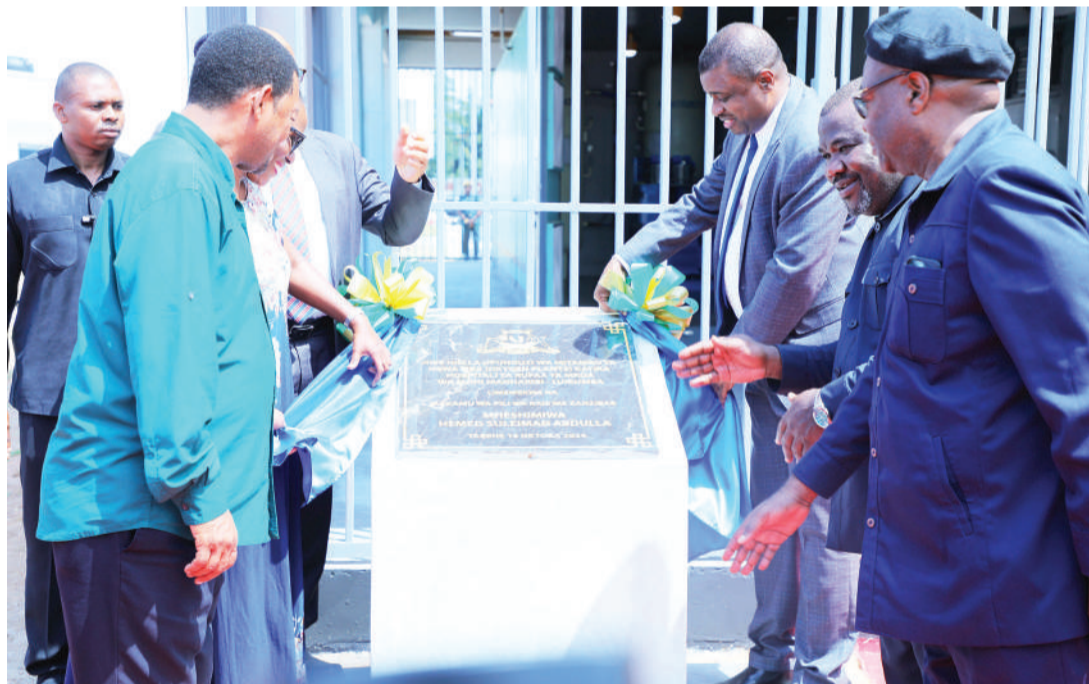
Makamu wa Pili wa Rais wa Zanzibar, Hemed Suleiman Abdulla, akikata utepe kuashiria ufunguzi wa mitambo ya hewa tiba (Oxygen Plants) uliofanyika katika Hospitali ya Rufani ya Mkoa wa Mjini Magharibi jana.

Aliwataka wakulima waondokane na mikopo isiyo na tija na wajiunge na vikundi mbalimbali vya kuweka na kukopa vyenye masharti nafuu na kuchangamkia fursa za mikopo ya serikali inapowafikia.