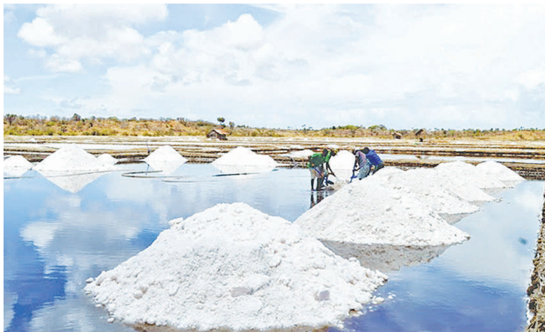
Shughuli za uzalishaji chumvi kienyeji Kilwa zikiendelea.

Uzalishaji wa chumvi mkoani Lindi, kihistoria ulianza mwaka 1969 na mradi wa ujenzi wa kiwanda hicho sasa, unasimamiwa na Shirika la Madini la Taifa (STAMICO) katika eneo