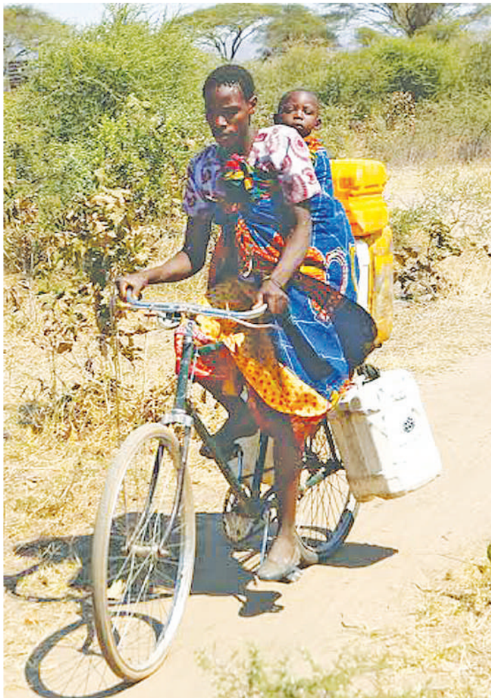
Mama wa kijijini akipambana na maisha.

Mwaka huu, siku hiyo imepambwa na kaulimbiu: “Wanawake wa vijijini wanaodumisha uoto wa asili, kwa mustakabali wetu wa pamoja, ili kujenga ustahimilivu wa mazin-