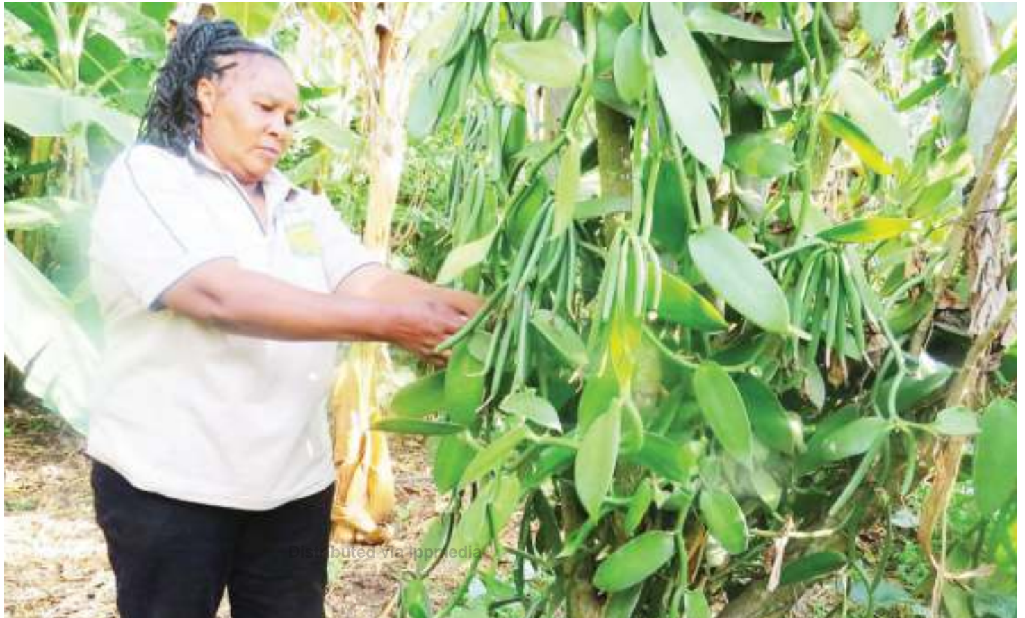
Mkulima akihudumia zao la vanilla shambani. Picha ndogo ni baada ya kukaushwa.

Eneo jingine la kufurahisha kuhusu kuanza kwa wakulima kuhamia vanilla ni kuwa kampuni kubwa zinazohitaji zao hilo