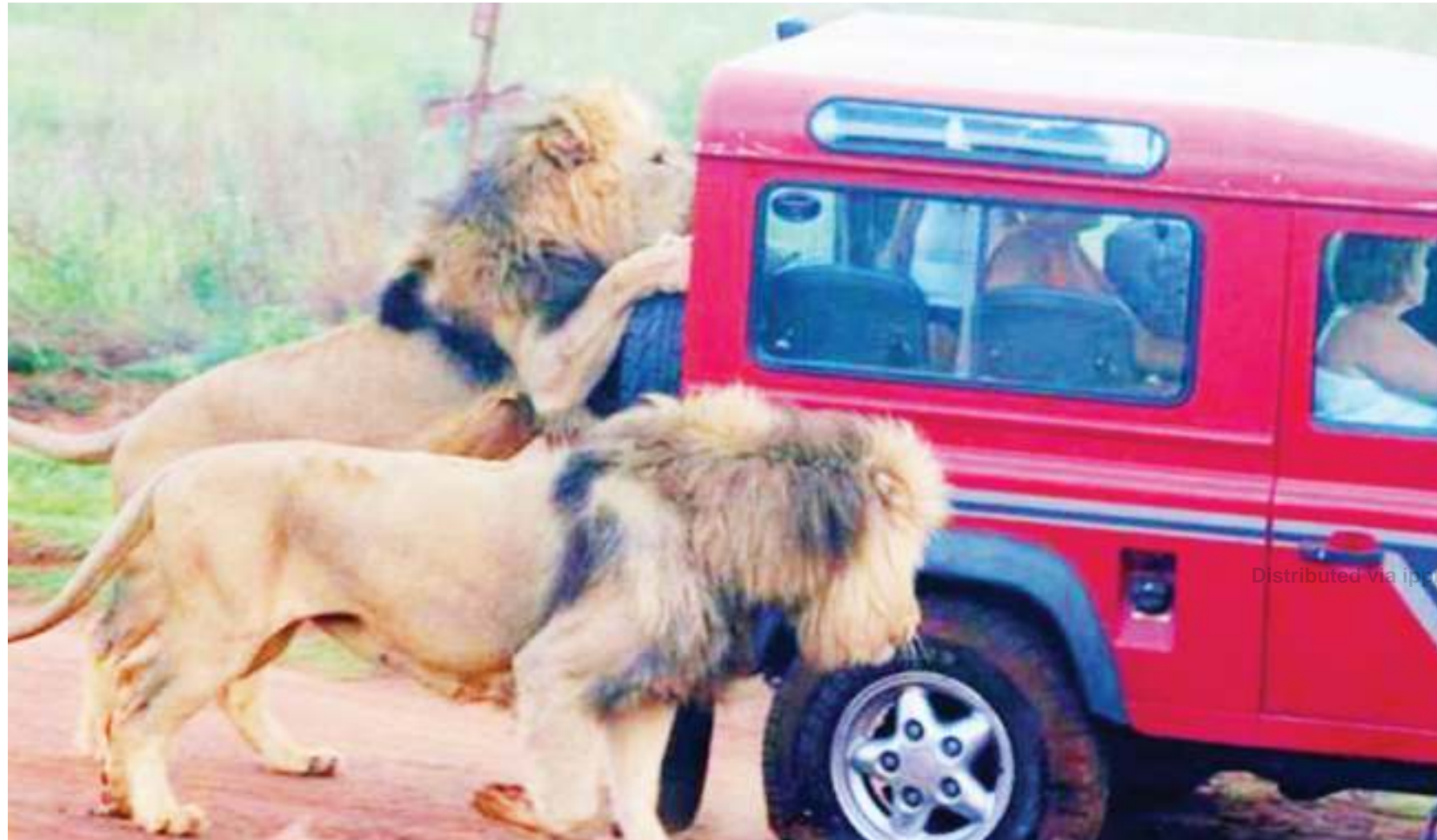
Mandhari na vivutio vya kitalii ndani ya hifadhi ya Serengeti iliyopata tuzo ya Afrika.

"Mwanzoni tulikuwa hatuna hela na tulikuwa hatuwezi kwenda