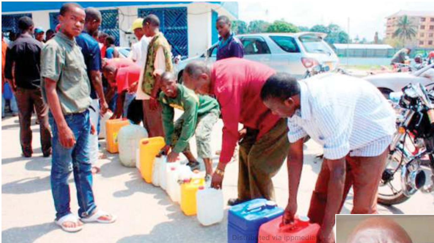
Wenye madumu katika foleni ya kununua mafuta.