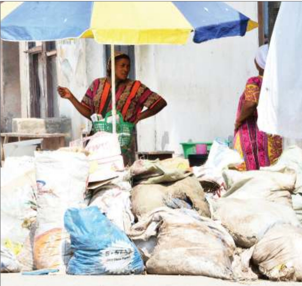
Mchuuzi wa chapati akiharisha afya za walaji kwa kufanya biashara jirani na rundo la takataka, katika eneo la Tandale, Manispaa ya Kinondoni, jijini Dar es Salaam jana.