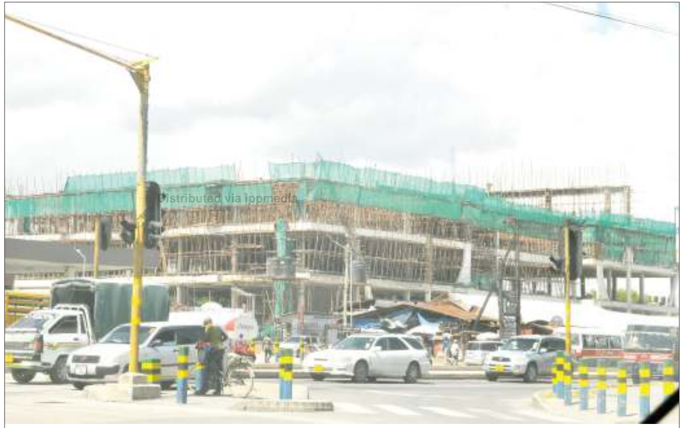
Mwonekano wa jengo la soko jipya la kisasa la Magomeni, litakalokuwa na ghorofa tatu, linaloendelea kujengwa jijini Dar es Salaam jana, ambalo ujenzi wake unatarajiwa kukamilika mwezi Desemba mwaka huu.

Pia alisema baraza halina sehemu sahihi ya kusahihisha mitihani pamoja na mtambo wake wa kuchapishia mitihani ya taifa na nyaraka zingine.