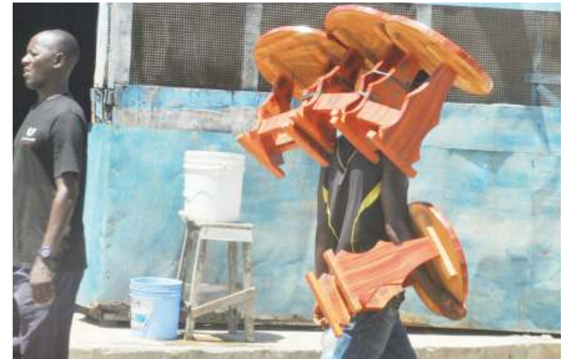
Kijana akiwa amebeba stuli, akisaka wateja ili ajipatie kipato, kando ya Barabara ya Kawawa, eneo la Msimbazi Centre, jijini Dar es Salaam jana.