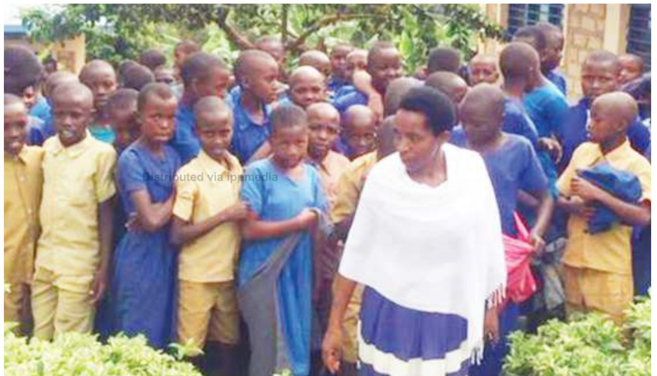
Wanafunzi wa moja ya shule nchini Rwanda. Sensa ya hivi karibuni ya Wizara ya Elimu imebainisha shule nyingi zina idadi kubwa ya wanafunzi nchini humo.

Mnamo mwaka 2001, vikosi vina- vyoongozwa na Marekani viling'oa serikali ya Taliban nchini Afghanistan kwa sababu wanamgambo hao waliupatia mtandao wa al-Qaeda fursa ya kuandaa mpango wa mashambulio dhidi ya Marekani Septemba 11. BBC