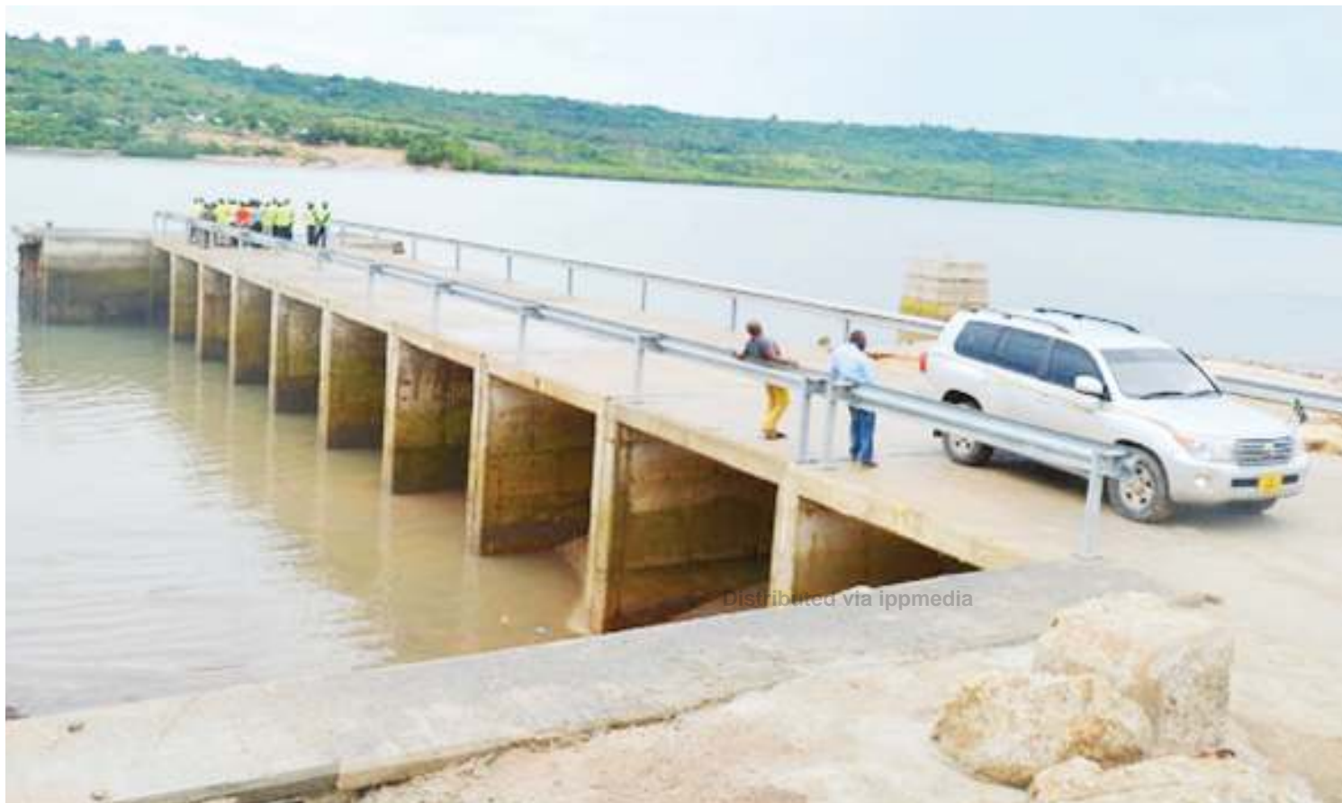
Gati mpya katika Bandari ya Lindi, ambayo iko chini ya Bandari ya Mtwara, ujenzi wake umekamilika.

• Meneja atangaza mkakati 'punguzo la bei' • Waachiwa Bagamoyo, bandari ndogo lukuki • Ajisifu usalama miaka 'chembe wizi' haijasikika