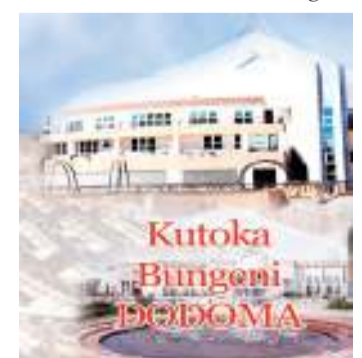
Habari zote na Gwamaka Alipipi, DODOMA

katika ujenzi wa Taifa ambao pia hualikwa kushiriki katika maadhimisho hayo mfano viongozi wastaafu na wanasiasa wakongwe.