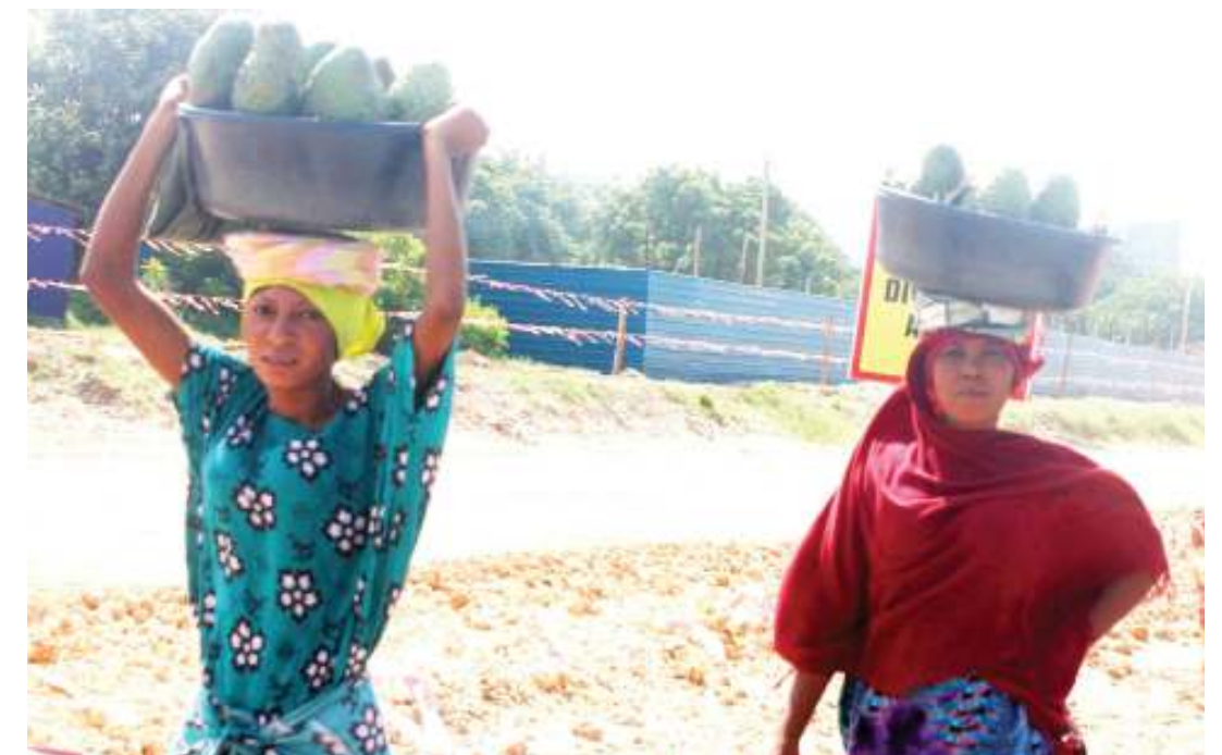
Wachuuzi wa maparachichi wakisaka wateja katika Barabara ya Gymkhana, Manispaa ya Ilala, jijini Dar es Salaam mapema wiki hii.