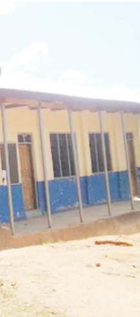
Mradi huo akiwa kazini. PICHA ZOTE: