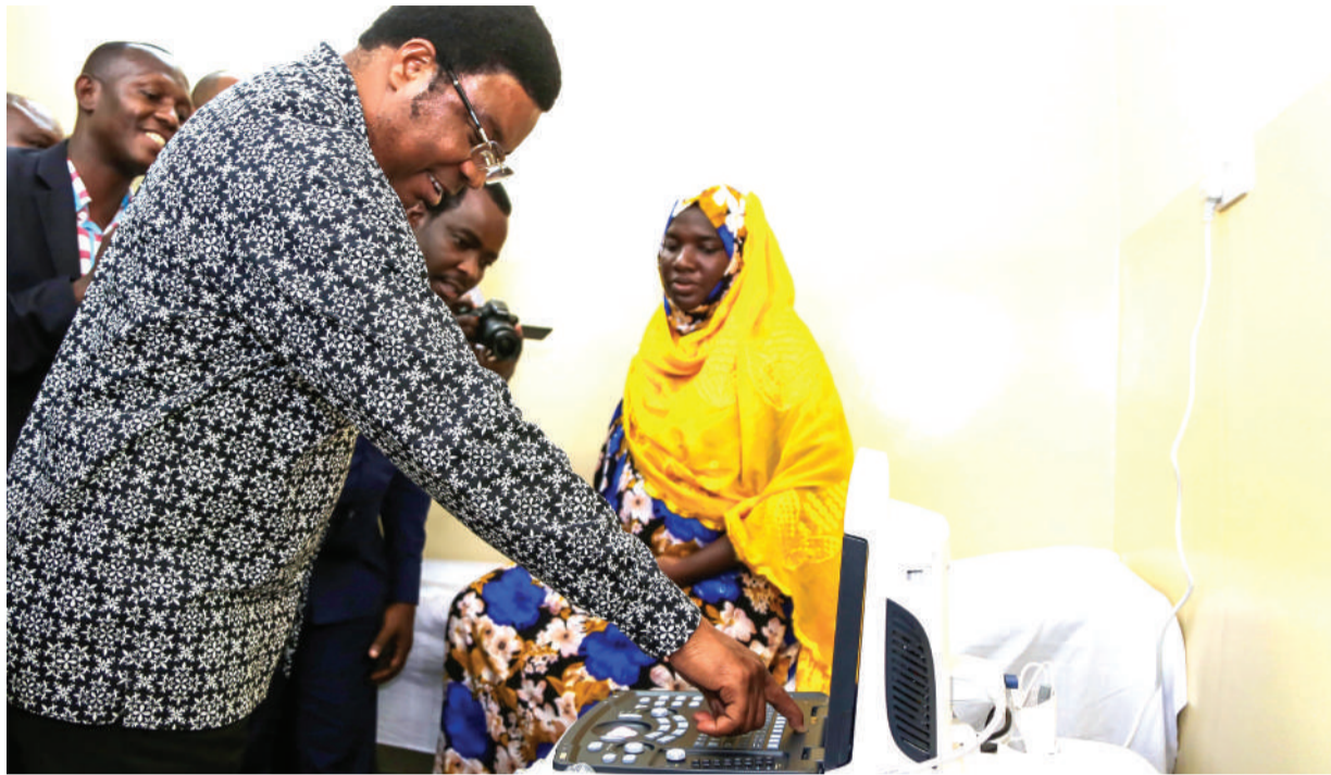
Waziri Mkuu, Kassim Majaliwa, akibonyeza kitufe kuzindua huduma ya Ultra Sound, baada ya kuzindua huduma ya afya ya kijiji, katika Halmashauri ya Wilaya ya Kusini, Kizimkazi Dimbani, mjini Zan-zibar jana, akiwa kwenye ziara ya siku tatu.

Kwa mujibu wa wahifadhi, mifugo hiyo iliyokamatwa mwishoni mwa mwaka jana, inadaiwa kukutwa mita 450 ndani ya pori hilo huku wananchi wakidai kuwa ilikutwa nje ya mita 450 kutoka kwenye mpaka mahali ambako wamekuwa wakiishi.