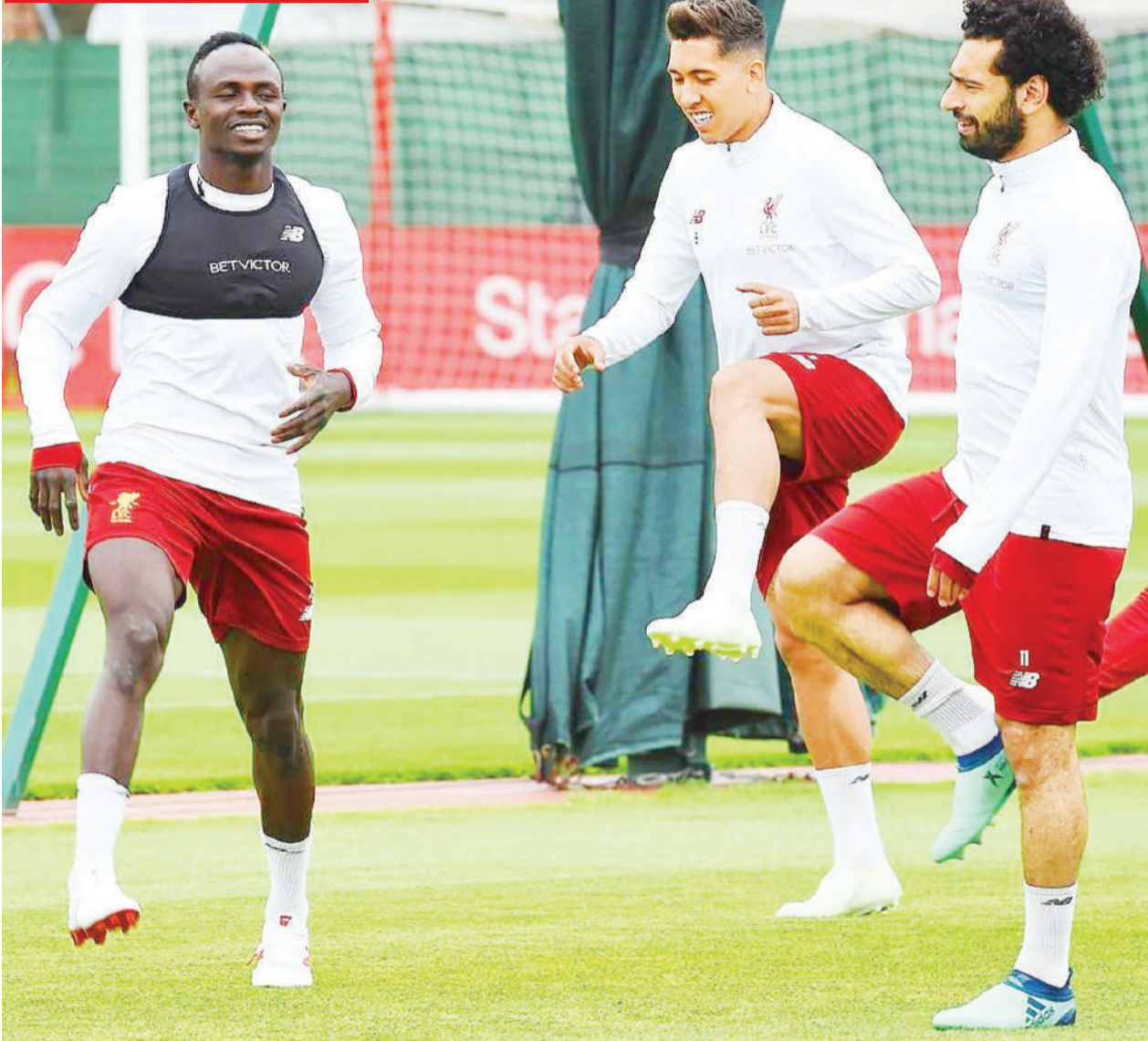
Majembe matatu ya Liverpool, Sadio Mane, Roberto Firmino na Mohamed Salah (kulia), yanayotarajiwa kuiongoza timu hiyo kesho, dhidi ya Manchester United kwenye mechi ya Ligi Kuu England itakayopigwa Uwanja wa Anfield.