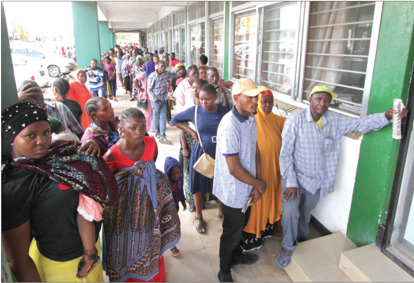
Baadhi ya wakazi wa Jiji la Dodoma, wakiwa kwenye foleni kutafuta vitambulisho vya Taifa nje ya Ofisi za Mamlaka ya Vitambulisho (NIDA), jijini humo, jana, kwa ajili ya kusajili laini zao za simu, kabla ya kufungwa kwa zoezi hilo, Jumatatu ijayo.