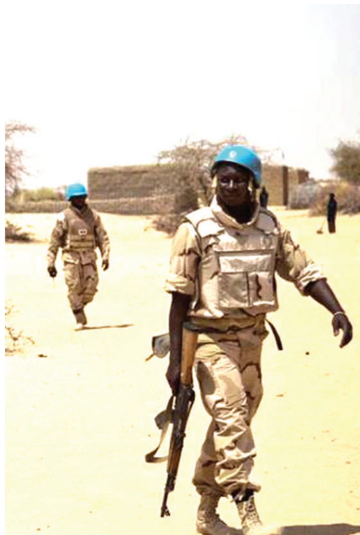
Askari wa kupambana na ugaidi wakilinda usalama katika maeneo ya jangwani.