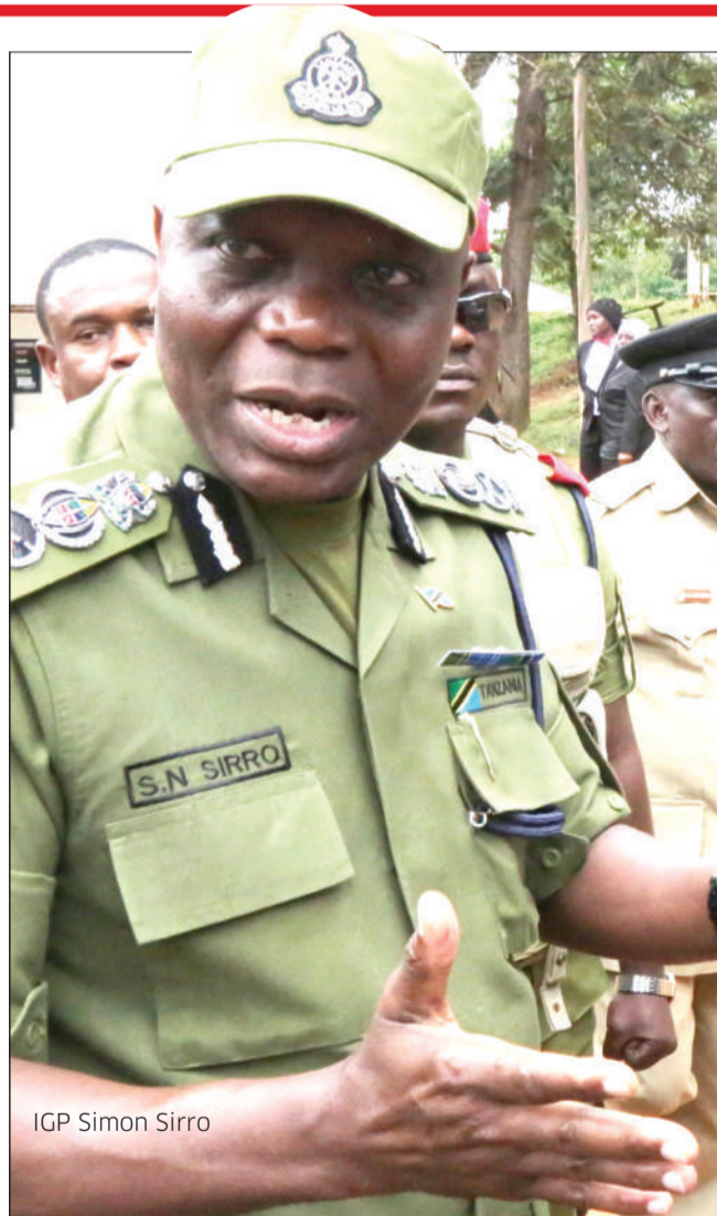
IGP Simon Sirro