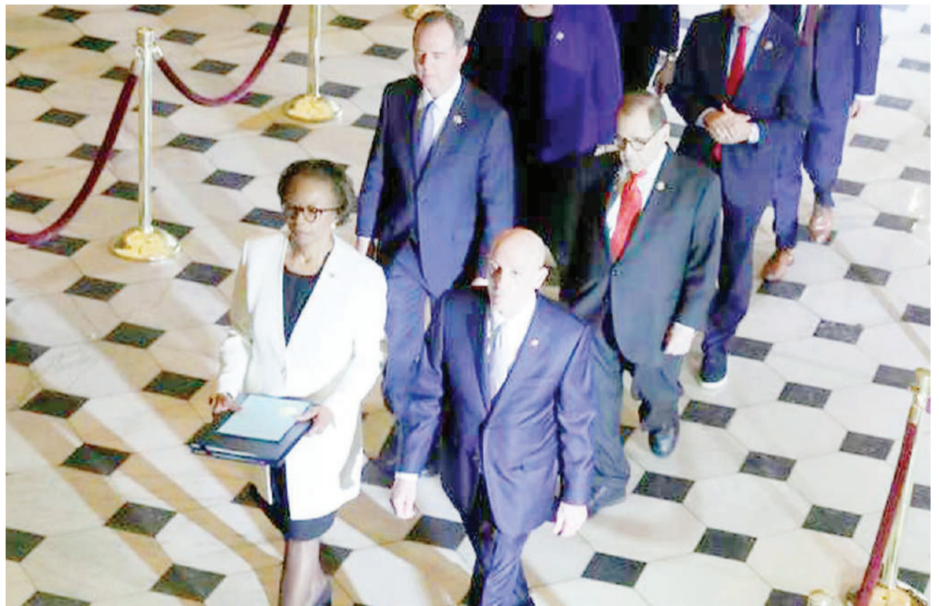
Wajumbe wa Baraza la Wawakilishi wakiwasilisha mashtaka katika Bunge la Seneti kwa ajili ya kuanza kusikilizwa kwa mashtaka dhidi ya Rais Donald Trump, juzi.

Shambulio la roketi lilikuwa kisasi baada ya ndege isiyokuwa na rubani ya Marekani kufanya shambulizi Baghdad na kusababisha kifo cha Jen- erali Qasem Soleimani. BBC