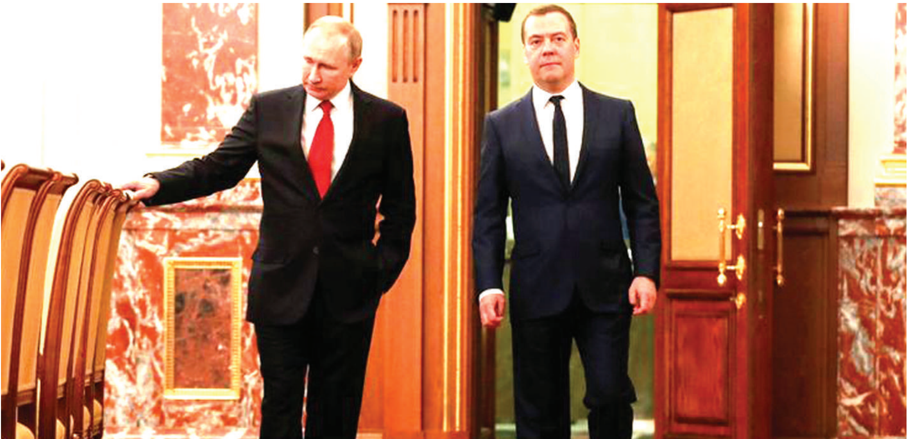
Rais wa Urusi, Vladimir Putin (kushoto), akiwa na aliyekuwa Waziri Mkuu wa nchi hiyo, Dmitry Medvedev.