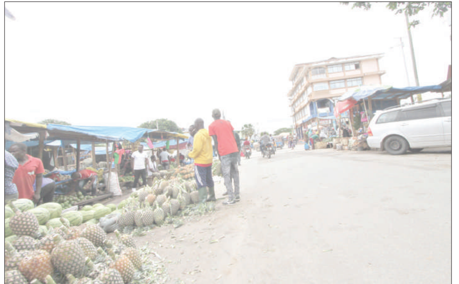
Wafanyabiashara wa Soko Kuu la Majengo Jiji la Dodoma wakiuza matunda yao, huku yakiwa yamepangwa chini badala ya mezani bila kujali afya za walaji na wao wenyewe.