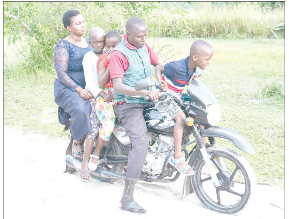
Mwendesha pikipiki maarufu (bodaboda), akiwa amepakia abiria kinyume na sheria katika eneo la Kitunda Kivule jijini Dar es Salaam jana.