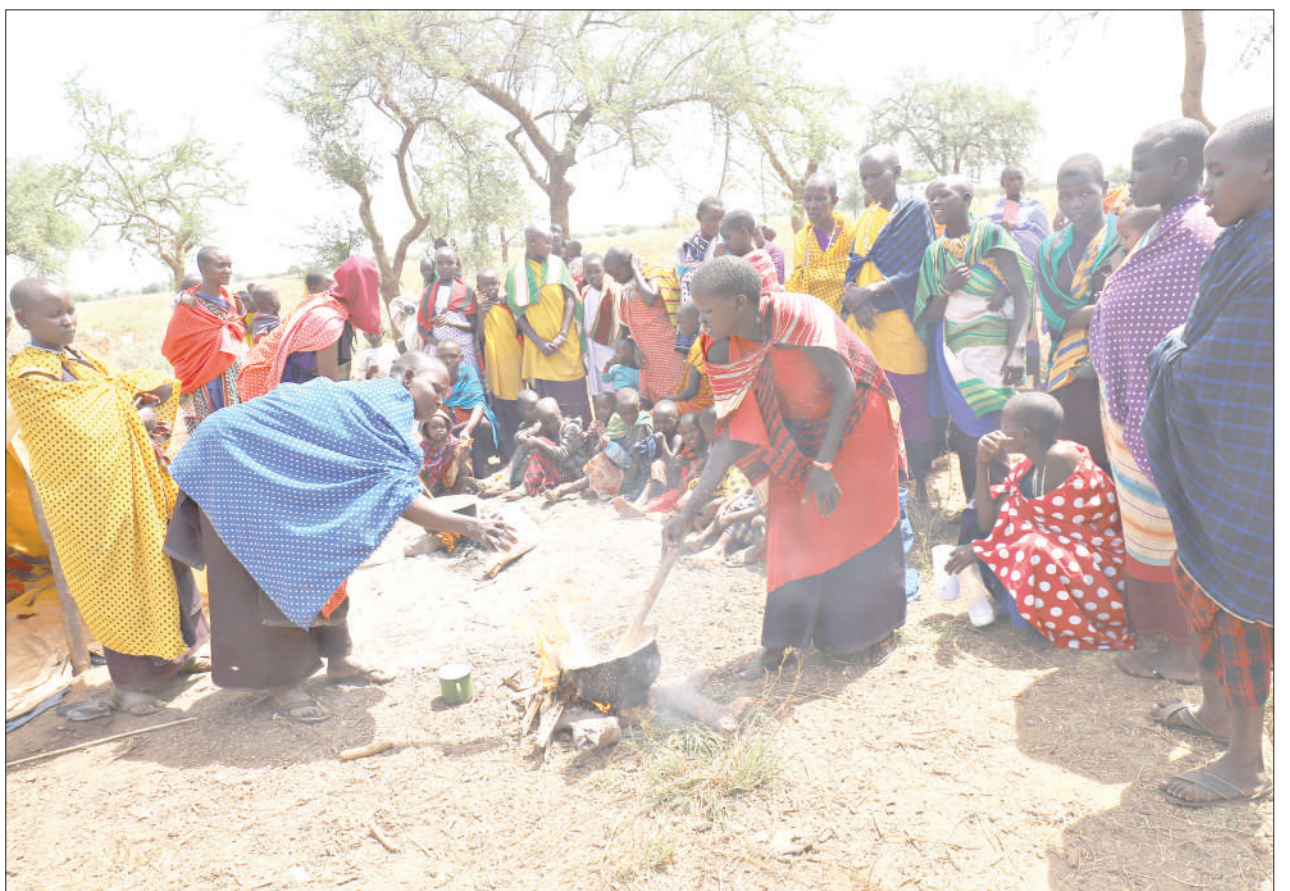
Baadhi ya wananchi wa Kijiji cha Nadonjoki wanaolalamikia makazi yao kubomolewa kutokana na mgogoro wa mpaka wa kijiji chao na cha Terati Wilaya ya Simanjiro, wakiwa wamekaa na watoto wao katika eneo hilo, linalodaiwa kuwa na mgogoro wa muda mrefu.