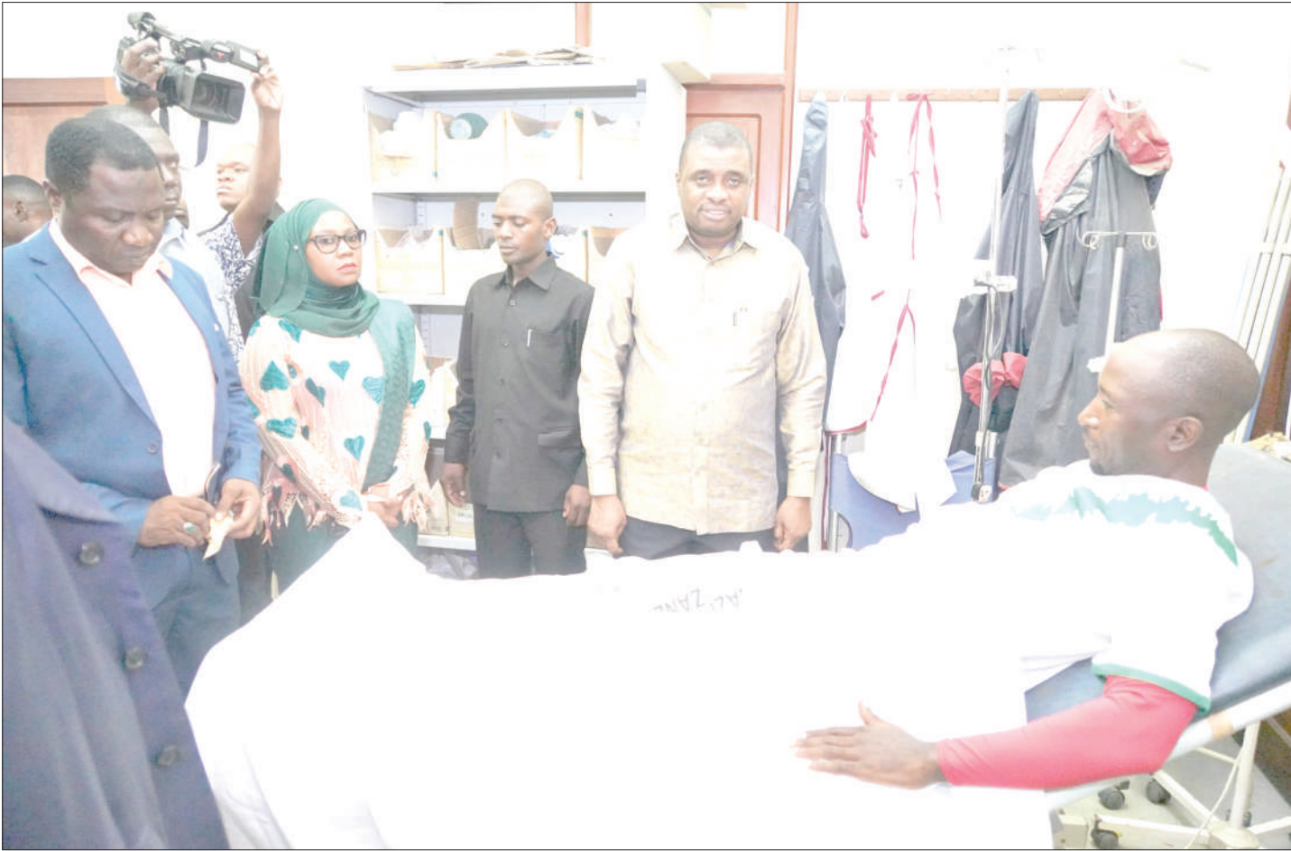
Makamu wa Pili wa Rais wa Zanzibar, Hemed Suleiman, akimfariji mmoja wa wanamichezo waliopata ajali ya kugongwa na gari, Migombani wakiwa mazoezini.