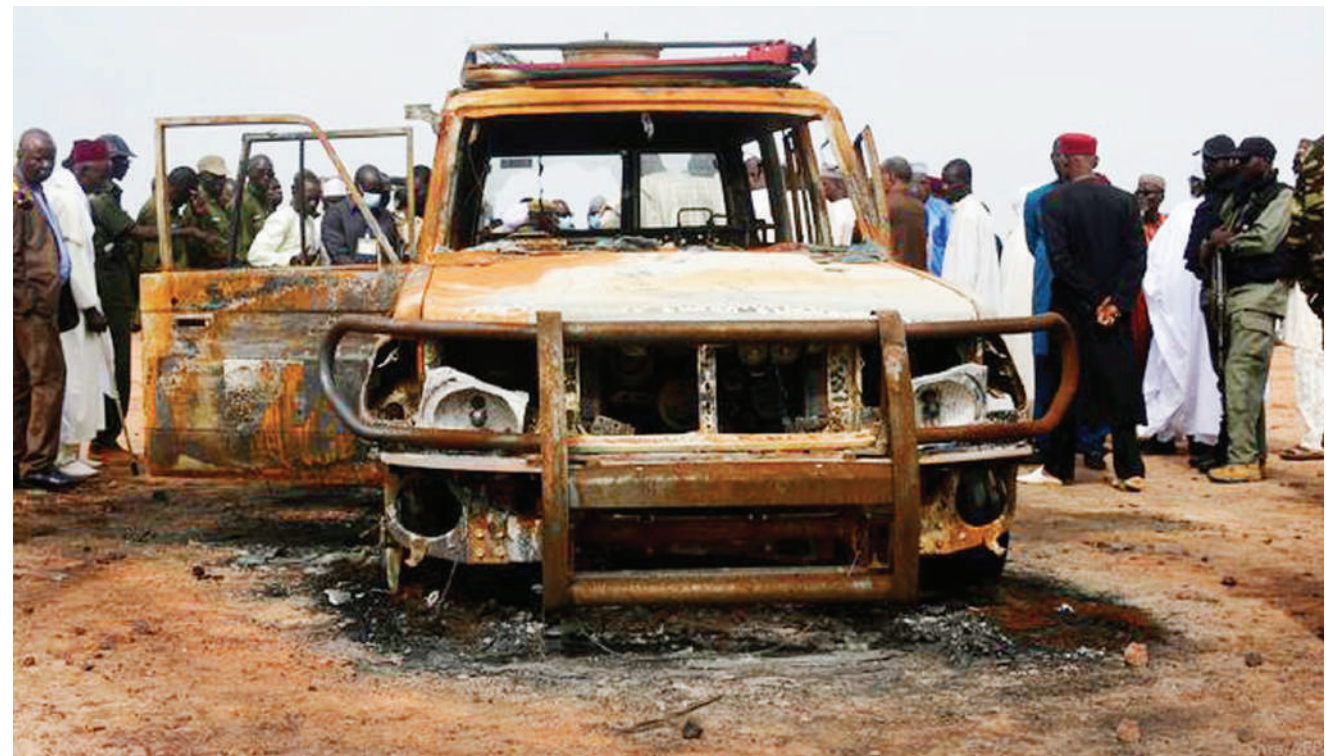
Gari ambalo limesababisha vifo vya takribani watu 56 na kujeruhi wengine 20, nchini Niger. Shambulizi hilo, lililotokea juzi katika vijiji vya Tchomb-Bangou na Zaroumdareye vilivyo jirani na mpaka kati ya nchi hiyo na Mali.

Rais huyo, sasa anatafuta washirika wapya watakaoungana naye ili apate wabunge wengi ndani ya bunge. BBC