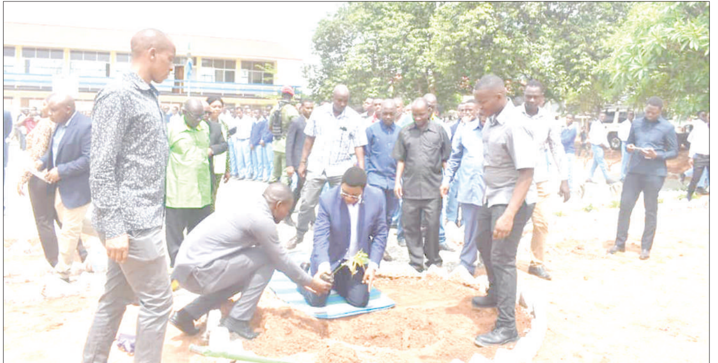
Waziri Mkuu, Kassim Majaliwa (aliyepiga magoti), akipanda mti wa mwembe dodo ulioboreshwa ikiwa ni sehemu ya kumbukumbu ya kuitembelea Shule ya Sekondari ya Wavulana Tunduru na kukagua ukarabati unaoendelea.

"Thamani ya mkataba Sh. bilioni 46.5 na unasimamiwa na kampuni ya wahandisi ya ushauri wa TANROAD na hadi kufikia sasa mkandarasi ameshaanza kazi mbalimbali ikiwamo kujenga nyumba ya msimamizi ambayo imefikia asilimia 50 na amesafisha barabara kutoka Bunda kwenda Bulamba."