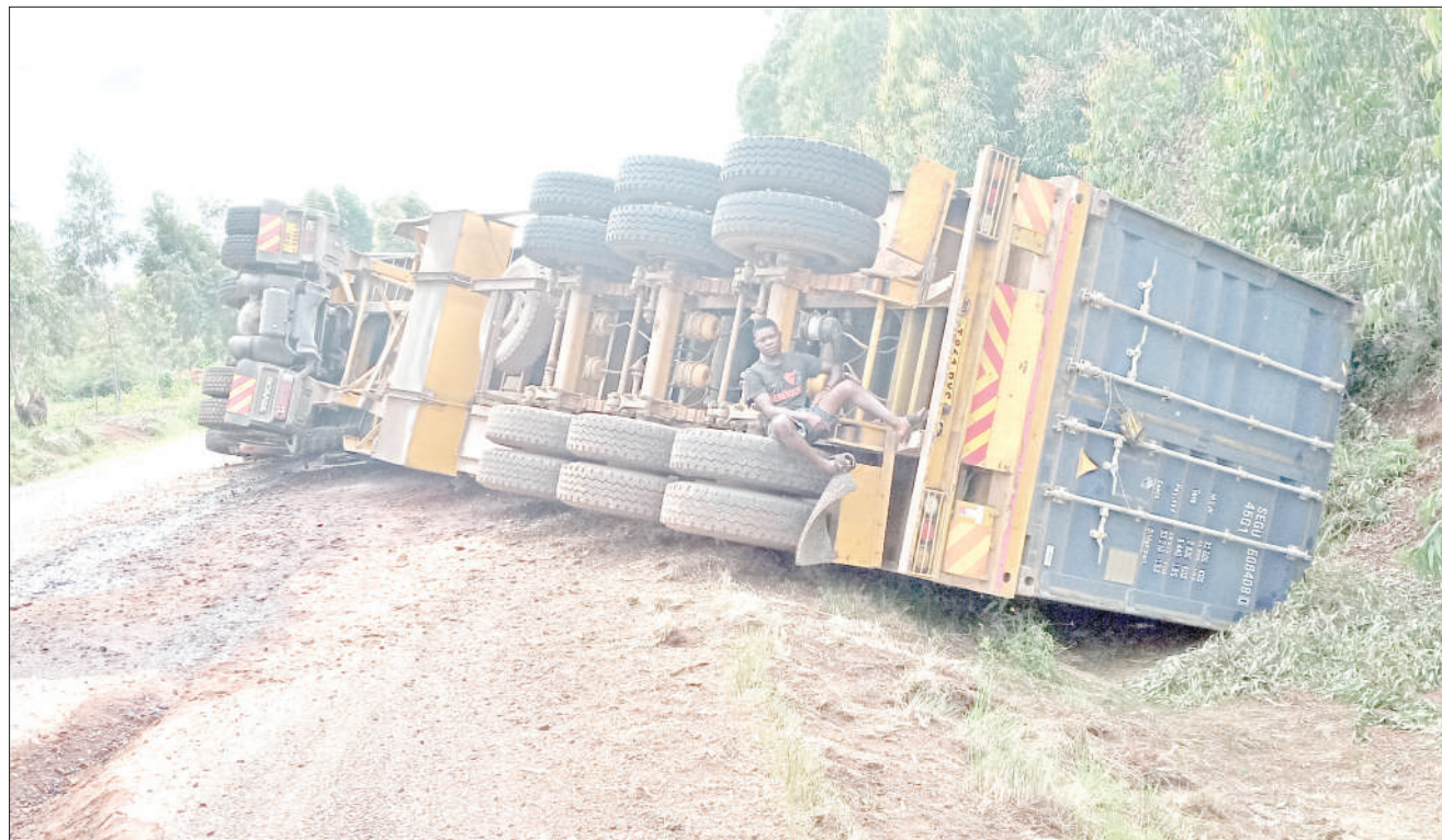
Gari aina ya Scania T.994 DCV na tela namba T.861 BXS jana likiwa limeanguka katikati ya barabara kuu ya kuelekea mpakani Kabanga Ngara nchini Burundi na kusababisha baadhi ya magari kushindwa kwenda nchini humo kwa muda.

"Wapo wazazi ambao wamekuwa mbali sana na watoto wao jambo ambalo linasababisha familia nyingi kuto-penda tamaduni za kitanzania kuwa na tabia ambayo haina utukufu mbele za wanadamu wala Mungu," alisema.