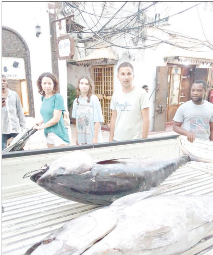
Watalii pamoja na wananchi wakiangalia samaki wawili aina ya jodari wakiwa na uzito wa kilo 75 kila mmoja waliovuiliwa eneo la Bahari Kuu Zanzibar, baada ya kufikishwa Shangani jana.

“Tumefarijika sana na ziara ya mlezi wetu na yote aliyotuelekeza tutayafanyia kazi,” alisema Ntole.