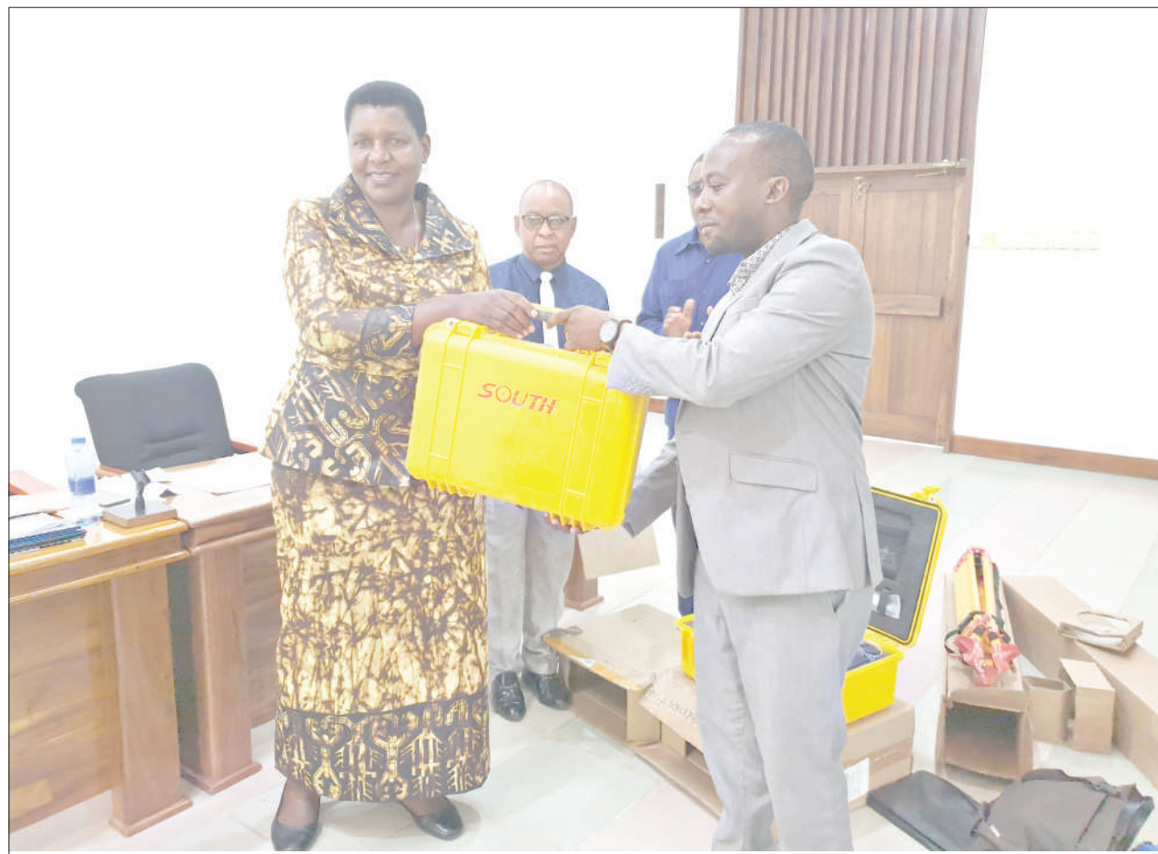
Naibu Waziri wa Ardhi Nyumba na Maendeleo ya Makazi, Dk. Angeline Mabula, akizungumza wakati wa kukabidhi vifaa vya upimaji vya RTK kwa Halmashauri ya Mkuranga akiwa katika ziara ya kikazi mkoani Pwani mwisihoni mwa wiki.

Alisema kutokana na ujenzi wa karakana za utengenezaji wa ndege zinazoendelea kujengwa katika viwanja mbalimbali vya ndege nchini, wahandisi hao watakuwa katika nafasi nzuri katika kutekeleza majukumu yao ipasavyo.