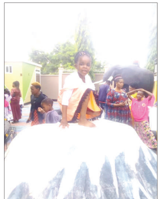
Baadhi ya watoto wakisherehekea kuuona mwaka mpya wa 2021, Mazubu Grand Hoteli, Mji Mdogo wa Mirerani wilayani Simanjiro, mkoani Manyara, juzi.