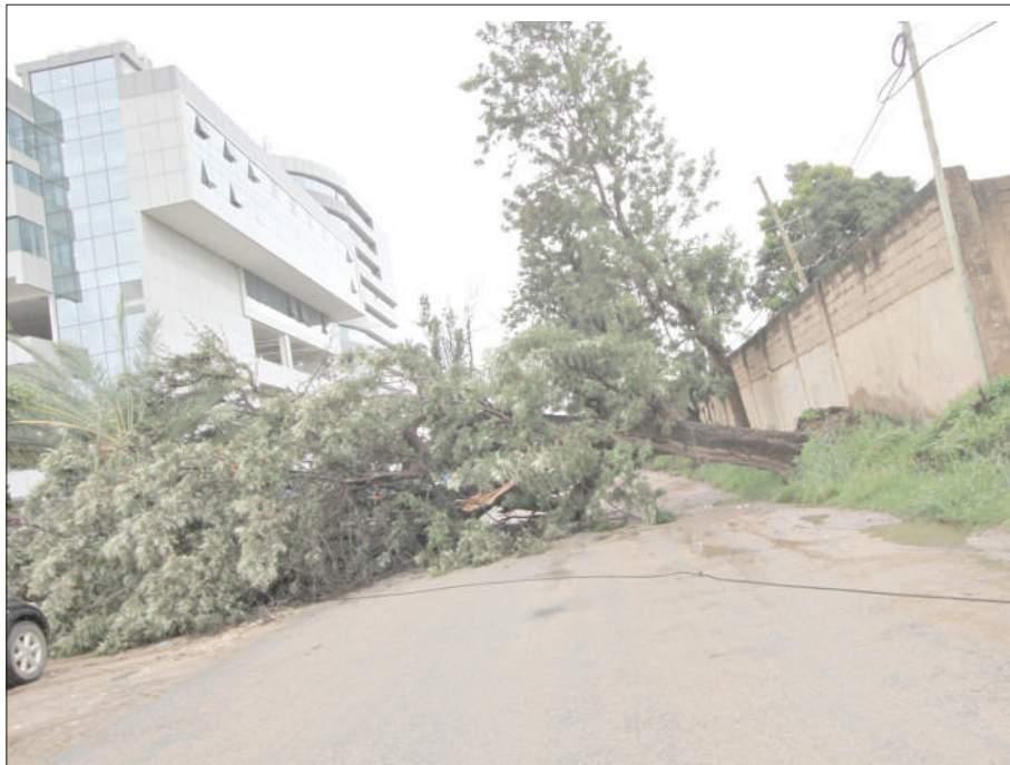
Mti ukiwa umedondoka na kuziba barabara na kuleta usumbufu kwa waendesha magari na watembea kwa miguu, ulianguka kutokana na mvua kubwa iliyonyesha jana, jirani na jengo la PSSSF na Makao Makuu ya Jeshi la Zimamoto na Uokoaji jijini Dodoma.