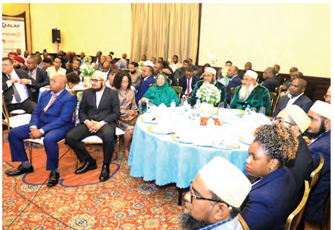
Kikao cha Shirikisho la Viwanda Tanzania (CTI) kilichotoa tuzo.

Washindi wengine kwenye tuzo hizo, ni Kilimanjaro Cables, wakati nafasi ya tatu ilichukuliwa na kampuni ya Ando Roofing.