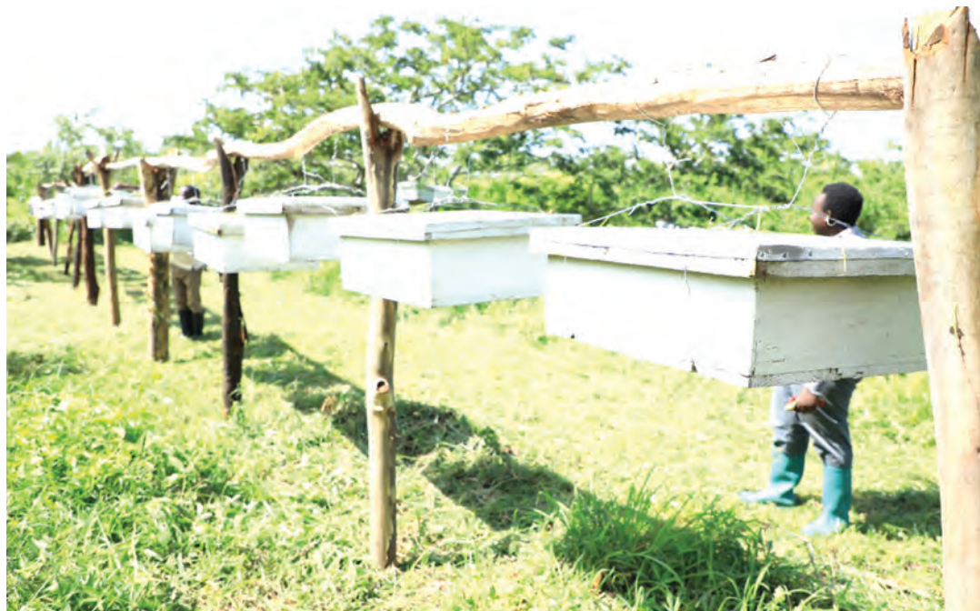
Mizinga ya nyuki iliyoandaliwa kisasa.