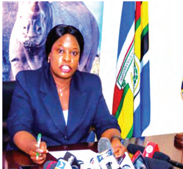
Naibu Waziri wa Maliasili na Utalii, Mary Masanja.

Anafafanua kuwa, lita ya asali ya nyuki wadogo huuzwa shilingi 25,000, wakati nyuki wakubwa ni shilingi 10,000. Kwa sasa anasema wana mizinga 180 ya nyuki wadogo waliyoitundika pembezoni mwa nyumba.