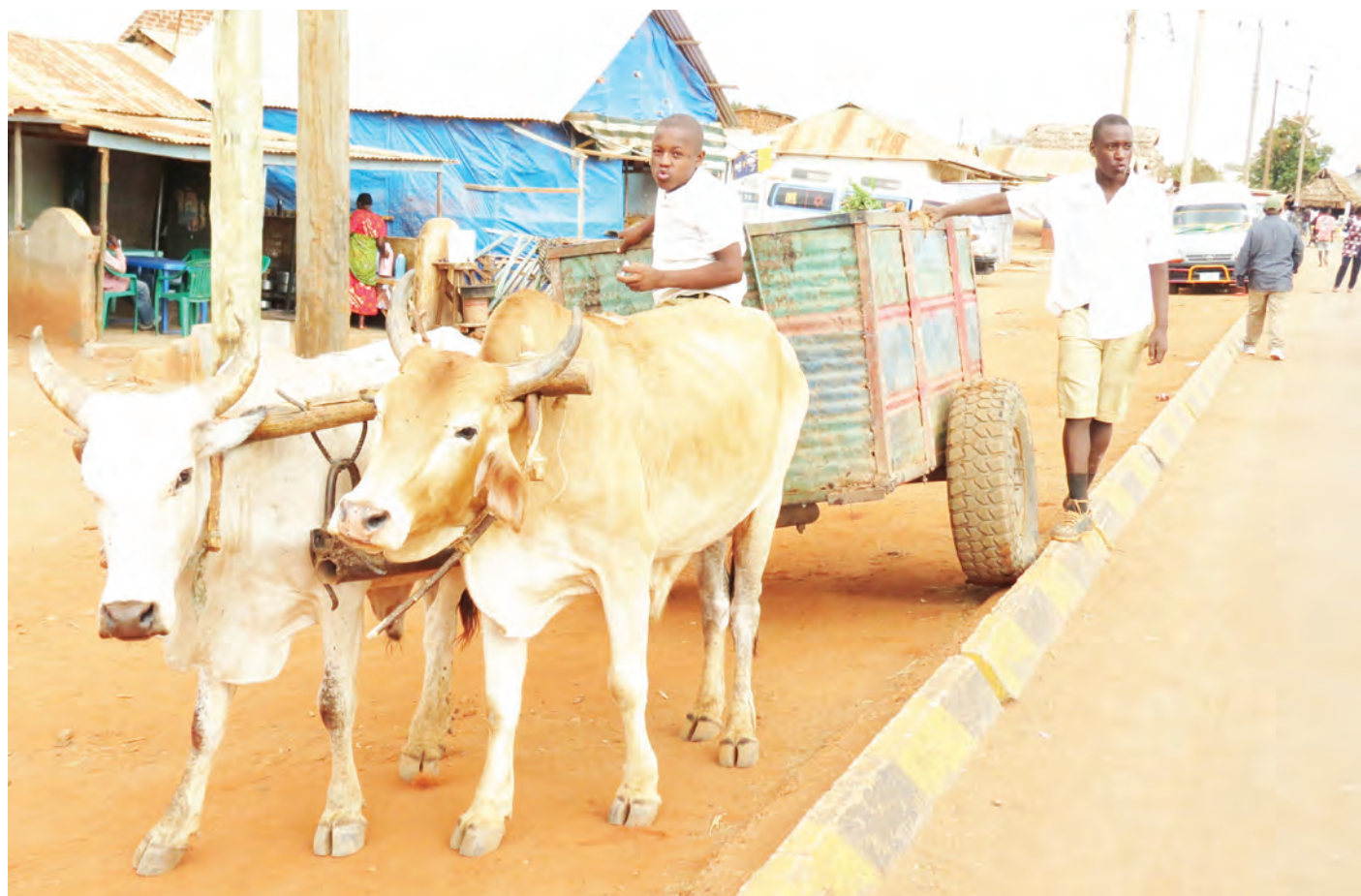
Wanafunzi wa Shule ya Msingi Mbande wilayani Kongwa wakibeba maji kwa toroli linalokokotwa na ng'ombe kwa ajili ya matumizi ya shuleni hivi karibuni.

“Sasa inabidi tuangalie na tatizo la afya ya akili katika jamii zetu ili kuchukua hatua na kumaliza tatizo hili kwani ni jambo la kushangaza mzazi mtumwa, alisema Magesa.