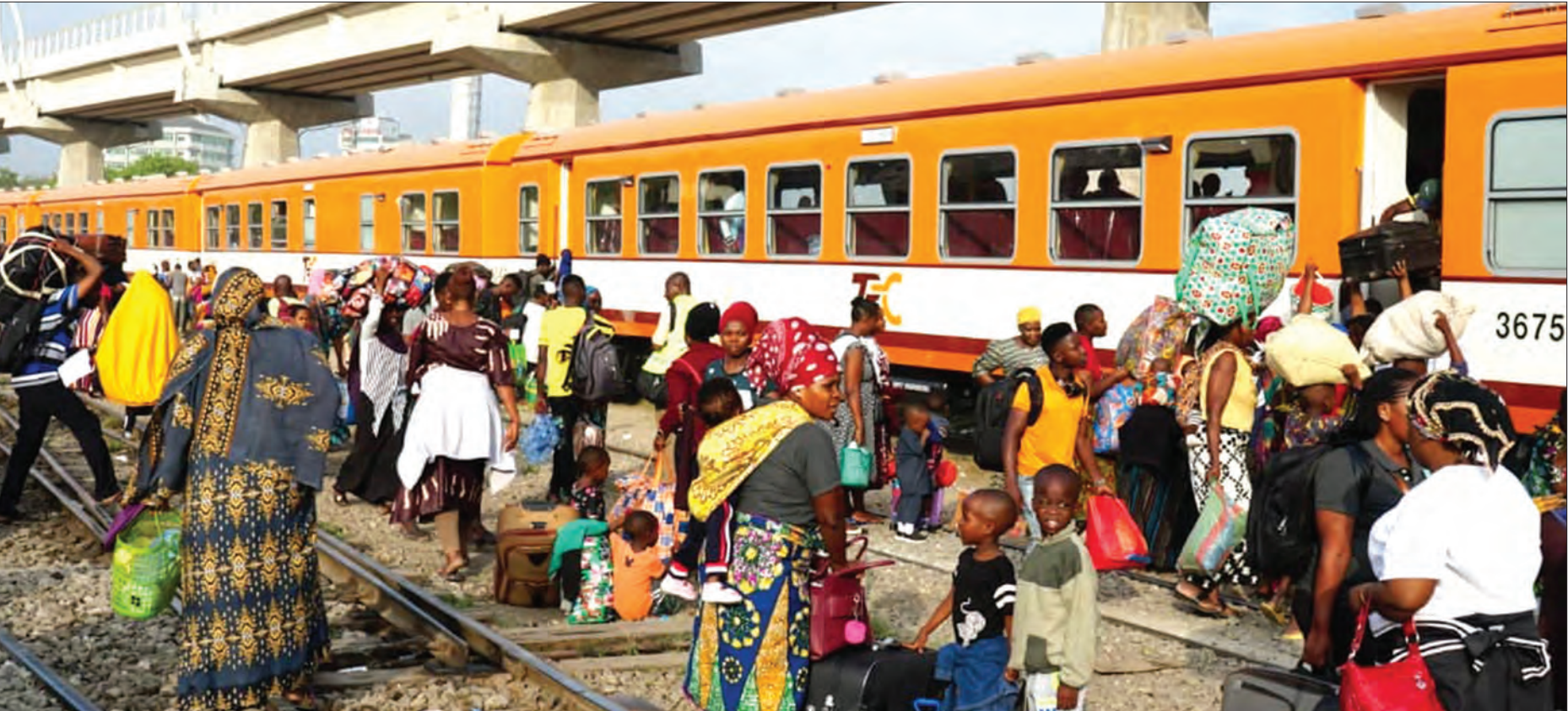
Abiria wakipanda kwenye mabehewa mapya ya treni katika stesheni ya Dar es Salaam jana kwenda mkoani Kigoma. Habari ukurasa wa 4.

Majaliwa awaanika vigogo, awakabidhi TAKUKURU