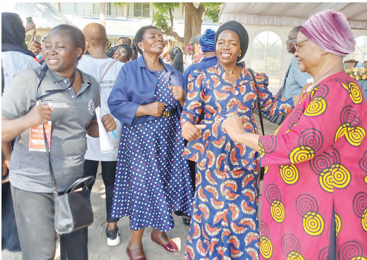
Baadhi ya wadau wa kupinga rushwa ya ngono Tanzania, wakicheza muziki kabla ya kuanza mkutano wa kitaifa wa kuweka mikakati ya kupambana na rushwa hiyo jijini Dar es Salaam juzi.