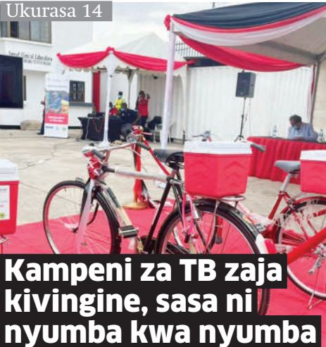
Kampeni za TB zaja kivingine, sasa ni nyumba kwa nyumba