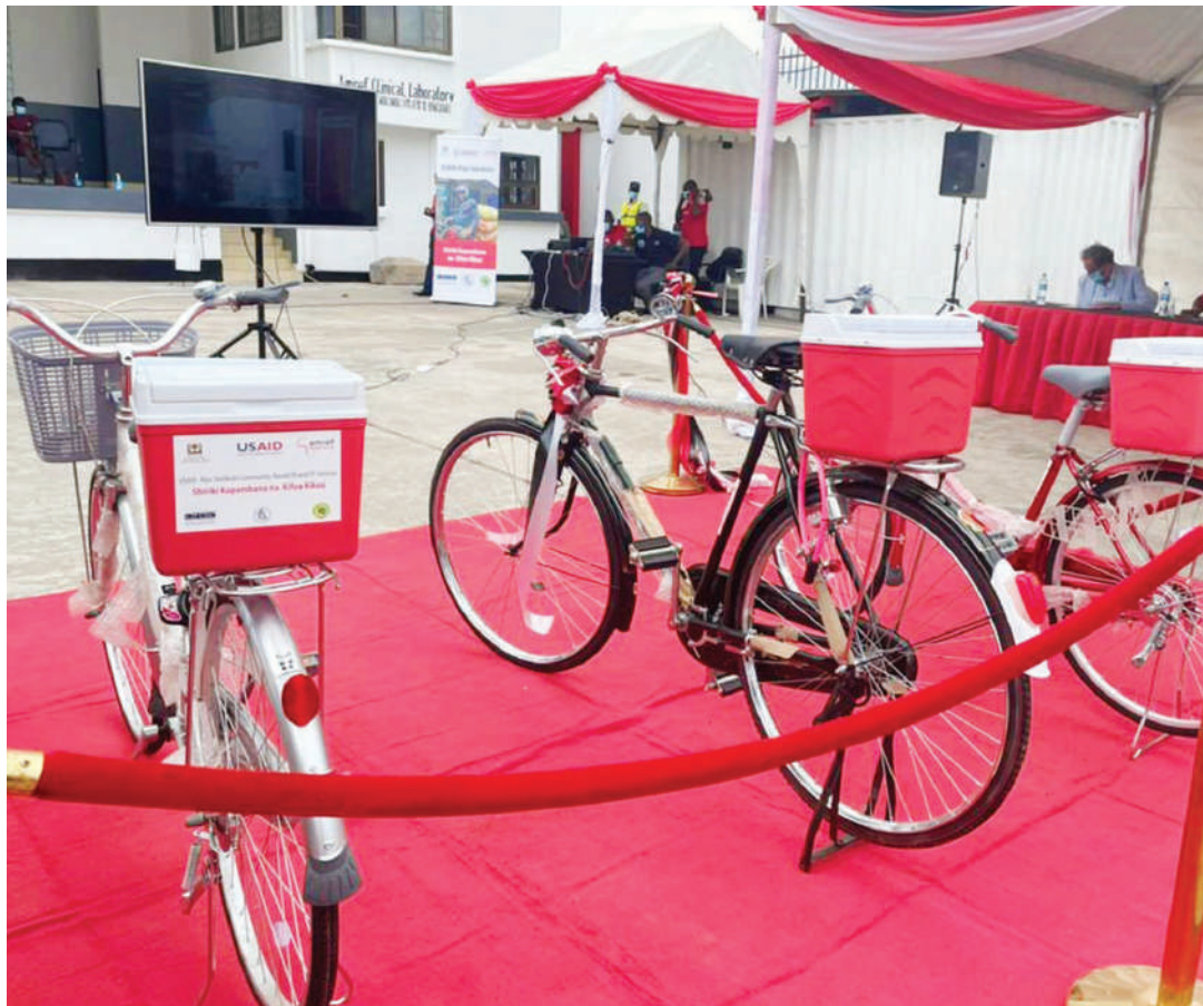
Vifaa, zikiwamo baiskeli na vibeba sampuli za makohazi kwa watoa huduma kwa wenye TB majumbani.

• Wagonjwa kufuatwa, kupimwa na kufuatiliwa