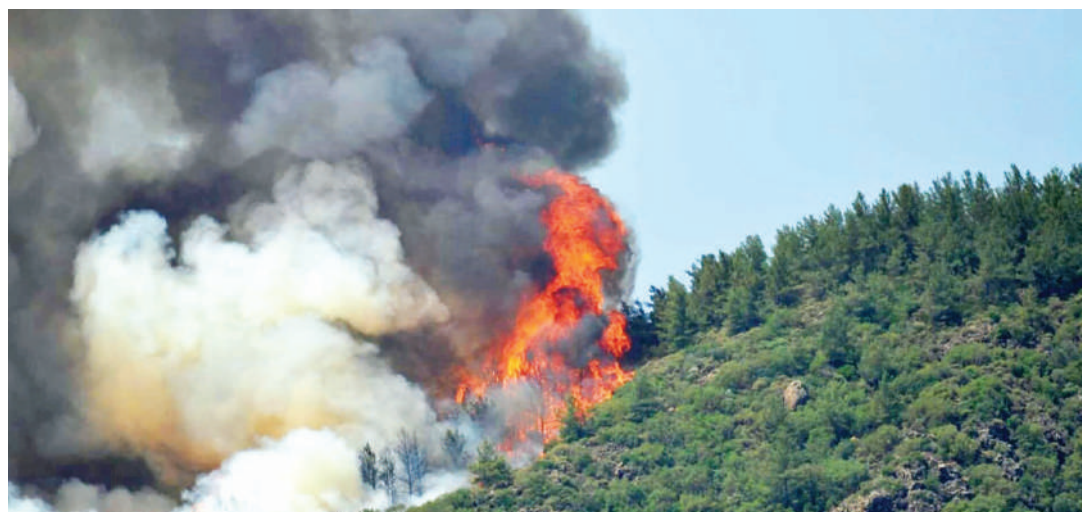
Moto wa asili unaoendelea nchini Uturuki ni moja ya majanga yanayotokana na uharibifu uliokithiri wa mazingira duniani.

Akiunga mkono matokeo ya utafiti ya wanasayansi, Katibu Mkuu wa UN António Guterres