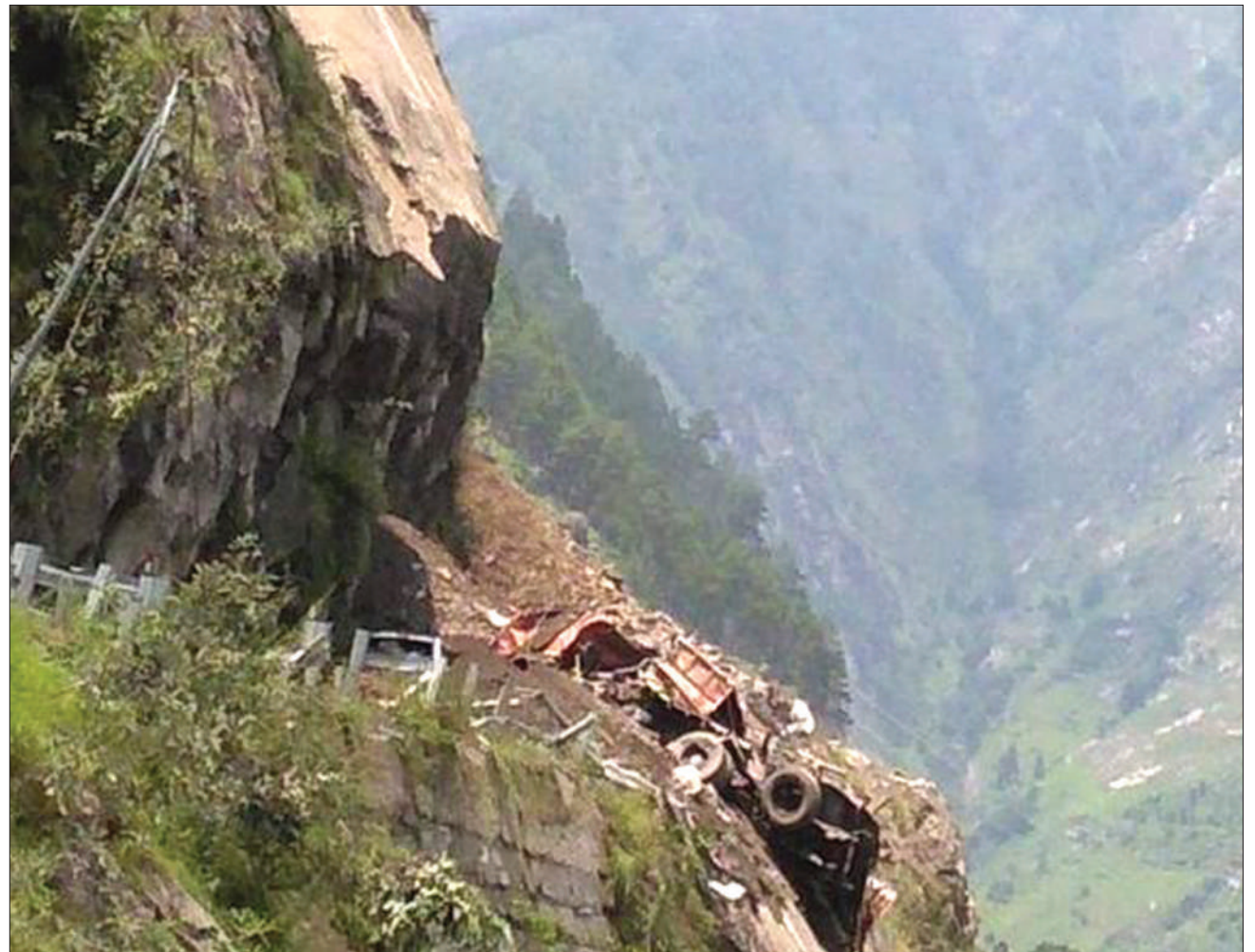
Magari yakiwamo ya abiria yakiwa yameharibiwa na maporomoko ya udongo, na kuua watu wawili na makumi kujeruhiwa Kaskazini mwa India, Jimbo la Himachal Pradesh, jana.