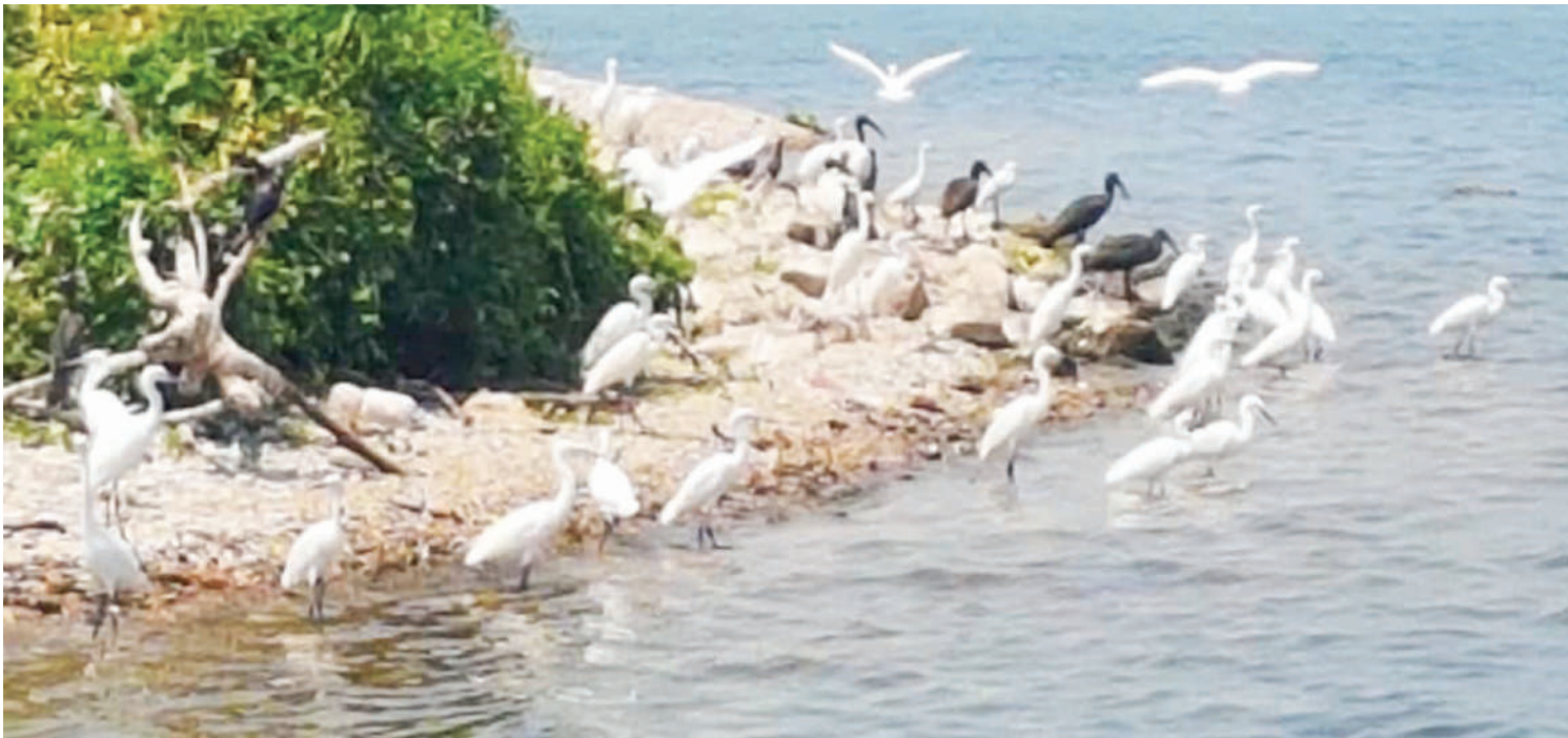
Ndege Ulaya na sitatunga vivutio mujarabu vya Hifadhi ya Rubondo.