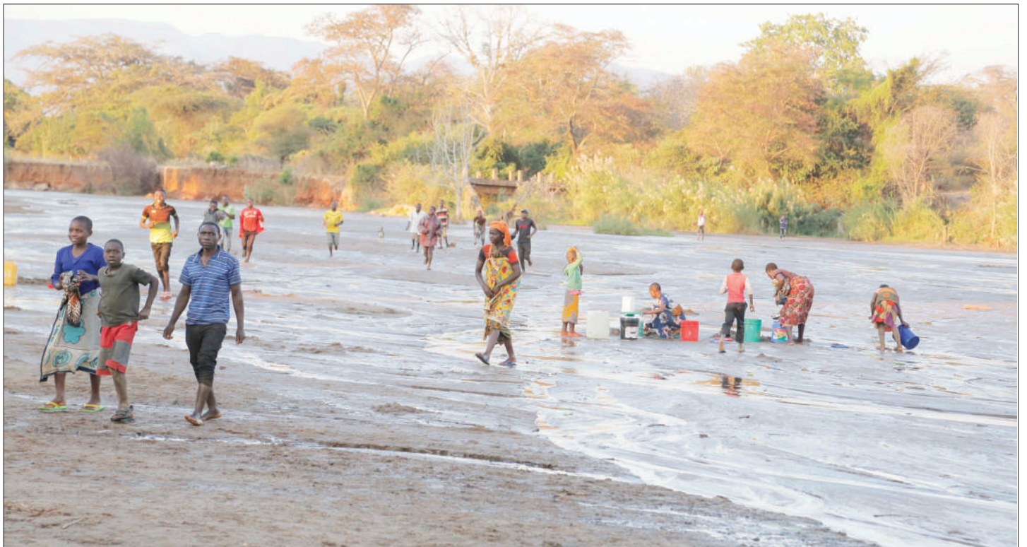
Baadhi ya wananchi wa Kijiji cha Mbori, Wilaya ya Mpwapwa, mkoani Dodoma, wakichota maji kwa ajili ya matumizi ya nyumbani kwenye Mto Mbori juzi, huku wengine wakiyakanyaga wakati wakivuka kitendo ambacho ni hatari kwa afya za watumiaji.

Kuhusu kupunguza msongamano, mhandisi huyo alisema barabara za pembezoni zitafanywa marekebisha ili kupunguza msongamano katika barabara kuu huku akibainisha barabara ya Medeli kupitia Kisasa hadi Nzuguni itajengwa kwa kiwango cha lami ili kutumika kama njia mbadala.