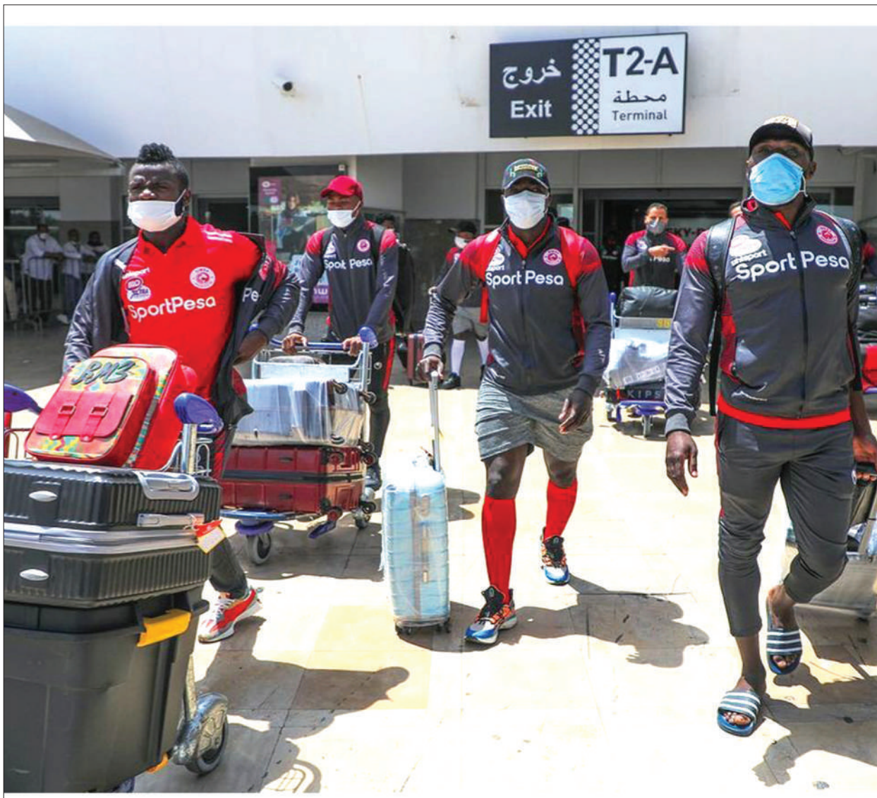
Wachezaji wa Simba ya jijini Dar es Salaam wakiwa wametua nchini Morocco ambapo timu yao inatarajia kuweka kambi maalumu kwa ajili ya maandalizi ya msimu ujao wa Ligi Kuu Tanzania Bara na mashindano ya kimataifa ya Ligi ya Mbingwa Afrika watakayoshiriki.