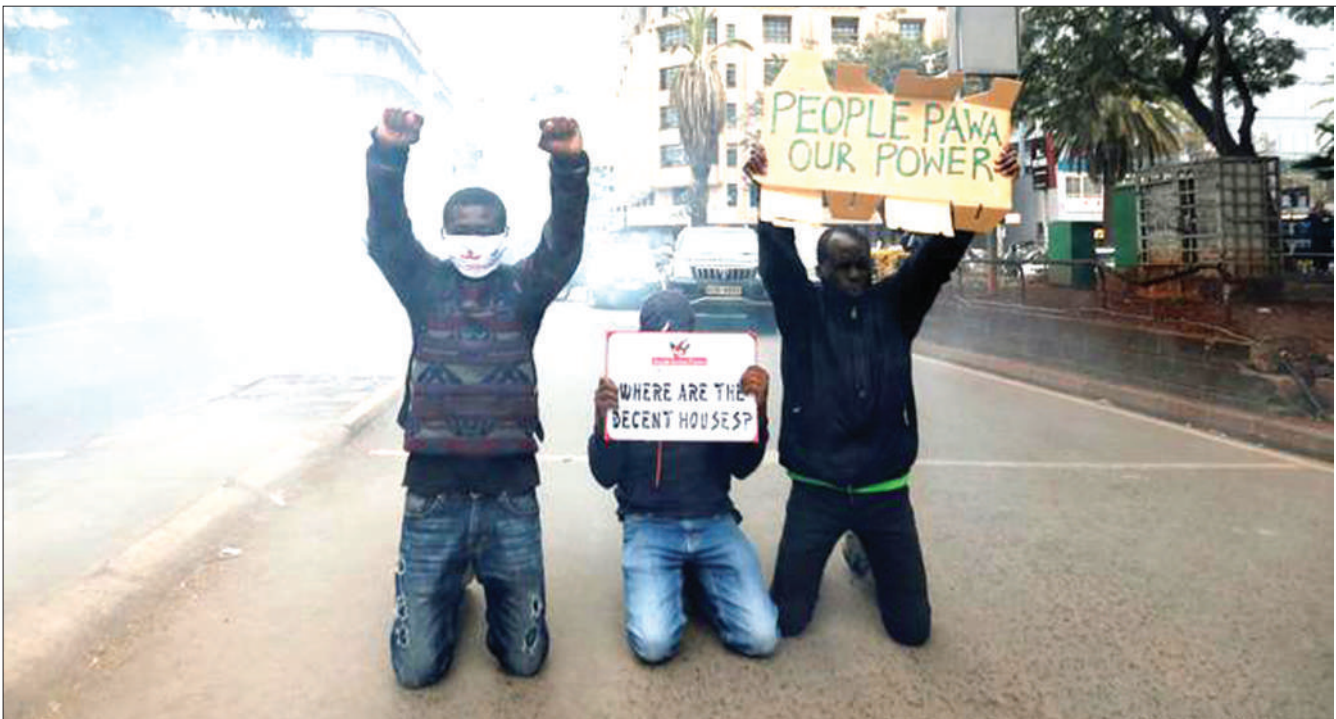
Baadhi ya wanaharakati nchini Kenya wakiwa wamepiga magoti huku wakishika mabango wakati wa maandamano, wakilalamikia ukosefu wa haki nchini humo.