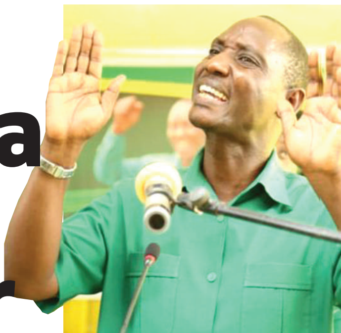
Katibu Mkuu wa CCM, Dk. Bashiru Ally.