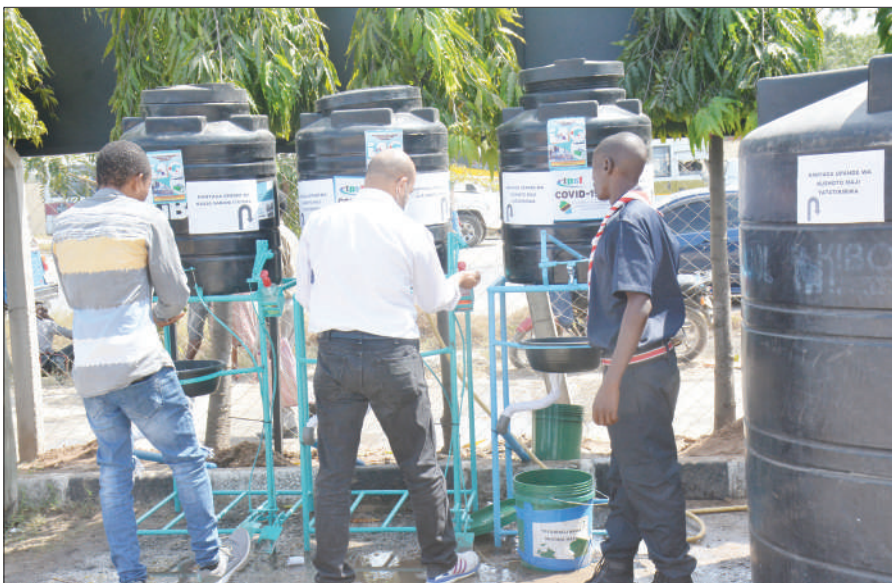
Wananchi wakichukua tahadhari ya maambukizi ya ugonjwa wa corona kwa kunawa mikono kabla ya kuingia katika Maonyesho ya 44 ya Biashara ya Kimataifa ya Dar es Salaam, katika Uwanja wa Mwalimu Nyerere, Barabara ya Kilwa, jana.