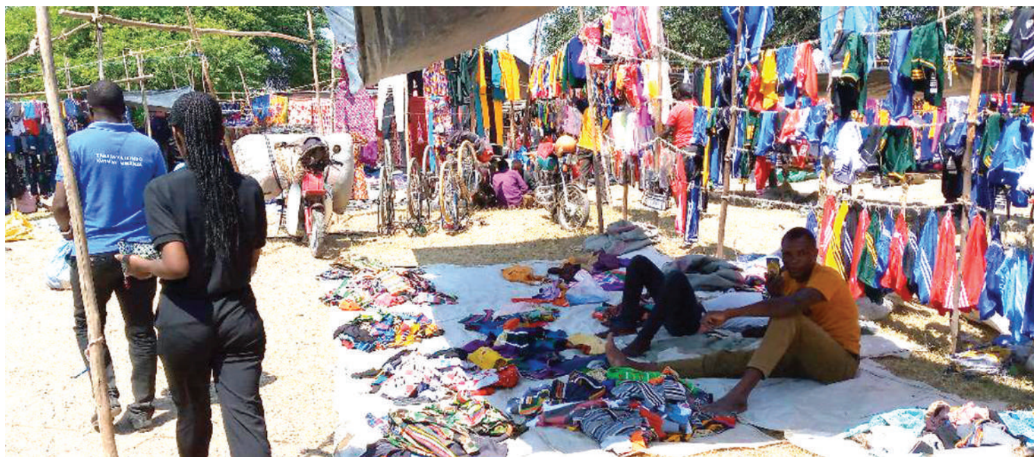
Mnada wa Nyambiti wilayani Kwimba, unaotajwa kuwa miongoni mwa vichocho vya mimba za utotoni, PICHA ZOTE: NEEMA MICHAEL.