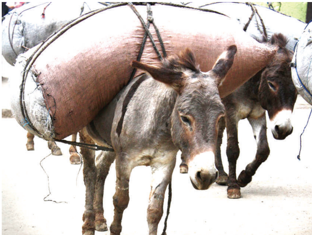
Punda wakibebeshwa mizigo kuliko uwezo wao. PICHA ZOTE: MTANDAO.

Mtaalamu mifugo huyo, anasema wanaokiuka kwa mara ya pili na kuthibitika mahakamani wanaadhibiwa, hutozwa faini inayoanzia Sh. 300,000 hadi Sh. 500,000 au kifungo cha mwaka mmoja jela au vyote kwa pamoja kulingana na mahakama itakavyo-