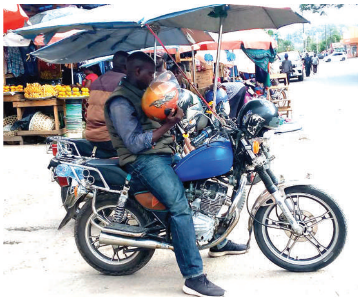
Mwendesha bodaboda akiwa kwenye kituo chake cha biashara.

Pia, ana mtazamo mwingine wa haja ya wazazi na jamii, kuzingatia