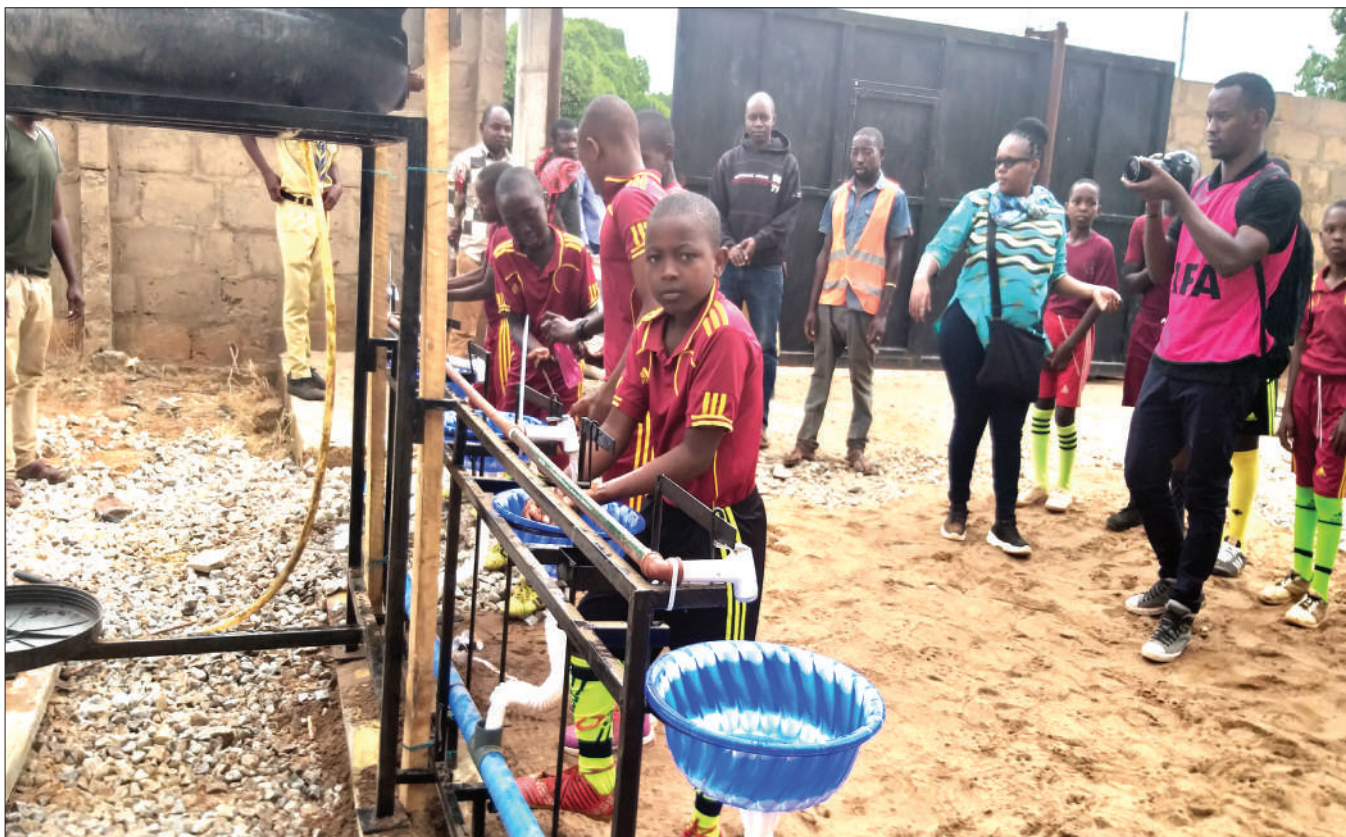
Watoto wanaokota mpira wakinawa kabla ya kuanza kwa mechi ya Ligi Kuu Tanzania Bara kati ya Simba na Namungo kwenye Uwanja wa Majaliwa ulioko Ruangwa mkoani Lindi jana.

Alisema kuwa hadi sasa hana wachezaji majeruhi, hivyo kikosi chote kitashuka dimbani dhidi ya mchezo huo kikiwa fiti.