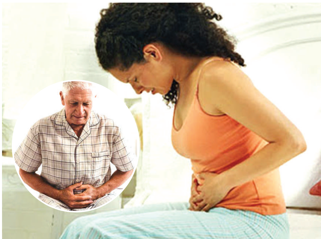
Wagonjwa tofauti wakilalama vidonda vya tumbo. PICHA ZOTE: MTANDAO.

Dalili nyingine, ni pamoja na kupungua uzito, kichefuchefu na