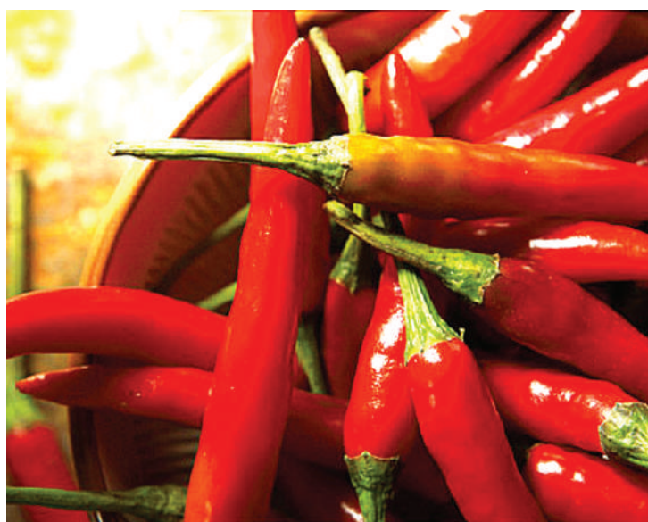
Pilipili, moja ya vyanzo vya vidonda vya tumbo.

Ni muhimu kuelewa kwamba, matibu ya vidonda vya tumbo hufanyika mara tu vinapogunduliwa