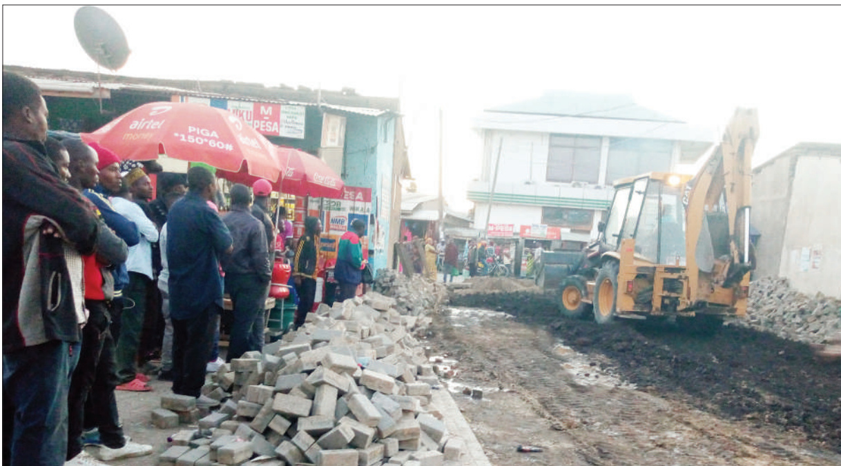
Baadhi ya wakazi wa Mji wa Mbalizi, mkoani Mbeya, wakishuhudia ukarabati kwenye eneo la kutokea magari la stendi ya mabasi ya Tarafani juzi, ambalo lilikuwa limeharibika takribani mwezi mmoja tangu stendi hiyo ilipofunguliwa.

Mganga Mkuu wa Halmashauri ya Jiji la Mbeya, Dk. Jonas Lulandala, alisema maambukizi ya malaria mkoani Mbeya ni asilimia tatu pekee, na kwamba mpango huo utasaidia wananchi na wageni wanaoingia mkoani humo kutouguu ugonjwa huo.