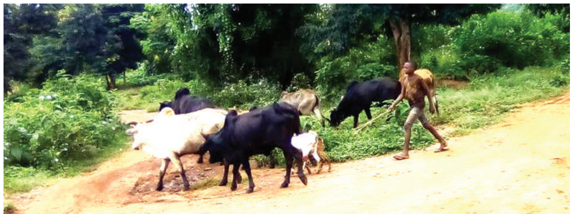
Mchungaji wilayani Babati, akiwapeleka ng'ombe malishoni.

Katika kutatua kero hiyo, wameamua kutoa elimu kwa wafugaji na wanakemea adhabu kwa wanyama na kuwafanyisha kazi nyingi, kwamba ziepukwe.