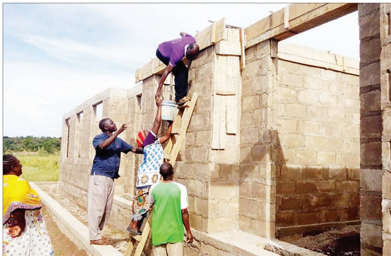
Baadhi ya wakazi wa Kijiji cha Kakisheri na Kigera Etuma, Musoma Vijijini, mkoani Mara, wakisaidiana na mafundi kuweka rentu kwenye moja ya madarasa ya sekondari ya pili inayojengwa, Kata ya Nyakatende juzi.

Kati yake, matukio 171 (24%) yalitokea katika shule za msingi na 551 (76%) yalitokea sekondari huku kwa mwaka 2019 pekee kukiripotiwa matukio 692 ya ukatili dhidi ya watoto mkoani humo.