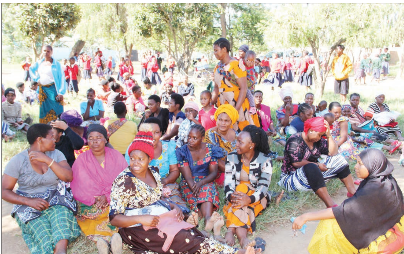
Wananchi wa Kata ya Nsalaga, jijini Mbeya wakiwa katika kusanyiko la kufanya harambee ya kuchangisha pesa kwa ajili ya kufanya ukarabati wa Shule ya Msingi Nsalaga jana.