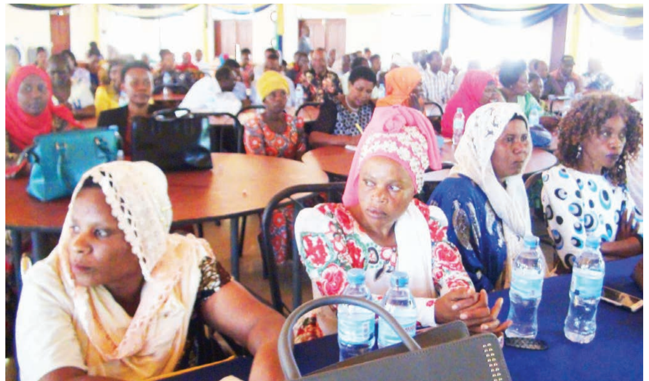
Baadhi ya watu wenye ulemavu waliohudhuria kongamano katika mikoa ya Dodoma, Tabora na Singida wakimsikiliza Mkuu wa Mkoa wa Singida, Dk. Rehema Nchimbi (hayupo pichani).

Katika sakata hilo vimekamatwa vifaa mbalimbali ambavyo ni pamoja na lita 40 za maji ya dhahabu, steel wire, copper wire, kemikali za kunasia dhahabu, kinu cha dhahabu, jiko kwa ajili ya kuchomea dhahabu carbon kilo 200 zinazosadikiwa kuwa na dhahabu, mkasi wa kushikilia dhahabu na vitu vingine vingi.