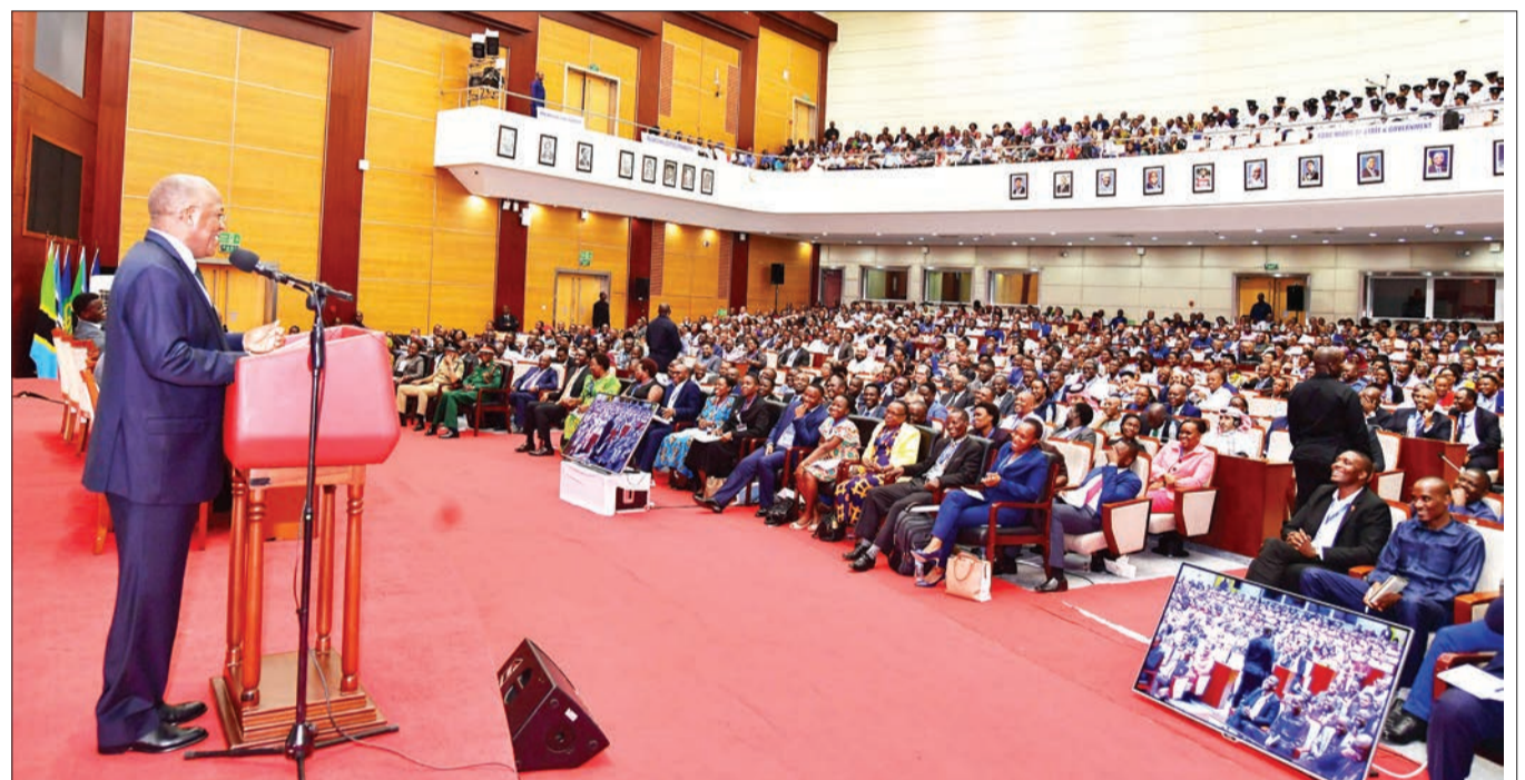
Rais John Magufuli akihutubia wakati wa maadhimisho ya Siku ya Madaktari Kitaifa, jijini Dar es Salaam jana.

Vigogo wengine walioihama Chadema na kurejea CCM walikotoka ni mawaziri wakuu wastaafu, Edward Lowassa na Frederick Sumaye.