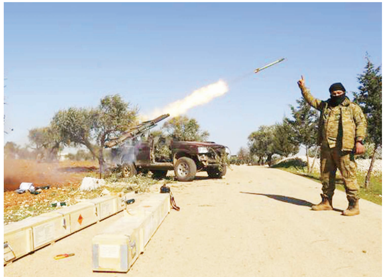
Wapiganaji wa kikundi cha waasi cha Idlib nchini Uturuki wakitekeleza mashambulio nchini humo.

Korea Kusini nayo imeripoti maambukizi mapya 31 ya corona na kufanya idadi ya walioambukizwa kufikia 82. DW