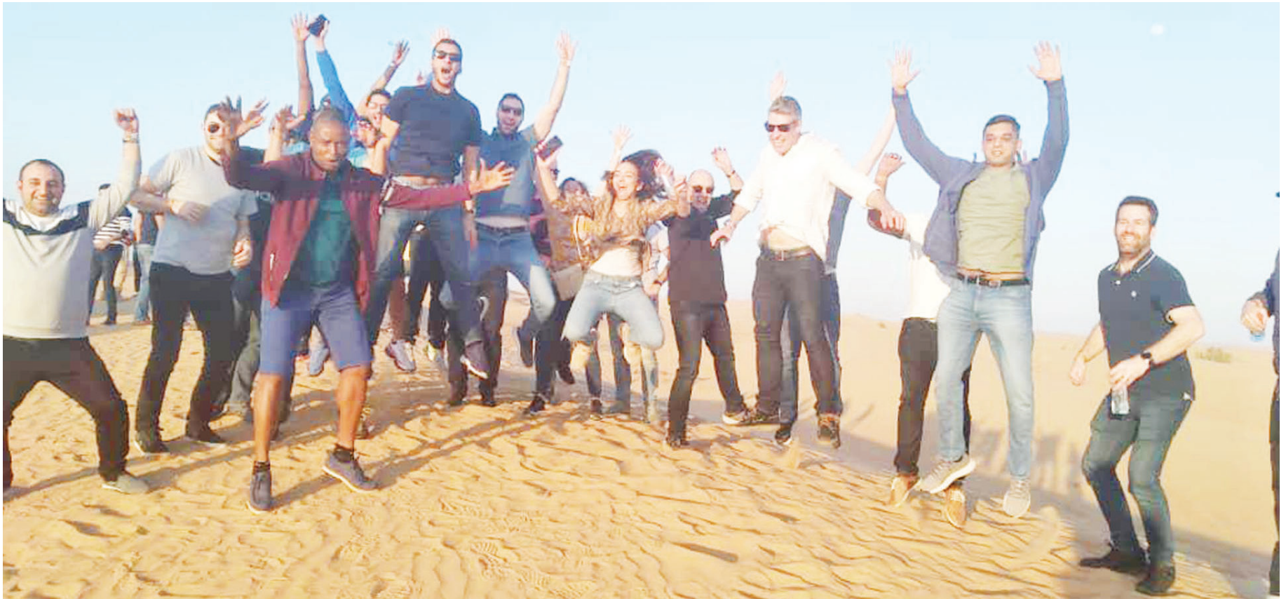
Watalii kutoka mataifa mbalimbali duniani, wakiwa kwenye jangwa mashuhuri kwa utalii, Dubai.

inamchukua mtu muda kuamini 'bahari bandia' katikati ya jiji kutokana na ukubwa na mwonekano. Hapo pamesheheni watalii wanaoshangaa.