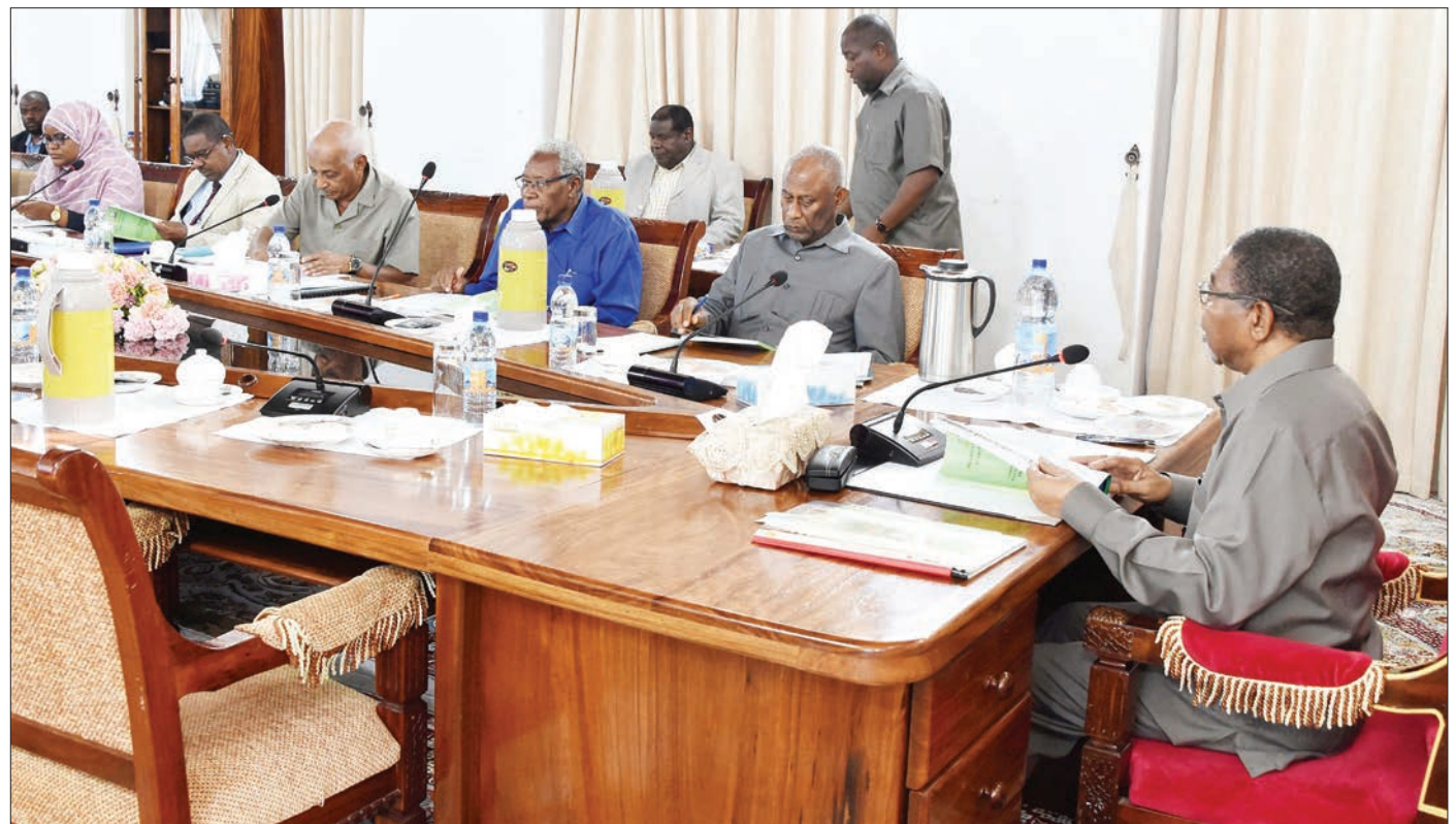
Rais wa Zanzibar na Mwenyekiti wa Baraza la Mapinduzi, Dk. Ali Mohamed Shein (kulia), akizungumza na Uongozi wa Wizara ya Fedha na Mipango, katika kikao cha utekelezaji mpango kazi kwa kipindi cha Julai-Desemba 2019, kilichofanyika katika ukumbi wa Ikulu, mjini Zanzibar jana.