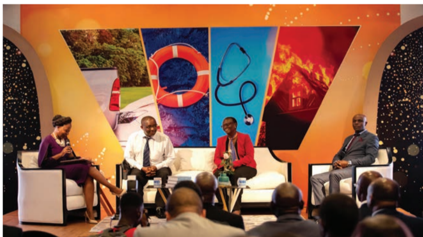
Mdahalo kuhusu mchango wa benki kwenye utoaji wa huduma za bima nchini.