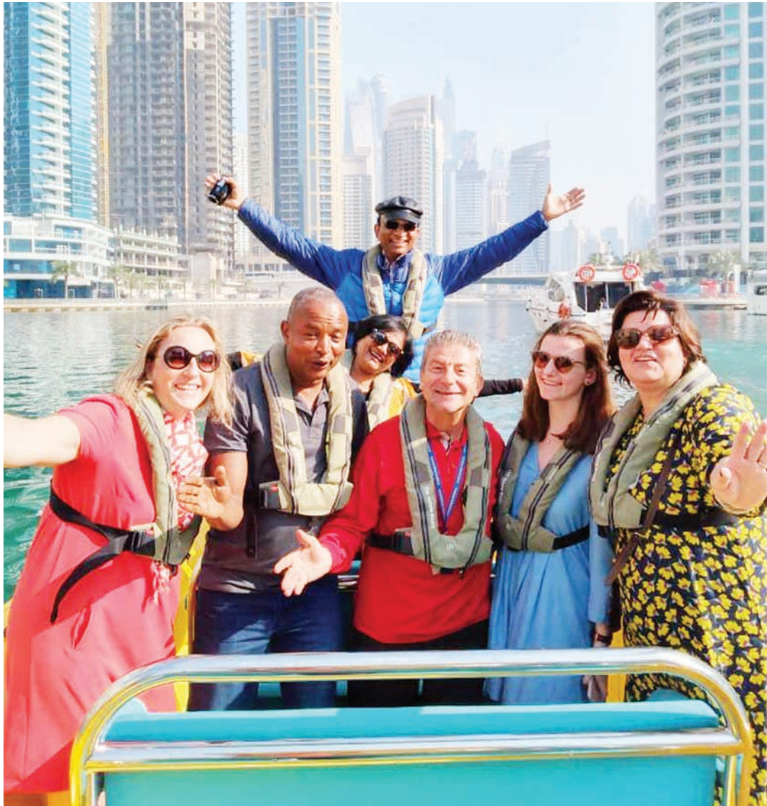
Watalii wakiwa kwenye bahari ya kutengenezwa na 'Marine Parks' iliyoko katikati ya mji wa Dubai.

Jambo lingine la kushangaza Dubai, ni kwamba huwezi kuona gari kuukuu, mengi ni mapya na ya kifahari na nilipotaka kufahamu sababu, mwenyeji wangu