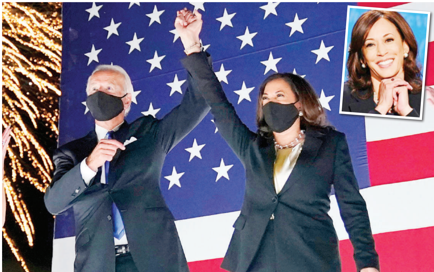
Rais mteule wa Marekani, Joe Biden na Makamu wa Rais, Kamala Harris, wakiwa wamenyanyua mikono yao juu ikiwa ni ishara ya ushindi baada ya matokeo ya uchaguzi kutangazwa kufuatia uchaguzi mkuu wa nchi hiyo, Novemba 3, mwaka huu. Harris (picha ndogo), anakuwa mwanamke wa kwanza kushika wadhifa huo katika taifa lenye nguvu kubwa kiuchumi duniani.

kukumbwa na maandamano ya kupinga ubaguzi wa rangi hasa kwa watu walio na asili ya Kiafrika dhidi ya polisi, alikuwa mshauri mkuu kuhusu masuala hayo kwenye mahakama.