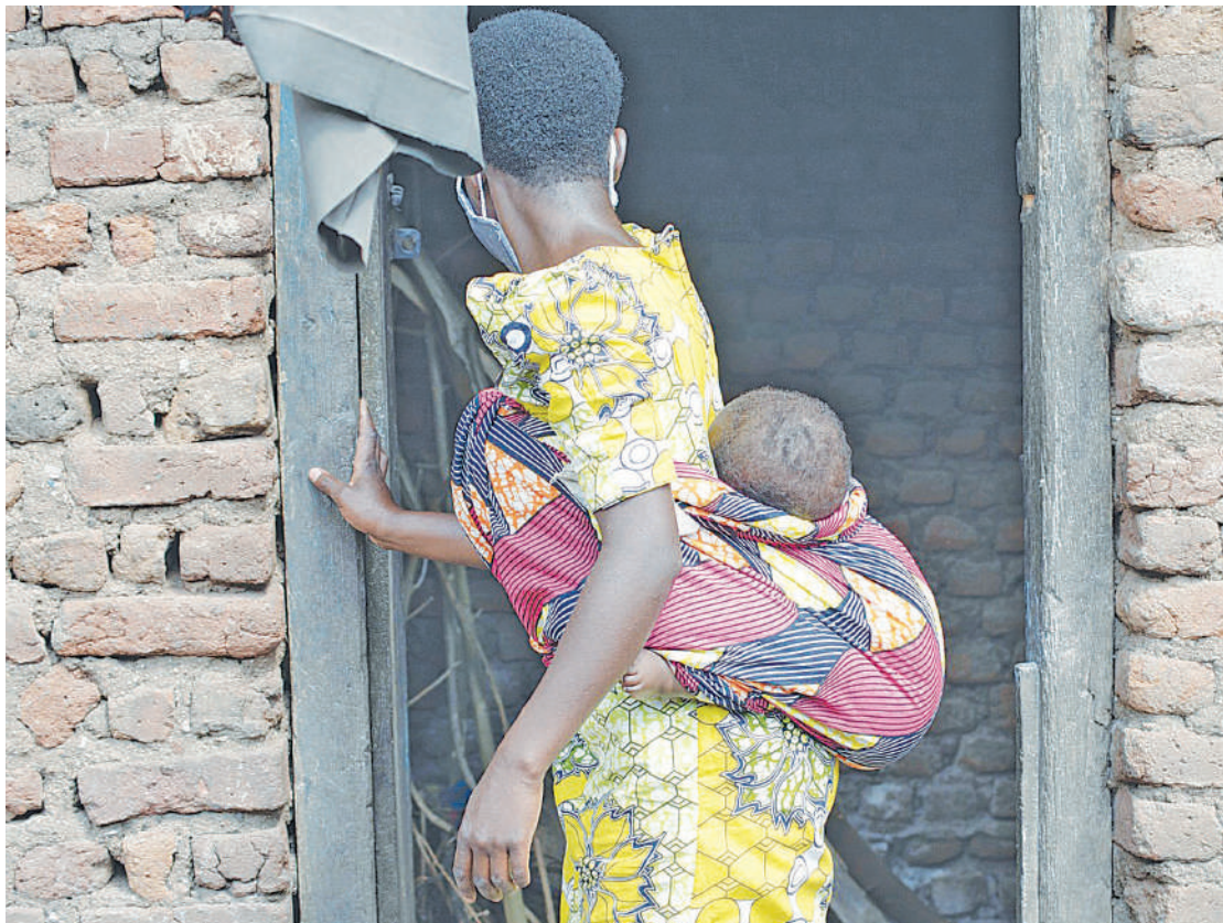
Hali ya mimba kwa mabinti, na wale ambao wamwefikia uzazi, katika picha tofauti.