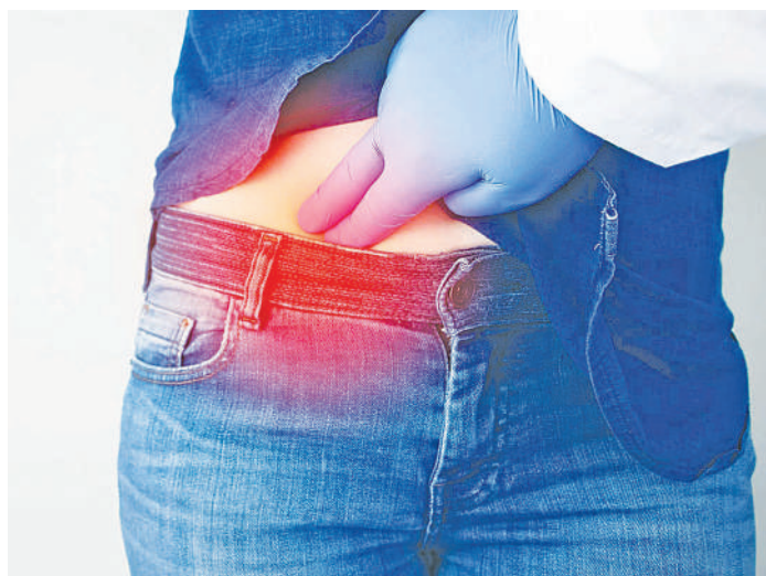
Daktari akimhudumia anayeugua maradhi PID

“ Ugonjwa huo kitaalamu unaelezwa unaweza kusababisha shida nyinginezo; maradhi ya 'Kansa ya Shingo ya Kizazi' au uvimbe kwenye mayai ya mwanamke.