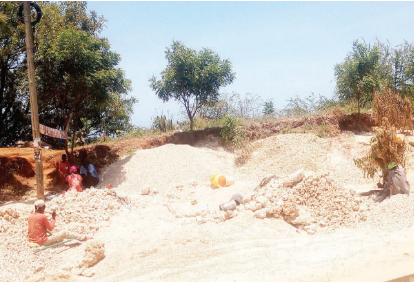
Baadhi ya wakazi wa Dar es Salaam, wakiponda kokoto katika eneo la Mbuyuni, Manispaa ya Kinondoni juzi, kwa ajili ya kuziua ili kujipatia riziki.