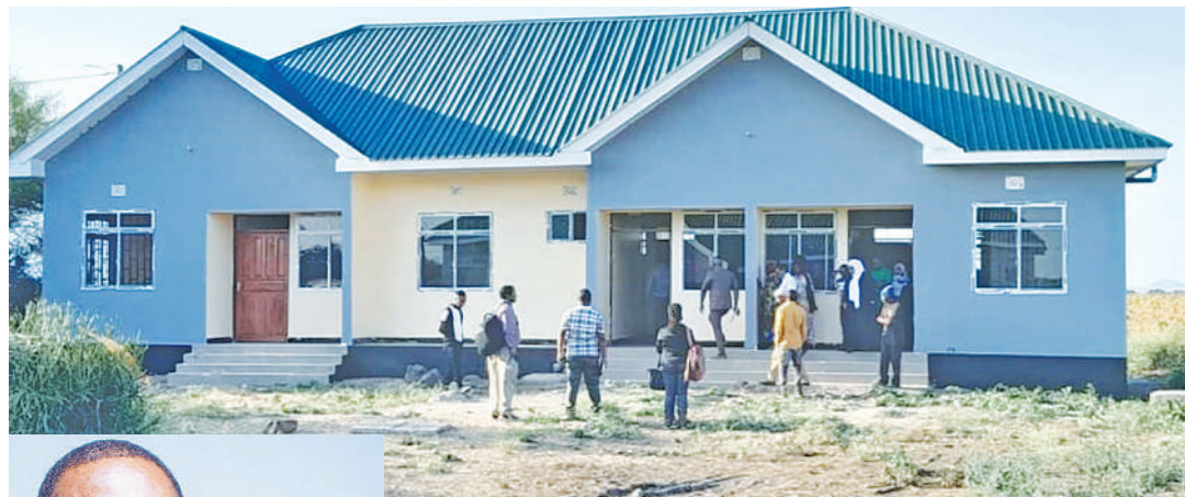
Jengo la watumishi wa Kituo cha Afya, kilometa 10 nje ya Arusha, lililojengwa na TASAF.

Mwaka mmoja baadaye, Novemba 2022, Rais Dk. Samia akatangaza kuongeza muda kwa wanufaika wa Mradi wa Kunusuru Kaya Maskini (TASAF) hadi mwaka ujao, 2025, kauli iliyopokewa na Naibu Waziri Ofisi ya Rais Utumishi na Utawala