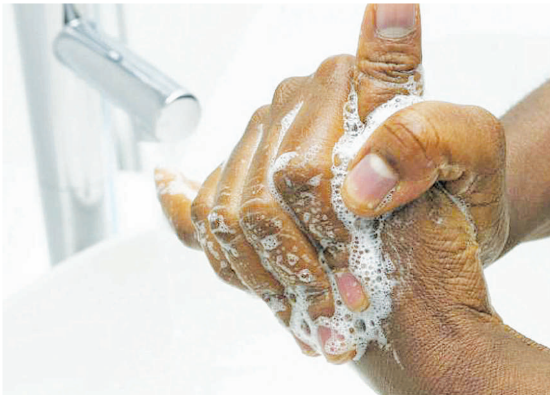
Mtu akinawa mikono.

Kadhalika tovuti za masuala ya afya pamoja na WHO, Cleveland