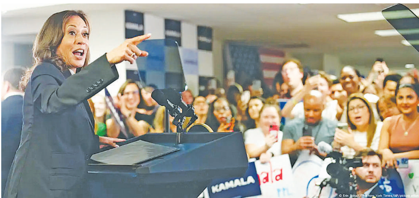
Kamala Harris, makamu wa rais wa Marekani anayekaribia kuteuliwa rasmi kuwa mgombea urais wa Chama cha Democratic.