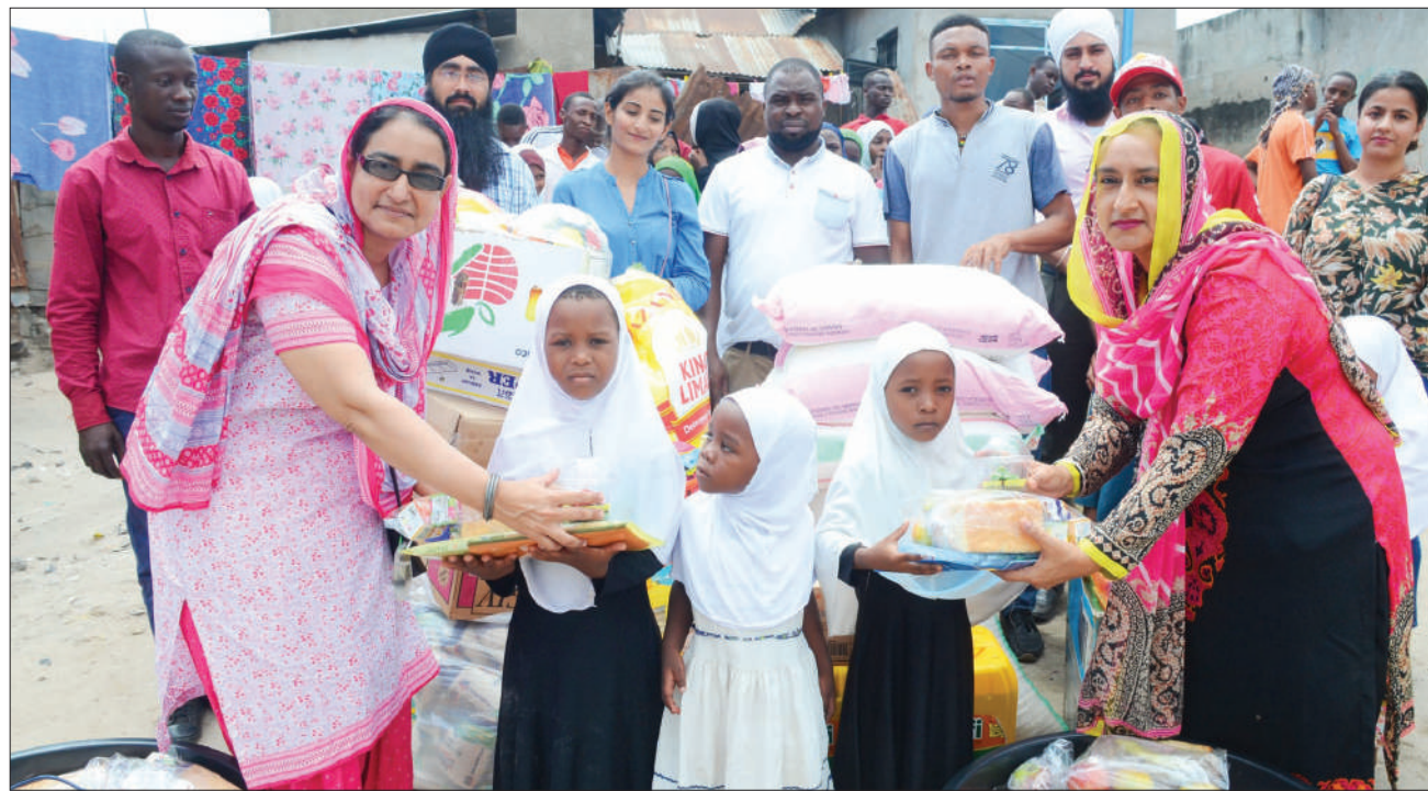
Wawakilishi wa vijana wa dhehebu la Singasinga Mkoa wa Dar es Salaam, wakitoa msaada wa vitu mbalimbali kwa watoto wa kituo cha kulelea yatima cha Al-Hidaya kilichopo Buguruni jijini Dar es Salaam jana.

Katika ujenzi huo, wananchi wanachangia nguvu zao kama vile kufyatua matofali, kukusanya mawe na ufundi.