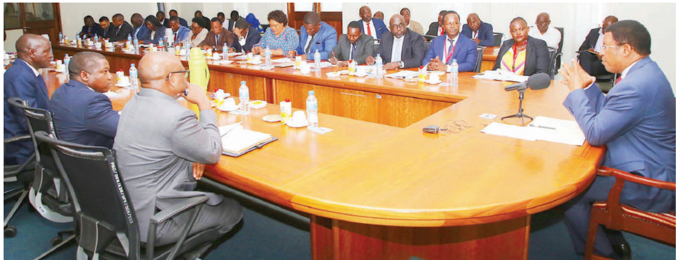
Waziri Mkuu, Kassim Majaliwa, akizungumza na viongozi wa Taasisi ya Sekta Binafsi Tanzania (TPSF) kwenye ukumbi wa ofisi ndogo ya Waziri Mkuu, Magogoni jijini Dar es Salaam jana.