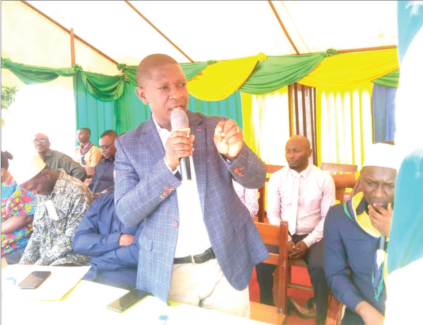
Mbunge wa Nachingwea, Dk. Amandus Chinguile, akitoa neno kwenye mahafali ya darasa la saba ya Shule ya Msingi Silvernash, alipokuwa jimboni mwake wiki iliyopita.