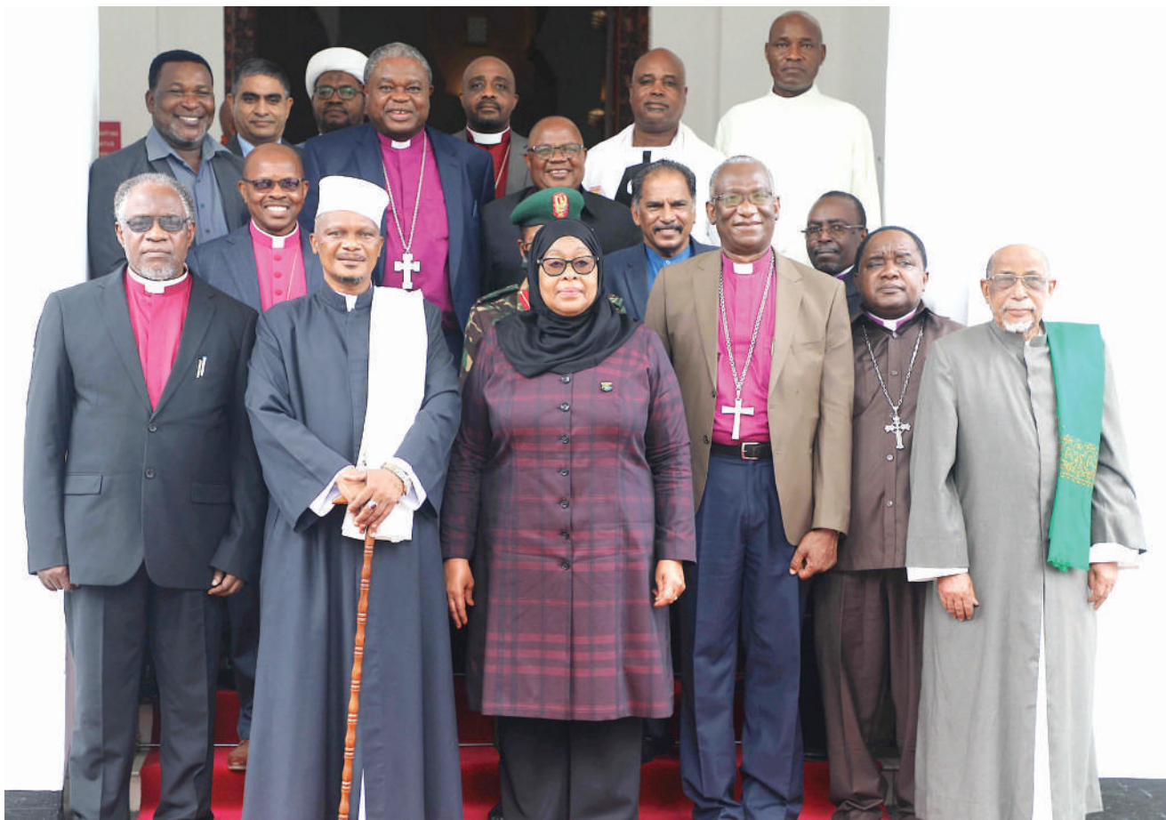
Rais Samia Suluhu Hassan, akiwa na baadhi ya viongozi mbalimbali wa dini baada ya kikao chao, Ikulu, jijini Dar es Salaam jana.