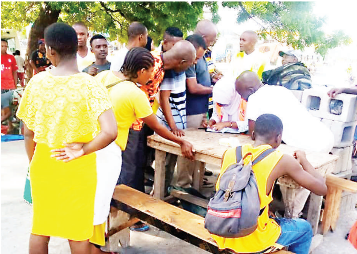
Wananchi wakijiandikisha kwa ajili kupata chanjo ya UVIKO-19, katika eneo la Feri, Magogoni, jijini Dar es Salaam juzi, wakati wa kampeni iliyoendeshwa na Idara ya Afya katika Wilaya ya Ilala, kwa kushirikiana na wadau mbalimbali, kikiwamo Chama cha Kutetea Abiria Tanzania (CHAKUA).

"Abiria wanapata elimu kuhusu haki zao wanapokuwa katika vyombo vya usafiri, lakini wanaelimishwa na kuhamasishwa kuchukua hatua za kuchanja ili kujikinga na ugonjwa huo.