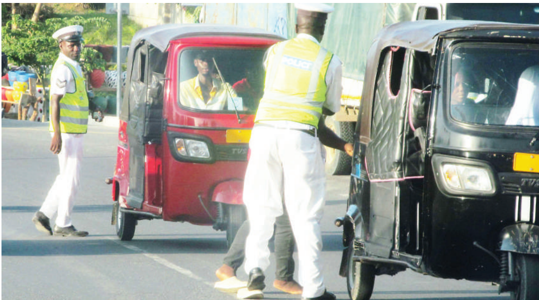
Askari wa Kikosi cha Usalama Barabarani akimdhhibiti dereva wa bajaj, baada ya kutofautiana wakati akitekeleza majukumu yake, katika eneo la Palestina, Mbezi Mwisho, Manispaa ya Ubungo, mkoani Dar es Salaam juzi.

Mavika alisema kabla ya serikali kuanzisha mfumo wa kushughulikia malalamiko kielektroniki, wananchi hawakuwa na fursa ya kupata mrejesho wa malalamiko yao kwa wakati, hivyo Ofisi ya Rais, Menejimenti ya Utumishi wa Umma na Utawala Bora kwa kushirikiana na Mamlaka ya Serikali Mtandao (e-GA) iliona ni vyema kuanza mfumo wa kielektroniki ambao kwa kiasi kikubwa utaongeza uwajibikaji katika eneo la kushughulikia malalamiko.