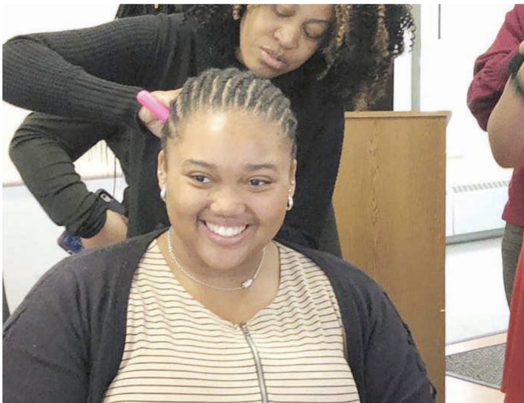
Kinamama wakikusuka, moja ya vigezo muhimu vya fahari ya nafsi zao.

Tatu, kutumia mafuta ya kuzuia jua kila mara: Inashauriwa mafuta maalum yenye walau asilimia saba za oksidi ya zinki na 'SPF 30' kila siku, inayotoa kinga dhidi ya jua, ambayo ni hatari kwa ngozi. Maeneo hayo yanajumuisha uso ni kila baada ya saa mbili, mtu anapotoka nje.