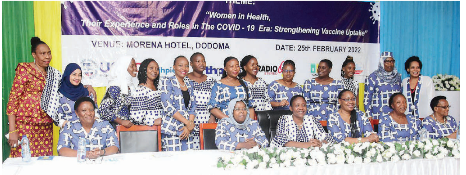
Madaktari wanachama wa MEWATA wakiwa kwenye mkutano wao mjini Dodoma, wiki hii.

• Leo waungana naye kupigania chanjo ya Uviko - 19