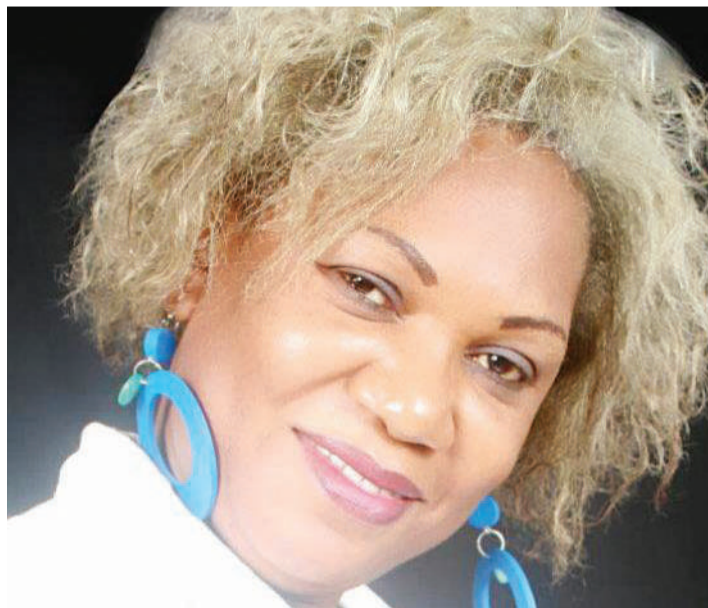
Mama mwenye mvi.

Hata uwe mrefu kiasi gani, kuna mambo unaweza kufanya bila kuchoka kutunza nywele zako, vilevile zikiwa ni fupi unaweza kuzirekebisha ili zionekane vizuri zaidi kwako.