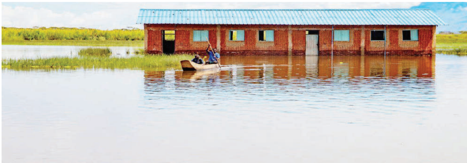
Shule iliyotelekezwa kutokana na kufurika maji ya Ziwa Tanganyika nchini Burundi.

• Utalii waangukia hasara isiyotarajiwa • Mgahawa wa kipekee 'bichi' wamezwa • Mashamba shida, kwa majirani hadithi ileile