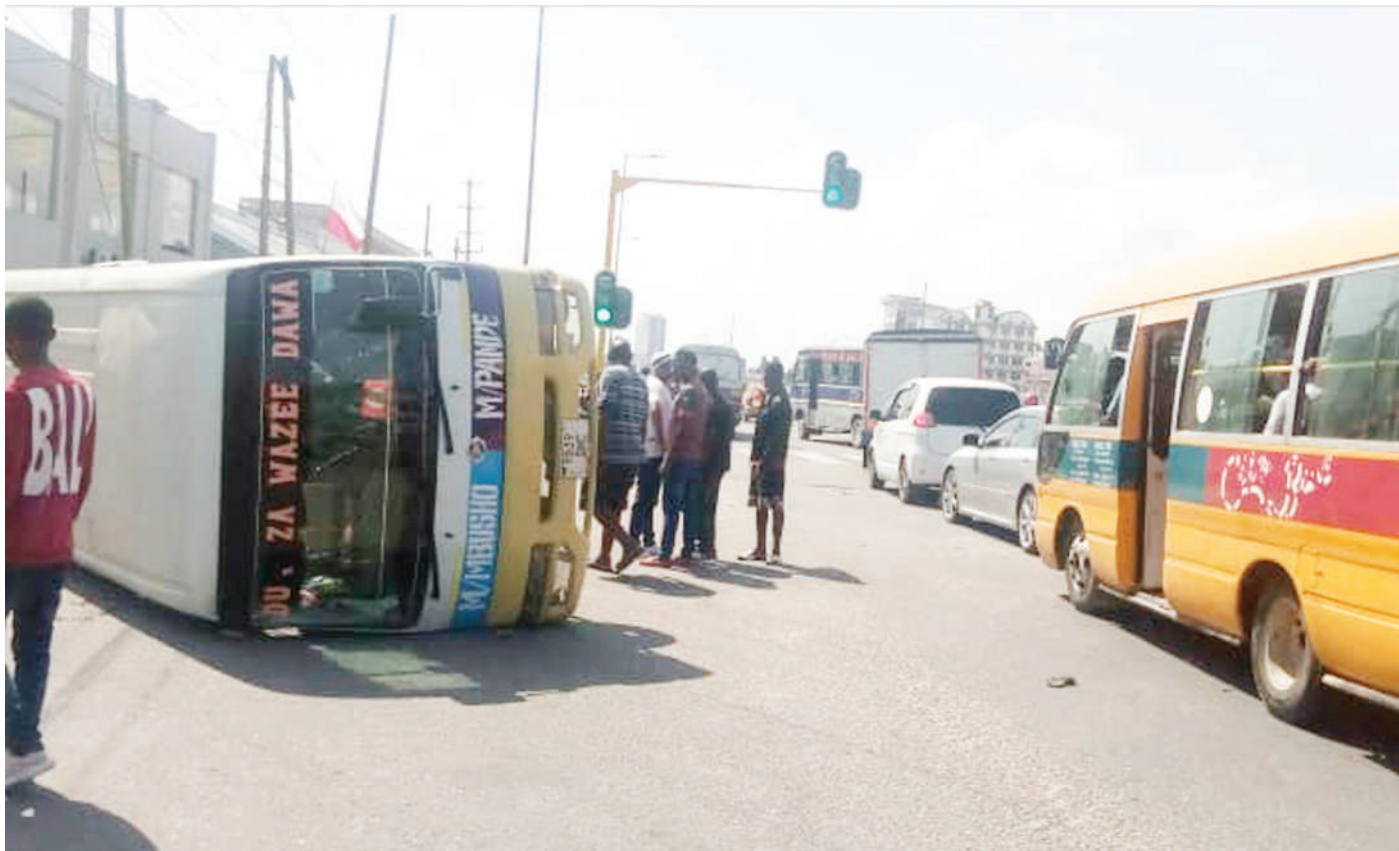
Wananchi wakiangalia basi la daladala lenye namba za usajili T539 DMC, linalofanya safari zake kati ya Makumbusho na Mabwepande, baada ya kupata ajali katika Barabara ya Bagamoyo, eneo la ITV, Manispaa ya Kinondoni, mkoani Dar es Salaam jana.

Alisema kuna aina zingine za fursa kama uwekezaji kwenye sekta mbalimbali za kiuchumi kama kilimo, uvuvi na ufugaji pamoja na elimu, biashara na afya ambazo zinaweza kumnufaisha mtu lakini cha muhimu ni kufanya utafiti wa kina.