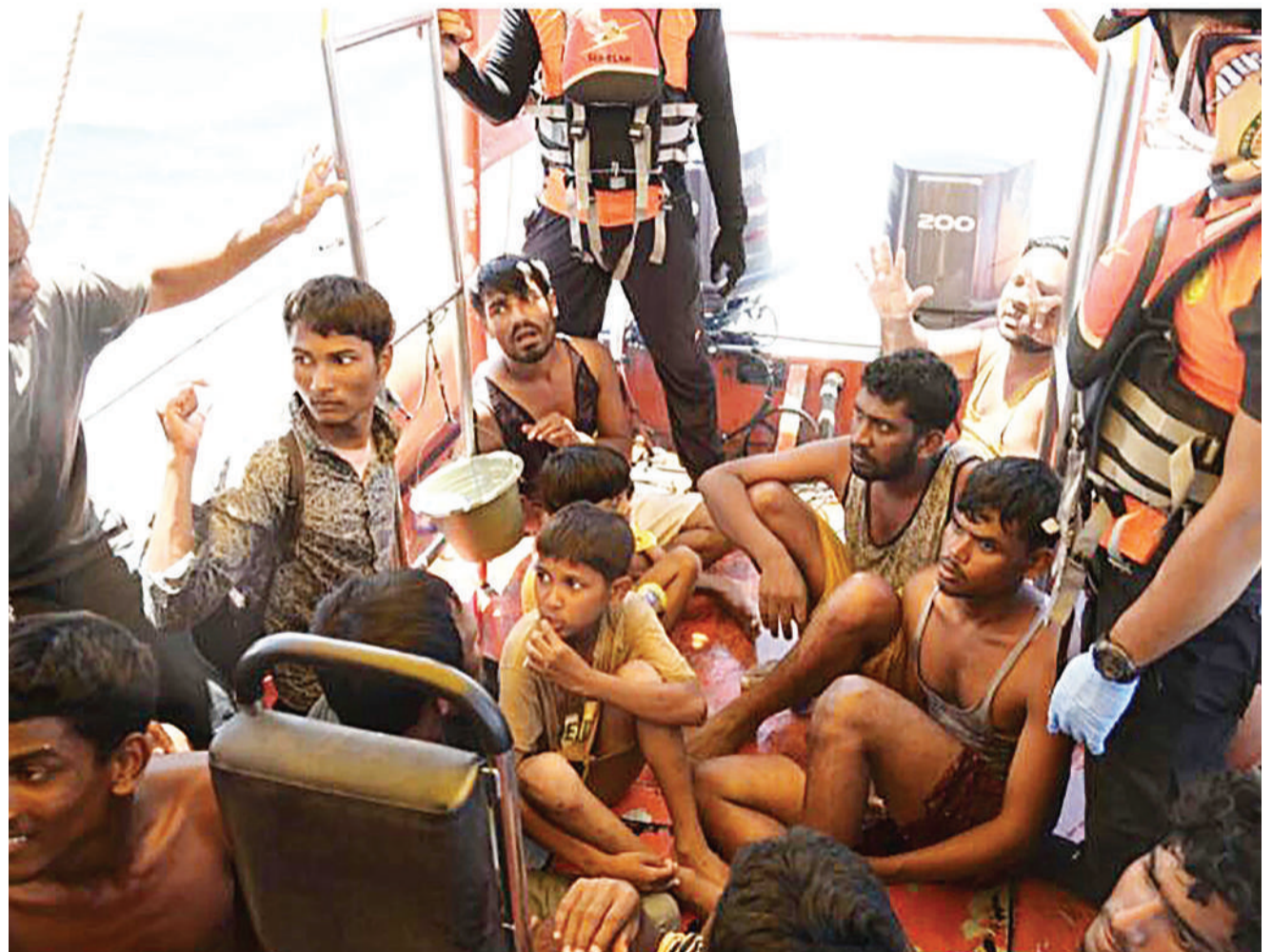
Wakimbizi wa Rohingya waliokolewa baada ya boti yao kupinduka na kuhofia wengine wengi kufa kwa maji karibu na pwani ya kaskazini mwa Indonesia juzi.