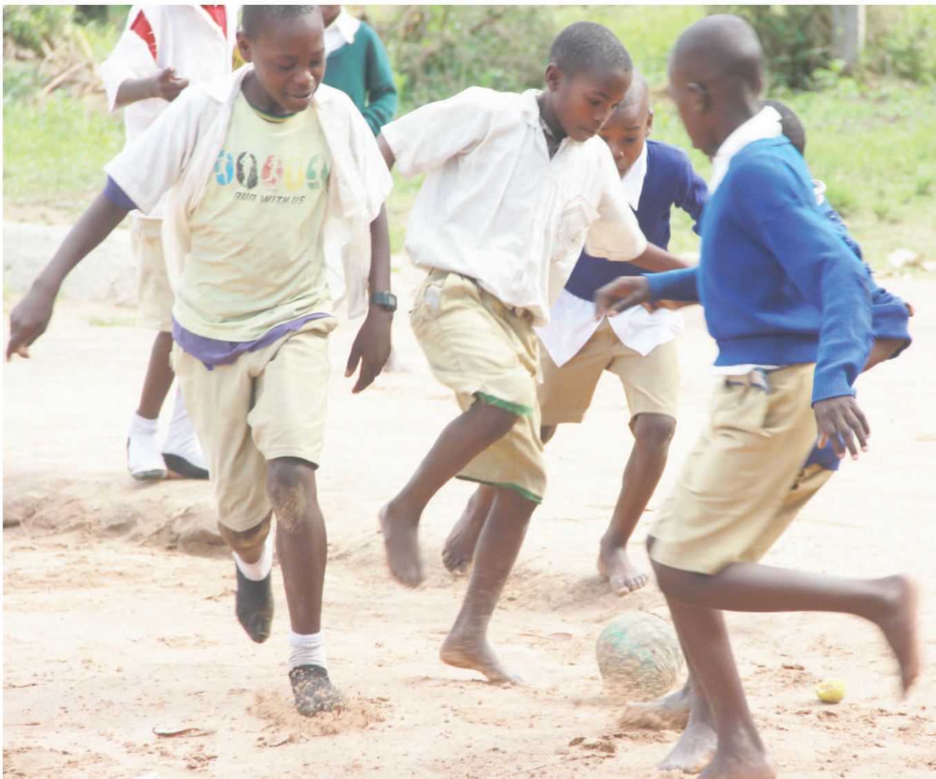
Wanafunzi wa Shule ya Msingi Luchebele ya jijini Mwanza wakicheza mpira maarufu kama 'sembo' wakati wa mapumziko shuleni hapo.