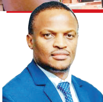
Mkurugenzi Mkuu wa TPA, Plasduce Mbossa