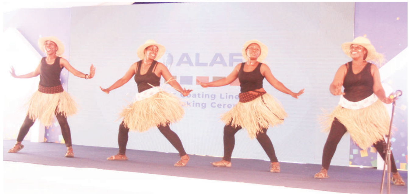
Kikundi cha ngoma za asili kikitumbuiza wakati wa uwekaji wa jiwe la msingi la kiwanda cha kutengeneza mabati ya rangi cha Alaf jijini Dar es Salaam juzi.

Alieleza kuwa amekua akiongea na wachezaji wake suala la kupambana na kujittoa katika mchezo huo kwa sababu ni mechi ambayo wanahitaji kutafuta ushindi na kutoruhusu bao ili mechi ya marudiano ugenini wasiwe na mlima mrefu.