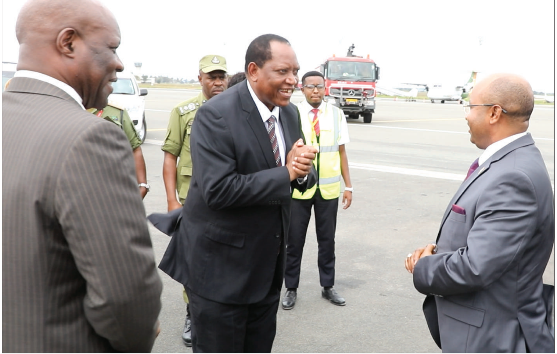
Waziri Mkuu wa Burundi, Jenerali Alain Guillaume Bunyoni (kulia), akipokewa na Waziri wa Mambo ya Nje na Ushirikiano wa Afrika Mashariki, Prof. Palamagamba Kabudi, baada ya kuwasili katika Uwanja wa Ndege wa Kimataifa wa Julius Nyerere, jijini Dar es Salaam jana, kuhudhuria mazishi ya kitaifa ya Rais mstaafu, Benjamin Mkapa.