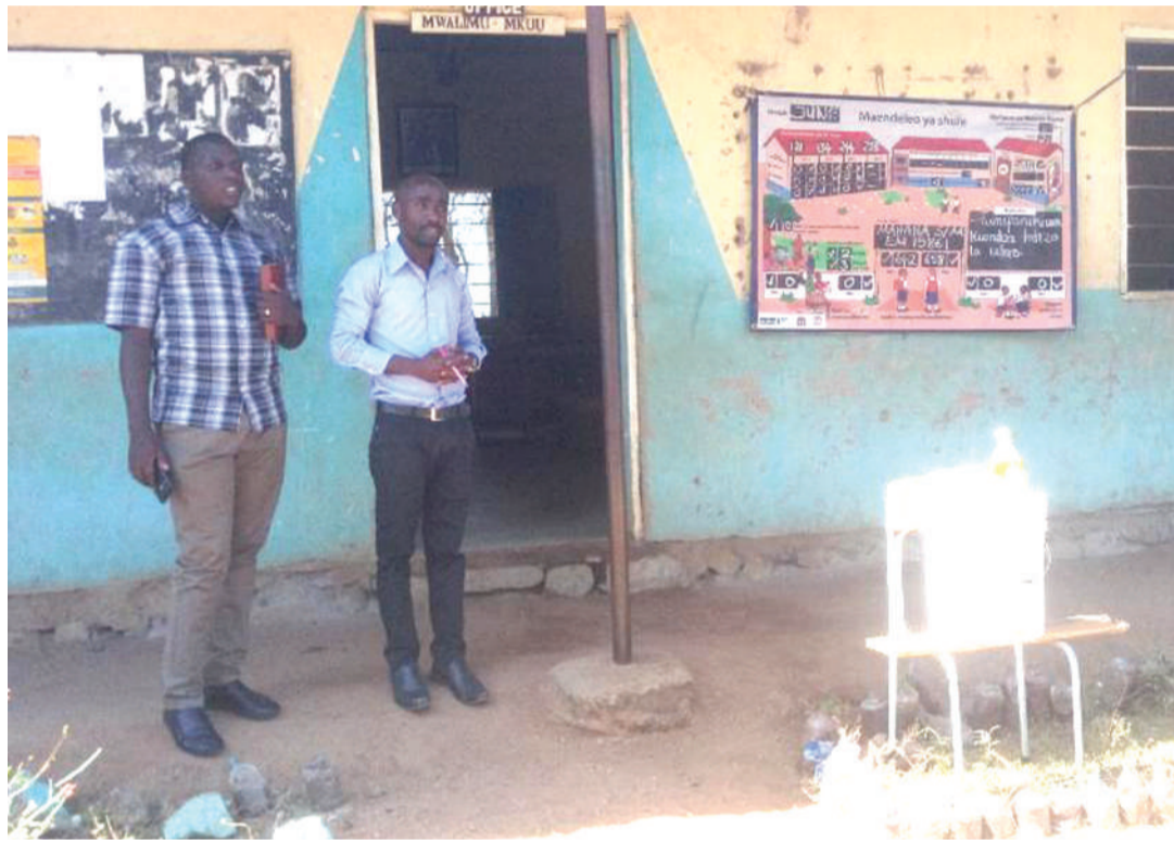
Mandhari na ofisi za shule wilayani Bariadi zilizokumbwa na mkasa wa kitaaluma, katika likizo ya corona.

kubwa sana kama malengo yetu tuliyokuwa tumejiweka kama yataweza kufanikiwa, kwani likizo ya corona imewafanya wanafunzi wengi kushuka viwango vyao vya uelewa," anasema Mwalimu Makene.