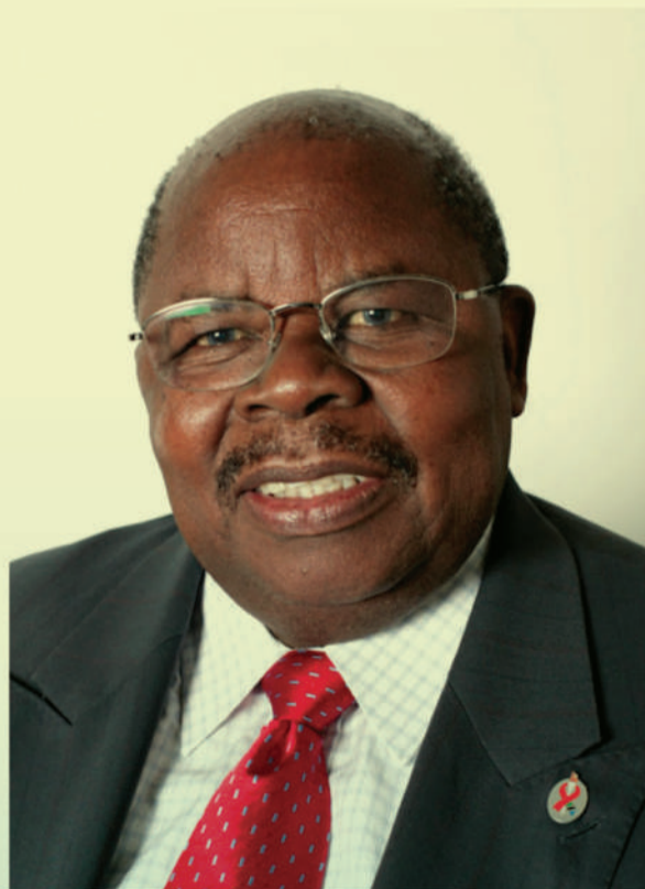
Benjamin William Mkapa (1938 - 2020)

Tovuti: www.tasaf.go.tz Barua pepe: info@tasaf.go.tz