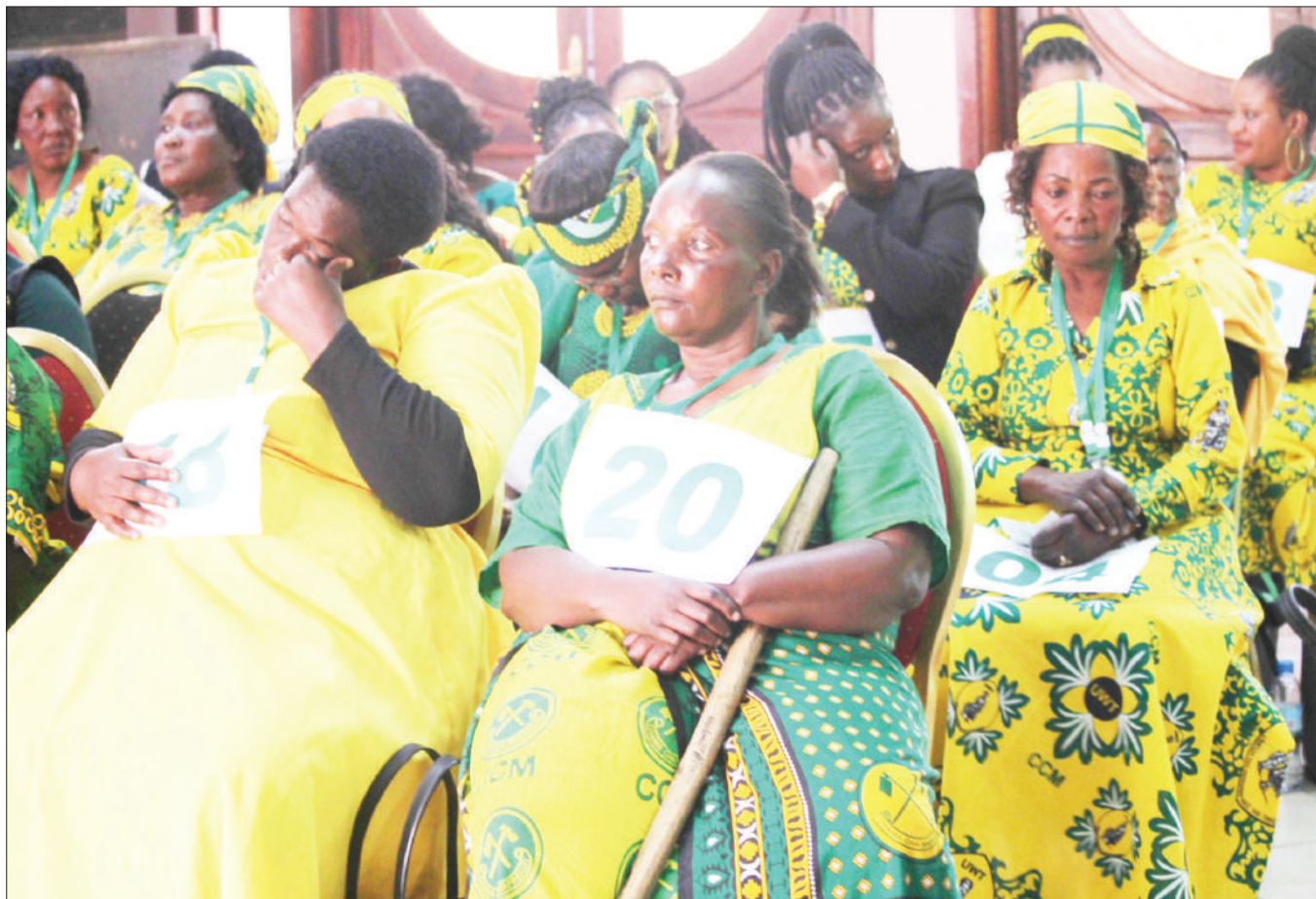
Baadhi ya wagombea udiwani wa viti maalum, Jimbo la Mbeya Mjini, wakiwasikiliza wagombea wenzao (hawapo pichani), wakati wakijinadi katika uchaguzi wa kura za maoni ili kuwapata wagombea 14 wa nafasi hizo kati ya wagombea 93 wanaoshirikiki, jijini humo, juzi.

Alisema wanafunzi hivyo kutokana na kwamba faida wanayoipata inatokana na jamii, ambayo ndiyo wateja wakuu wa benki hiyo kwa kutumia huduma za kibenki.