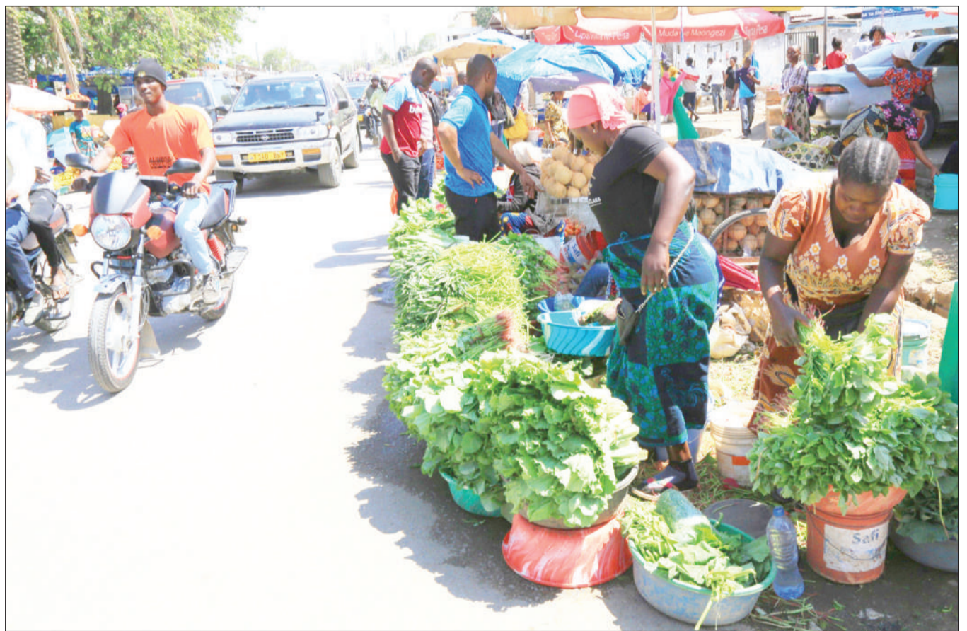
Baadhi ya wachuuzi wa mboga, wakiendelea na biashara zao kando ya barabara nje ya soko kuu la Majengo, jijini Dodoma jana, huku magari na pikipiki zikipita karibu kitendo ambacho ni hatari kwa usalama wao.

Pamoja na mengi aliyofanya, Mkapa atakumbukwa kwa jitihada zake za kupambana na rushwa, ubadhirifu na kuwa mstari wa mbele kuchochea kukua kwa uchumi wa Tanzania.