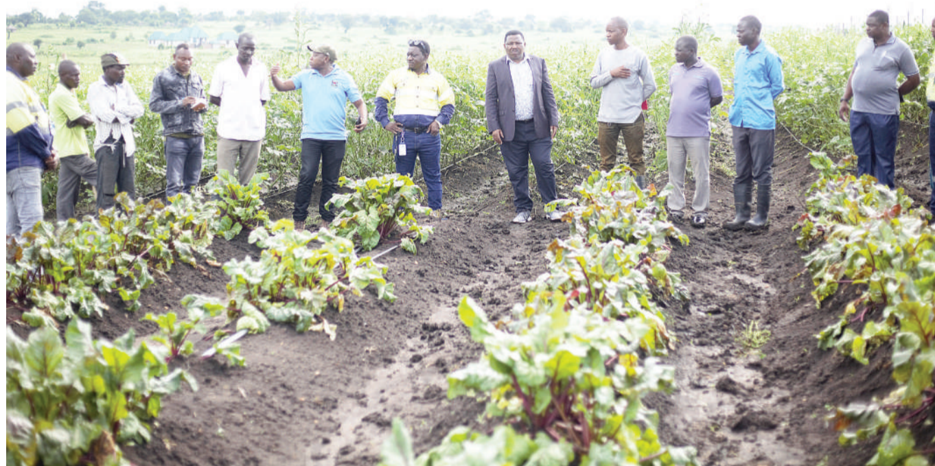
Timu ya Wakurugenzi kutoka Ofisi ya Waziri Mkuu, wakipata maelezo kuhusu mradi wa kilimo biashara ulioanzishwa na Mgodini wa Barrick North Mara, kwa ajili ya kuwawezesha vijana katika kijiji cha Nyangoto, wilayani Tarime, walipofanya ziara ya kikazi mgodini hapo jana na kutembelea miradi ya kijamii inayotekelezwa na mgodi huo. Wengine ni baadhi ya vijana wanufaika wa mradi huo na wafanyakazi wa mgodi.