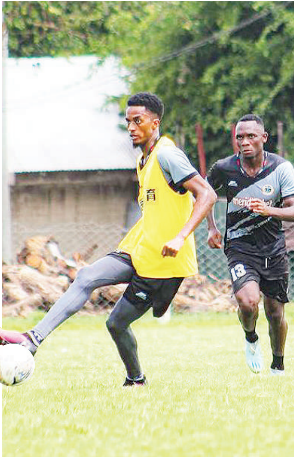
Wachezaji wa KMC FC wakifanya mazoezi kujiandaa na mechi ya Ligi Kuu Tanzania Bara dhidi ya Mashujaa itakayochezwa keshokutwa kwenye Uwanja wa Uhuru, Dar es Salaam.

Alisisitiza pia katika mechi hiyo wanahitaji kupata ushindi na anaamini maandalizi mazuri wanayofanya yatazaa matunda ingawa wanafahamu mchezo huo utakuwa mgumu kwa sababu wapinzani wao wamepoteza mechi iliyotangulia.