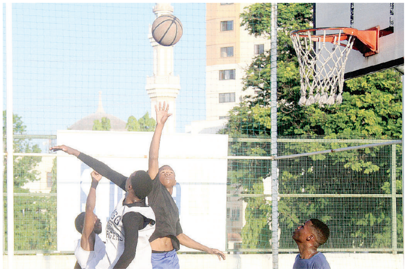
Vijana wakicheza mpira wa Kikapu kama walivyokutwa na mpiga picha kwenye viwanja vya Jakaya Kikwete jijini Dar es Salaam jana.

Kwa ushindi huo wa juzi sasa imepanda mpaka nafasi ya 13 kwenye msimamo iki-kusanya pointi 10 baada ya kucheza mechi 11, Dodoma jiji yenyewe inabaki katika nafasi ya sita ikiwa na pointi 15 baada nayo kucheza michezo 11.