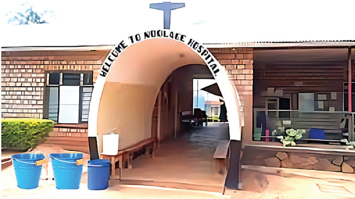
Hospitali ya Ndolage, wilayani Bukoba, Kagera, walikotibiwa wagonjwa wa kwanza wa ukimwi nchini, 1983.