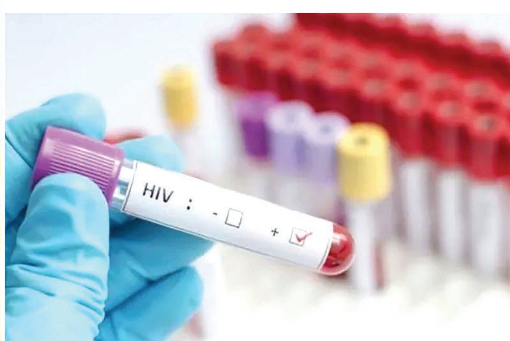
Shughuli ndani ya Maabara ya Majaribio Chanjo ya Ukimwi.