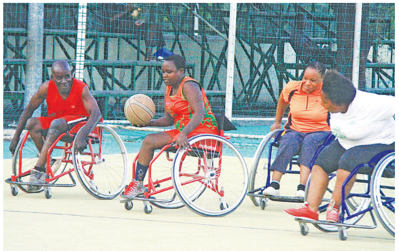
Wachezaji wa timu ya mpira wa kikapu ya wenye ulemavu, wakifanya mazoezi katika Uwanja wa Kituo cha Michezo cha Jakaya Kikwete Jijini Dar es Salaam jana.

miaka 23, kwani ilishuka daraja 2001. Timu ya Fountain Gate yenyewe itafanya tamasha lake kwenye Uwanja wa Tanzania Kwarara, Babati, mkoani Manyara, ambapo pamoja na shughuli zingine za kiburudani, litahitimishwa kwa kucheza dhidi ya Gor Mahia ya Kenya. Singida Big Stars nayo siku hiyo hiyo, itacheza dhidi ya Agle Noir ya Burundi, Uwanja wa Liti, Singida, na matamasha yote hayo yanafanyika ikiwa zimesalia wiki moja tu kabla ya Ligi Kuu Tanzania Bara kuanza.