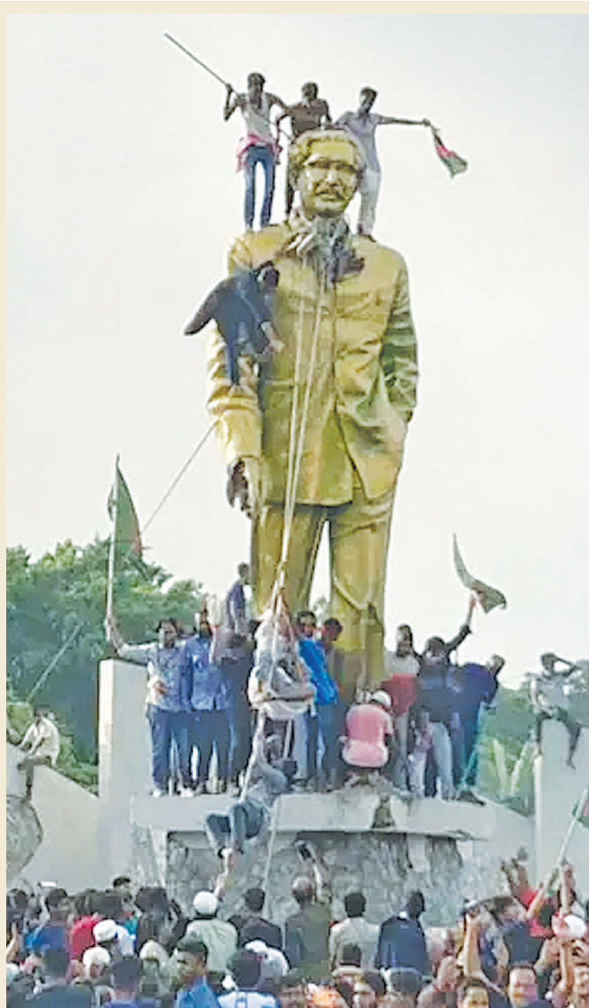
Waandamanaji wakiwa wameizingira nyumba ya Waziri Mkuu wa Bangladesh, Sheikh Hasina, baada ya kujiuzulu na kukimbilia uhamishoni, jana.

Katika huduma yake jeshini iliyodumu miongo mitatu na nusu, pia amefanya kazi kwa karibu na Hasina, akihudumu kama Ofisa Mkuu wa Kitengo cha Jeshi chini ya Ofisi ya Waziri Mkuu. BBC