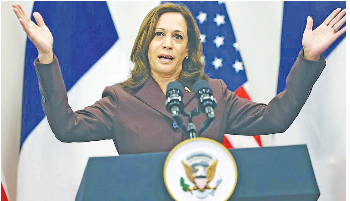
Mgombea urais wa Marekani, Makamu wa Rais, Kamala Harris.

• Ilikuwa Biden ni mzee, mgonjwa tena wa maradhi ya usahaulifu