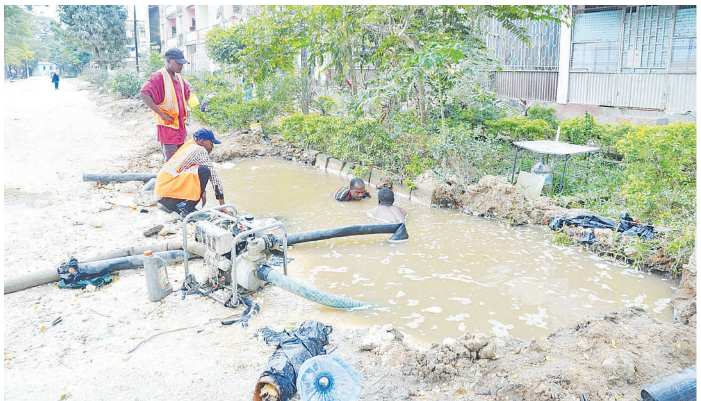
Maifundi wakiziba bomba la majisafi lililopasuka wakati wa ujenzi unaoendelea wa barabara ya Mnazi Mmoja hadi Kikwajuni Baraza la Wawakikishi la zamani, mjini Zanzibar jana.

Lakini alipokea pongezi kutoka kwa wafuasi wa CCM na kupokea maombi ya kwamba ajiunge CCM.