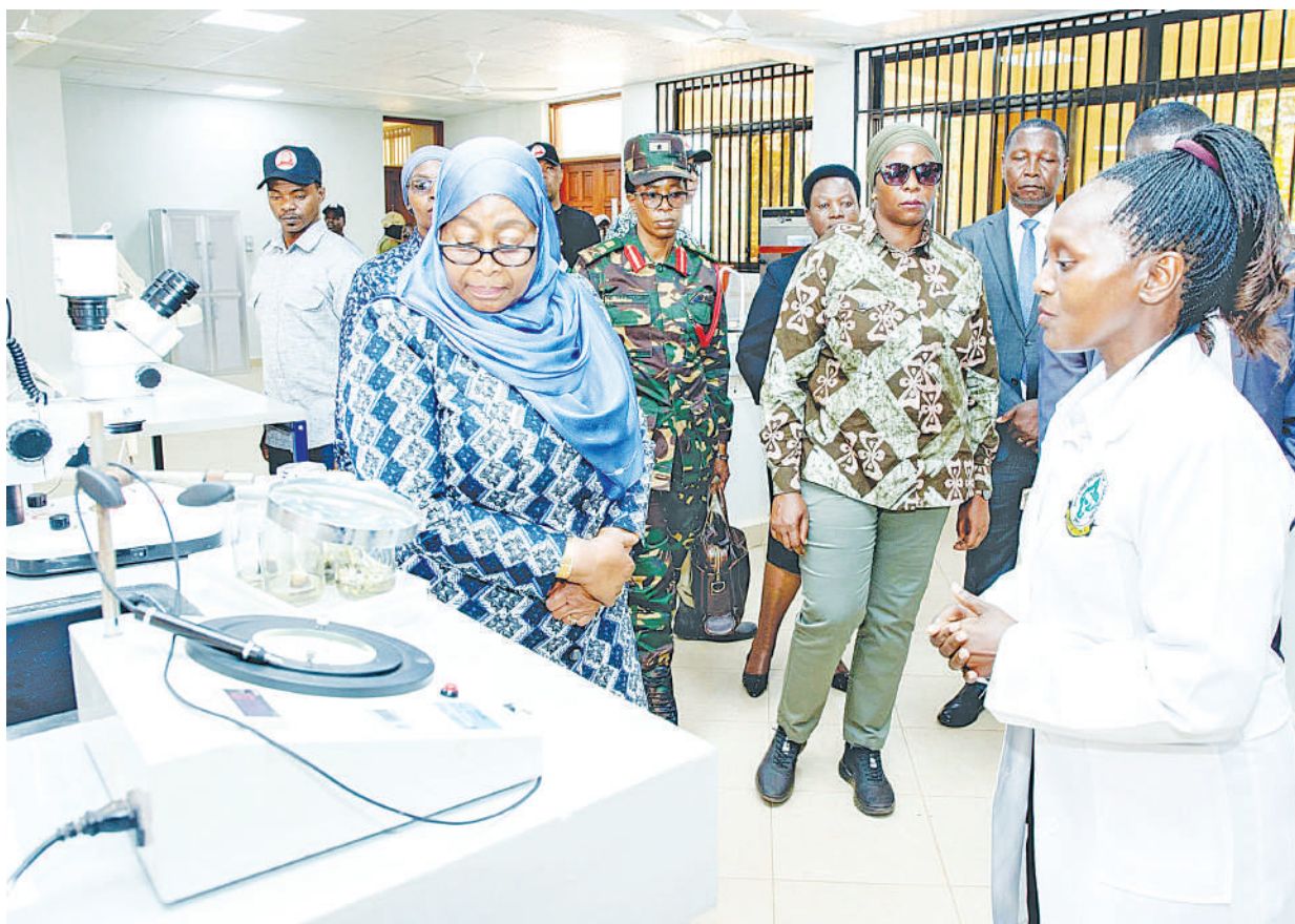
Rais Dk. Samia Suluhu Hassan akikagua moja ya maabara ya afya ya mimea, baada ya kuzindua jengo mtambuka la mafunzo katika Chuo Kikuu cha Sokoine cha Kilimo (SUA), Kampasi ya Edward Moringe, mkoani Morogoro jana.

Tanzania sasa namba 2 uzalishaji wa tumbaku UK. 2