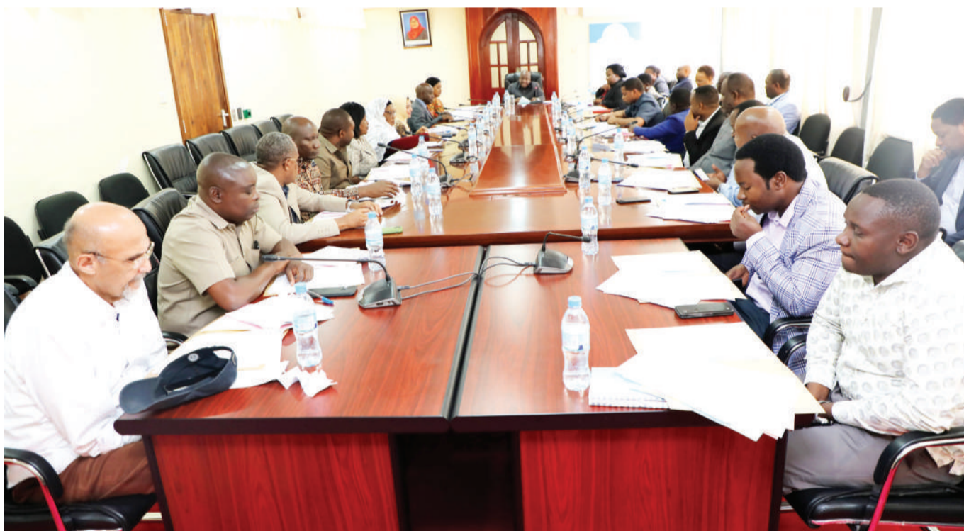
Wajumbe wa Kamati ya Uongozi wakiwa katika kikao kilichoongozwa na Spika wa Bunge, Job Ndugai, kilichofanyika jana, ofisi za Bunge jijini Dodoma.

Kwa mujibu wa taarifa iliyotolewa jana kwa vyombo vya habari na Ubalozzi wa Marekani nchini, mradi huo ujulikanao kwa jina la 'USAID Tuhifadhi Maliasili' unatekelezwa na Research Triangle Institute International, taasisi ya utafiti wa maendeleo ya kimataifa.