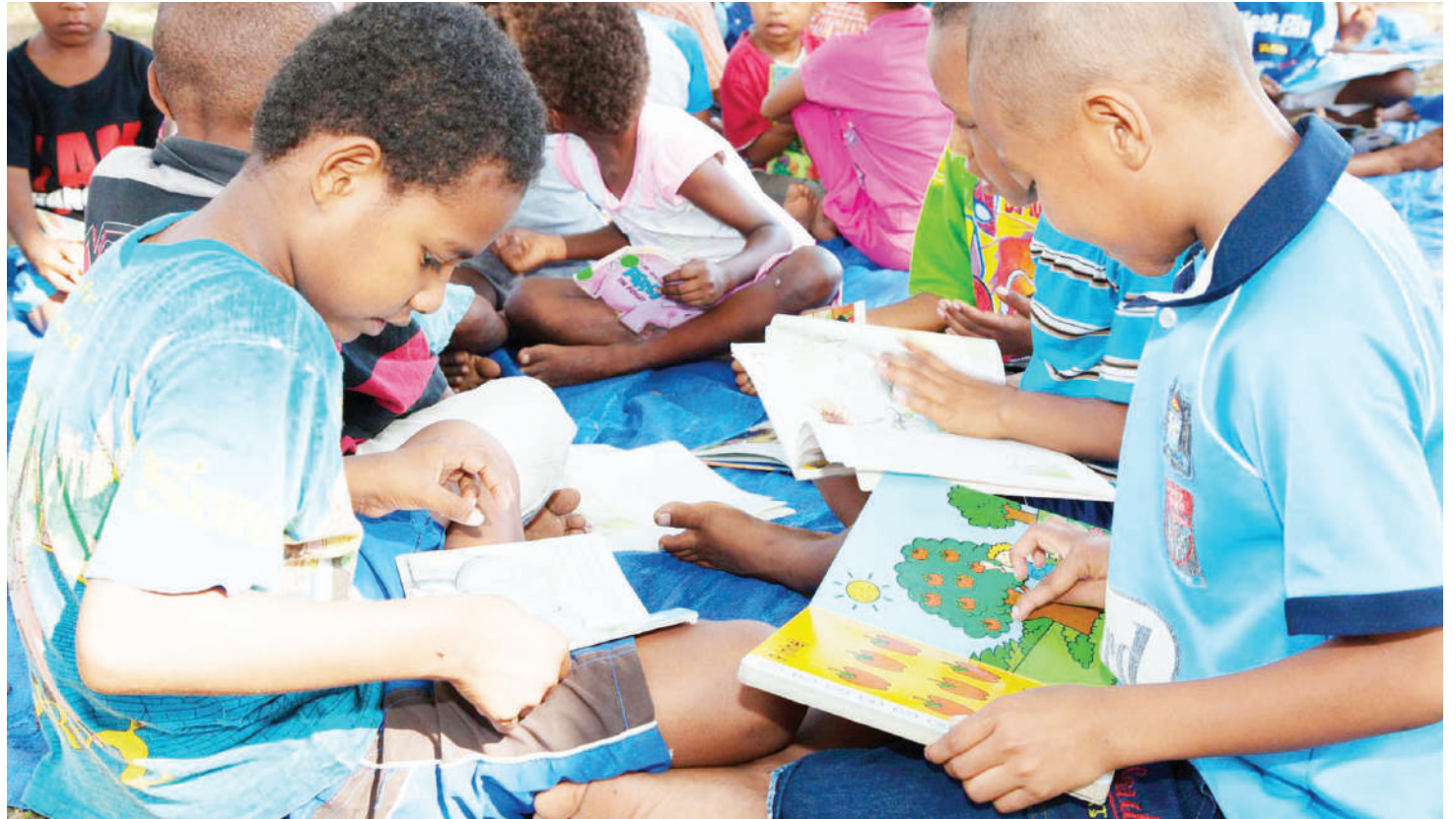
Kusoma vitabu uwe utamaduni kwa watoto wadogo na watu wazima ndiyo mwanzo wa maarifa.

Uwekezaji uliofanywa na serikali katika sekta ya elimu hasa kuwajengea uwezo rasimili watu waliomo katika shule za msingi, sekondari, vyuo vya ualimu, Taasisi ya Elimu Tanzania (TET) na taasisi nyingine za elimu ya juu, umewezesha kuwatumia wataalamu kutoka katika maeneo hayo ya elimu kuandaa vitabu hivyo.