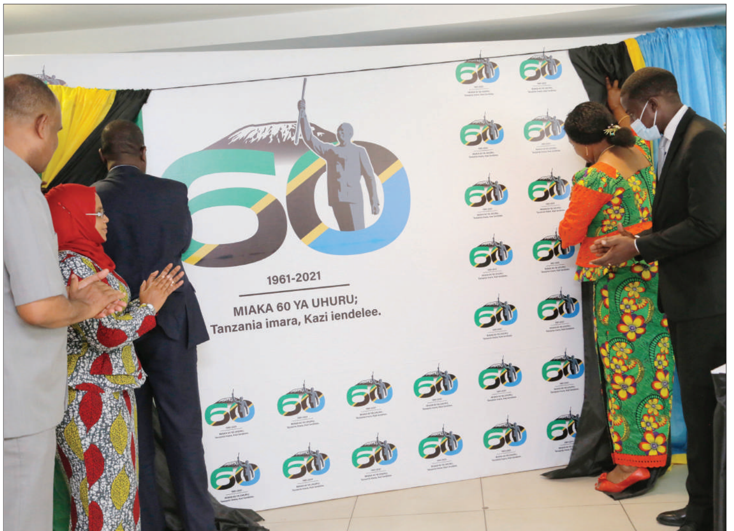
Waziri wa Nchi Ofisi ya Waziri Mkuu Sera, Bunge, Kazi, Ajira na Watu wenye Ulemavu, Jenista Mhagama (wapili kulia), akishirikiana na Waziri wa Nchi Ofisi ya Makamu wa Pili wa Rais, Sera, Uratibu na Baraza la Wawakilishi Zanzibar, Dk. Khalidi Salumu Mohamed (watatu kushoto), kuzindua nemo maalumu ya maadhimisho ya miaka 60 ya Uhuru wa Tanganyika mwaka huu yaliyozinduliwa jana, jijini Dodoma. Kulia ni Waziri wa Utamaduni na Sanaa, Innocent Bashungwa, Waziri wa Habari, Mawasiliano na Teknolojia ya Habari, Dk. Ashatu Kijaji (wapili kushoto).

Kadhalika, katibu huyo alisema kuwa wastaafu hao wamekuwa wakikwamishwa kufikisha kero zao kwa viongozi wa juu kuhusu kupata stahiki zao.