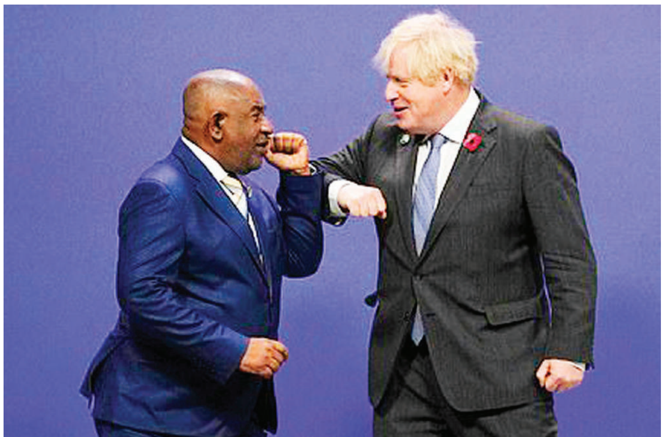
Waziri Mkuu wa Uingereza, Boris Johnson, akimsalimia Rais wa Comoro, Azali Assoumani, alipowasili jijini Glasgow, nchini Scotland kuhudhuriwa mkutano wa mabadiliko ya tabianchi COP26. Mkutano huo unakutanisha viongozi takribani 120 kutoka nchi mbalimbali duniani.

Hatuwezi kurekebisha kosa hili lakini tunaweza kuonyesha ubinadamu wetu.