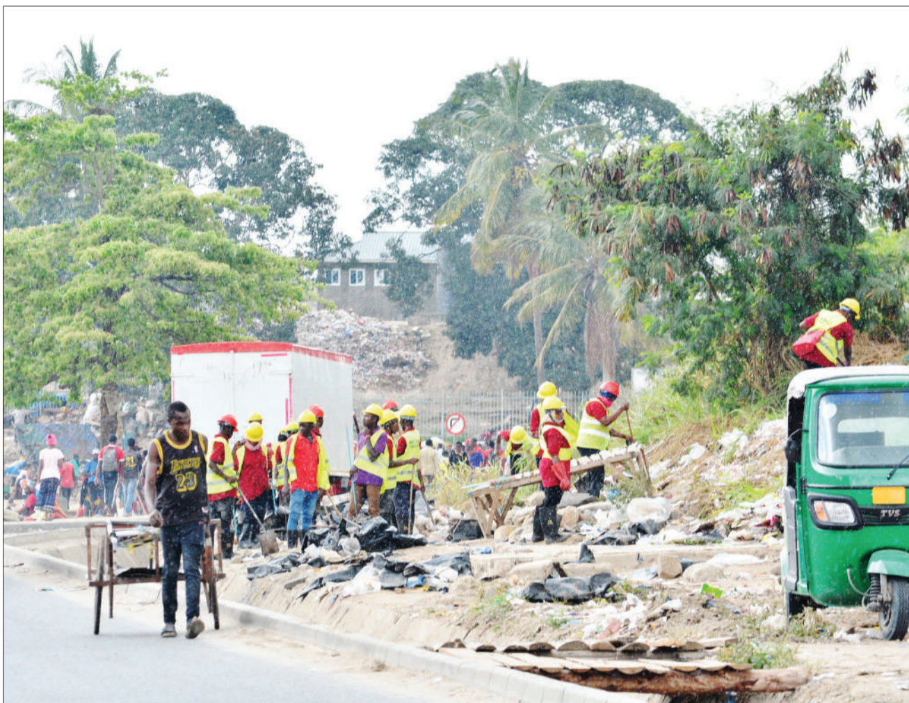
Kampuni ya SUMA JKT wakifanya usafi sehemu za wafanyabiashara waliotoa vibanda vyao katika eneo la Mbezi Mwisho, jijini Dar es Salaam jana.

Nao wadau wa usafirishaji jijini Mbeya wanaohudhuria mafunzo hayo, wameitaka serikali kutilia mkazo upatikanaji wa elimu hiyo, kwa kuandaa mabango na vipeperushi mbalimbali ambavyo vita-waongezea uelewa juu ya sheria hiyo ya udhibiti wa uzito wa magari kwa kuwa kwa kufanya hivyo, wataepukana na makosa wanayoyafanya mara kwa mara kwa sababu ya kukosa uelewa.