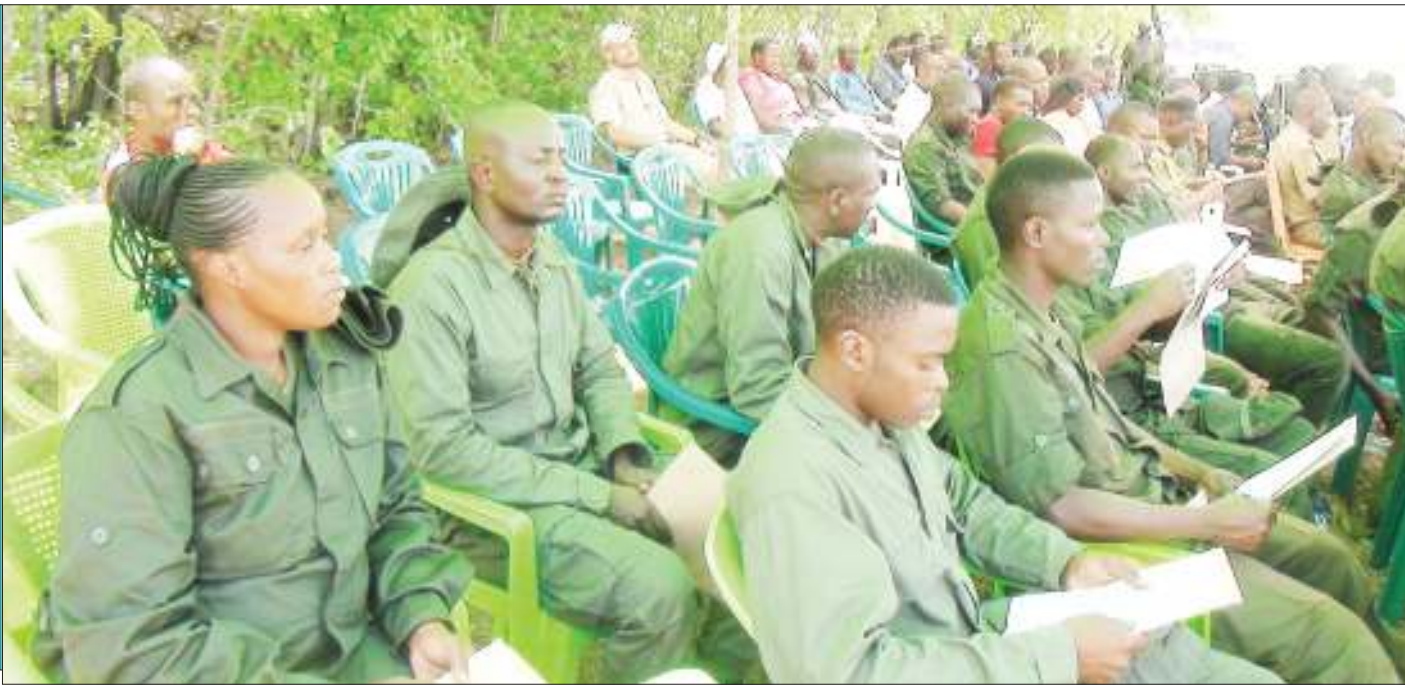
Baadhi ya askari wa kikosi cha mwitikio wa haraka (RRT) waliomaliza mafunzo ya wiki mbili katika Kijiji cha Rungwa, wilayani Manyoni wakimsikiliza mgeni rasmi wakati wa kufunga mafunzo hayo.