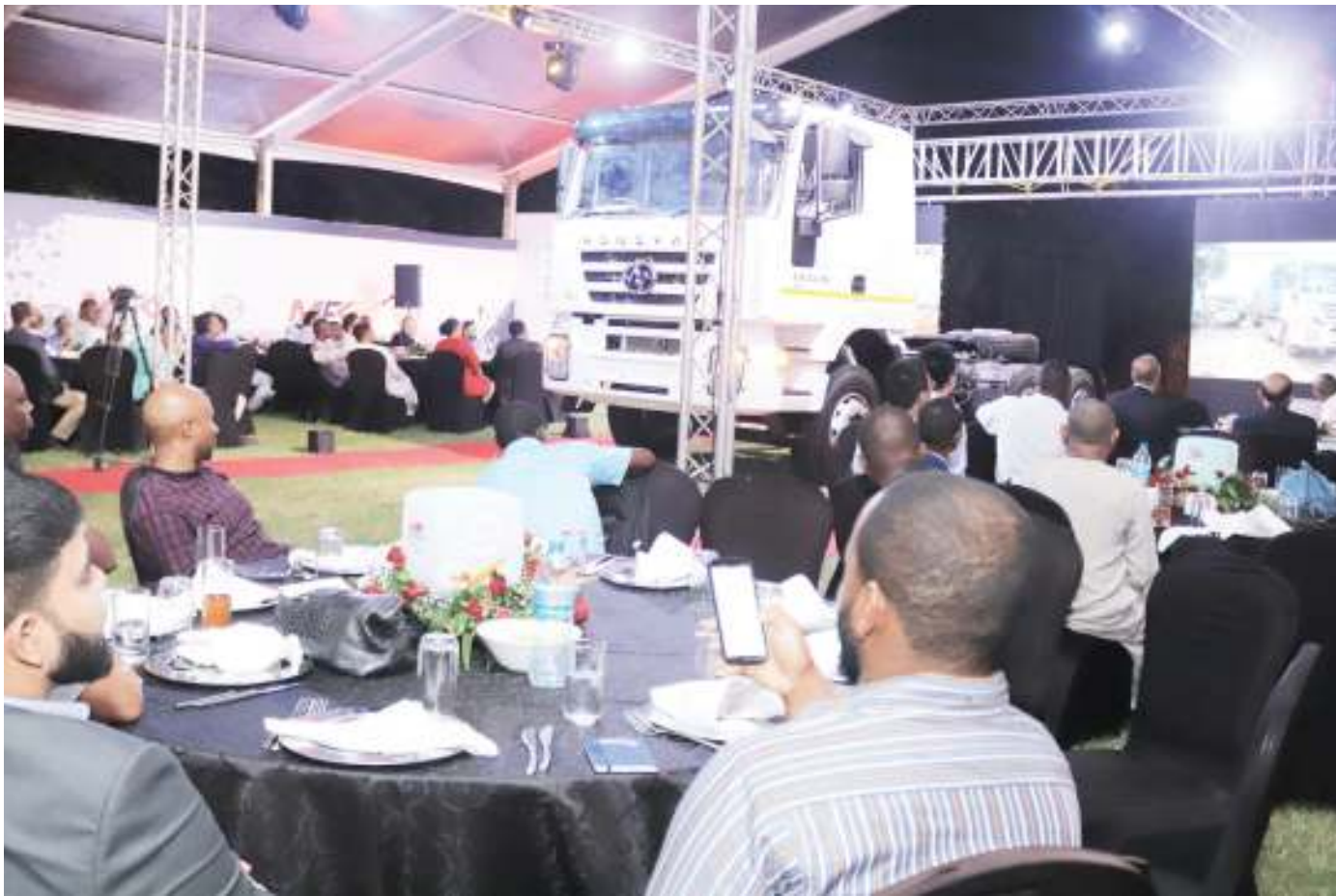
Wafanyabiashara wa sekta ya usafirishaji waliohudhuria hafla ya uzinduzi wa magari ya kisasa ya mizigo aina ya Hongyan wakishuhudia moja kati ya magari hayo. Kampuni ya MFK Automobile Tanzania kwa kushirikiana na Hongyan ya China walizindua magari hayo jijini Dar es Salaam juzi.

Alisema kwa sasa, Bandari ya Bukoba imekuwa ikiendelea kutoa huduma kwa wateja wakubwa wawili ambao ni Kiwanda cha Sukari Kagera kinachotumia usafiri wa meli kupeleka sukari jijini Mwanza pamoja na Kampuni ya Omukwano ya Uganda ambayo husafirisha mafuta na sabuni kuingia nchini.