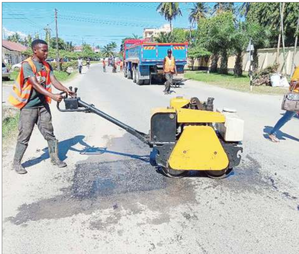
Mafundi wakiendelea na kazi ya kuweka viraka kwenye barabara inayoelekea kwenye Hospitali ya Kairuki Mikocheni jijini Dar es Salaam.