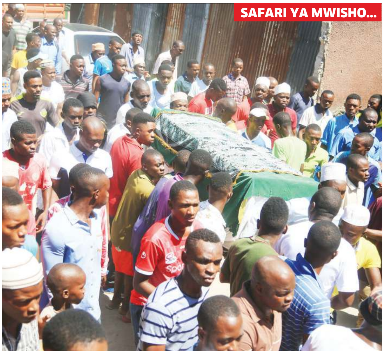
SAFARI YA MWISHO...

Mechi atakazokosa mchezaji huyo ni dhidi ya Tanzania Bara ambayo ilichezwa jana jioni na mchezo wa mwisho wa mashindano haya utakaochezwa kesho dhidi ya Kenya.