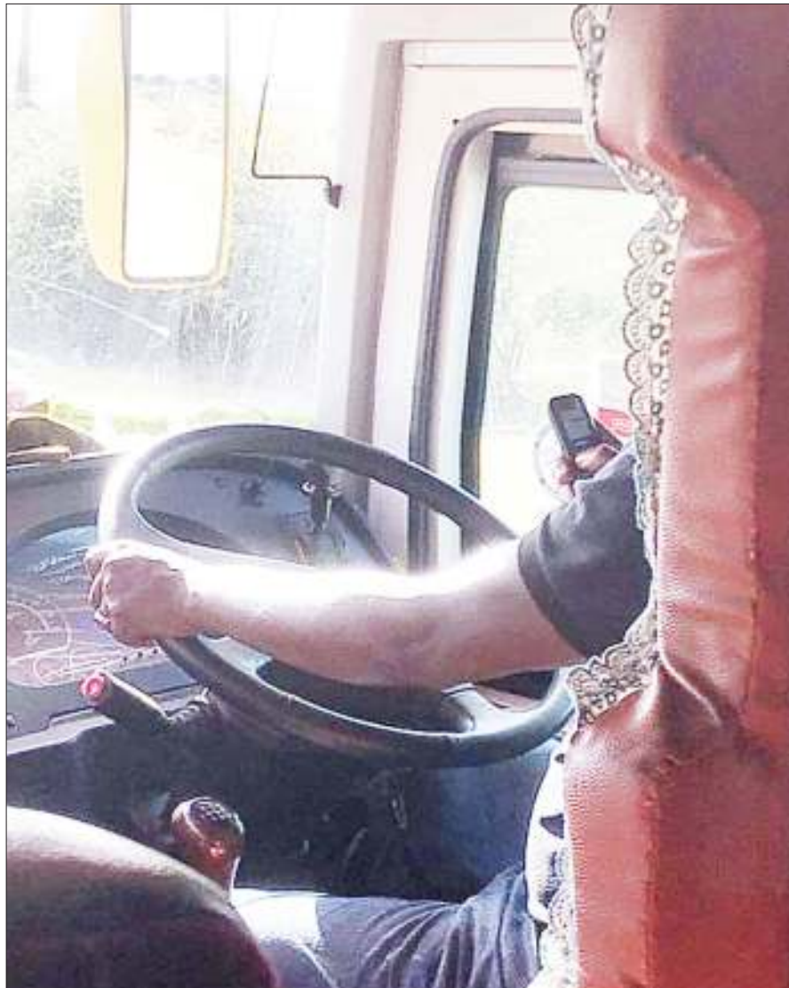
Dereva akiendesha gari huku mawazo yake yakitawaliwa na simu.

Sokoni anatetea hoja yake, kwa simulizi ya ushuhuda kwamba matumizi ya simu kwa madereva huwaondolea umakini na