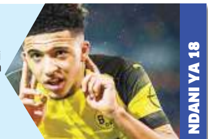
NDANI YA 18

MSHAMBULIAJI wa kimataifa wa England, Jadon Sancho ni miongoni mwa wafungaji wakati Borussia Dortmund ikiibuka na ushindi wa mabao 4-0 dhidi ya Mainz juzi, hivyo kumfanya kucheka na nyavu kwenye mechi sita mfululizo, lakini amekuwa mchezaji wa kwanza katika ligi tano bora Ulaya kufunga na kutoa pasi za mwisho 'assists' 10 kwenye mashindano yote msimu huu.