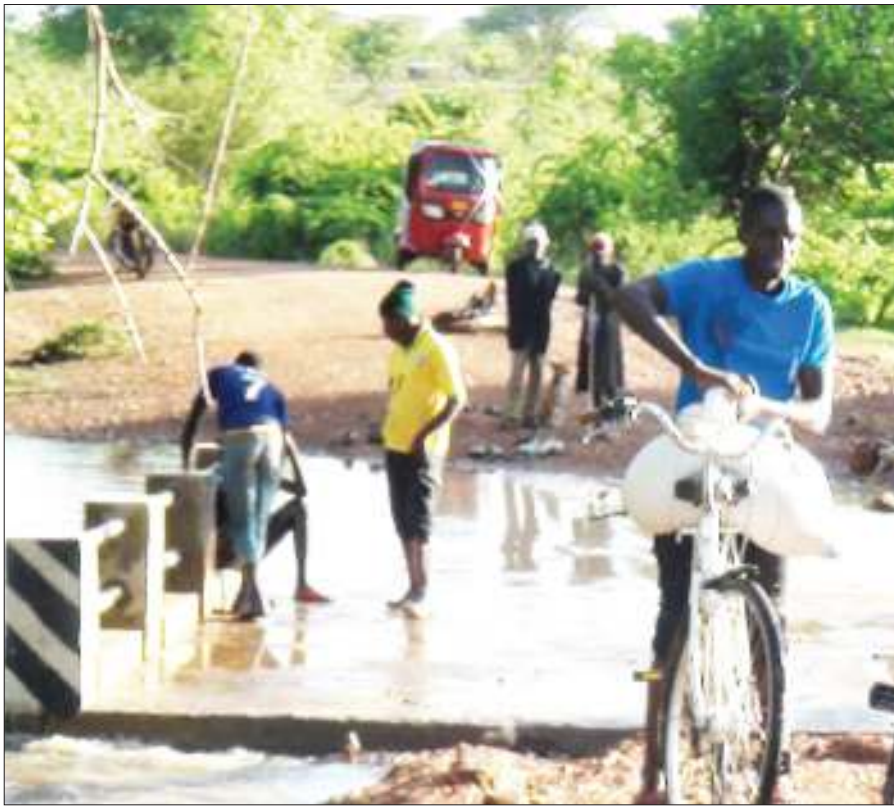
Wananchi wa Kijiji cha Munkawa, Kata ya Rungwa wilayani Manyoni, mkoani Singida wakivuka kwenye daraja la Mto Musa baada ya maji ya mvua kupungua.