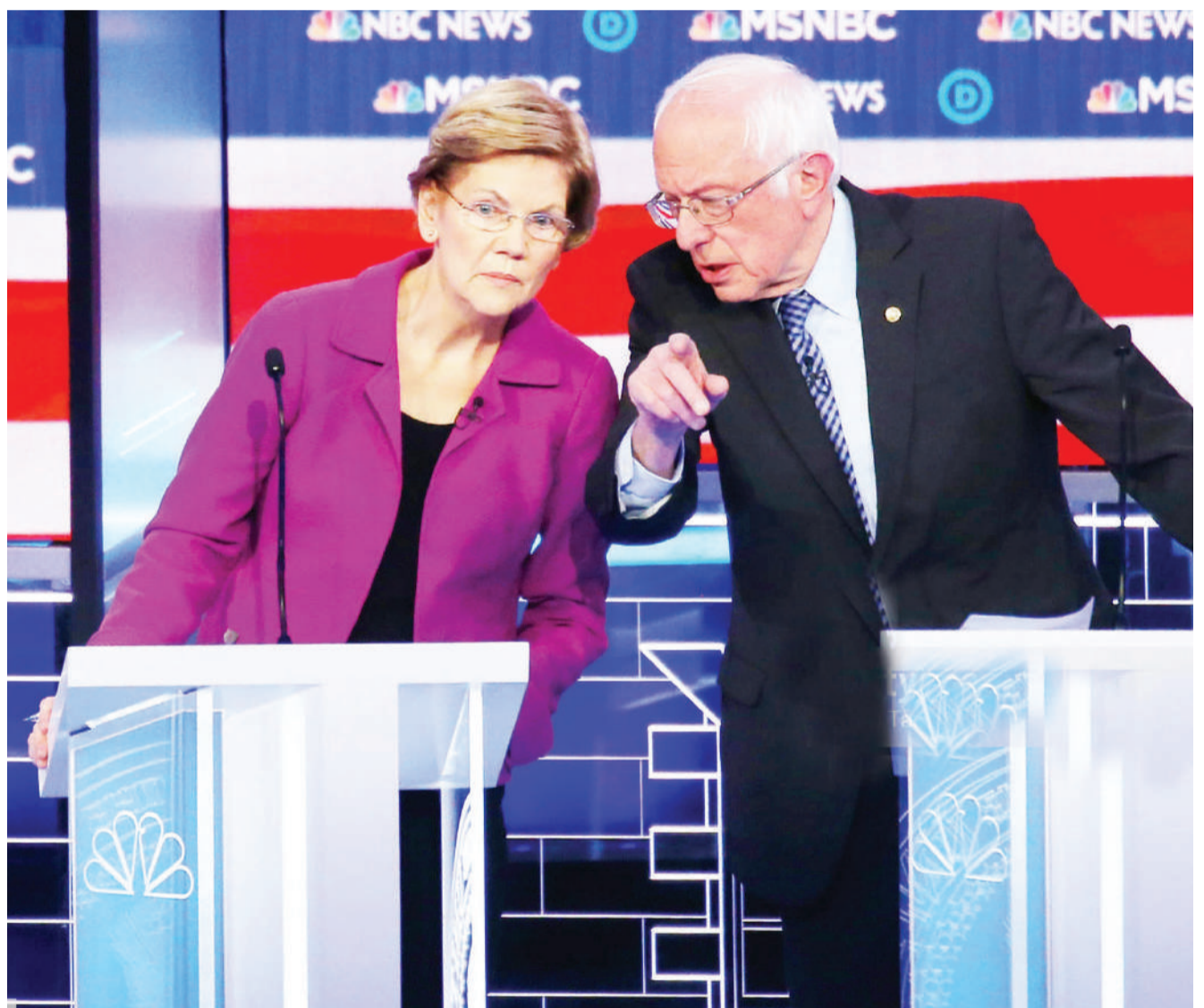
Wanachama wa Democrat wanaowania nafasi ya nafasi ya urais, Seneta Elizabeth Warren na Bernie Sanders (kulia), wakizungumza jambo wakati wa mapumziko baada ya mdahalo katika eneo la Paris, Las Vegas juzi.