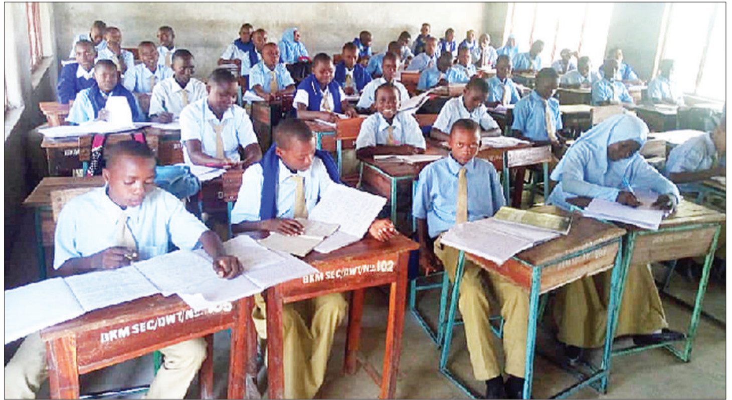
Baadhi ya wanafunzi wa Bukima Sekondari iliopo Musoma Vijijini, wakiendelea na masomo darasani.

■ Wadau 500 kuchambua mbinu kupandisha ufaulu