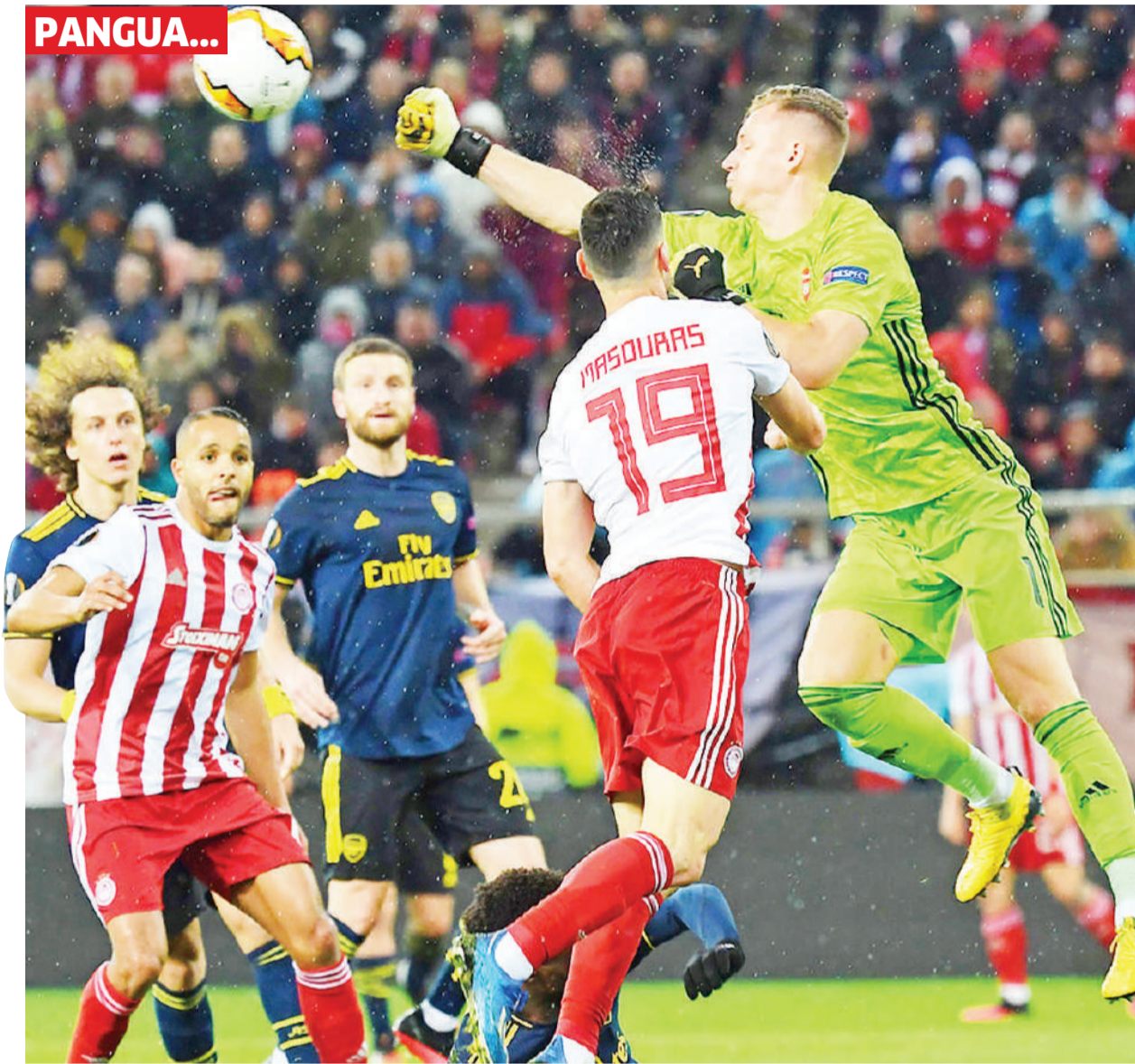
Kipa wa Arsenal, Mjerumani Bernd Leno, akipangua hatari wakati wakishinda kwa bao 1-0 ugenini, kwenye mechi ya mkondo wa kwanza ya Europa League hatua ya 32 dhidi ya Olympiacos juzi. HABARI UK. 28