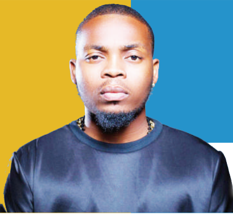
HONGERA OLAMIDE KUPATA DILI SAFI Soma UK.20