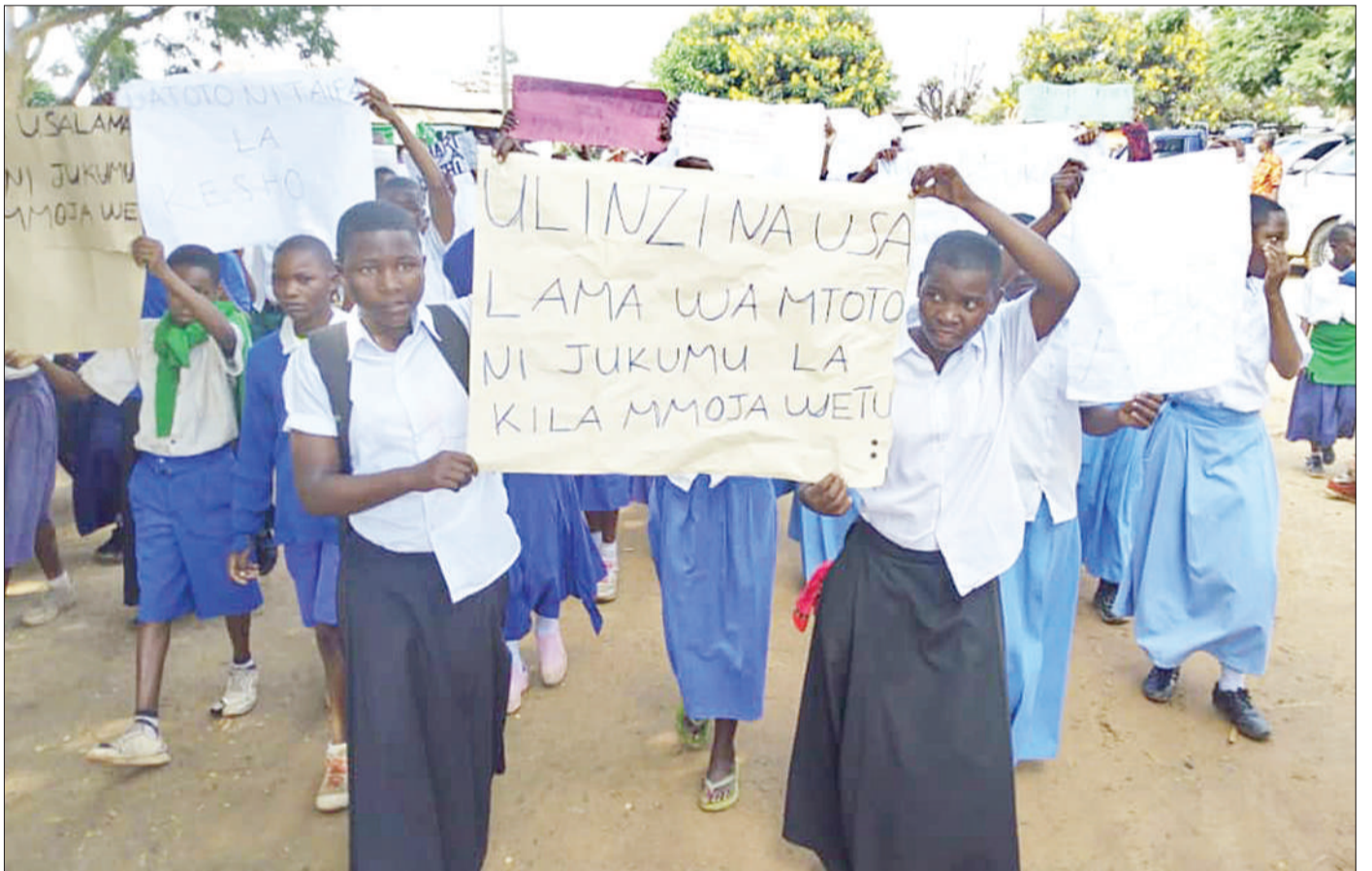
Wanafunzi wa shule mbalimbali za msingi na sekondari wa Mkoa wa Rukwa, wakiwa wamebeba mabango yenye ujumbe mbalimbali za kupinga ukatili wa kijinsia, wakati wa uzinduzi wa Mpango Mkakati wa Kukabiliana na Matukio ya Mimba Shuleni, katika Mji wa Namanye, Halmashauri ya Wilaya ya Nkasi, juzi.

Gondwe aliachiwa kwa dhamana baada ya kutimiza masharti na kesi imepangwa kutajwa Machi 18, mwaka huu.