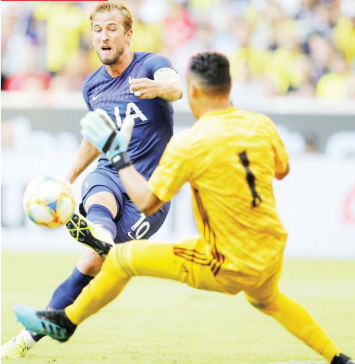
Mshambuliaji wa Tottenham Hotspur, Harry Kane, akizamisha mpira kimyani dhidi ya kipa wa Real Madrid, Keylor Navas, wakati wakiibuka na ushindi wa bao 1-0 juzi kwenye mechi wa nusu fainali ya Kombe la Audi iliyopigwa katika Uwanja wa Allianz Arena, Ujerumani, kwa ushindi huo Spurs sasa itakutana na Bayern Munich fainali kufuatia Wajerumani hao kuichapa Fenerbahce mabao 6-1.