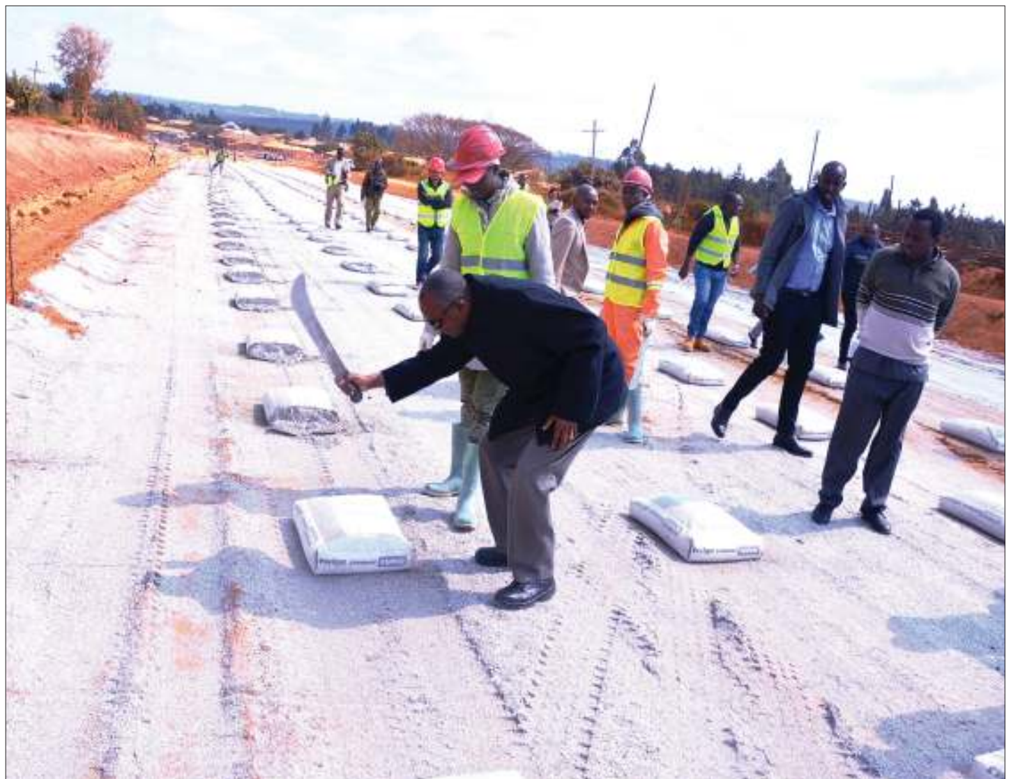
Naibu Waziri wa Ujenzi, Uchukuzi na Mawasiliano (sekta ya ujenzi), Elius Kwandikwa, akikata mfuko wa saruji aliposhiriki kazi ya kusambaza saruji katika ujenzi wa barabara ya Njombe - Moronga yenye urefu wa km 53.9 ambayo ni sehemu ya barabara ya Njombe-Ndulamo-Makete km 107.4 inayojengwa kwa kiwango cha lami, mkoani Njombe juzi.

Aliwataka wananchi kufuata matakwa ya usajili wa vitambulisho vya taifa ambayo yanahitaji mtu kujiandikisha mara moja ili kurahisisha kazi hiyo.