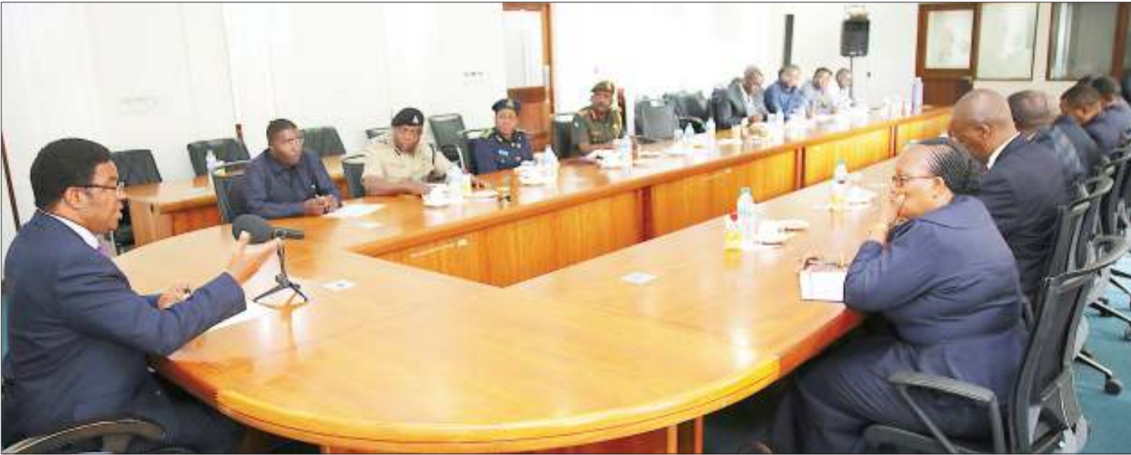
Waziri Mkuu, Kassim Majaliwa akiongoza kikao cha utekelezaji wa haraka wa maagizo ya Rais Dk. John Pombe Magufuli, kuhusu mradi wa kufua umeme wa Mto Rufiji, kilichofanyika, jijini Dar es Salaam jana.