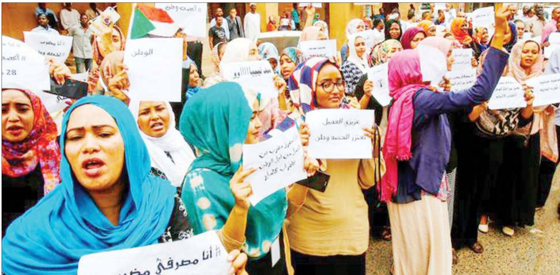
Wananchi wa Sudan wakiwa kwenye maandamano kupinga hatua ya Jeshi la nchi hiyo kuchukua madaraka ya uongozi.

Maandamano ya kuipinga serikali yalianza mwishoni mwa mwaka uliopita ambapo waandamanaji walikuwa wakishinikiza kuhitimisha kwa utawala wa kiongozi wa muda mrefu wa nchi hiyo, Omar al-Bashir. DW