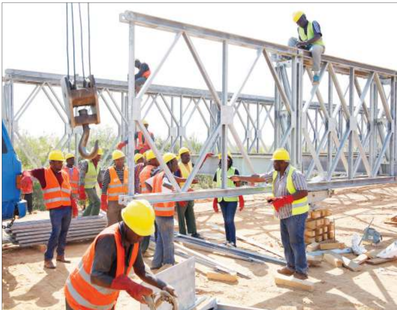
Wahandisi kutoka Wakala wa Barabara za Vijijini na Mijini (Tarura) wakiendelea na ujenzi wa daraja la chuma (Mabey Bridge), lililopo Mto Kihansi, Kata ya Chita Melela katika Halmashauri ya Wilaya ya Kilombero, mkoani Morogoro jana.