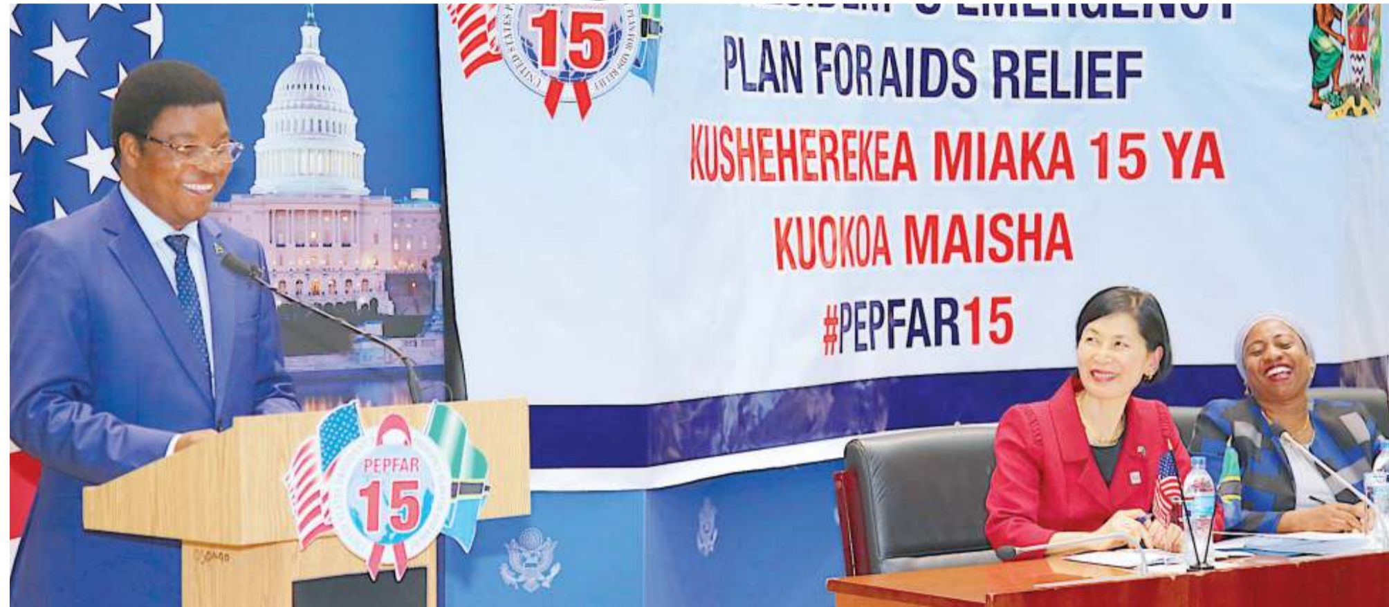
Waziri Mkuu Kassim Majaliwa, akizungumza kwenye Maadhimisho ya Miaka 15 tangu Kuanzishwa Mfuko wa Dharura wa Rais wa Marekani wa Kupambana na Kudhibiti Maambukizi ya Virusi vya Ukimwi (PEPFAR), kwenye Kituo cha Mikutano cha Kimataifa cha Julius Nyerere jijini Dar es Salaam, Mei 3 mwaka jana.