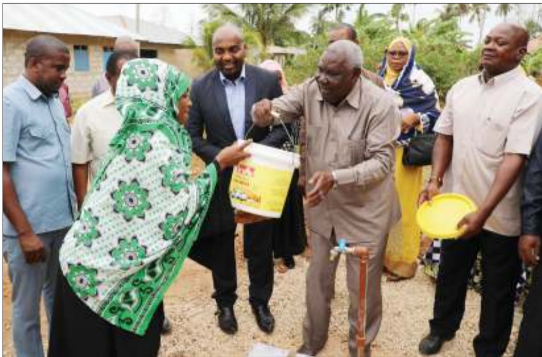
Makamu wa Pili wa Rais wa Serikali ya Mapinduzi Zanzibar, Balozi Seif Ali Idd, akimwisha ndoo ya maji mwananchi wa Mahonda baada ya uzinduzi wa mradi wa maji kwenye eneo la nyumba za polisi, zilizoko katika Jimbo la Mahonda, Mkoa wa Kaskazini Unguja jana. Katikati ni Naibu Waziri wa Mambo ya Ndani, Mhandisi Hamad Msauni.