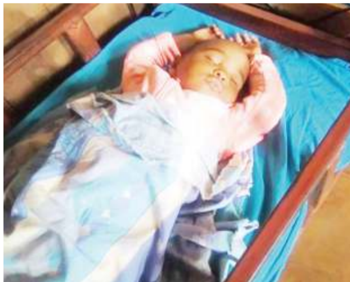
Mtoto wa kituo cha malezi, amelala mchana baada ya kupewa chakula.

Ukimzoesha mtoto wako ni wa kiume wewe unampa midori au kioo ajiangalie atafikiri maisha yake yote vitu hivyo vinafaa kutumiwa naye.