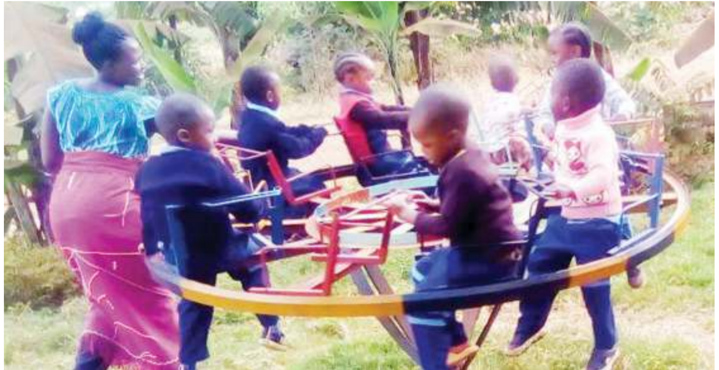
Watoto wa kituo cha kulelea watoto cha Yeyo Care Centre, mjini Babati, wakicheza na mwalimu wao.