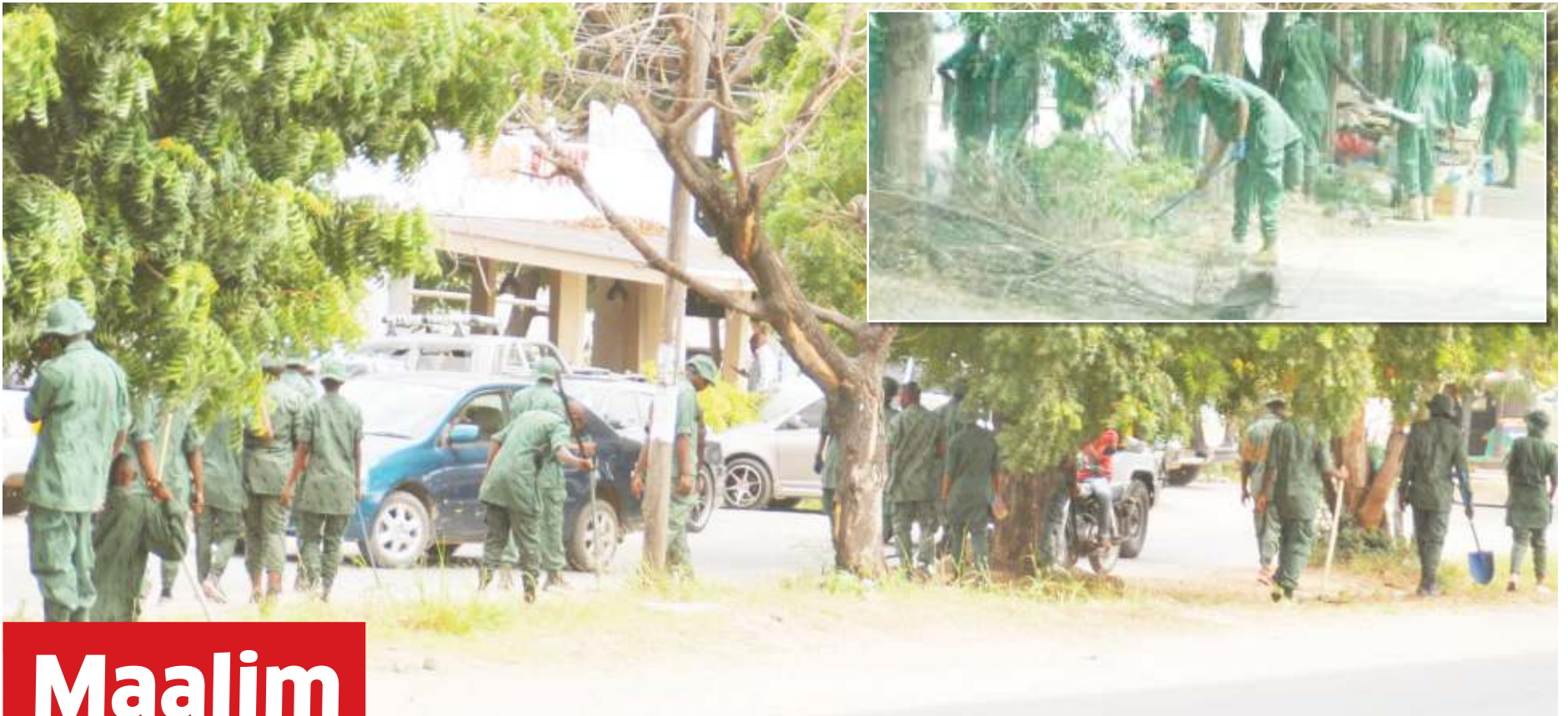
Vijana wa Jeshi la Kujenga Taifa, wakifanya usafi wa mazingira katika maeneo mbalimbali ya Jiji la Dar es Salaam jana, kuelekea Mkutano wa SADC unaotarajiwa kufanyika mapema mwezi huu.

• Daktari bingwa ataja sababu, mapenzi ni chanzo kikuu... Endelea uk. 2