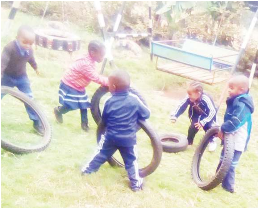
Watoto katika kituo cha malezi yao wakicheza.