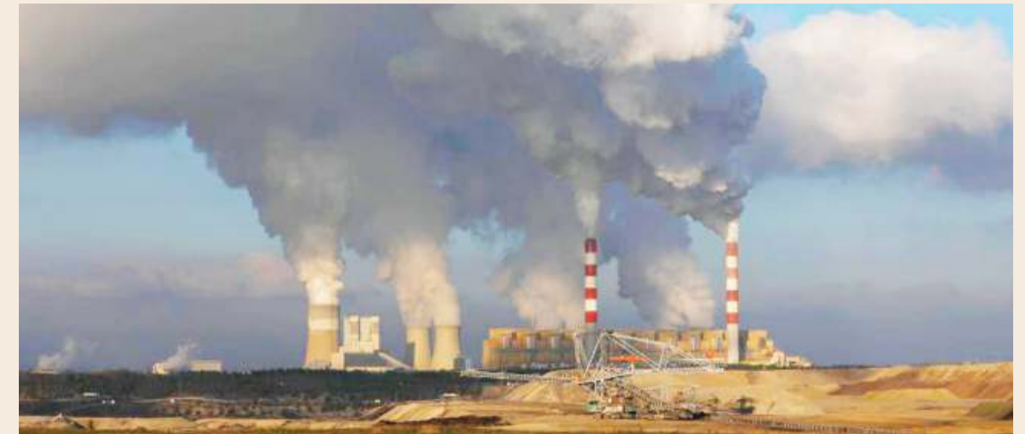
Hali halisi ya uharibifu wa mazingira.

HIVI sasa duniani kuna malalamiko makubwa kuhusiana na kasi kubwa ya ongezeko la joto duniani, huku katika sura ya pili kukiwapa hatua kubwa inayoendelea kuchukuliwa na mazingira, kudhibiti hali hiyo.