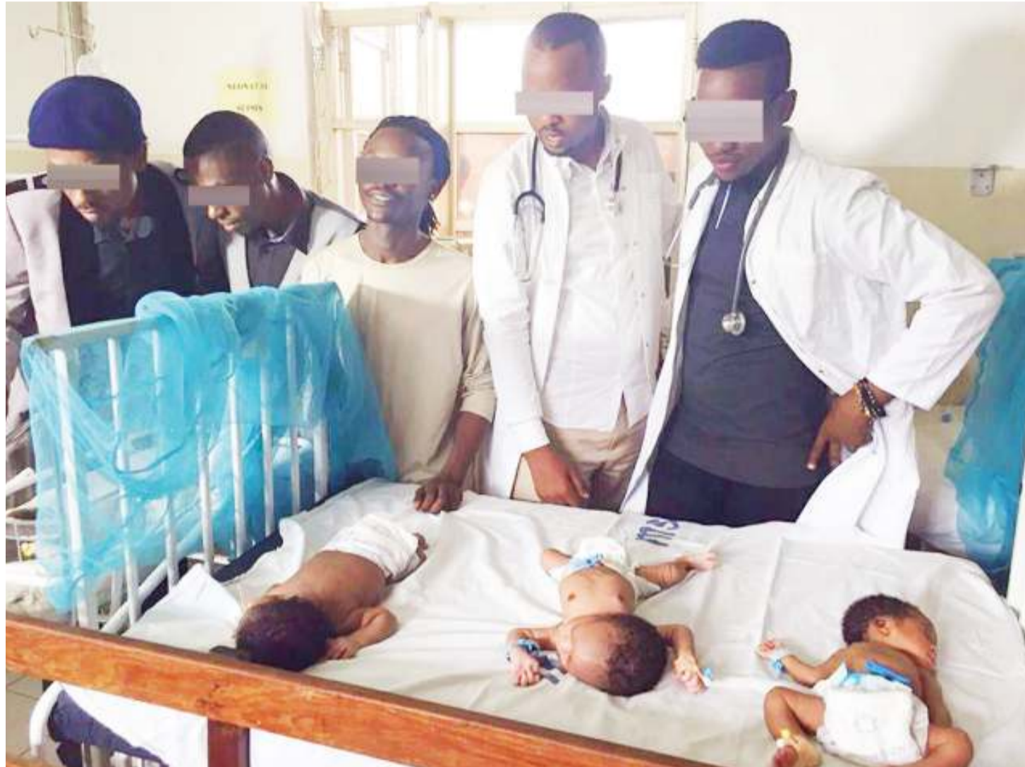
Madaktari wakiwahudumia watoto njiti wodini.

• Wa kiume waongoza kwa idadi • 'Mabonge' nao wakae chonjo