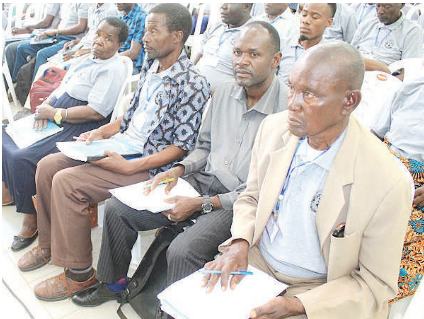
Wajumbe wa Mkutano Mkuu wa Chama Kikuu cha Ushirika mkoani Shinyanga (SHIRECU), wakiwa kwenye mkutano kujadili mambo mbalimbali kwa ajili ya kuimarisha ushirika huo ikiwamo kufufua viwanda vya kuchakata mazao (Ginery) ili kumkomboa mkulima kiuchumi kwa kununua mazao yake kwa bei rafiki.

Alisema: "Nawasihia abiria kutoshabikia vitendo vya ukiukwaji wa sheria hususani mwendokasi, mna-takiwa kukemea na kutoa taarifa kwa Jeshi la Polisi wakati mnapoona viashirika vya usababishaji wa ajali unaofanywa na madereva."