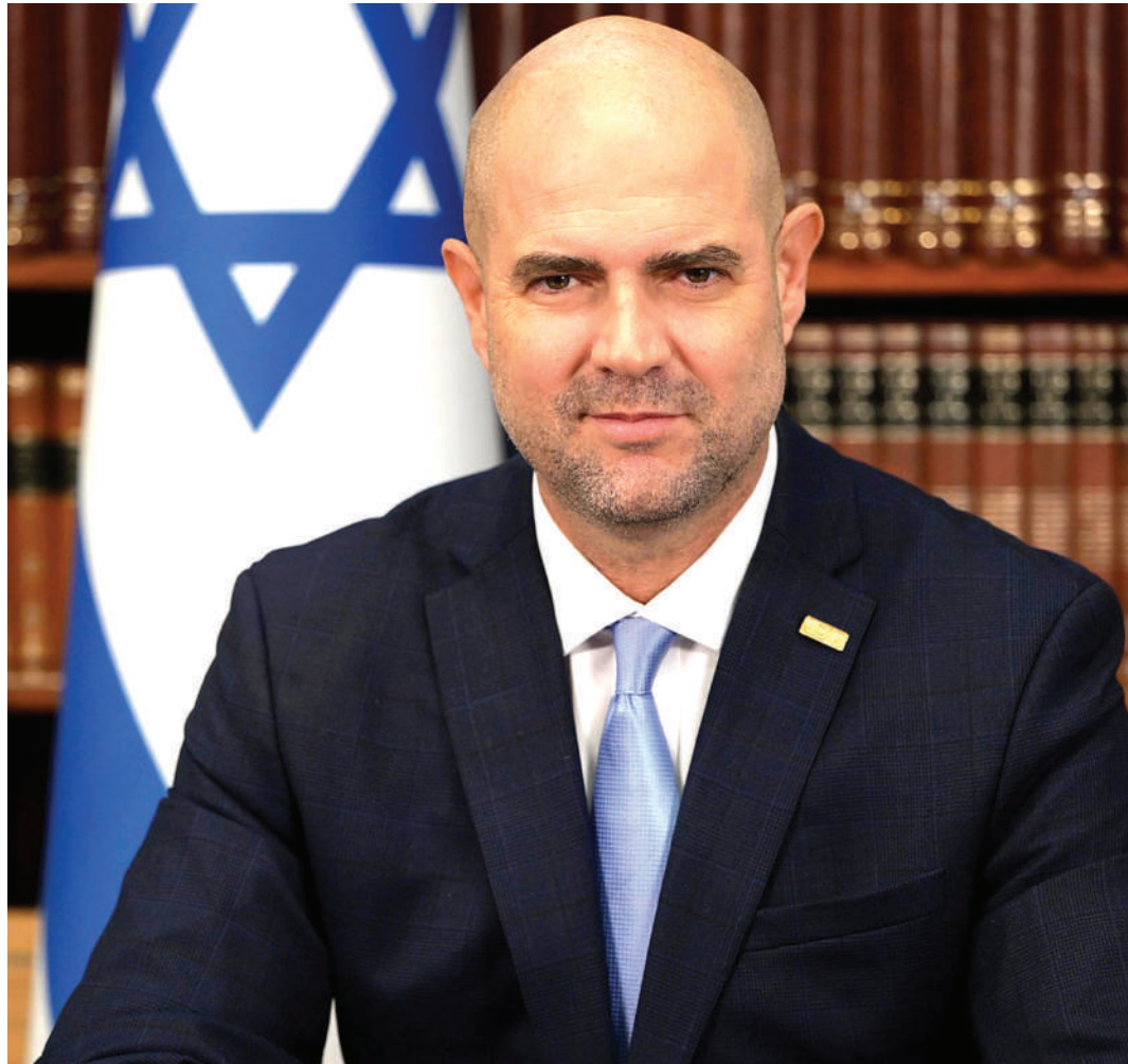
Amir Ohana, Spika wa Bunge la Israel -Knesset, anayetetea ndoa za jinsia moja.

Kwa miongo miwili iliyopita suala hili limekuwa likipigwa gitaa kwa sauti kubwa ili wahusika kujinafasi