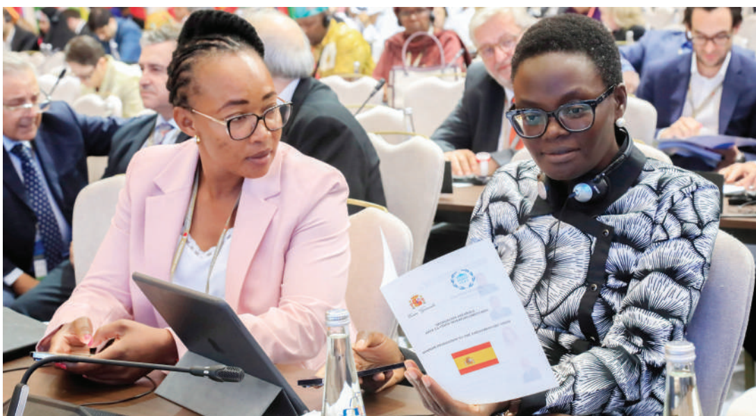
Spika wa Bunge ambaye ni Mwenyekiti wa Kundi la Afrika kwenye Umoja wa Mabunge Duniani, Dk. Tulia Ackson, akiteta jambo na Ester Matiko Mbunge wa Tanzania anayewakilisha umoja huo katika Mkutano wa 146 unaoendelea Manama nchini Bahrain.