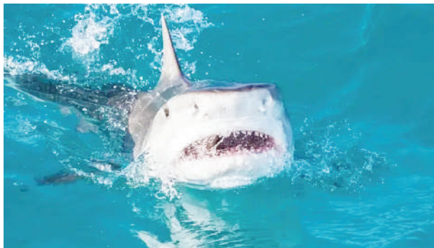
Simba wa Bahari