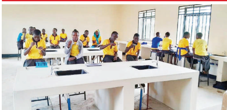
Baadhi ya wanafunzi wa Shule ya Sekondari ya Etaro, wilayani Msumama mkoani Mara, wakijifunza kwa vitendo katika maabara ya shule hiyo, mwishoni mwa wiki, baada ya kupata vifaa vya maabara hivi karibuni.

"Mbali na maeneo hayo, kuna eneo la watumishi wa umma, hawa wanalipa kodi, wanatakiwa wapate mishahara mikubwa, wakilipwa vizuri ndio makusanyo ya kodi yanakuwa makubwa na wao wanakwenda kutumia fedha zao kuwekeza na kufanya biashara, kodi inaongezeka na mzunguko wa fedha unakuwa, angalieni maslahi ya watumishi wa umma na sekta binafsi ndipo uchumi wetu utakua," alisema.