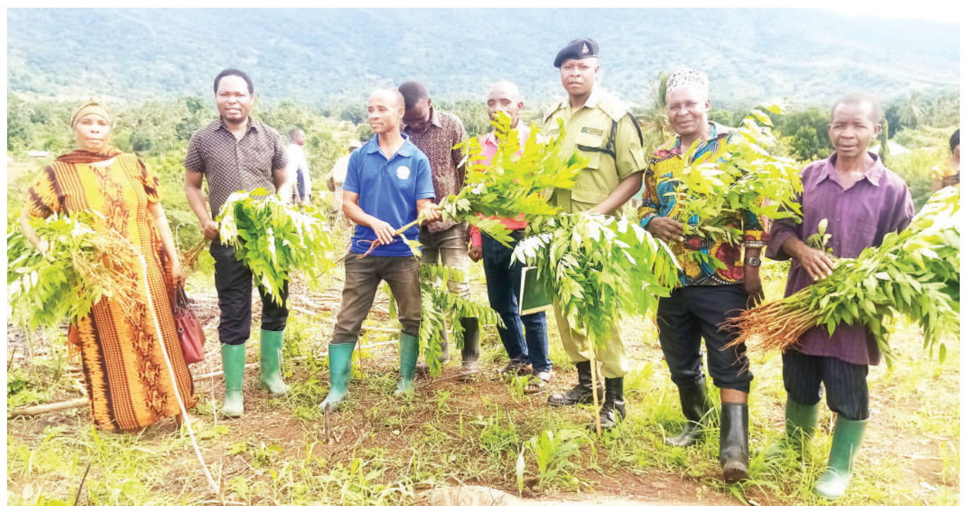
Baadhi ya wakazi wa wilaya ya Muheza, mkoani Tanga, wakiwa wameshika miche ya miti wakijiandaa kupanda katika viwanja vya Shule ya Sekondari ya kata ya Potwe, jana, wakati wa uzinduzi wa upandaji miti kiwilaya.

Alisema: “Kuanzia sasa wafanyabiashara wa mifugo, hakikisheni mnapotaka kusafirisha mifugo yenu kwenda nje ya nchi, mnatimiza taratibu zote ikiwemo vibali, ili kuepuka usumbufu ikiwa ni pamoja na kukamatwa”.