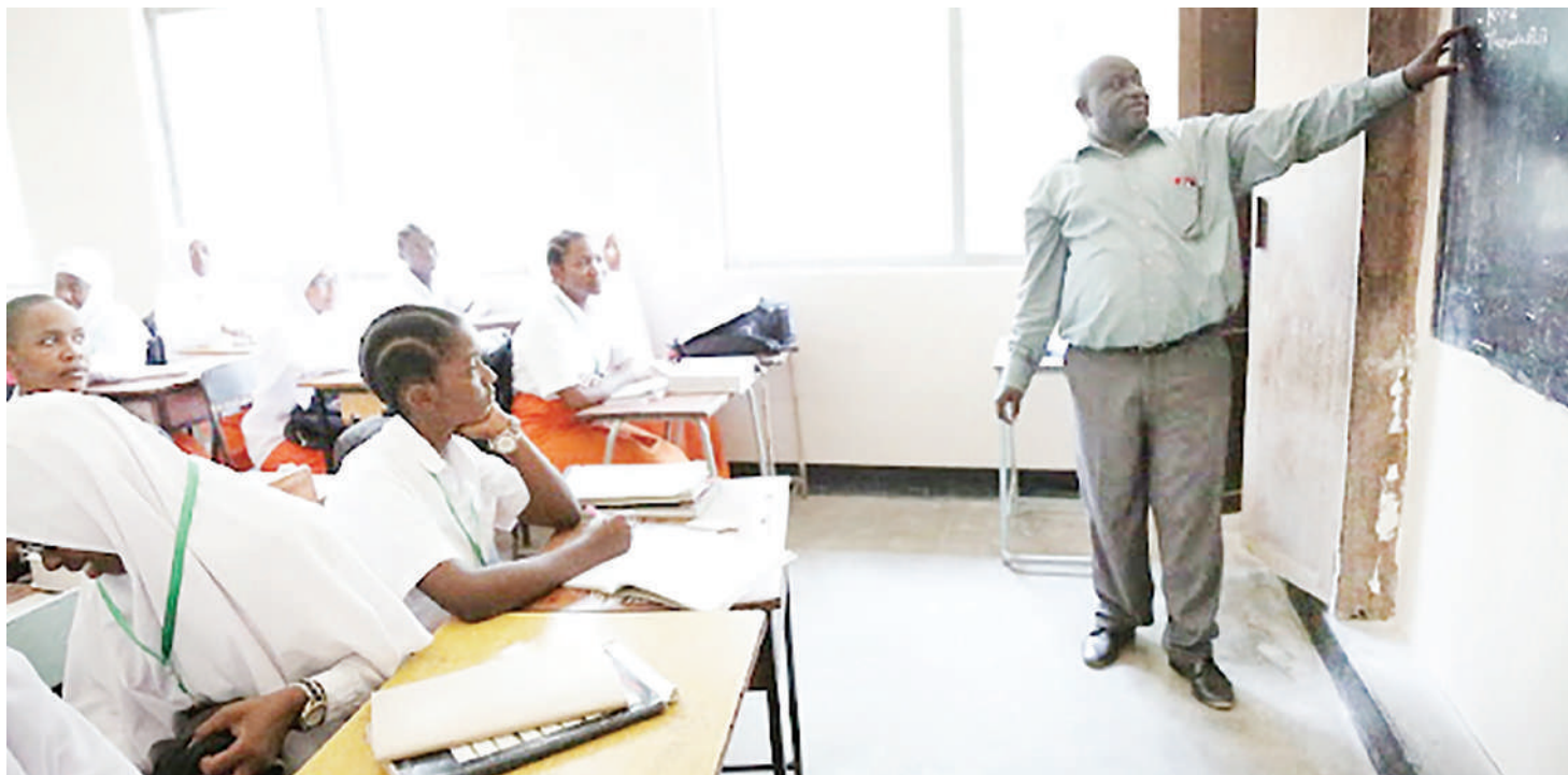
Mwalimu akiendelea na jukumu lake darasani.

Ndipo mbia mwalimu anajiweka sawa na kuanza 'kushusha nondo' alizoandaa huku mara zote akiongozwa na tathmini akihoji kama wako pamoja na ndio chimbuko la maswali 'are we together?'