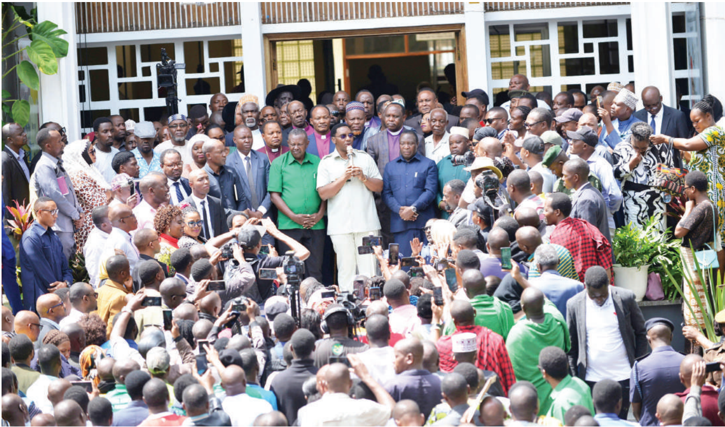
Mkuu wa Mkoa wa Arusha, Paul Makonda (katikati), akizungumza na umati wa wakazi wa Jiji la Arusha, waliofika kumpokea nje ya ofisi za mkuu wa mkoa huo, jana.

• Magari 100 yampokea, akijivunia alikotoka ameacha rekodi... Uk. 2