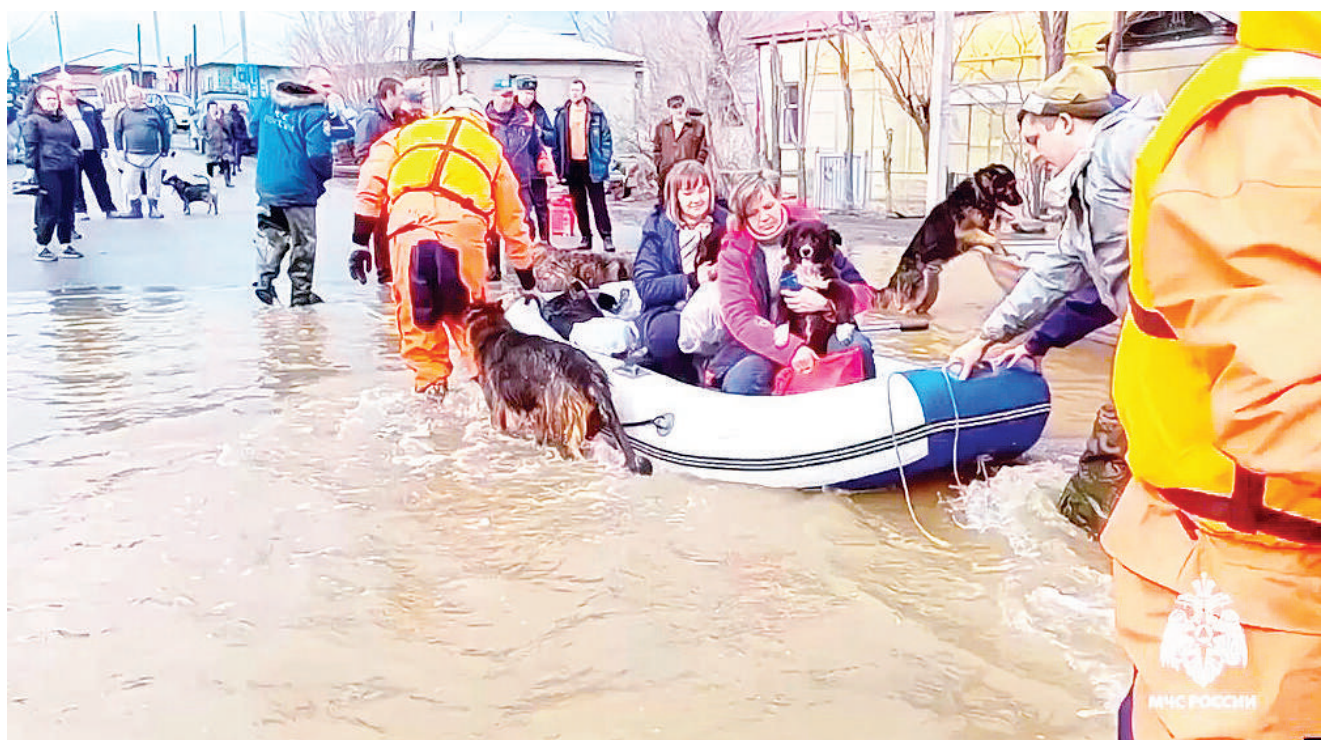
Maofisa wa uokoaji nchini Russia wakiwawusha wananchi kwenye maji baada ya kutokea kwa mafuriko katika miji miwili ya milima ya Ural, na kusababisha takribani nyumba 6,000 kuzingirwa na maji na kuwalazimu maelfu ya watu kukimbia makazi yao, juzi.

Vile vile, walisema wamewaita wale wote wanaohusika na upatikanaji na usambazaji wa mbolea hiyo feki. Na kwamba timu hiyo imepanga kulifikisha suala hilo katika ngazi yoyote kabla ya kupeleka faili lao kwa Mkurugenzi wa Mashtaka na mapendekezo mbalimbali. BBC