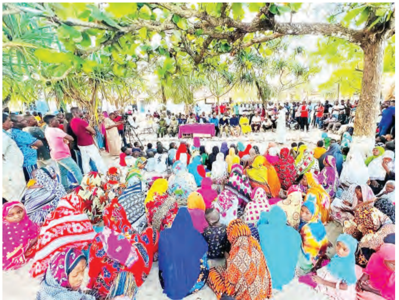
Baadhi ya wazee wakifuatilia hotuba katika maadhimisho ya Siku ya Wazee Duniani katika ukumbi wa mikutano wa Chuo Kikuu cha Zanzibar (SUZA), jana.

Ofisa Kilimo wa Mkoa huo, Juma Khamis Kona, aliwataka masheha wa shehia kusimamia suala la vibali vya usafirishaji wa mazao ili kuhakikisha mazao yanayosafirishwa yamekomaa na yanastahili kuvunwa.