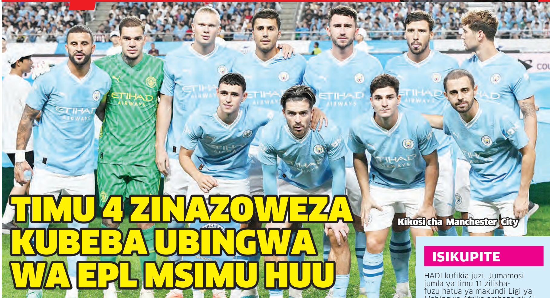
Kikosi cha Manchester City

FARASI WA3 WAKUCHUNGWA LIGI YA MABINGWA ULAYA MSIMU HUU UK. 12-13