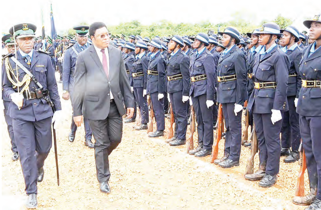
Waziri Mkuu, Kassim Majaliwa, akikagua gwaride la wahitimu wa Jeshi la Uhamiaji katika Chuo cha Uhamiaji cha Raphael Kubaga kilichopo wilayani Mkinga mkoani Tanga juzi, alikuwa mgeni rasmi na kufunga mafunzo hayo ya awali namba 1, 2023.