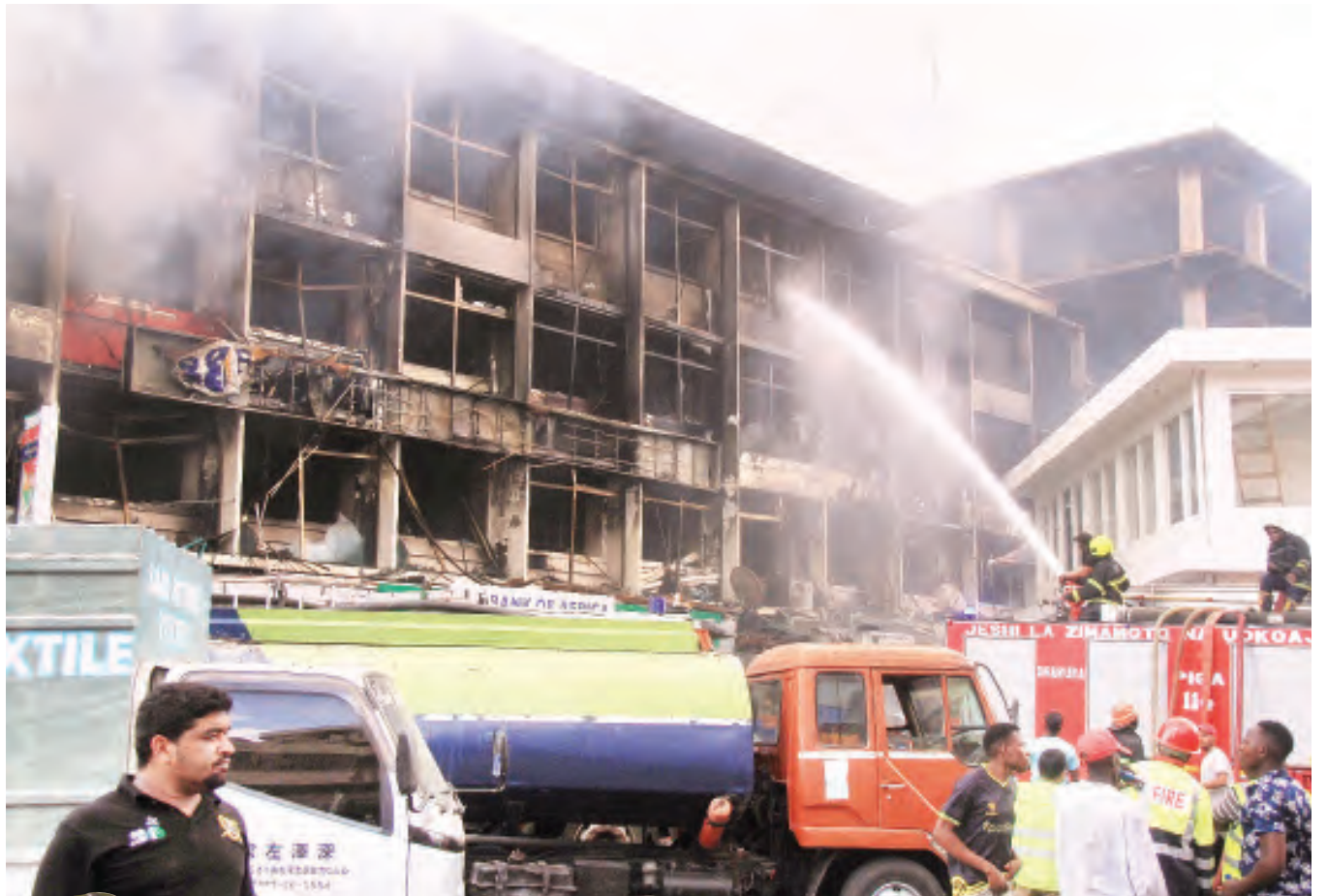
Askari wa Jeshi la Zimamoto na Uokoaji wakizima moto uliokuwa unateketeza majengo ya biashara katika eneo la Kariakoo jijini Dar es Salaam jana.

CHADEMA yaona dosari mitaala mipya ya elimu UKURASA 3