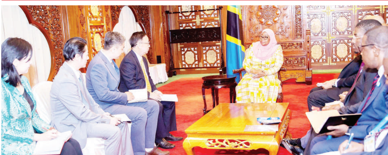
Rais Dk. Samia Suluhu Hassan akizungumza na wawekezaji na viongozi wa kampuni mbalimbali za China, jijini Beijing jana. Rais yuko nchini China kwa ziara ya kikazi ambapo alishiriki katika Mkutano wa Jukwaa la Ushirikiano kati ya China na Afrika (FOCAC).