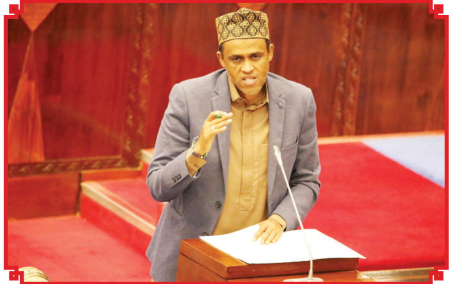
Waziri wa Kilimo, Hussein Bashe akijibu maswali yaliyoulizwa na baadhi ya Wabunge kwenye kikao cha tisa cha mkutano wa 16 wa Bunge, jijini Dodoma jana.