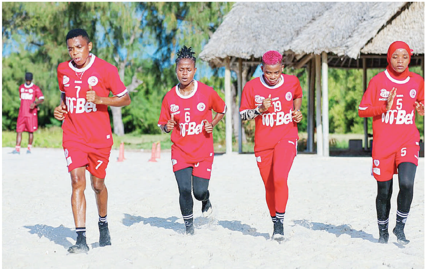
Wachezaji wa Simba Queens wakifanya mazoezi ya ufukweni kwa ajili ya kujiandaa na mashindano ya Ngao ya Jamii kwa Wanawake yanayotarajiwa kufanyika kuanzia Septemba 24 hadi 27, mwaka huu kwenye Uwanja wa KMC Complex, Dar es Salaam.