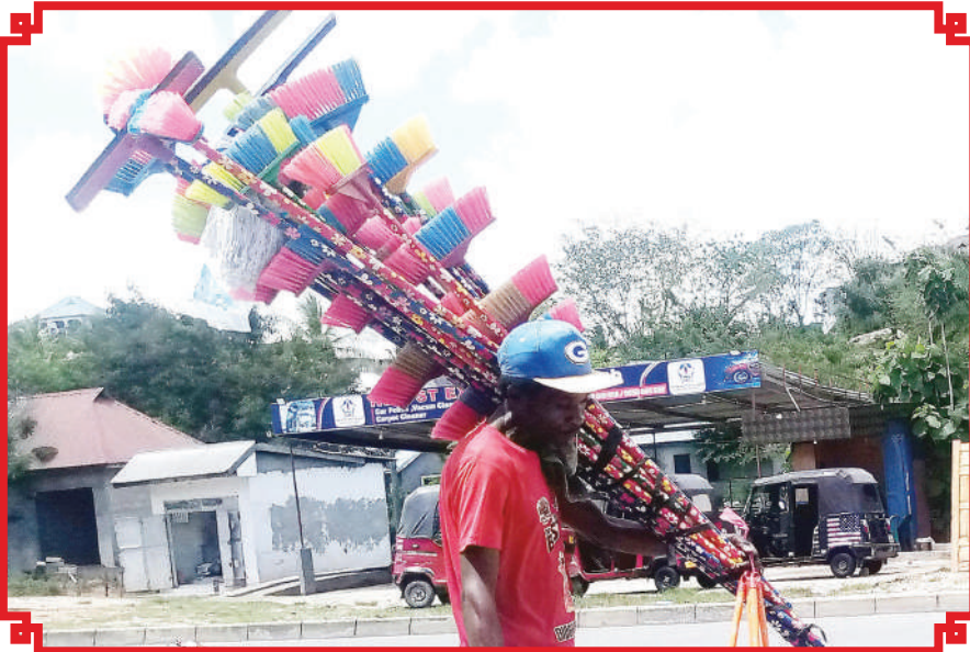
Mfanyabiashara mdogo maarufu machinga akisaka wateja wa bidhaa zake, katika eneo la Malamba Mawili, Dar es Salaam jana.