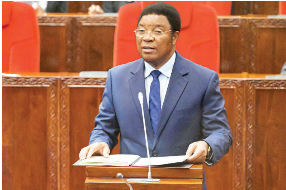
Waziri Mkuu Kassim Majaliwa akitoa hotuba ya kuahirisha shughuli za mkutano wa 16 wa Bunge, jijini Dodoma jana.