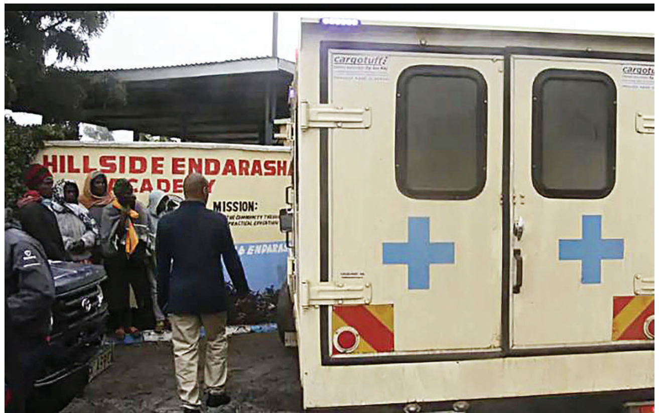
Gari la kubeba wagonjwa likiwa nje ya shule ya Msingi ya Hillside Endarasha, kusaidia kubeba wanafunzi walioathirika na tukio la moto.