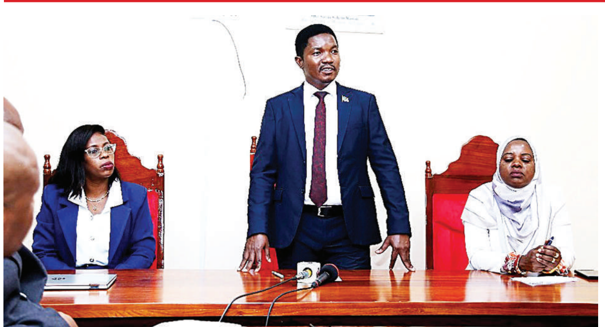
Waziri wa Viwanda na Biashara, Dk. Selamani Jafo (katikati), akizungumza wakati alipotembelea Chuo cha Elimu ya Biashara (CBE), jijini Dar es Salaam jana.

"Kati ya Julai na Agosti, mwaka huu, vibali 70 vya uondoshaji wa magari chakavu vimetolewa kwa halmashauri na ofisi za serikali," alisema.