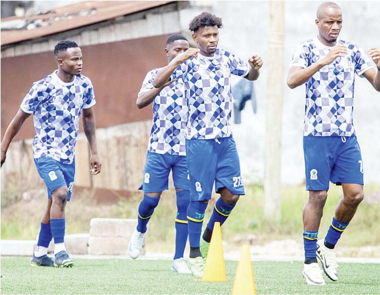
Wachezaji wa Timu ya Soka ya Taifa (Taifa Stars), wakifanya mazoezi kwa ajili ya kujiandaa na mechi ya kusaka tiketi ya kushiriki Fainali za Kombe la Mataifa Afrika (AFCON 2025), dhidi ya Guinea itakayochezwa ugenini Septemba 10, mwaka huu.