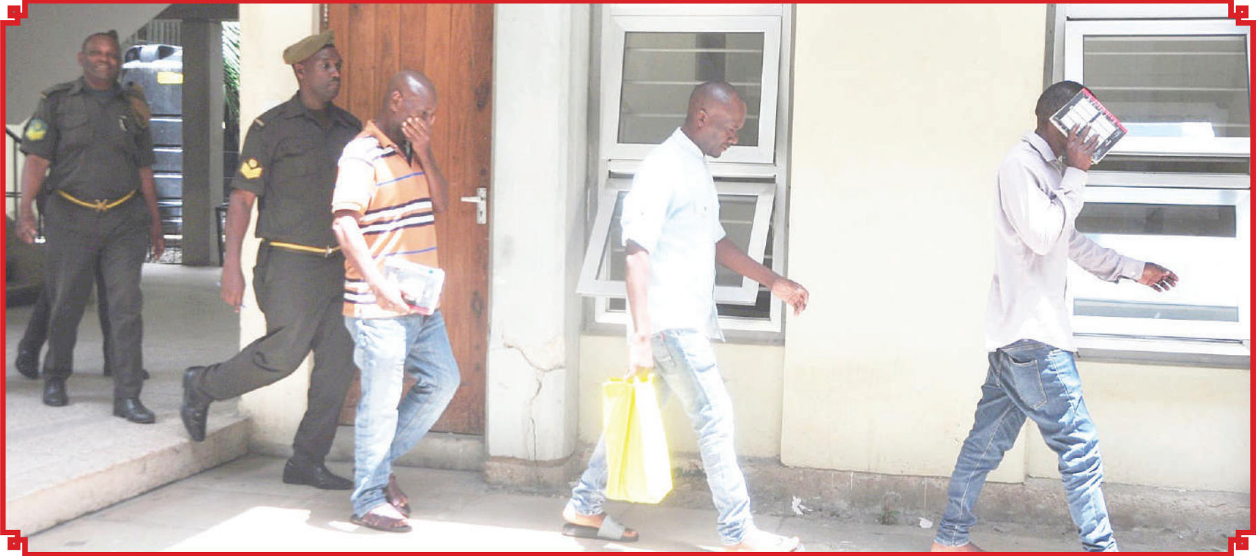
Washtakiwa wa kesi ya uhujumu uchumi kwa kusafisha vipande vya meno ya Tembo 413 na meno ya Kiboko mawili yanayosadikika kuwa na thamani ya Sh. Bilioni 4.4, wakiwa chini ya ulinzi wa Askari Magereza, baada ya kusikiliza kesi inayowakabili katika Mahakama ya Hakimku Mkazi Kisutu, jijini Dar es Salaam jana.