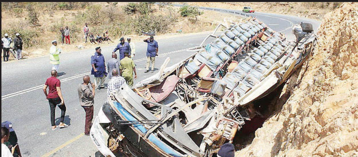
Askari wa Kikosi cha Usalama Barabarani, wakikagua mabaki ya basi la kampuni ya AN CLASSIC, lililopata ajali katika Kijiji cha Lwanjilo, Halmashauri ya Wilaya ya Mbeya na kusababisha vifo vya watu 12 na kujeruhi 36.

• Watu 12 wafariki dunia na 36 kujeruhiwa, ni ya pili ndani ya wiki moja Mbeya... Endelea Ukurasa 2