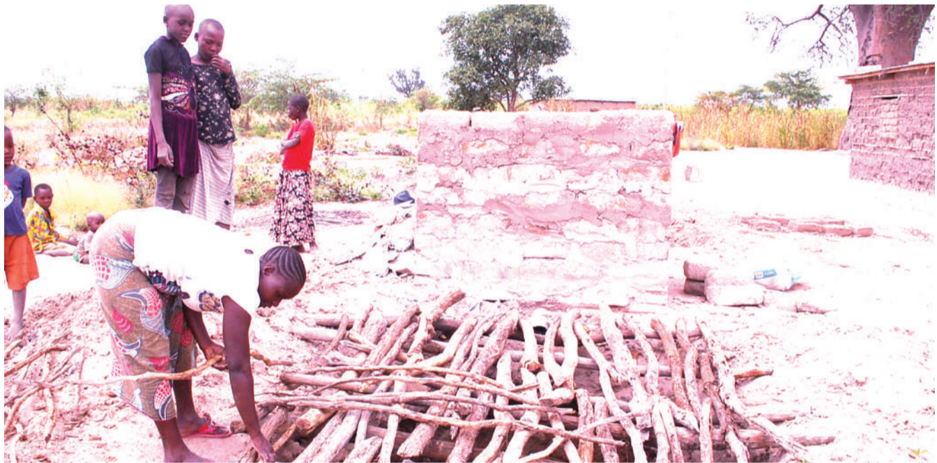
Mkazi wa Kijiji cha Bahi, mkoani Dodoma, akijenga choo jana, kwa kufunika kwa miti ili kukabiliana na magonjwa ya mlipuko yanayo-sababishwa na ukosefu wa huduma hiyo muhimu.