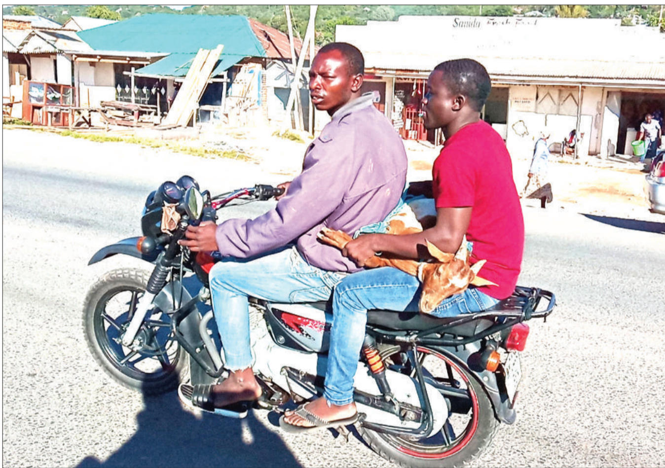
Wakazi wa Manispaa ya Iringa, wakitoka kununua mbuzi kijijini kwa ajili ya kitoweo cha sikukuu ya Eid El Fitri, juzi.