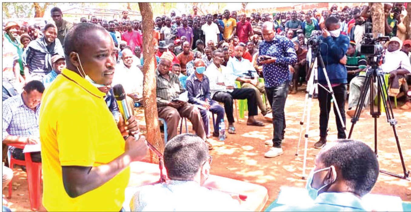
Waziri wa Madini, Dotto Biteko, akizungumza na wachimbaji wadogo katika mgodi mdogo wa Mwabomba, Halmashauri ya Ushetu mkoani Shinyanga jana, wakati akitatua mgogoro uliodumu zaidi ya miaka 20 kati ya wachimbaji hao na kampuni ya utafiti wa madini ya Catton Myabi Tanzania Ltd.