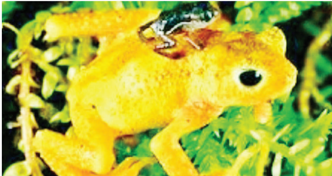
Vyura wa Kihans ni miongoni mwa viumbe wa ajabu duniani. Wanyama hawa wanazaa na hupatikana Tanzania pekee.

na vijijini wanajihusisha na usambazaji au uzaji wa mazao ya misitu. Upatikanaji wa mkaa, kuni, nguzo, mbao, fito na asali kirahisi katika mitaa na sehemu tunazoishi ni matokeo ya wasambazi au wajasiriamali wa chini.