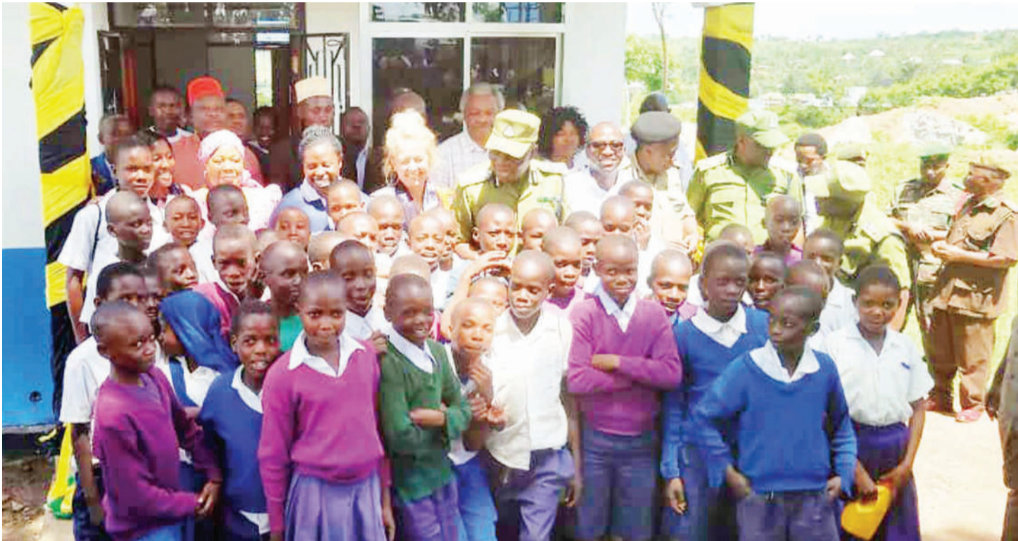
IGP Sirro (katikati), akiwa na wanafunzi na wadau wengine kuzindua dawati la jinsia na watoto wilayani Butiama mwaka jana.

K WA jinsi hali ilivyo kwenye baadhi ya maeneo nchini, huenda hadi shule kufunguliwa, wanafunzi wengi watakuwa wameshaumia kwa vitendo vya ukatili wa kijinsia ikiwamo kukeketwa, mimba na ndoa za utotoni.