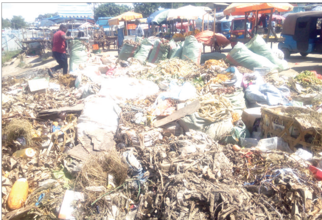
Taka za wafanyabiashara wadogo katika kituo cha daladala na bajaji cha Mbezi Mwisho, kuelekea Kinyerezi jijini Dar es Salaam, zikiwa zimerundikwa na kutelekezwa pembeni ya kituo hicho juu, na kusababisha usumbufu kwa madereva wa bajaji na wapita njia.

Mawasiliano zaidi mzazi wa mtoto ni 0683203363.