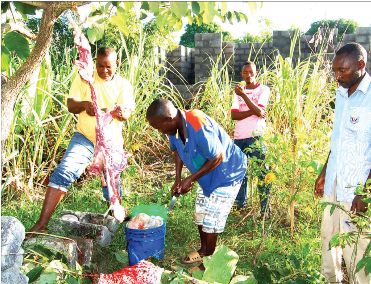
Wakazi wa Kitunda Kivule nje kidogo ya Jiji la Dar es Salaam, wakichuna mbuzi kwa ajili ya kitoweo cha Sikukuu ya Eid El Fitri, jana.

AVIKUMBUSHA mambo muhimu ya kuzingatia kwenye mchakato wa uchaguzi mkuu... Endelea ukurasa 2