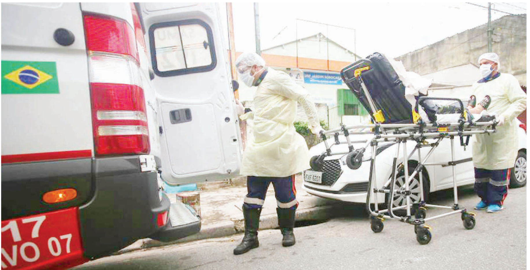
Brazil ni nchi ya pili duniani hivi sasa kwa kuwa na maambukizo mengi ya virusi vya corona baada ya Marekani.

Wote wametengwa, kwa mujibu wa wamiliki wa mgodi, AngloGold Ashanti.