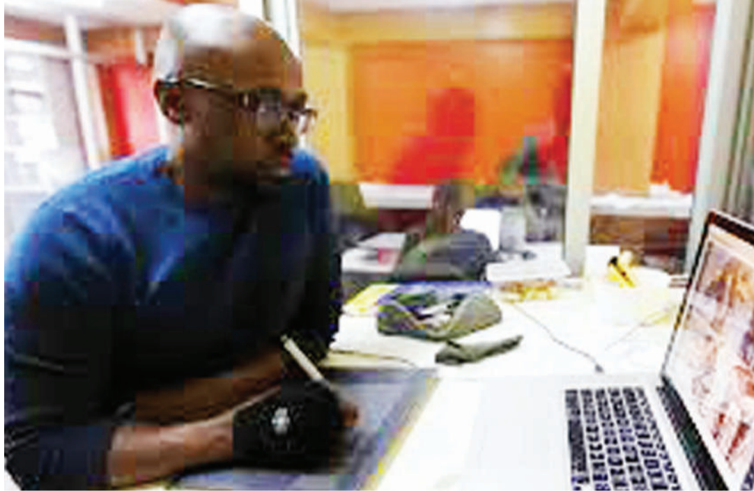
Mfanyakazi akifanyia kazi nyumbani badala ya kujazana ofisini kuepusha maambukizo ya corona.

Licha ya kuwa michepuo ya ajira imesinyaa ukilinganisha na wakati uliopita, bado vijana inabidi wafanye uamuzi wanataka kusoma nini vyaoni, na hata katika kujiunga na vidato vya juu mwelekeo wa masomo unaamua hatma au mvuto wa ajira baadaye. Tofauti na nyakati