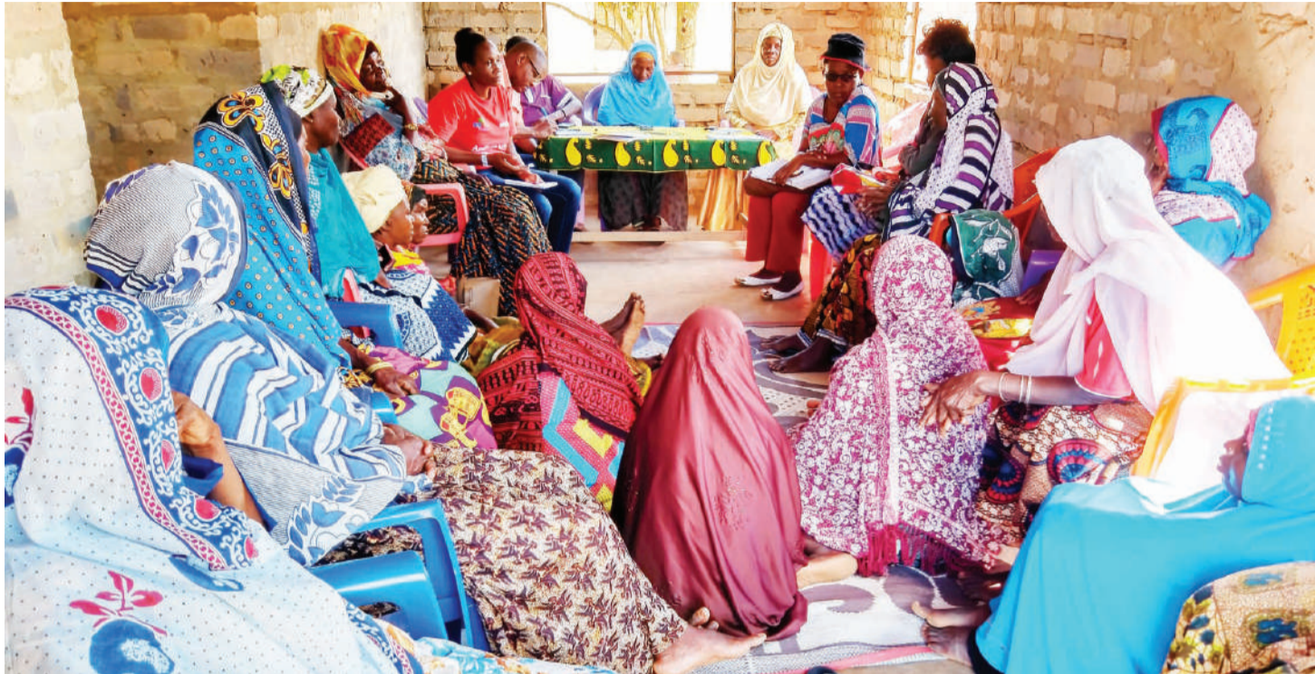
Wanawake wa asasi isiyo ya kiraia ya haki za wanawake wilaya ya Tandahimba (Taworo), katika mkutano na maofisa wa ActionAid wakielezea mafanikio kiuchumi na kijamii.