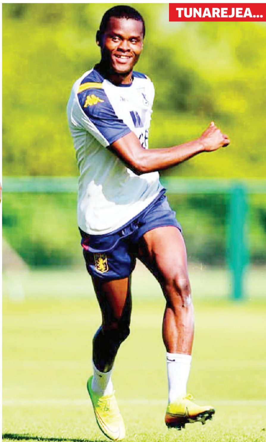
Mshambuliaji wa kimataifa wa Tanzania na nahodha wa Taifa Stars, Mbwana Samatta akiwa mazoezini na klabu yake ya Aston Villa kujiandaa kumaliza Ligi Kuu ya England iliyosimama tangu katikati mwa Machi kutokana na mlipuko wa maambukizo ya virusi vya corona (Covid-19).

Hadi Ligi Kuu inasimama, Namungo ipo nafasi ya nne ikiwa na pointi 50 zilizotokana na kushuka dimbani mara 28.