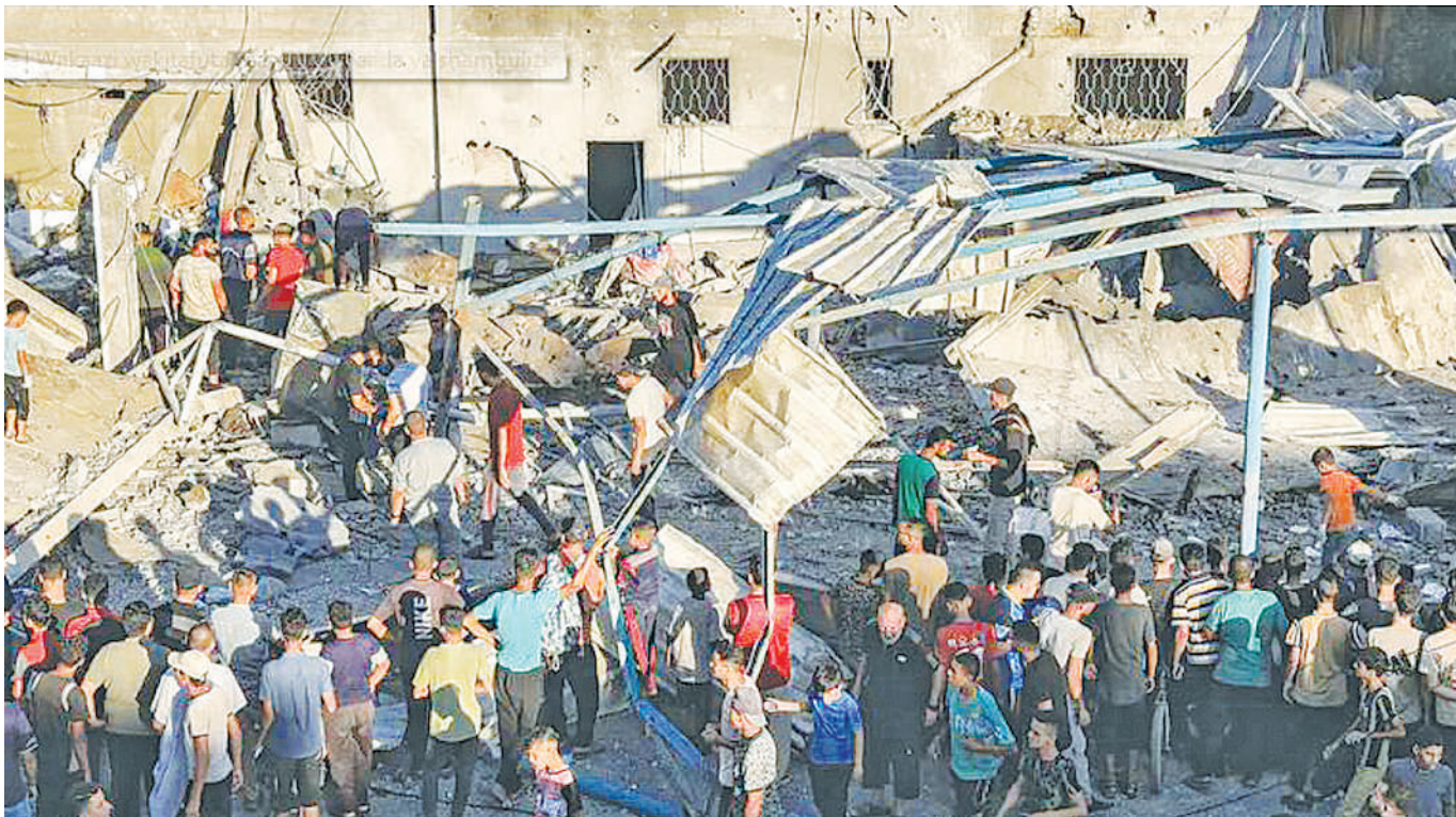
Raia wa Ukanda wa Gaza wakitafuta manusura baada ya vikosi vya Israel kushambulia majengo kadhaa katika eneo hilo juzi.