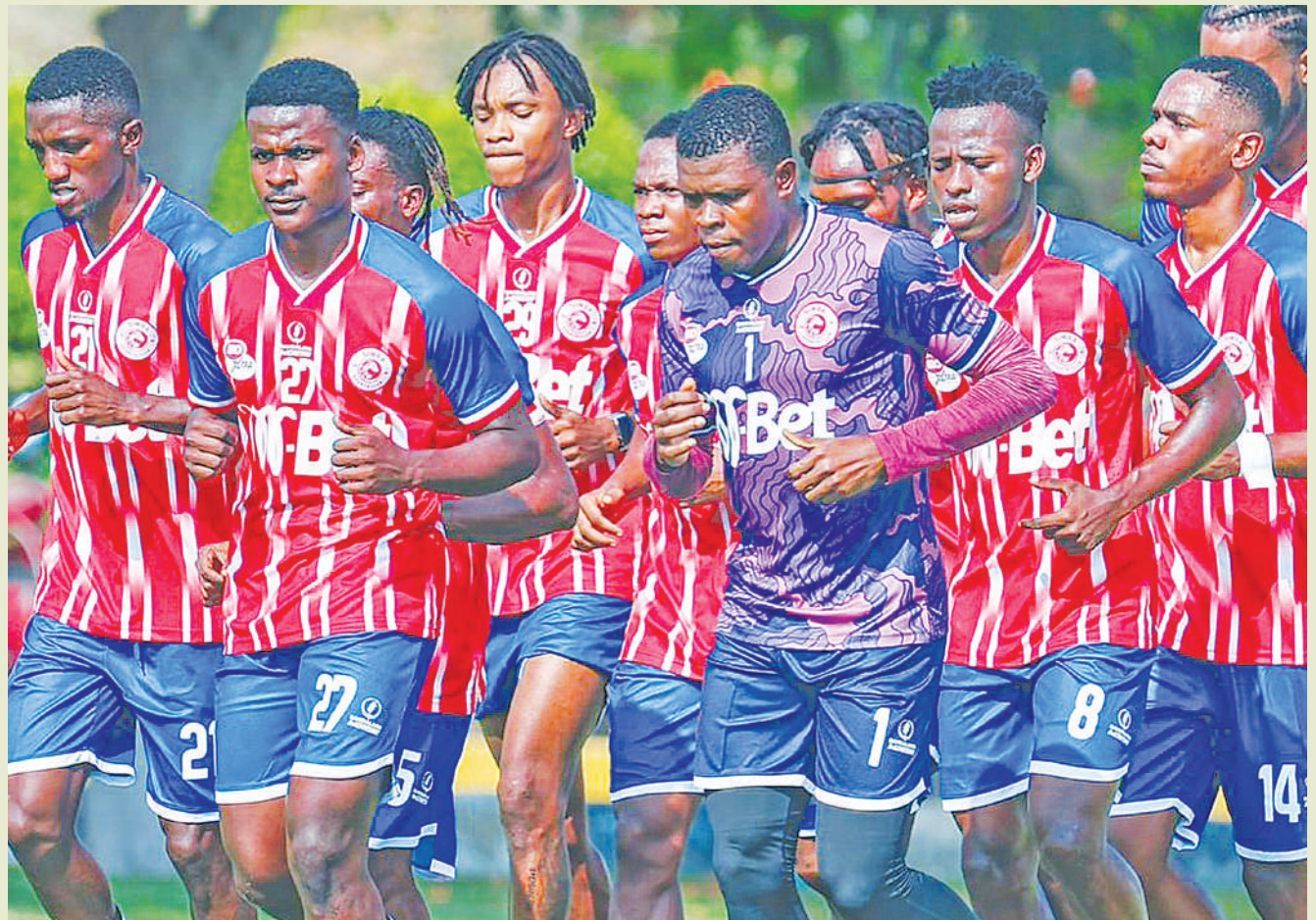
Baadhi ya wachezaji wa Simba wakiwa katika mazoezi jana kwenye kambi yao katika mji wa Ismailia, Misri kujiandaa na msimu mpya wa Ligi Kuu na mashindano ya kimataifa.