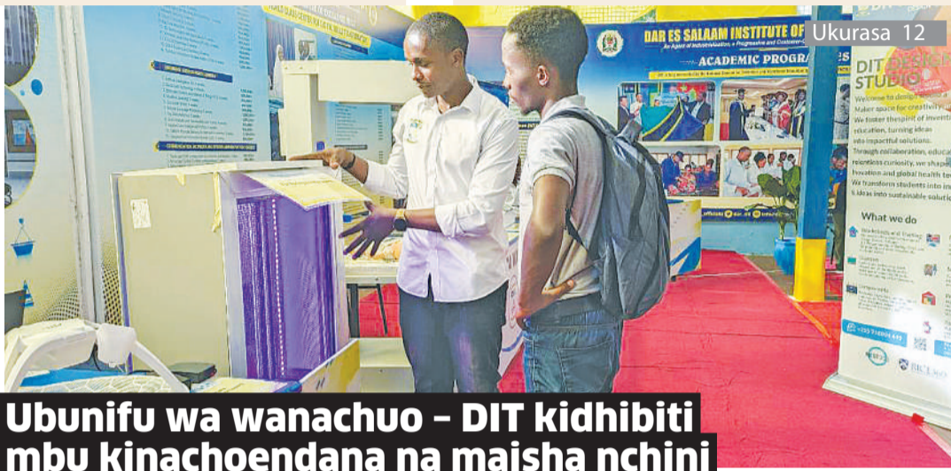
Ubunifu wa wanachuo - DIT kidhibiti mbu kinachoendana na maisha nchini