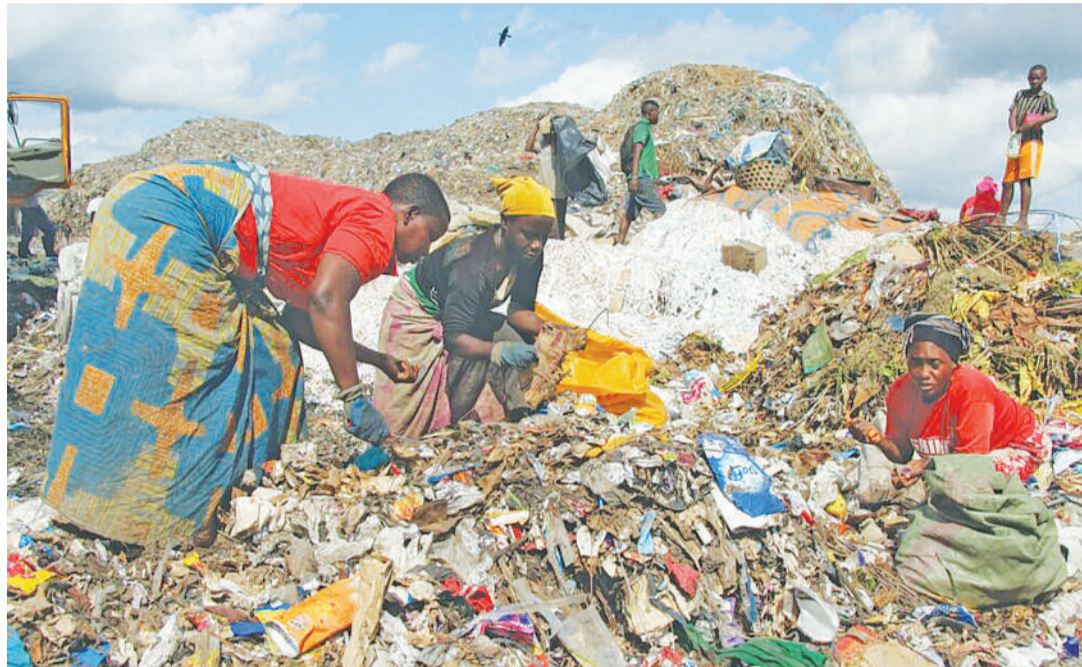
Uchafu ukiwa mtaani na kuwa kero kwa afya.

"Mfumo wa Taka Sifuri unapendekeza mifumo itakayotatua matatizo ya kimazingira kama uchafu wa hali ya hewa, kuruhusu jamii kuelewa mienendo yake na ku-