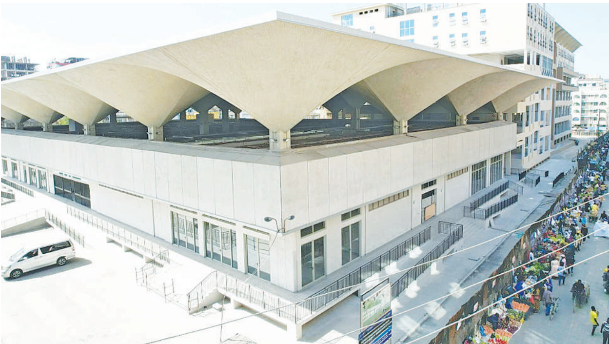
Mwonekano wa soko jipya la Kariakoo, Manispaa ya Ilala jijini Dar es Salaam.

Masharti wafanyabiashara kuingia jengo jipya Kariakoo yatangazwa