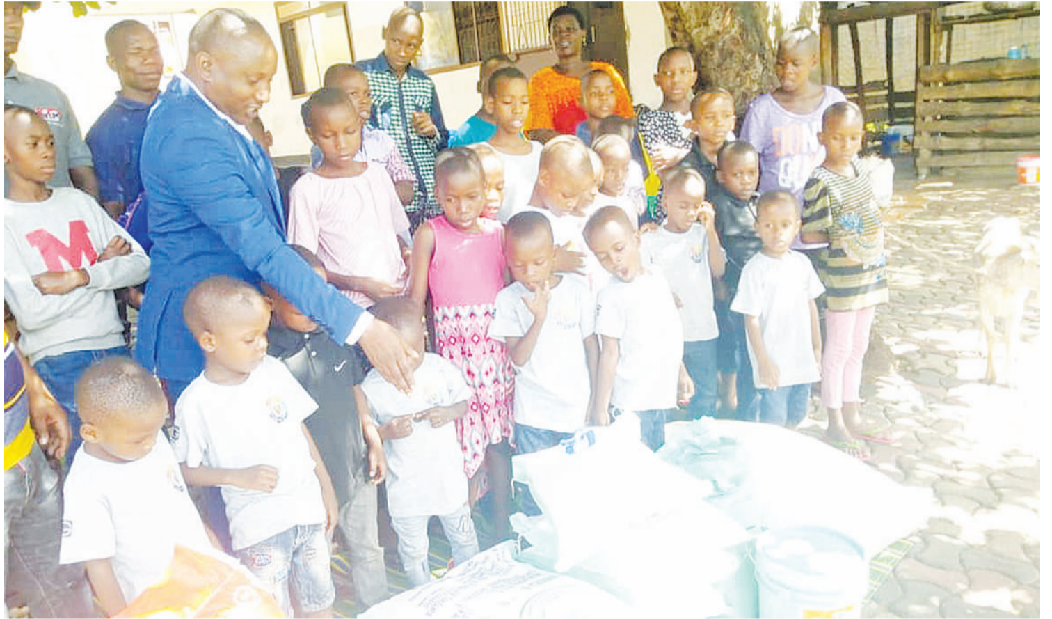
Halfa mojawapo ya kutoa msaada katika kituo cha yatima wilayani Kibaha.

Anaongeza kuwa, hata Rais Dk. Samia Suluhu Hassan, amekuwa mstari wa mbele kutoa sadaka katika makao ya Watoto aina hiyo.