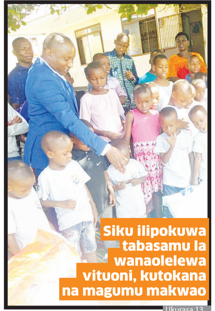
Siku ilipokuwa tabasamu la wanaolelewa vituoni, kutokana na magumu makwao