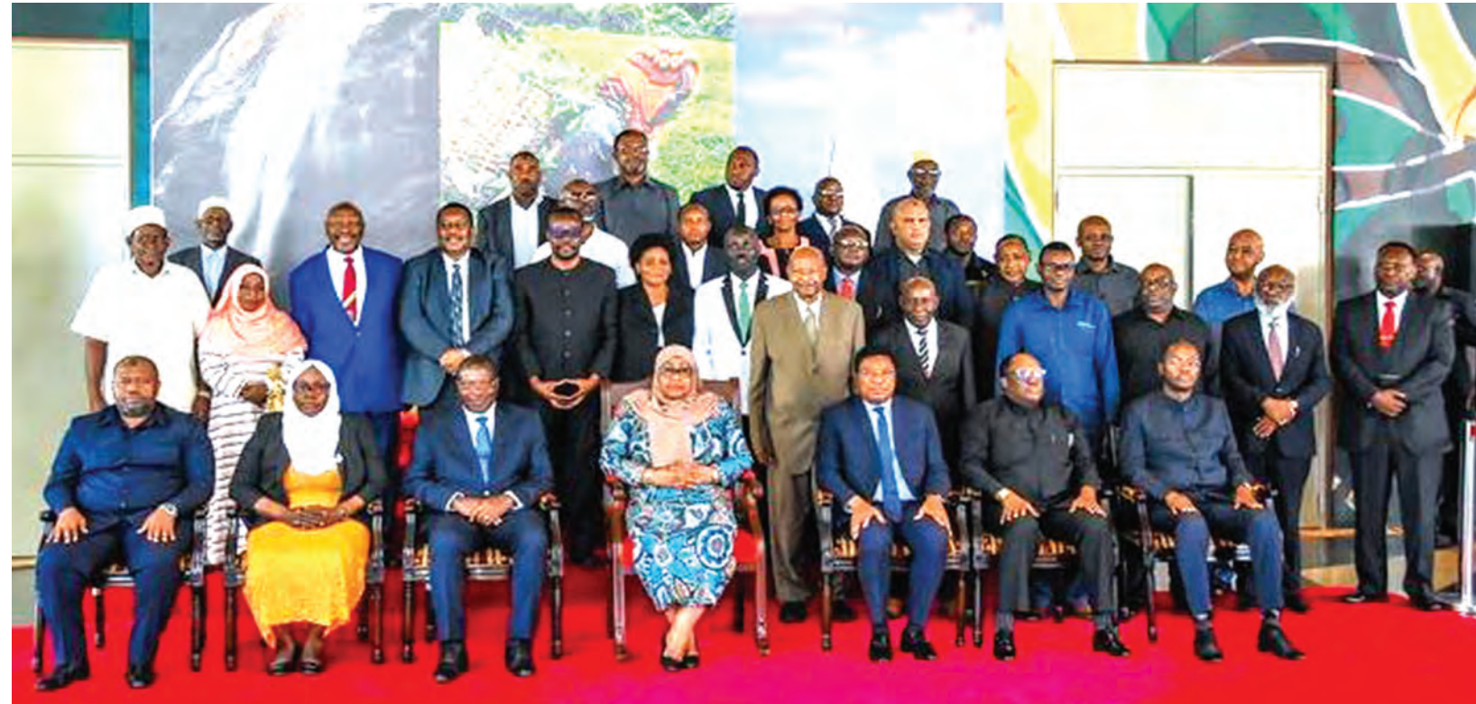
Viongozi wa vyama vya siasa walipokutana na Rais Samia Suluhu Hassan, Ikulu Dar es Salaam.

"Kwa hiyo, uwepo wangu leo mbele yenu ni kuja kutoa ruhosa,