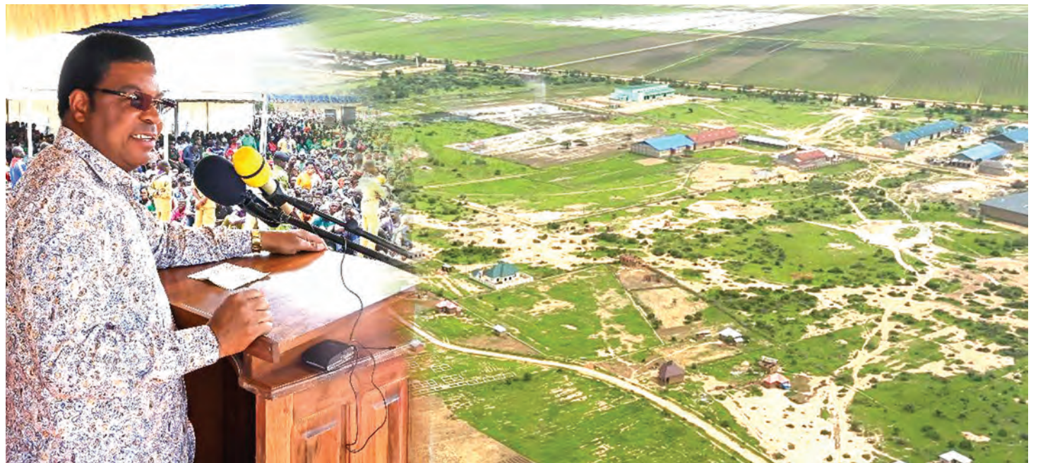
Sehemu ya ardhi iliyochukuliwa uamuzi mzito na Rais Dk. Samia Suluhu Hassan na kutangazwa rasmi wiki hii. Picha kushoto: Waziri Mkuu, Kassim Majaliwa akiutangazia umma wiki hii kuhusu kilichoamuliwa.

Akizungumza kwenye mkutano wa wadau na wakulima wa