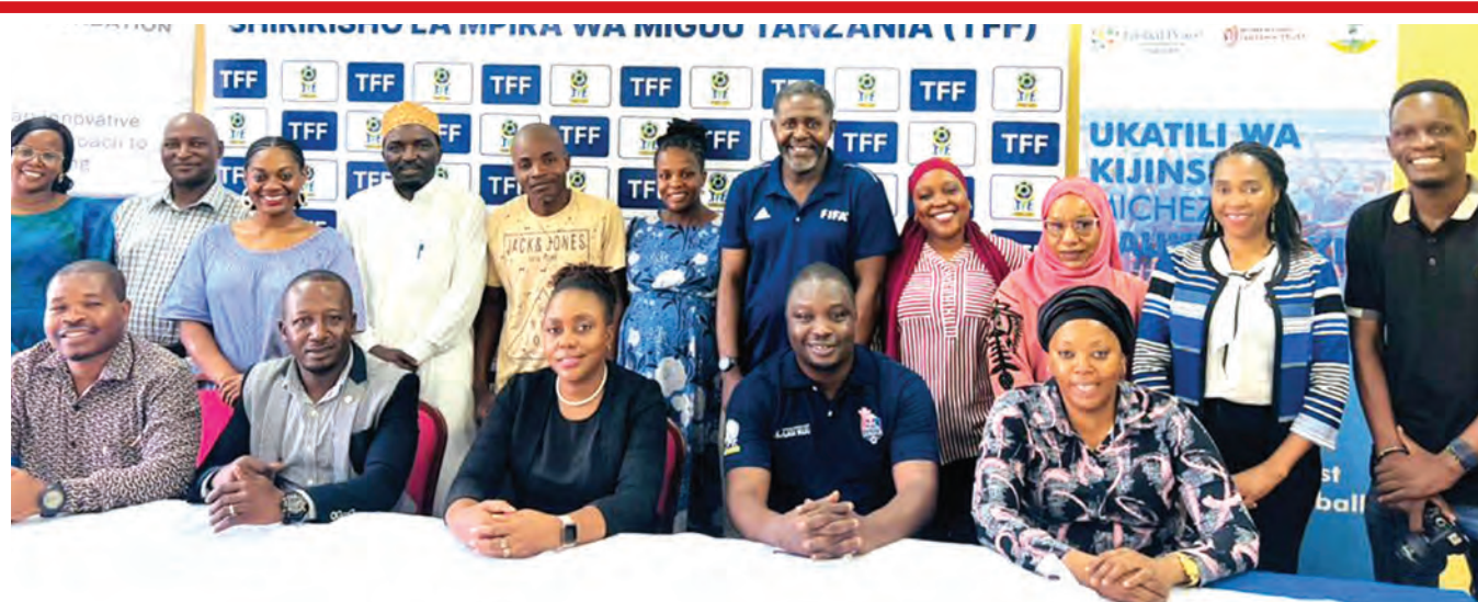
Washiriki wa kongamano la kujadili mapendekezo ya kumaliza changamoto ya ukatili wa kijinsia kwa wachezaji wa soka la wanawake hapa nchini baada ya kumaliza mkutano uliofanyika kwenye ukumbi wa TFF Ilala, Dar es Salaam jana.

Alliance Girls inakamata nafasi ya tano kwa pointi 10, Ceasia Queens iko katika nafasi ya sita pointi zake ni sita, Baobab Queens na Amani Queens zina pointi nne kila moja, huku The Tigers Queens na Mkwawa Queen zikiwa na pointi moja kila moja.