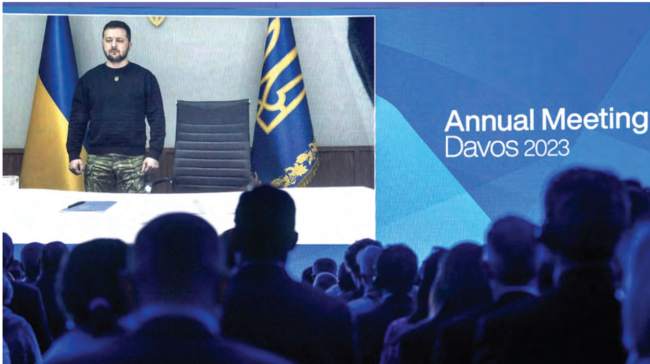
Rais wa Ukraine, Volodymyr Zelensky, akiwahutubia wajumbe waliohudhuria jukwaa la Uchumi Duniani (WEF) kwa njia ya video mjini Davos juzi.