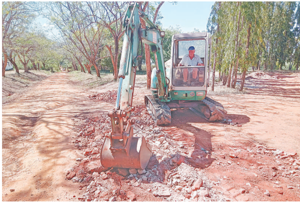
Dereva wa mtambo wa kuchimbika akisawazisha vifusi katika Kanisa la Wamisionari wa Mapadre wa Passionist Fathers kijijini Zeneth, wilayani Muheza. Eneo hilo limepitwa na mradi wa bomba la mafuta ghafi la EACOP, hivyo baadhi ya majengo yao yamebomolewa ili kupisha utekelezaji wa mradi huo.