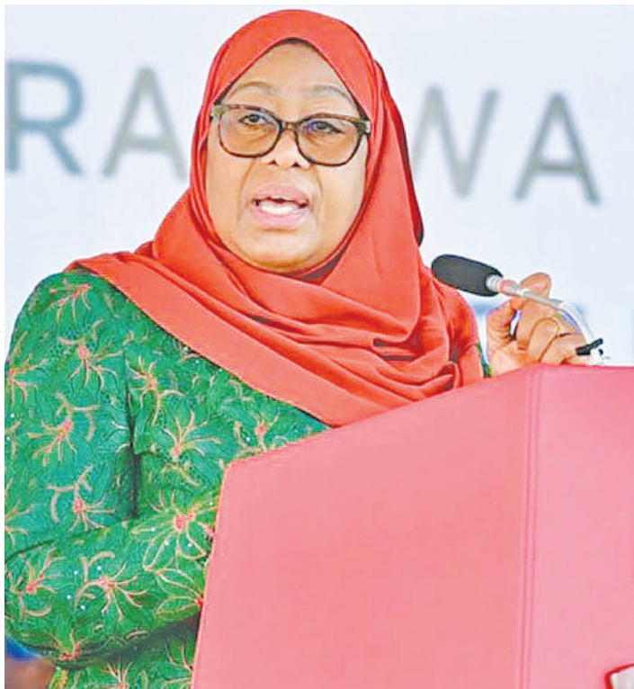
Rais Dk. Samia Suluhu Hassan, akihutubia tukio linalohusu Bima ya Afya.