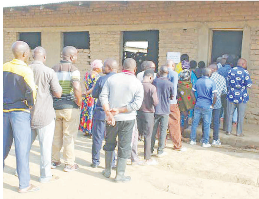
Baadhi ya wakazi wa Kitongoji cha Tunduma Road katika Mamlaka ya Mji Mdogo wa Mbalizi mkoani Mbeya, wakiwa kwenye mstari wakisubiri kupiga kura za kuwachagua viongozi wa Serikali za Mitaa kwenye kituo cha Shule ya Msingi Mapelele.