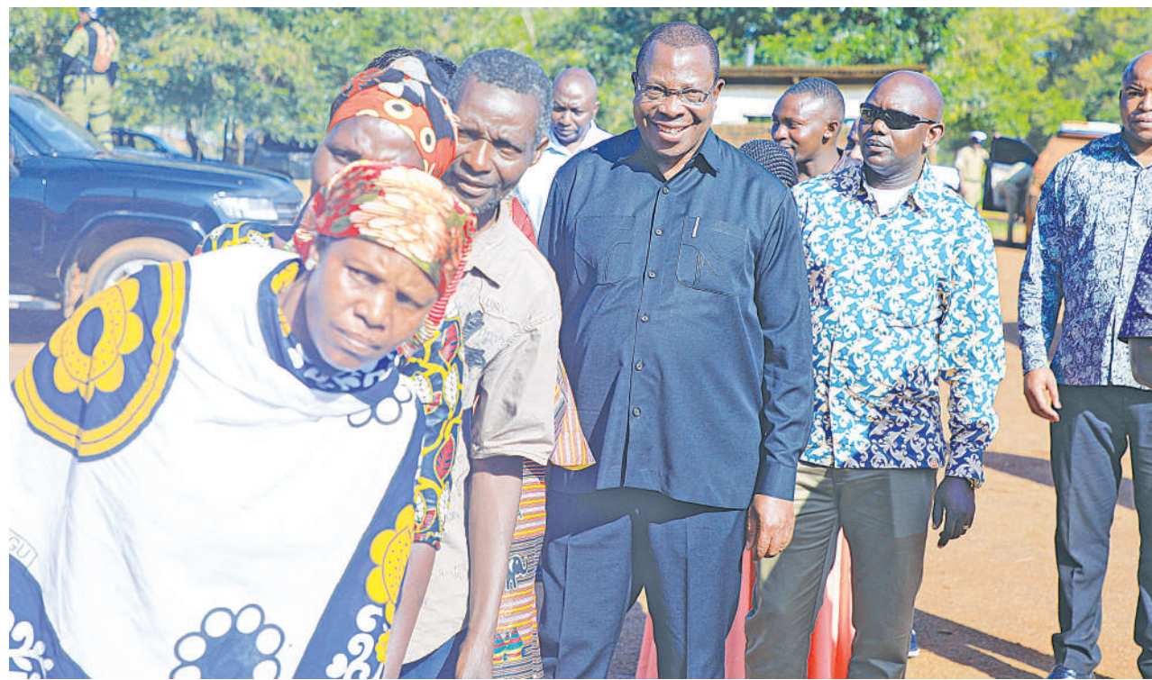
Makamu wa Rais, Dk. Philip Mpango, akiwa katika mstari na wananchi mbalimbali wakati akishiriki kupiga kura katika uchaguzi wa serikali za mitaa Kitiongoji cha Kihanga, Kijiji cha Kasumo, Wilaya ya Buhigwe mkoani Kigoma jana.