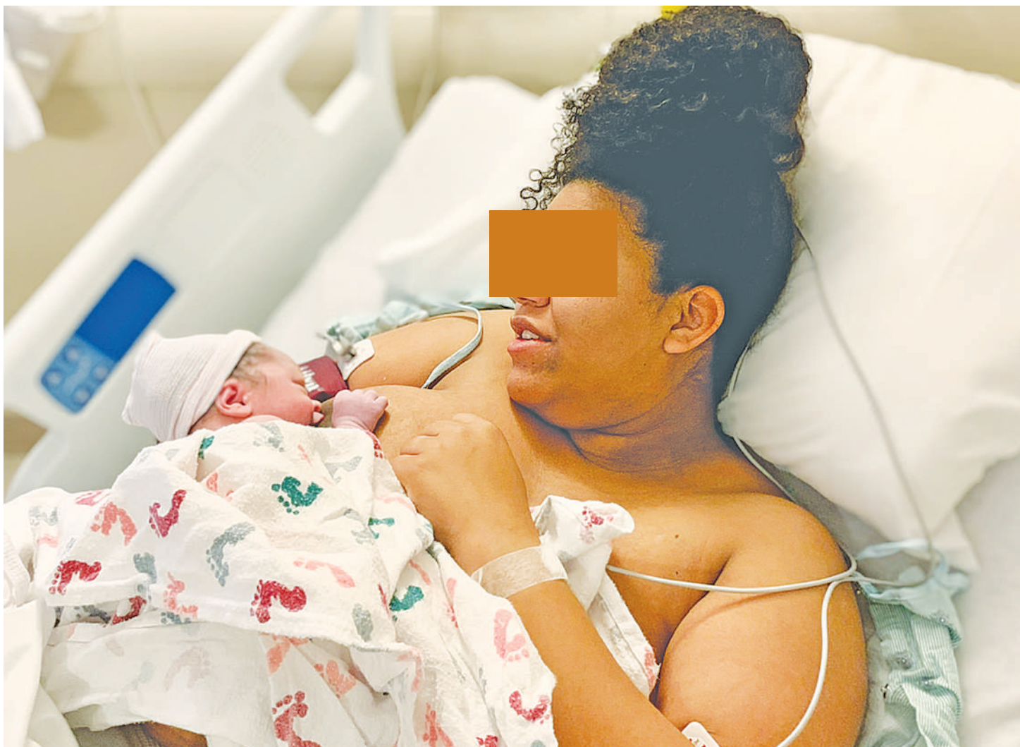
Mzazi anayesadikiwa kuugua maradhi ya Preeclampsia, akipata matibabu na mwanawe mchanga.

nawake wenye uzito mkubwa, hawawezi kukabiliana na uzito wao unaoongezeka wakati wa ujauzito.