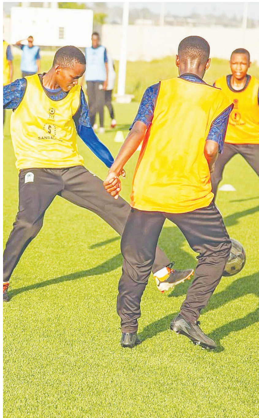
Wachezaji wa Timu ya Soka ya Taifa ya wasichana wa umri chini ya miaka 17 wakifanya mazoezi kwa ajili ya kujiandaa na mashindano ya Afrika Mashariki na Kati (CECAFA), yatakayofanyika hivi karibuni nchini Uganda.

Timu iliyopanda daraja msimu huu, Ken-Gold yenye pointi sita inaburuza mkia katika msimamo wa ligi hiyo yenye kushirikisha klabu 16 kutoka mikoa mbalimbali.