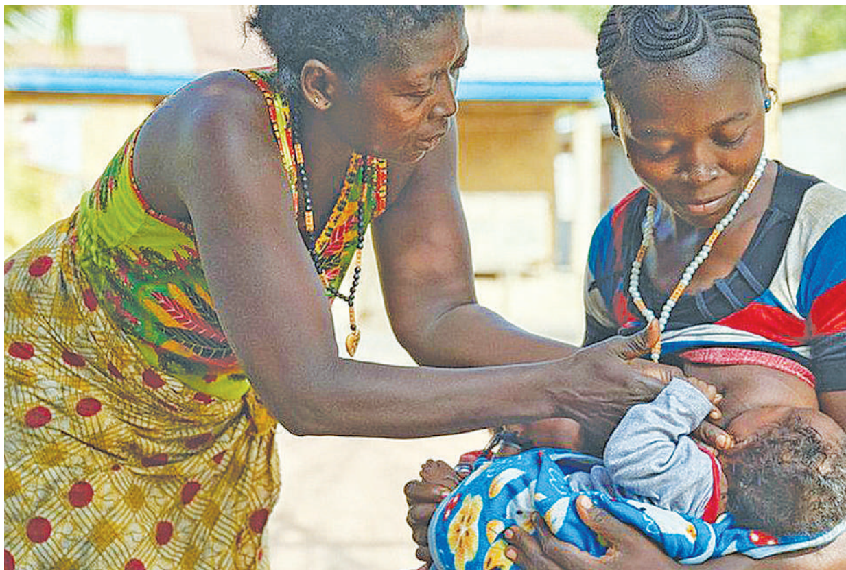
Mama akimwongoza binti yake anayenyonyesha mtoto. Ni sehemu ya tafsiri pana inayohusu uzazi wa mpango na malezi.

Mtaalam na mtoa huduma za afya ya uzazi,