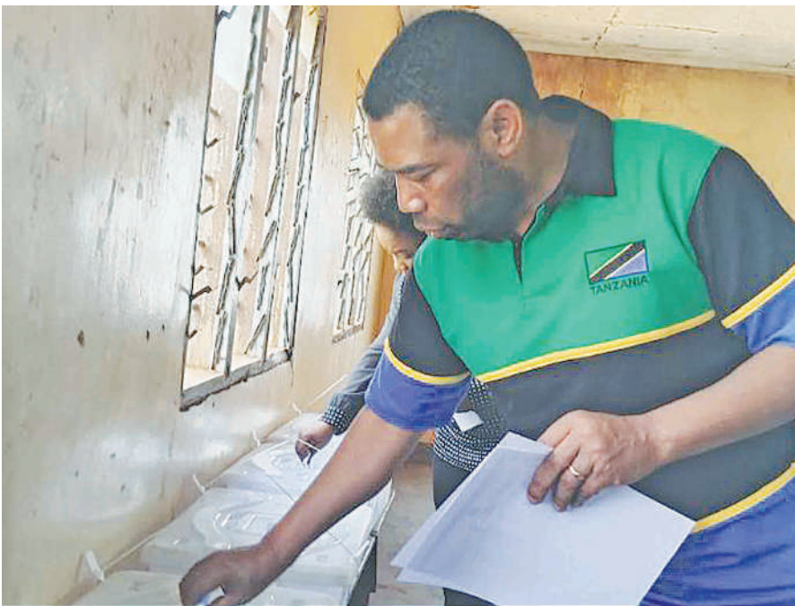
Waziri wa Fedha, Dk. Mwigulu Nchemba, Mbunge wa Iramba Magharibi, akipiga kura jana katika kituo cha kupigia kura ofisi za Ofisa Mtendaji wa Kata ya Misigiri, wilayani Iramba mkoani Singida.