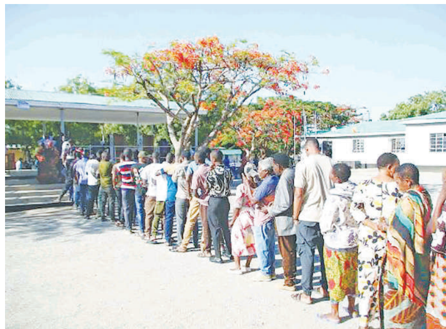
Baadhi ya wakazi wa Mtaa wa Sokoine Kijiji cha Chamwino Ikulu, Wilaya ya Chamwino mkoani Dodoma, wakiwa kwenye foleni ya kupiga kura kwenye uchaguzi wa serikali za mitaa uliofanyika jana.