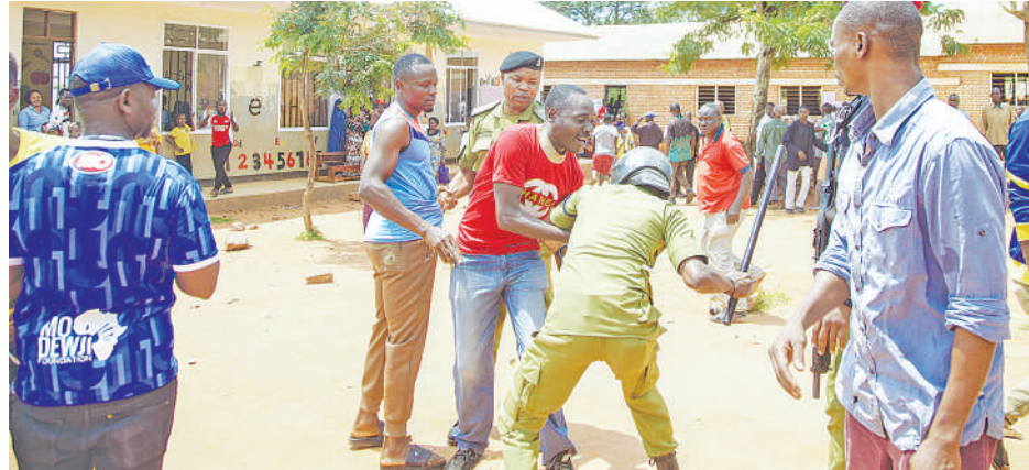
Polisi wakiwadhhibiti vijana waliokuwa wanapigana wakituhumi-ana kuweka kura feki katika kituo cha Shule ya Msingi Kibirizi, mjini Kigoma jana.

“Unajua hapa nyumbani pamoja na kuwa na familia yangu kwa maana ya mume wangu, pia walikuwapo baadhi ya mawakala na wagombea wengine wa CHADEMA wanaogombea kwenye uchaguzi wa Serikali za Mitaa. Tulikuwa tukiendelea na mazungumzo yetu ghafla tukasikia watu wakizunguka ny-