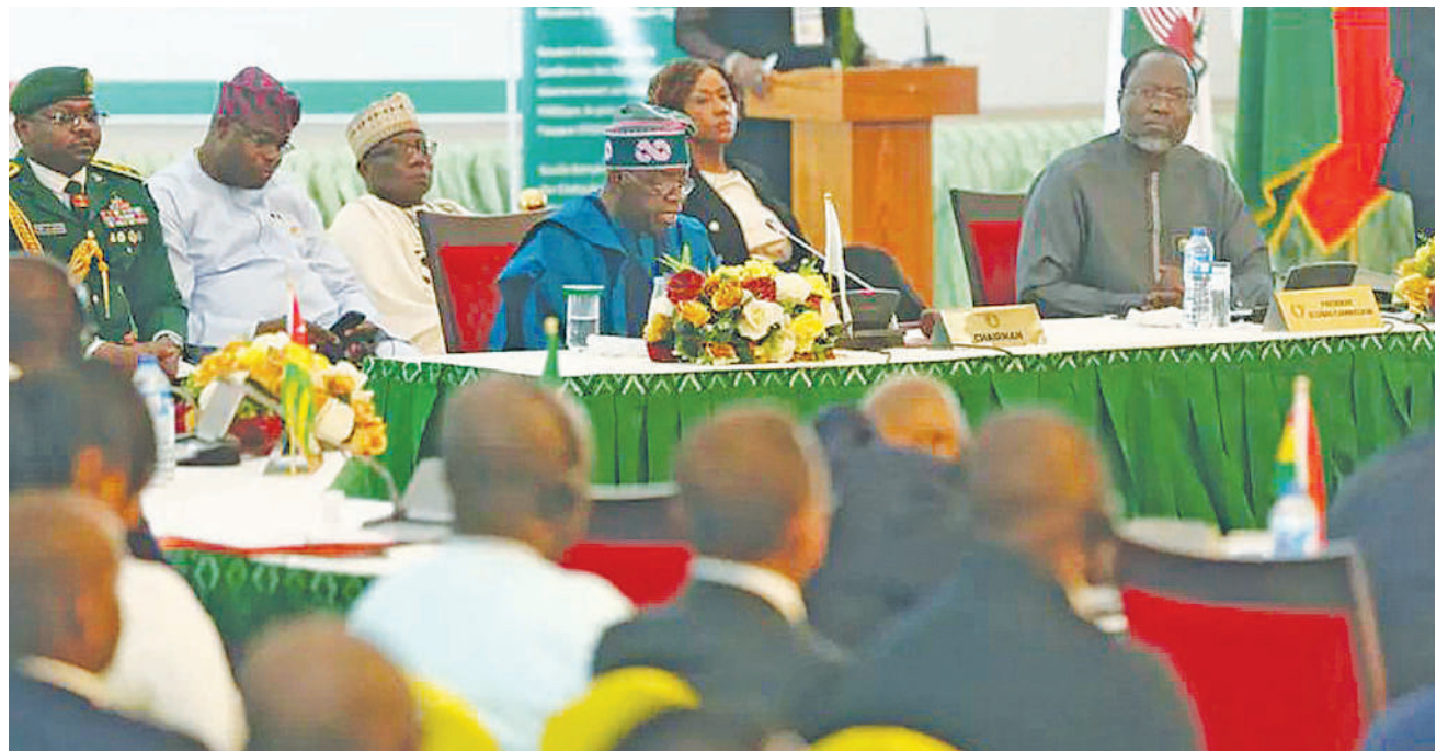
Mwenyekiti wa Jumuiya ya Kiuchumi ya nchi za Afrika Magharibi, Bola Tinubu ambaye pia ni Rais wa Nigeria akiiongoza mkutano wa viongozi wakuu wa nchi wanachama juji.

Hata hivyo wachambuzi wa kisiasa wanasema bunge lisilo na chama chenye wingi wa wazi linaweza kuzitumbukiza siasa za Ufaransa katika machafuko kwa wiki kadhaa za mashauriano kuamua nani atashika nafasi ya waziri mkuu. Kibaya zaidi Rais Macron anaweza kulazimika kuongoza nchi sambamba na waziri mkuu anaepinga sehemu kubwa ya sera zake za mrengo wa kati. DW