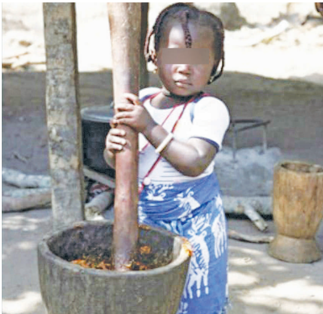
Kutwanga kwenye kinu hakuna umri hata watoto wanaweza.

Kuna upande huwa mpana au mkubwa zaidi na mwingine