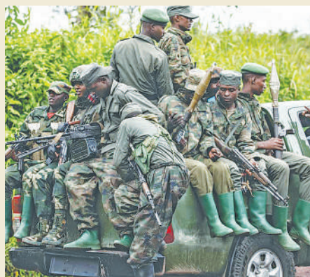
Waasi wa M23

Aidha ripoti hiyo pia iliongeza kuwa kuna watoto kuanzia miaka 12 wamesajiliwa kutika kambi zote za wakimbizi nchini Rwanda ambao wanatarajiwa kupelekwa katika kambi za mafunzo katika maeneo yanayokaliwa na waasi chini ya uongozi wa wanajeshi wa Rwanda na waasi wa M23.