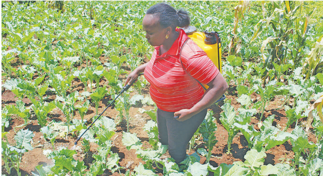
Mboga zikitibiwa kwa viuatilifu vya viwandani.

Ni wakati wa kutumia marathoni hizo kuhamasisha kutengeneza dawa hai za asili kwa ajili