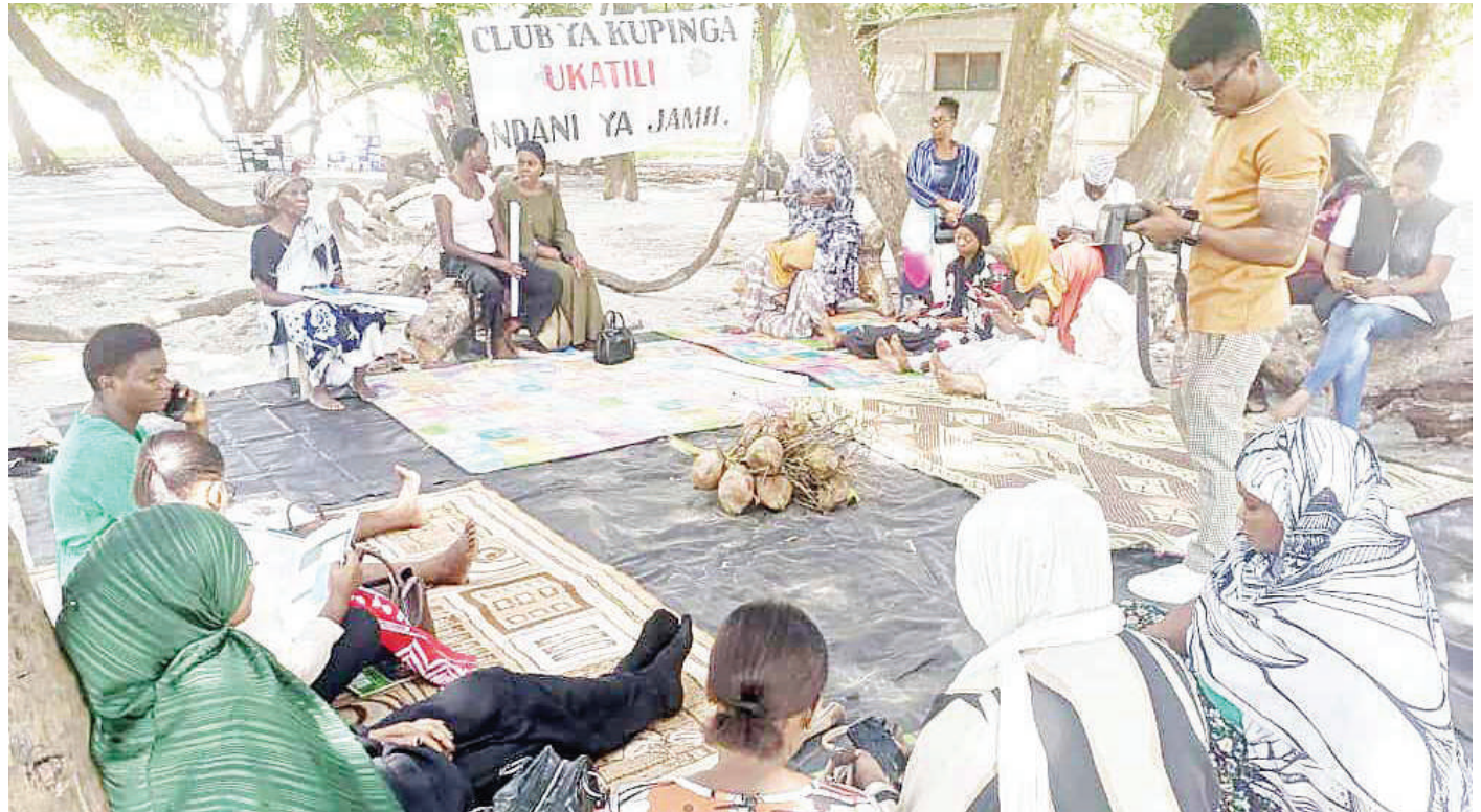
Baadhi ya viongozi wa vikundi na mashirika yasiyo ya kiserikali wakiwa katika mkutano wa kujifunza jinsi ya kutoa maoni kuhusu Dira ya Taifa ya mwaka 2025 hadi 2050, ulioandaliwa na Kituo cha Sauti ya Jamii Kipunguni, jijini Dar es Salaam jana.

Alisema pia wanajadili kwa kina mahusiano ya nchi na nchi katika nchi wanachama ambapo katika kujadili mambo hayo yanahitaji utulivu.