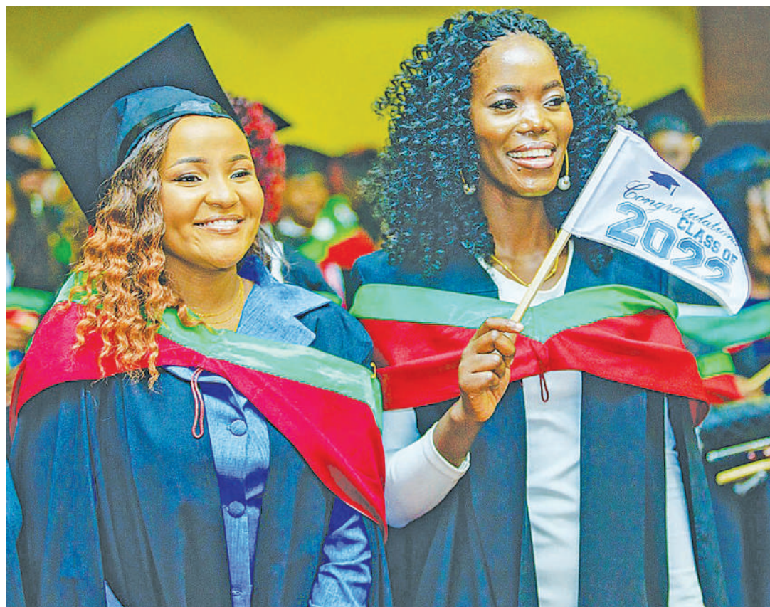
Wahitimu wanapofurahia mahafali wakumbuke kurejesha mikopo ya bodi.

Kwa walioajiriwa katika sekta binafsi au ya umma wanapaswa kurejesha asilimia 15 ya mshahara wao wa kila mwezi na kwa