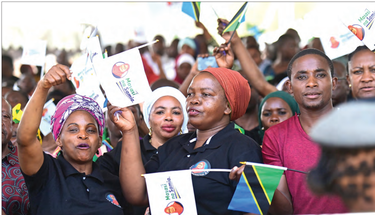
Wananchi wa Masasi wakiwa kwenye shamrashamra za kumpokea Rais Samia Suluhu Hassan katika mkutano wa hadhara uliofanyika Uwanja wa Bomani, mkoani Mtwara jana.

Rais Samia ashtukia viongozi; aonya mila zinazochochea mimba utotoni... Ukurasa wa 2