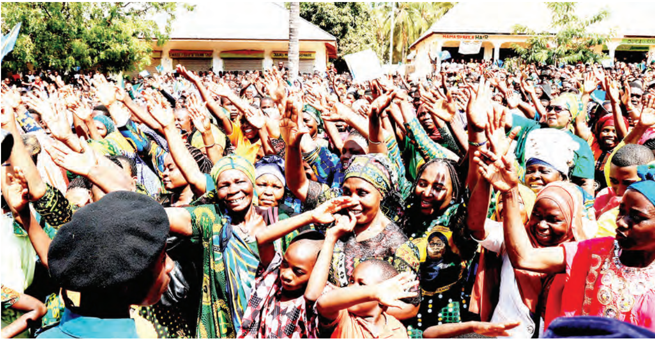
Wananchi wa Mangaka wilayani Nanyumbu mkoani Mtwara wakiwa katika mkutano wa hadhara kumsikiliza Rais Samia Suluhu Hassan jana.