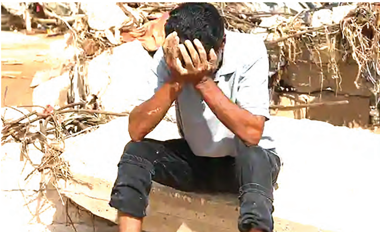
Mkazi akiwa amekaa mbele ya nyumba yake katika eneo la Derna, lililoathirika vibaya na mafuriko nchini Libya, mwishoni mwa wiki.