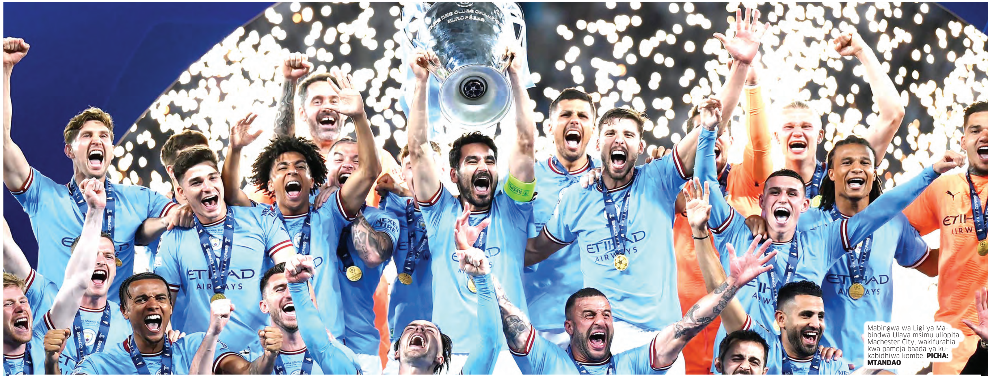
Mabingwa wa Ligi ya Mabingwa Ulaya msimu uliopita, Manchester City, wakifuraha kwa pamoja baada ya kukabidhiwa kombe.