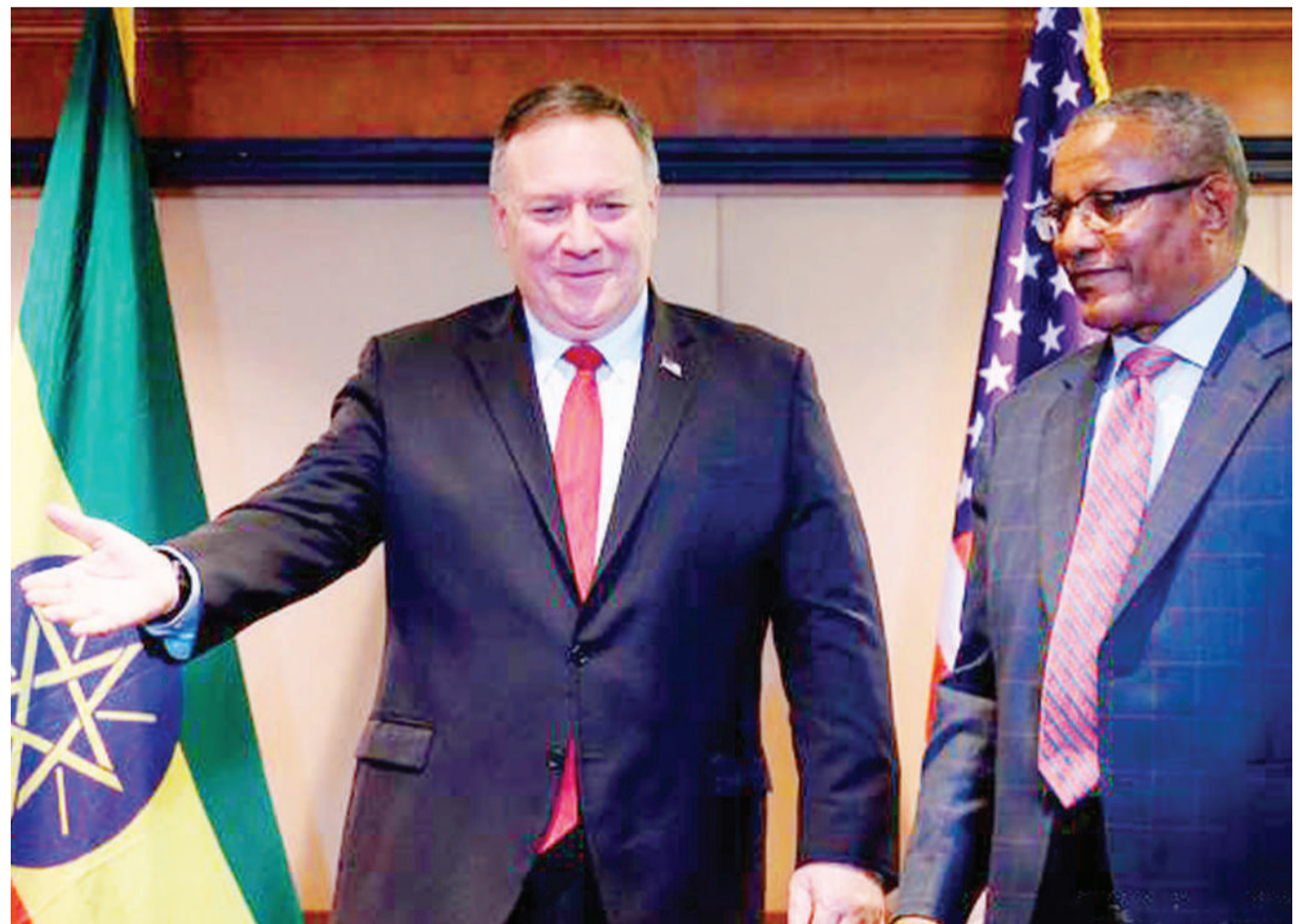
Waziri wa mambo ya nje wa Marekani Mike Pompeo (kushoto) akiwa nchini Ethiopia katika moja ya ziara yake.

Nako Hong Kong taarifa zinaeleza kuwa mtu wa pili aliyekuwa amebukizwa amefariki dunia.