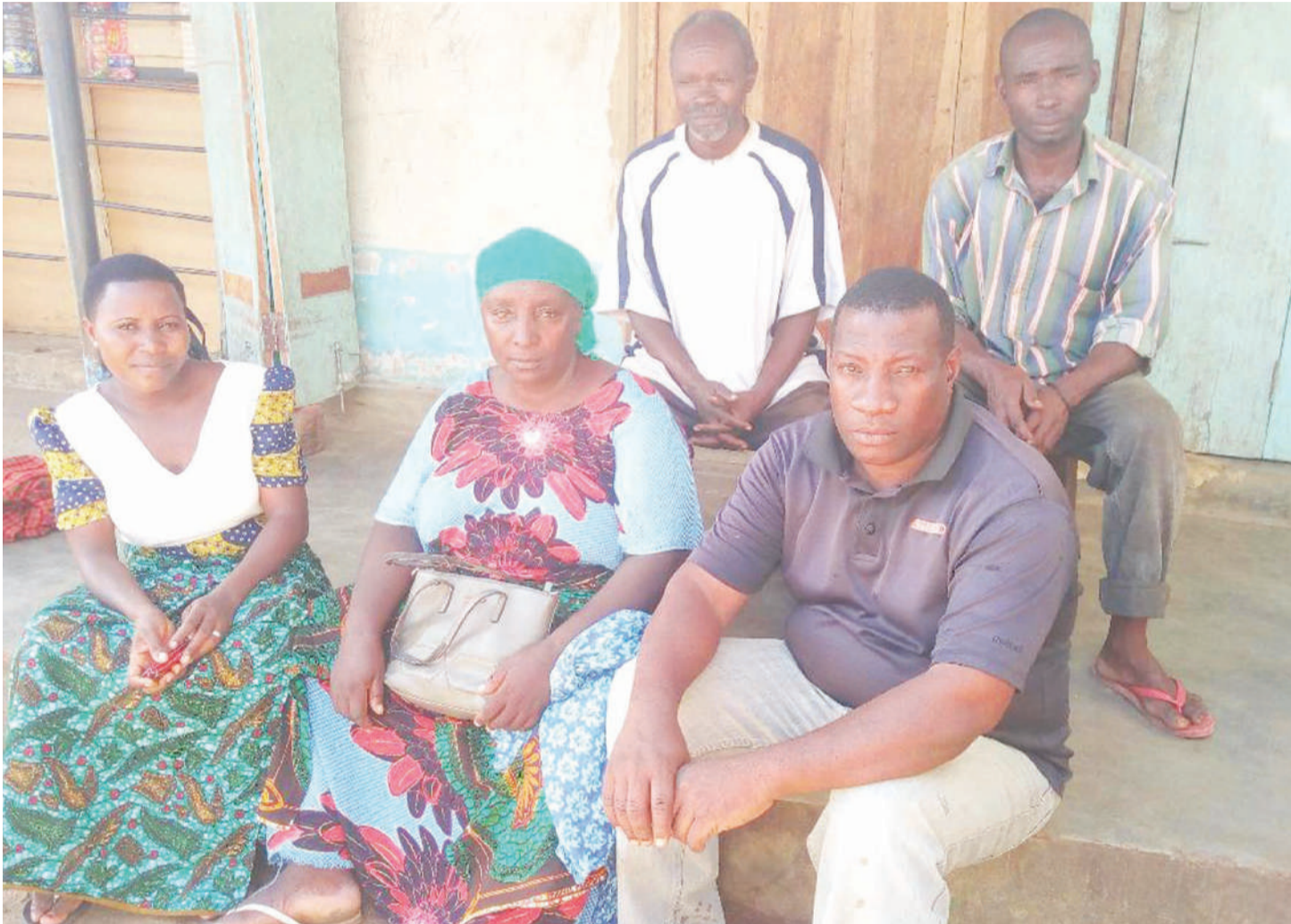
Baadhi ya wananchi wa Kata ya Kiroka, baada ya kujadiliana kuhusu masuala ya ubakaji na ulawiti yanayoendelea kwenye jamii.