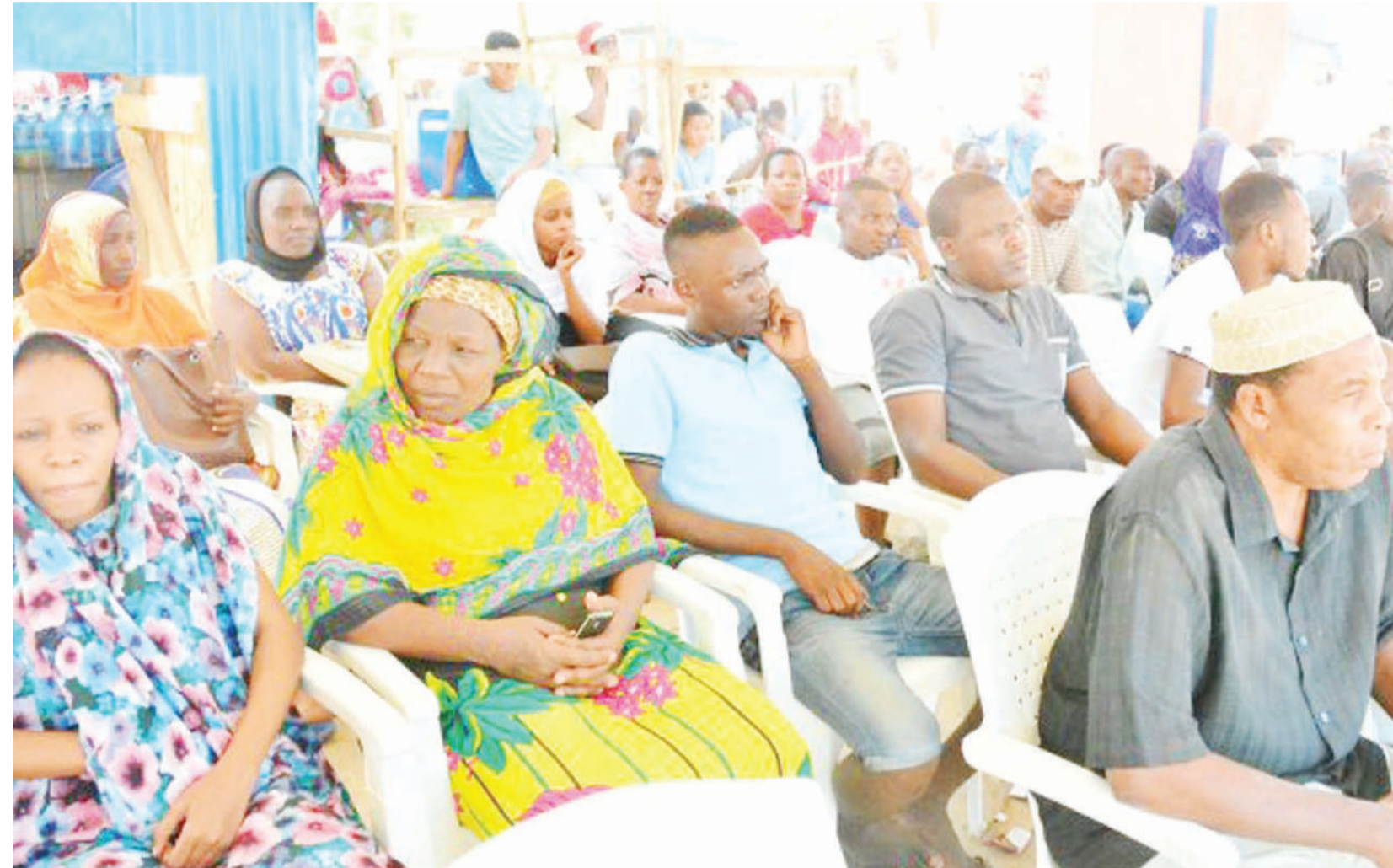
Wakazi wa Manzese wakifuatilia elimu kuhusu kifafa iliyotolewa na madaktari bingwa wa Ubongo, Uti wa Mgongo, Mishipa ya Fahamu wa Hospitali ya Taifa Muhimbili (MNH).

Anasema, pia ajali zinaweza kumsababisha mtu kifafa, kwa kuwa