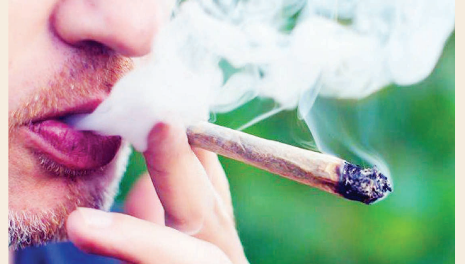
Uvutaji bangi.