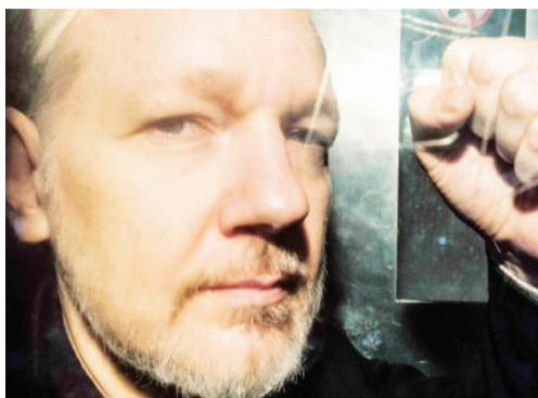
Mwanzilishi Mtandao Wikileaks, Julian Assange.