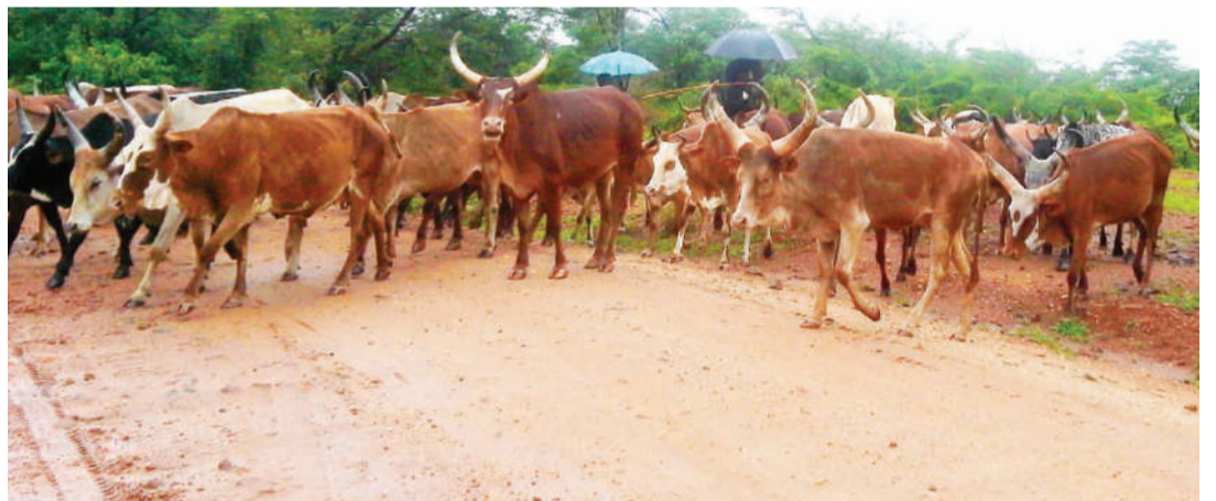
Moja ya misitu iliyovamiwa wilayani Chunya.

Sisi tunao- toka kwe- nye maeneo yale ndio tunaajua umuhimu wa msitu ule. Dunia nzima sasa hivi inahubiri mabadiliko ya tabianchi, sasa hii ni fursa kubwa kwetu wa- nanchi wa mkoa Mbeya maana sisi ndio wanu- faika wa kwanza wa misitu hii.