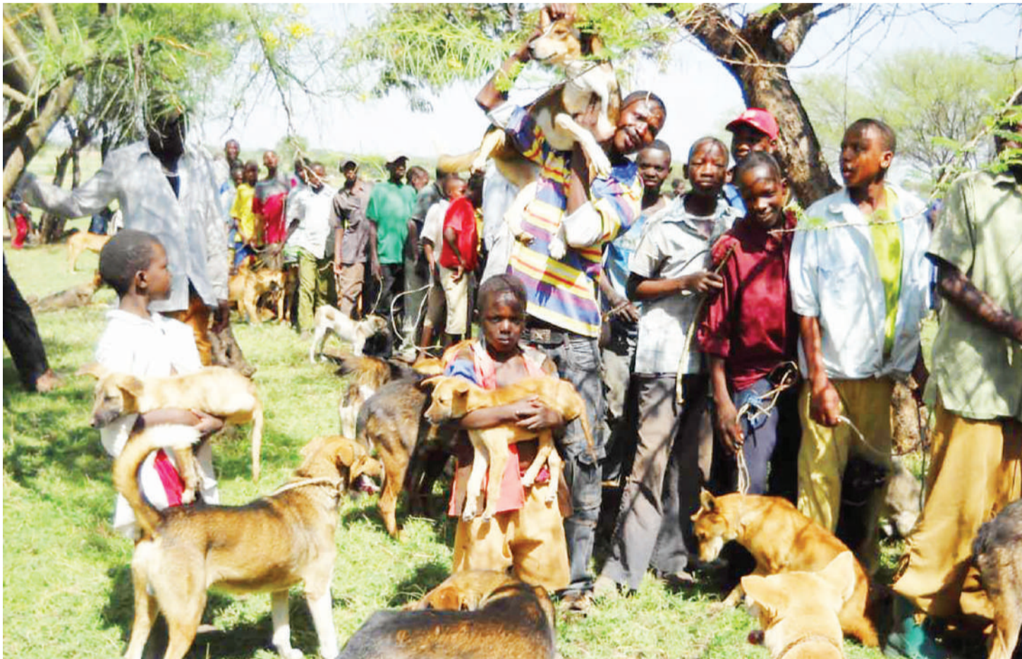
Wanakijiji wakiwapeleka mbwa wao kupatiwa chanjo, wilayani ya Serengeti.

• Aorodhesha dalili, madhara • Serengeti kinara wa ugonjwa • Si madaktari wote wanaijua