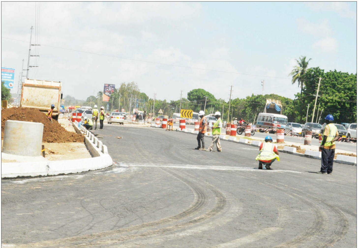
Mafundi wakiendelea na ujenzi wa upanuzi wa barabara ya Bagamoyo kuanzia Mwenge hadi Morocco, katika eneo la Sayansi Kijitonyama, jijini Dar es Salaam jana.

Alidai mwili wa marehemu umehifadhiwa kwenye chumba cha maiti katika Hospitali ya Rufani ya Mkoa hadi pale ndugu zake watakapokabidhiwa kwa ajili ya mazishi.