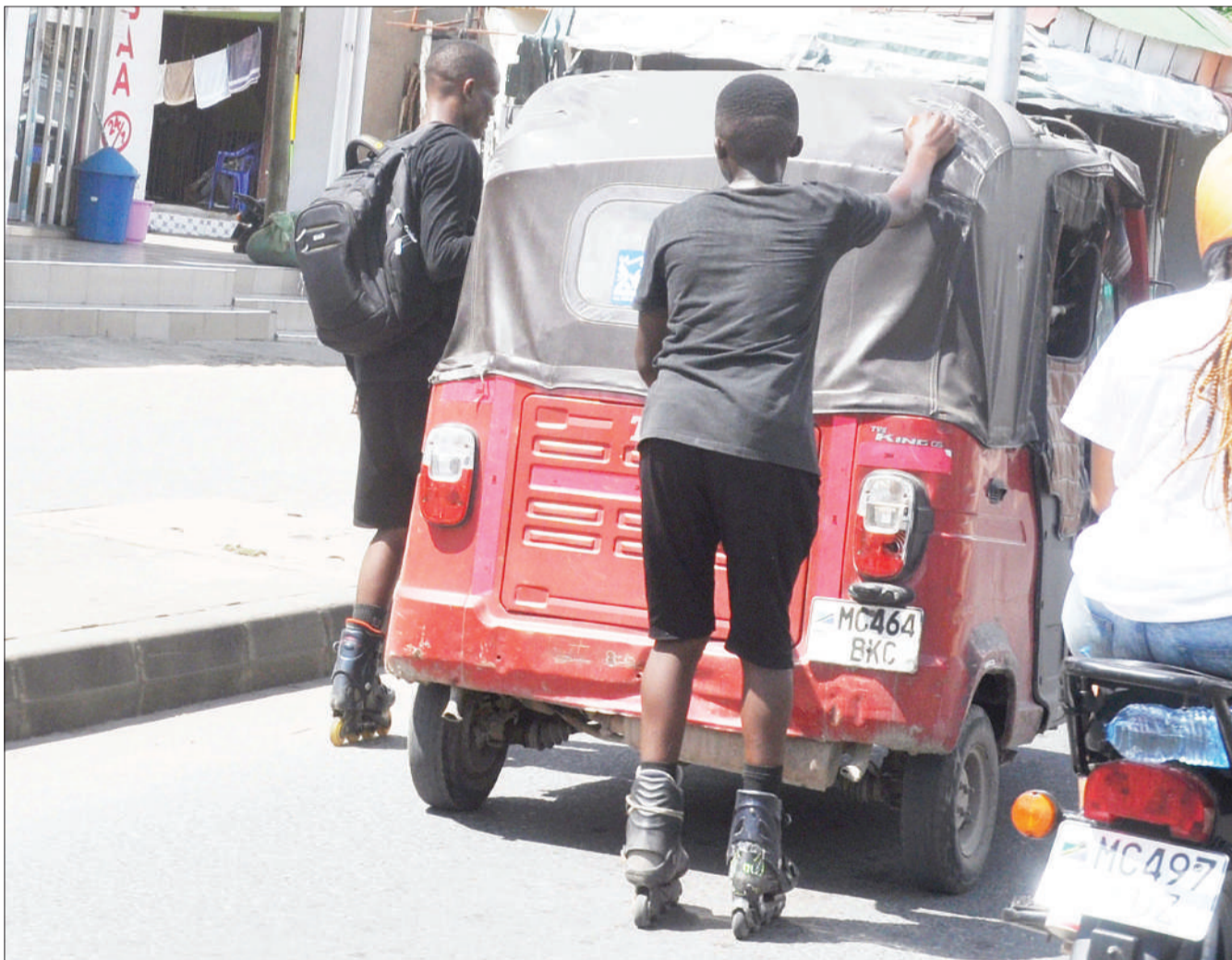
Vijana waliovalia viatu vya magurudumu, wakiwa wamedandia bajaji iliyoko kwenye mwendo katika Barabara ya Kawawa, eneo la Magomeni Morroco, jijini Dar es Salaam hivi karibuni kitendo ambacho ni hatari kwa usalama wao.