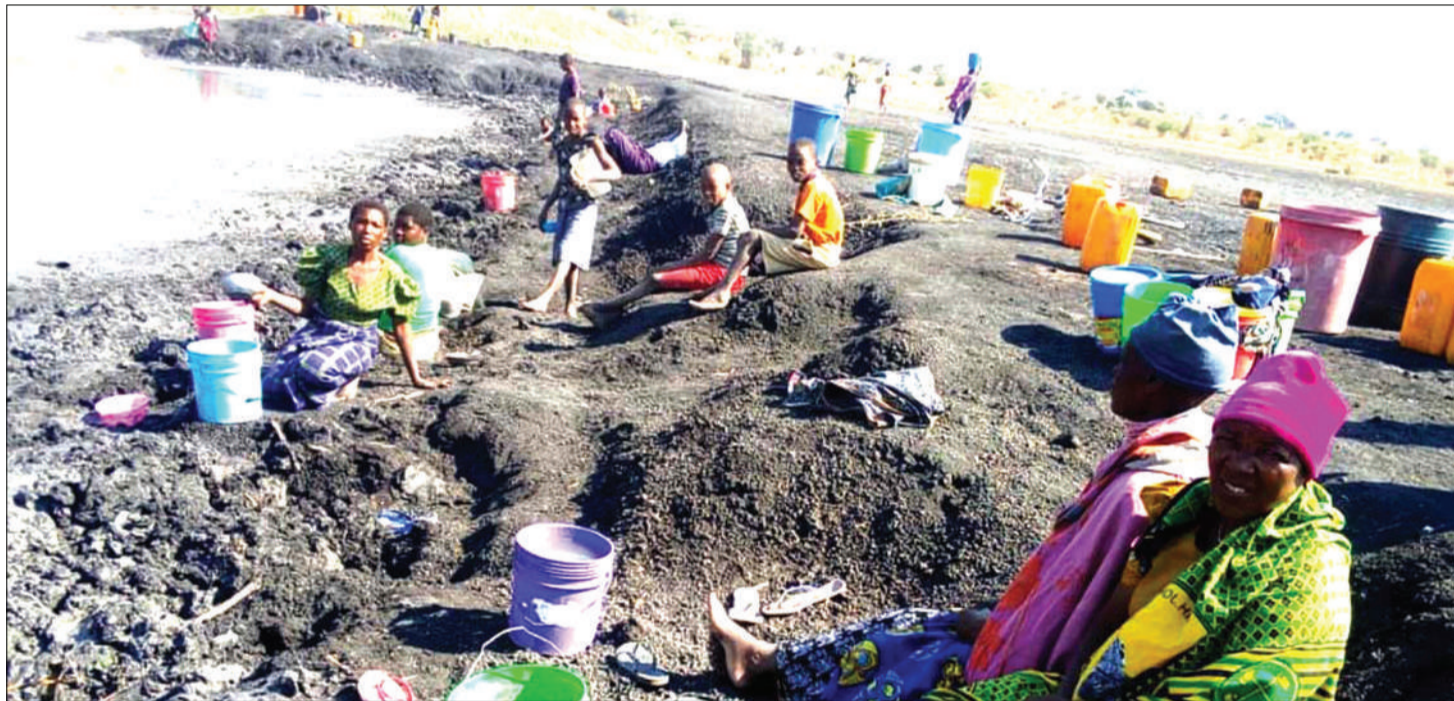
Wakazi wa Kijiji cha Kiloleli, Wilaya ya Kishapu mkoani Shinyanga, wakisubiri maji kwenye bwawa la kijiji hicho ambalo limeanza kukauka.

•Kukosa usingizi, kuchangia maji na mifugo, wanyama pori