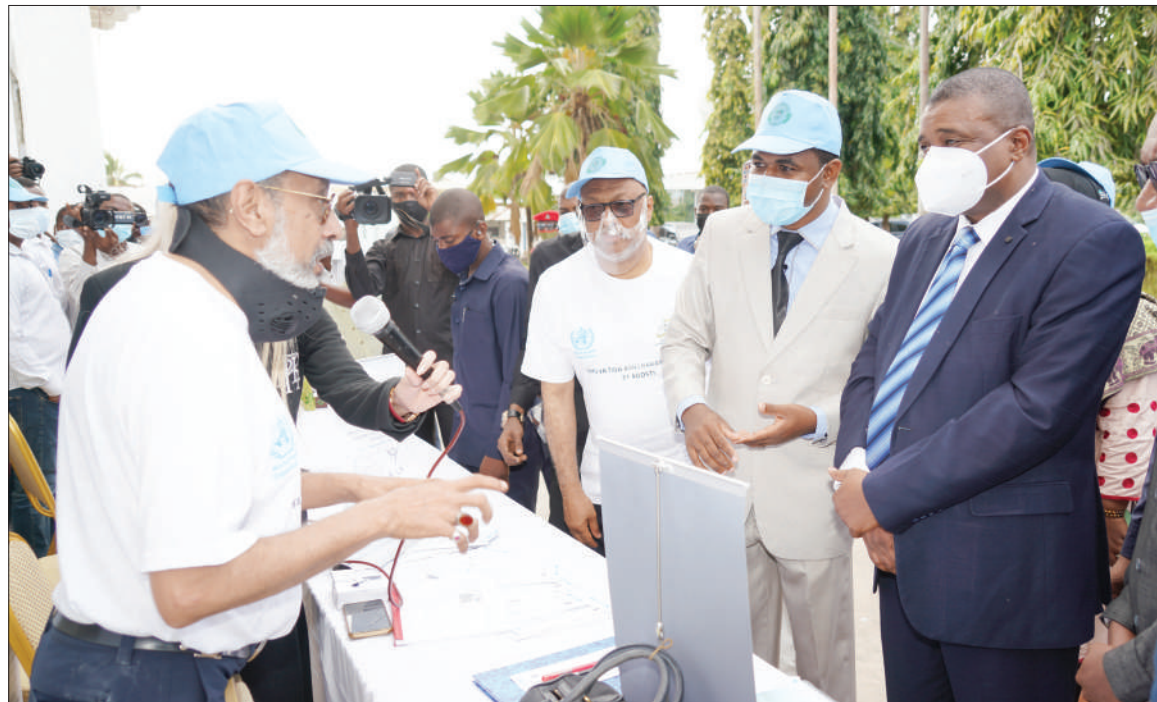
Makamu wa Pili wa Rais wa Zanzibar, Hemed Suleiman Abdulla (kulia), aki-pata maelezo alipotembelea maonyesho ya tiba za asili wakati wa maadhimisho ya 19 ya Siku ya Tiba Asili barani Afrika, mjini Unguja juzi.