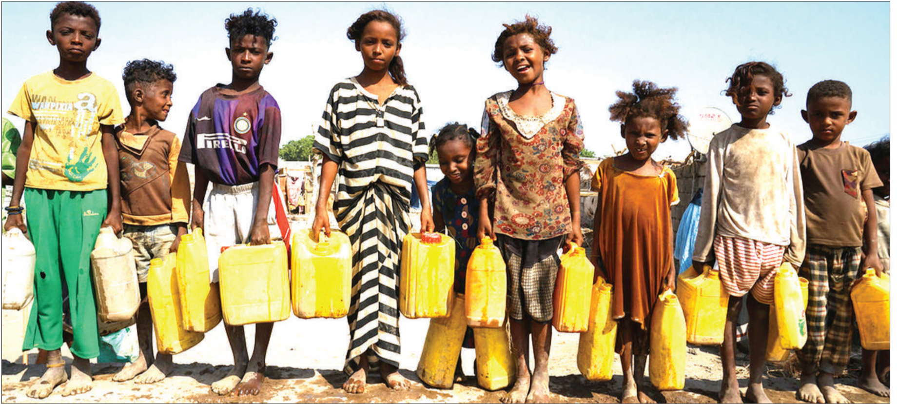
Watoto wakimbizi wakifuata maji kwenye kambi ya Aden, ambayo hutolewa mara mbili kwa siku.