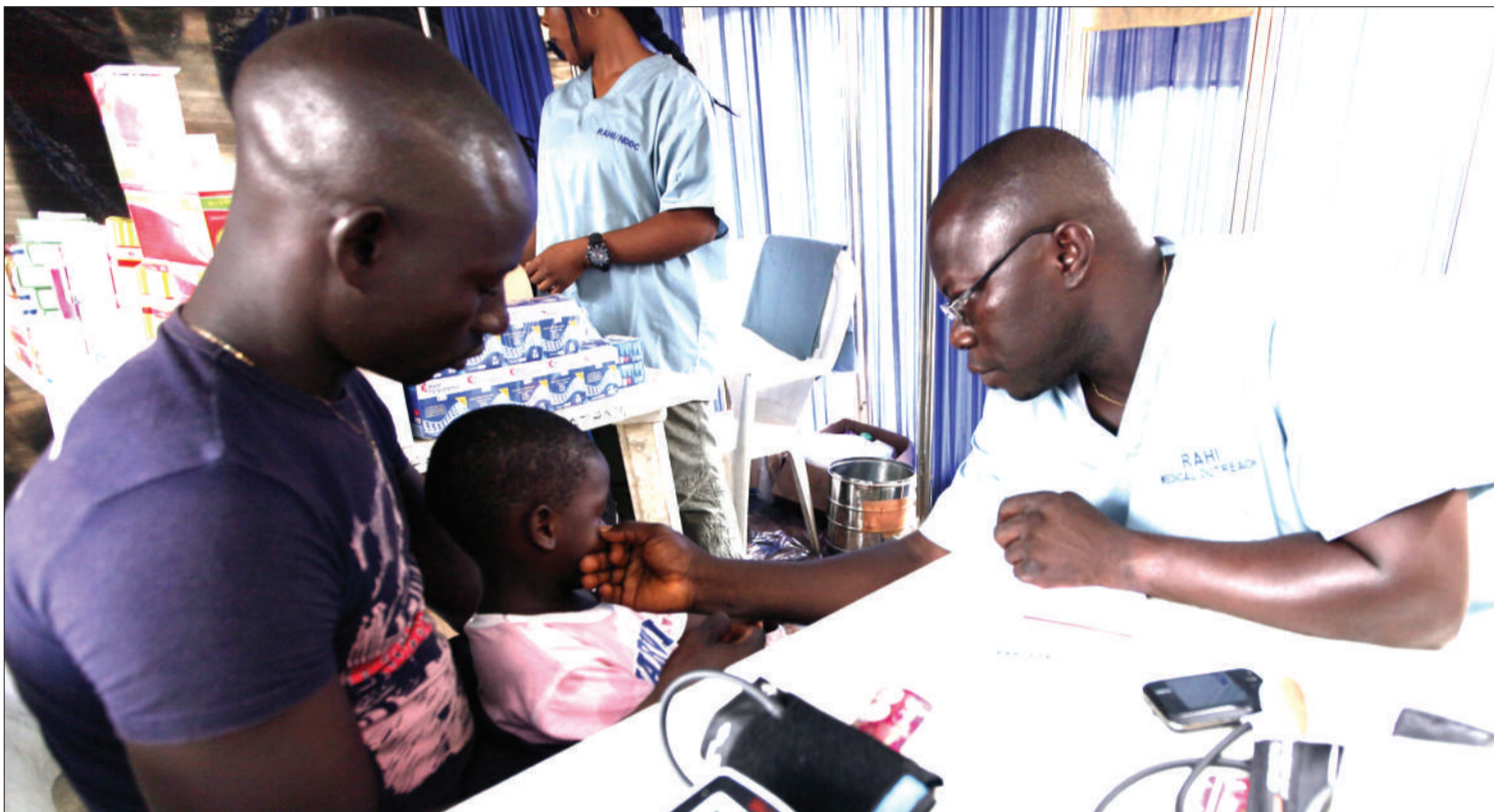
Kuwahi hospitalini na kutumia dawa kikamilifu ni mbinu ya kupunguza makali ya U.T.I sugu.