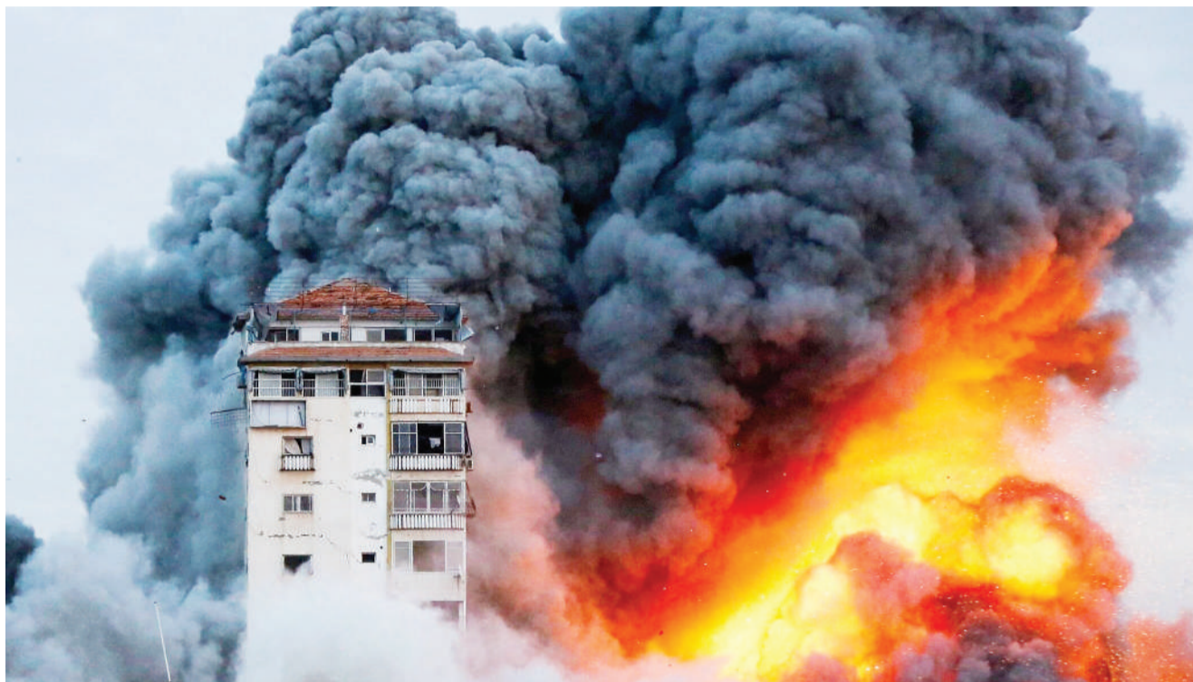
Anga la mji wa Gaza likitawaliwa na wingu zito la moshi wenye moto baaada ya ndege za Israel kuendelea kushambuliwa kwa siku tano mfululizo.

Mwanasheria Mkuu Leonard Manirakiza, alisema kuwa madai dhidi ya gavana huyo ni ya muda mrefu na uchunguzi dhidi yake unaendelea. BBC