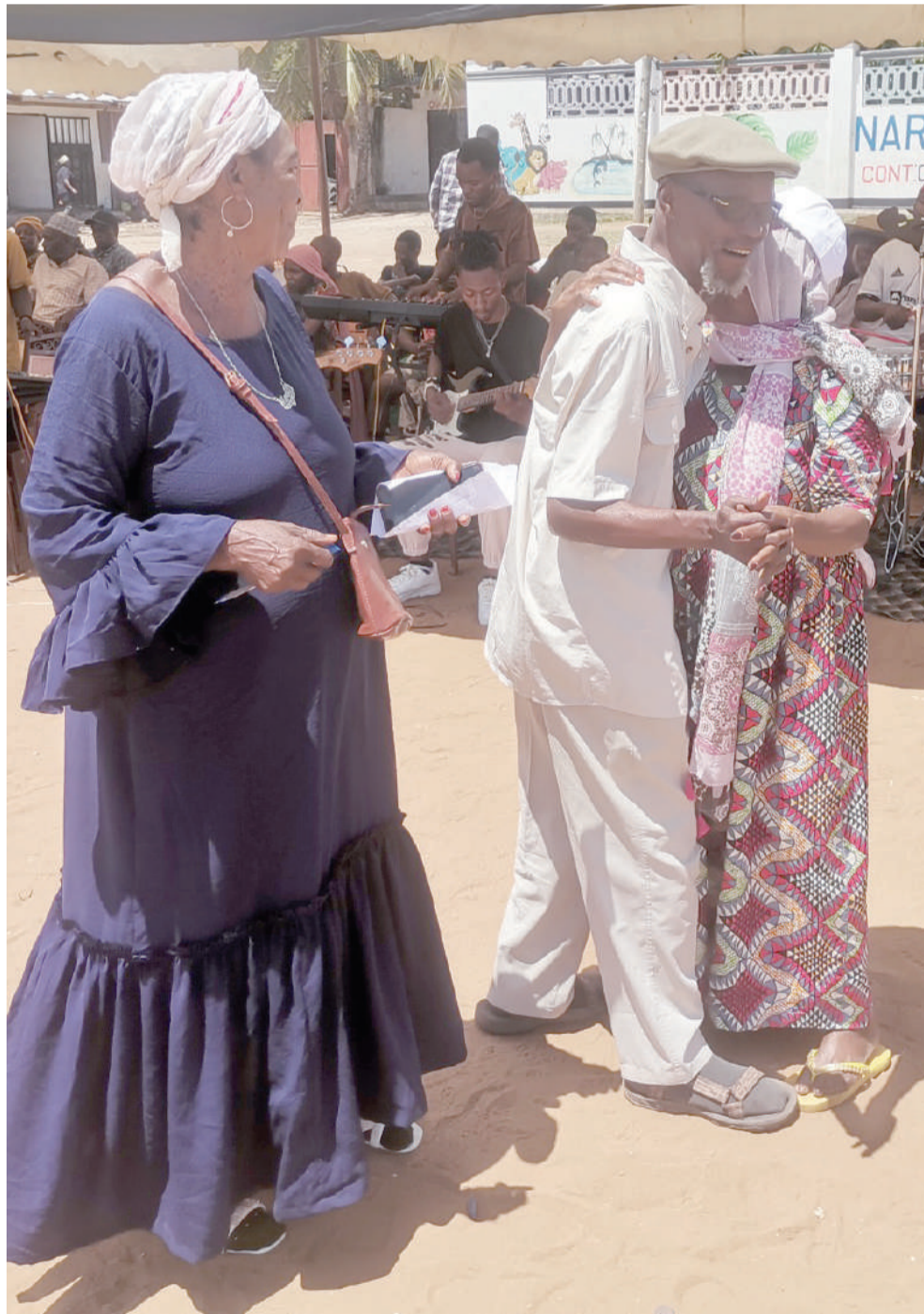
Baadhi ya wakazi wa Wilaya ya Kigamboni wakicheza muziki katika hafla ya maadhimisho ya Siku ya Wazee iliyofanyika kwenye Viwanja vya Mji Mwema, Dar es Salaam.