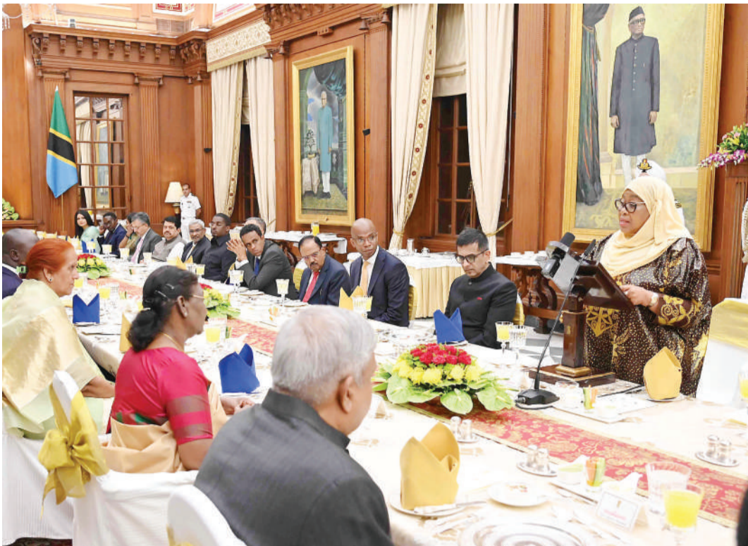
Rais Dk. Samia Suluhu Hassan, akizungumza katika dhifa ya kitaifa iliyoandaliwa na Rais wa India, Droupadi Murmu, Ikulu ya India jana.