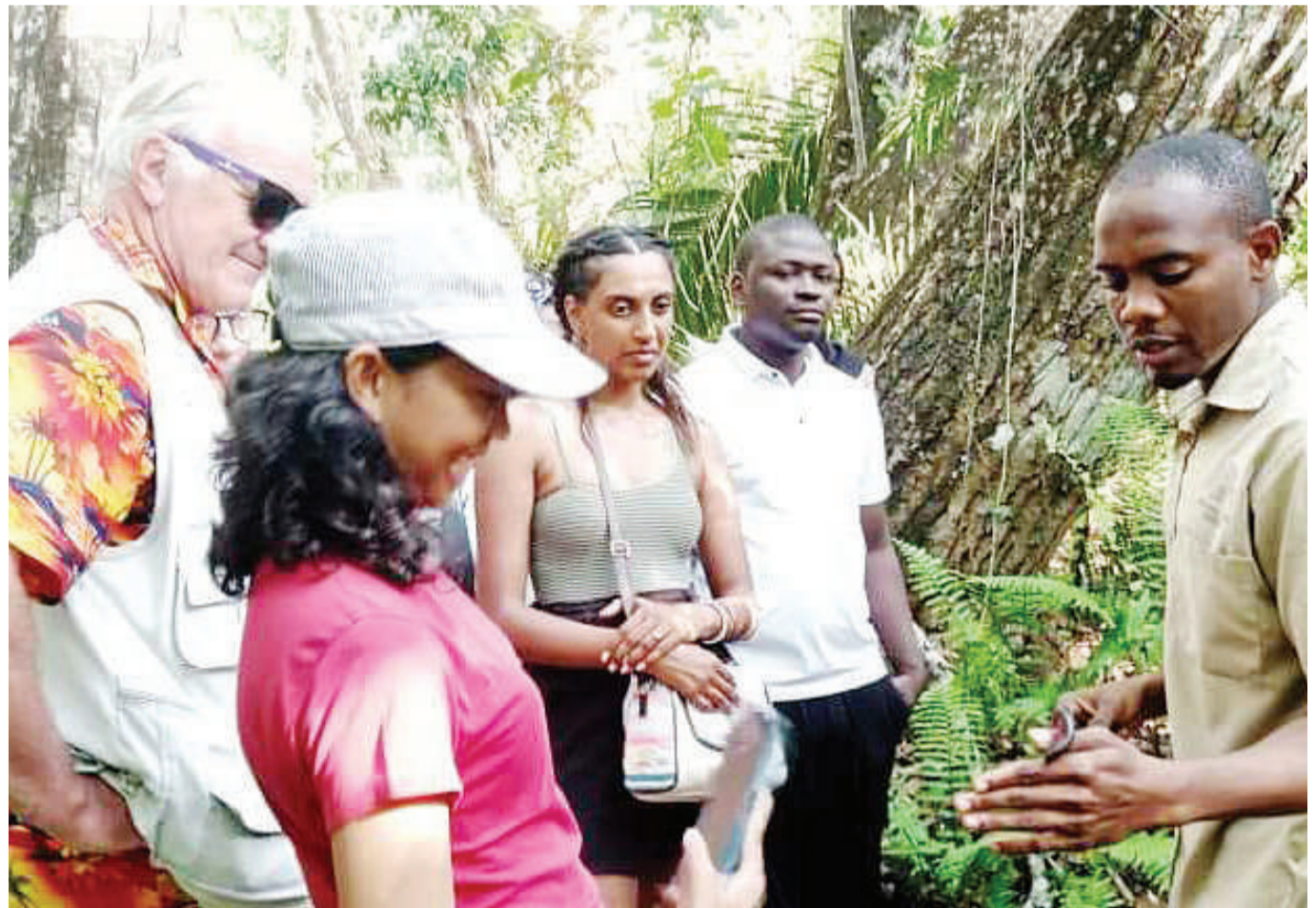
Mwongoza watalii katika Hifadhi ya Taifa ya Msitu wa Jozani (kulia), akionyesha watalii kiumbehai, walipotembelea hifadhini humo, Mkoa wa Kusini Unguja jana.

Alisema amejionea vivutio mbalimbali vya utalii vikiwamo, kima punju wanaopatikana katika Msitu wa Hifadhi Jozani, samaki aina ya pomboo wanaopatikana katika Bahari ya Hindi Kijiji cha Kizimkazi pamoja na Mji Mkongwe ambao ni urithi wa duniani.