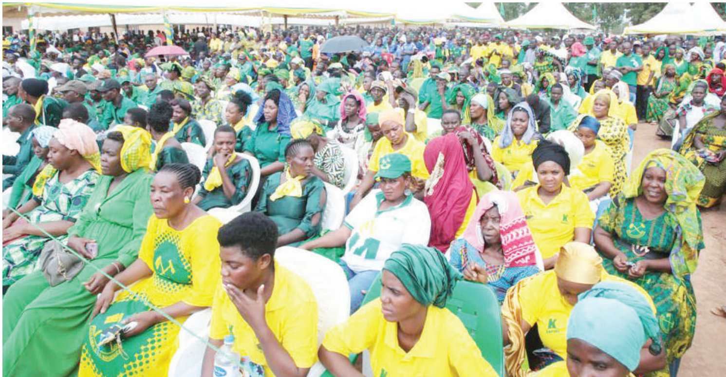
Umami uliokusanyika kumsikiliza.