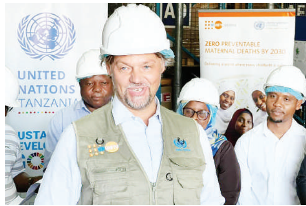
UNITED NATIONS TANZANIA

UNFPA inavyopambana kuishika mkono serikali udhibiti wa mimba