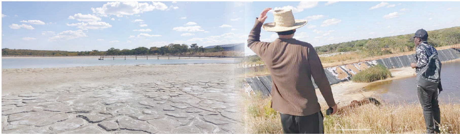
Wafanyakazi wa Kampuni ya Sunshine wakiangalia hali ya mabwawa yao ya tope sumu hivi karibuni.