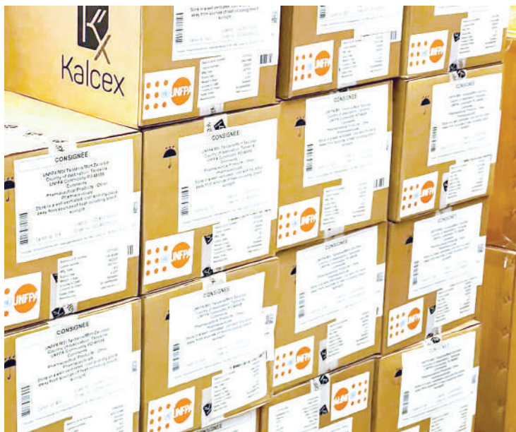
Baadhi ya vifaa vya uzazi wa mpango vilivyokabidhiwa kwa serikali, vikitolewa na Ubalizi wa Uingereza nchini na UNFPA, Ofisi ya Tanzania.

kuwashauri watu binafsi kwa usahihi na kwa umakinifu kuhusu chaguzi zao za kupanga uzazi na kukuza elimu ya kina ya kujamii-ana shuleni.