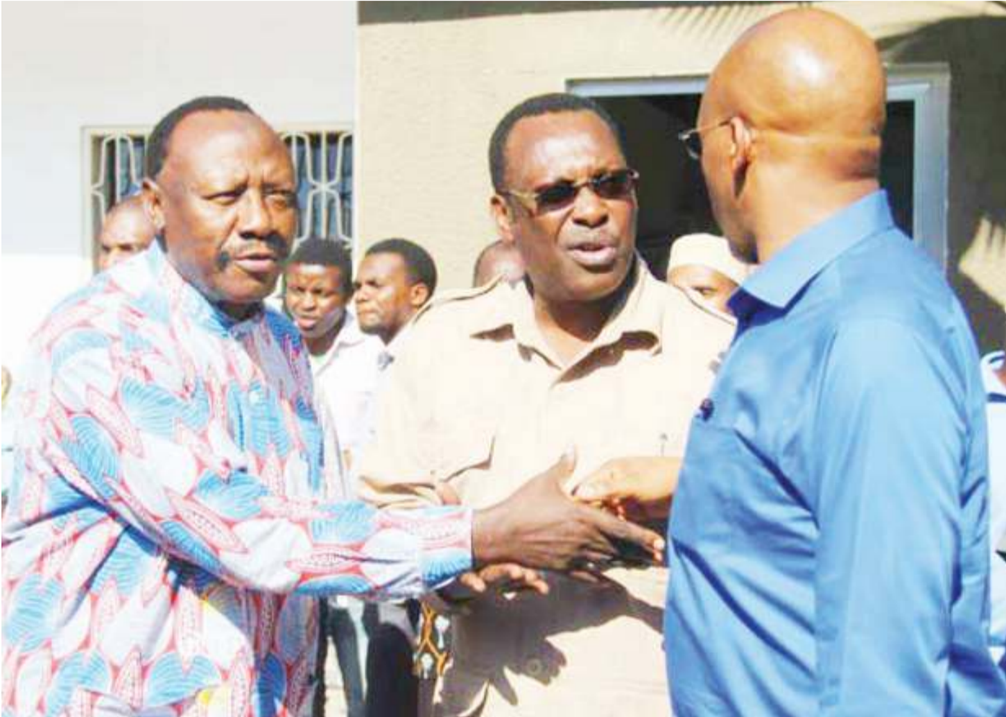
Viongozi wa vyama vya upinzani, Prof. Ibrahim Lipumba wa CUF (kulia), Freeman Mbowe (Chadema) na James Mbatia (NCCR Mageuzi), wakiwa kwenye moja ya harakati zao za kisiasa.