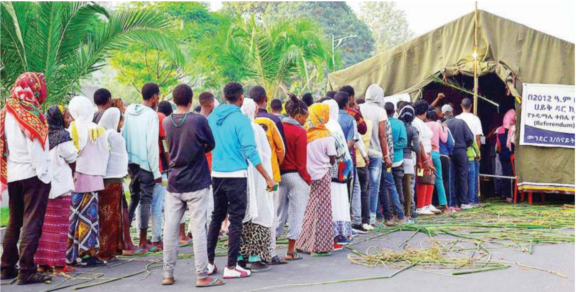
Wakazi wa Sidama katika moja ya kampeni za kupiga kura za kujipatia uhalali wa kuwa jimbo huru.