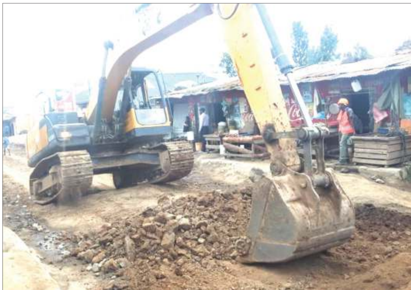
Kijiko cha kampuni ya ukandarasi kikiendelea na ujenzi wa barabara ya kuanzia Mama John hadi Mwakibete, jijini Mbeya juzi. Ujenzi huo, ukikamilika utasaidia kupunguza msongamano wa magari kwenye barabara kuu ya Tanzania na Zambia.

Alisema endapo wananchi watafuatilia na kuzielewa taarifa hizo na wakazingatia, wataepuka madhara ya radi pamoja na kufanya shughuli zao za uzalishaji mali kwa ufasaha.