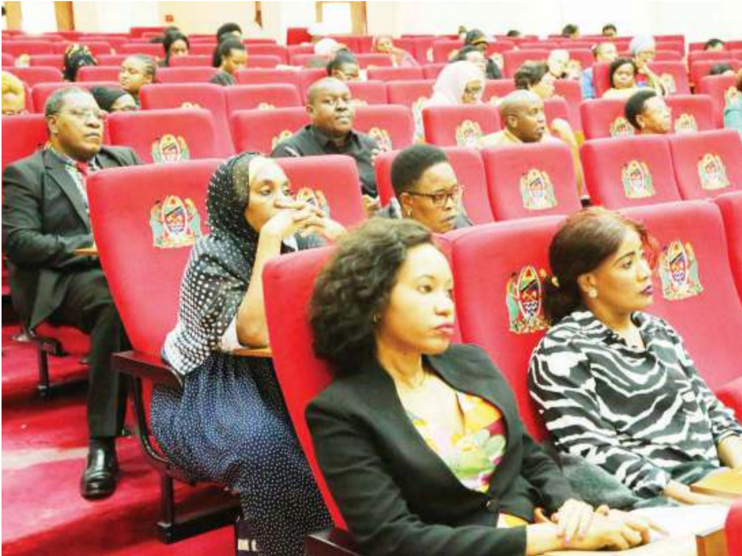
Baadhi wa wabunge wanawake wakifuatilia vikao vya bunge. Watafiti na watetezi wa haki za kinamama wanataka ushirikishwaji zaidi wa wanawake kwenye masuala ya uongozi kwa kuwa bado hawajapewa nafasi kama inavyostahili.