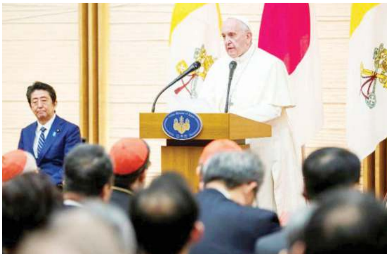
Papa akiwahutubiwa viongozi wa Japan na wanadiplomasia.

Alisema kuwa nyumba 22,000 zimeharibiwa na maporomoko ya ardhi na kati ya watu 80,000 na 120,000 wamesambaratika au kuathiriwa na mafuriko hayo. BBC