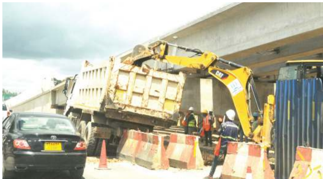
Mafundi wakiendelea na ujenzi wa barabara za mpishano (Ubungo Interchange), katika makutano ya Barabara za Morogoro, Mandela na Sam Nujoma, eneo la Ubungo, jijini Dar es Salaam jana.

Kaulimbiu ya maadhimisho hayo ni ‘Jamii ni chachu ya mabadiliko tuungane kupunguza maambukizi mapya ya VVU’.