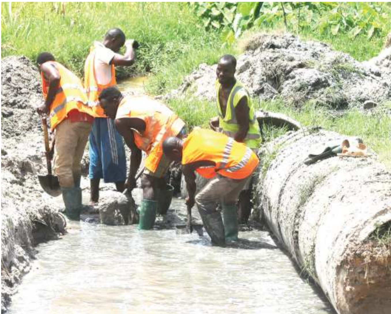
Mafundi wa kampuni ya ujenzi ya Nyanza Road, wakichimba mtaro kwa ajili ya kutoa karavati za zamani ili waweke mpya katika Barabara ya Kitunda, jijini Dar es Salaam jana.

Aidha, alieleza juhudi na mikakati ya Serikali ya Mapinduzi ya Zanzibar katika kuimarisha na kukuza uchumi wake ikiwa ni pamoja na kuimarisha sekta ya uwekezaji, viwanda sambamba na kuendeleza na kuimarisha sekta ya utalii ambayo inachangia kwa asilimia 27 ya Pato la Taifa la Zanzibar na asilimia 80 ya fedha za kigeni.