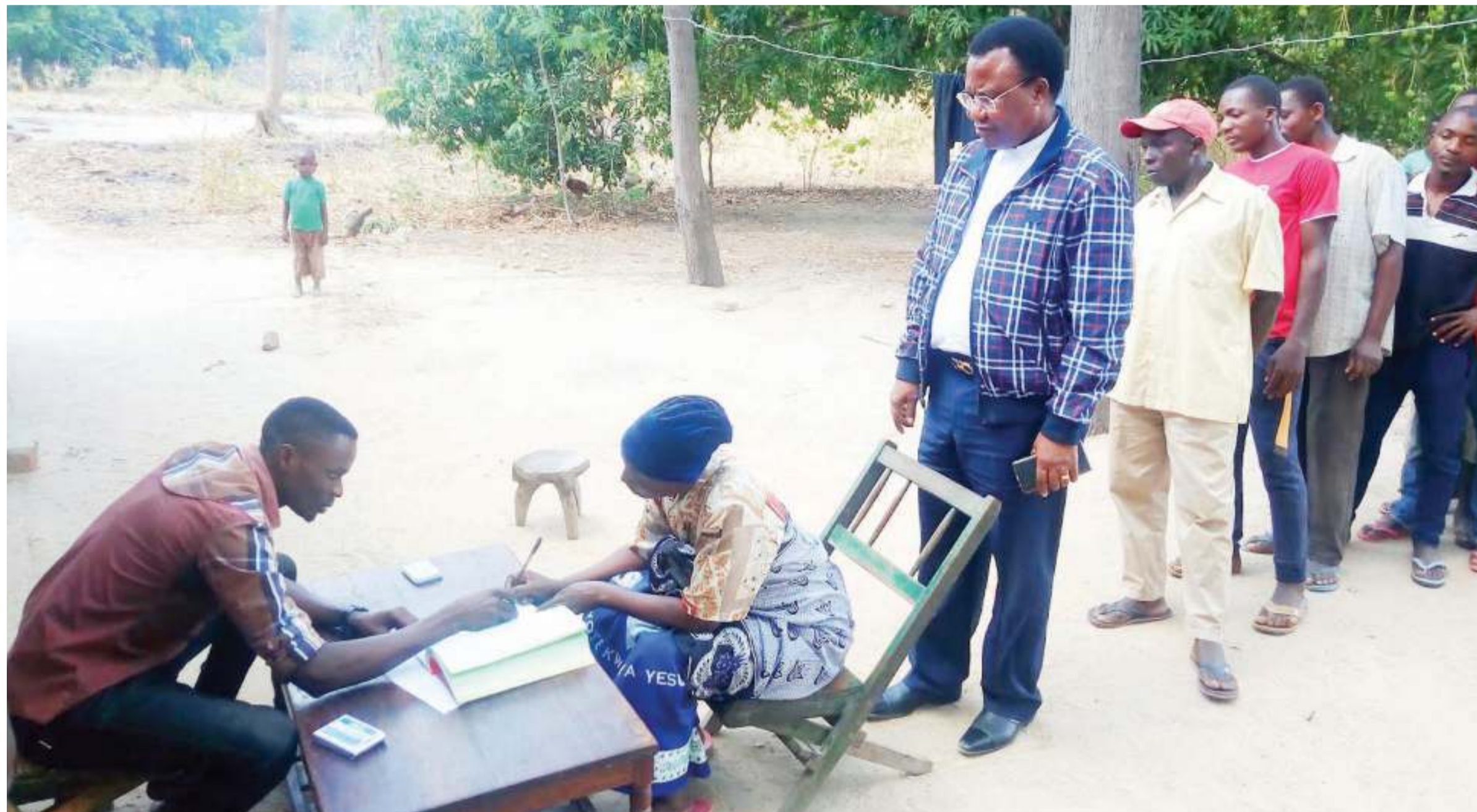
Viongozi na wananchi wakijiandikisha kupiga kura kwenye uchaguzi wa serikali za mitaa.

Kwa hiyo baada ya matokeo ya sasa wapinzani waanza kujiangalia