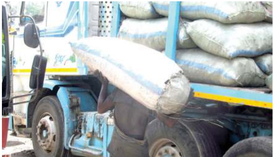
Mkazi wa jijini Dar es Salaam, akishusha gunia la mkaa kwenye lori, ili kujipatia ujira wa siku katika eneo la Soko la Mabibo juji.