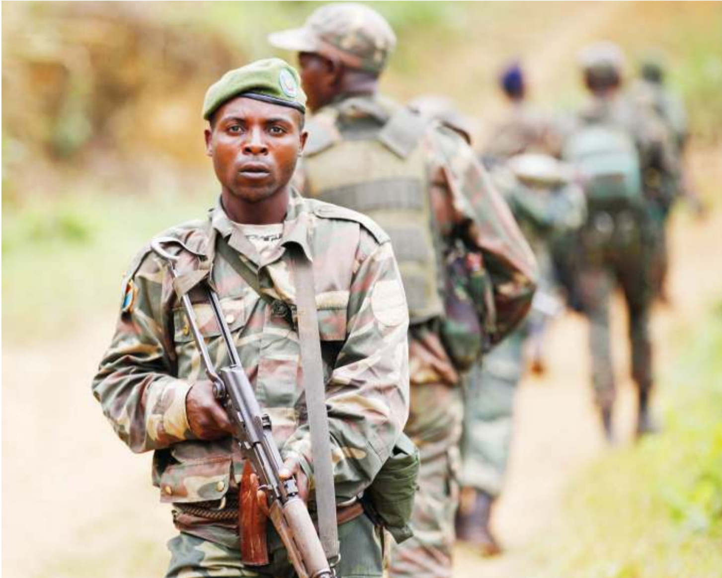
Wananchi wanaishi kwa wasiwasi muda wote kwa kuwa ndivyo waasi wanavyokuwa mitaani wakazunguka na silaha, hasa eneo la kaskazini mashariki mwa Congo.