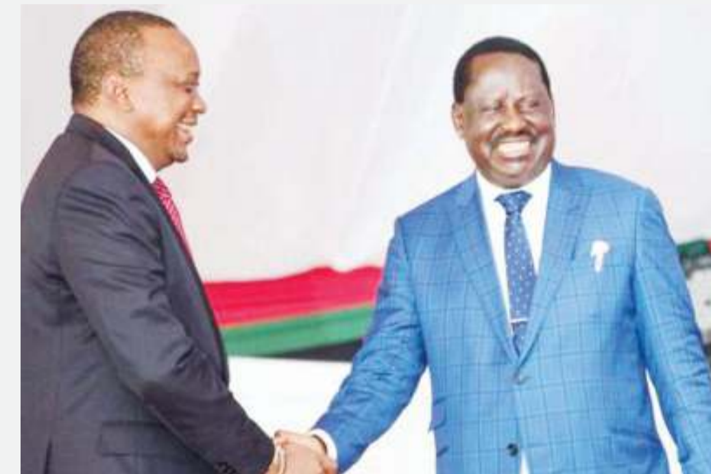
Wahusika wakuu BBI, Rais Kenyatta na Raila (kulia).