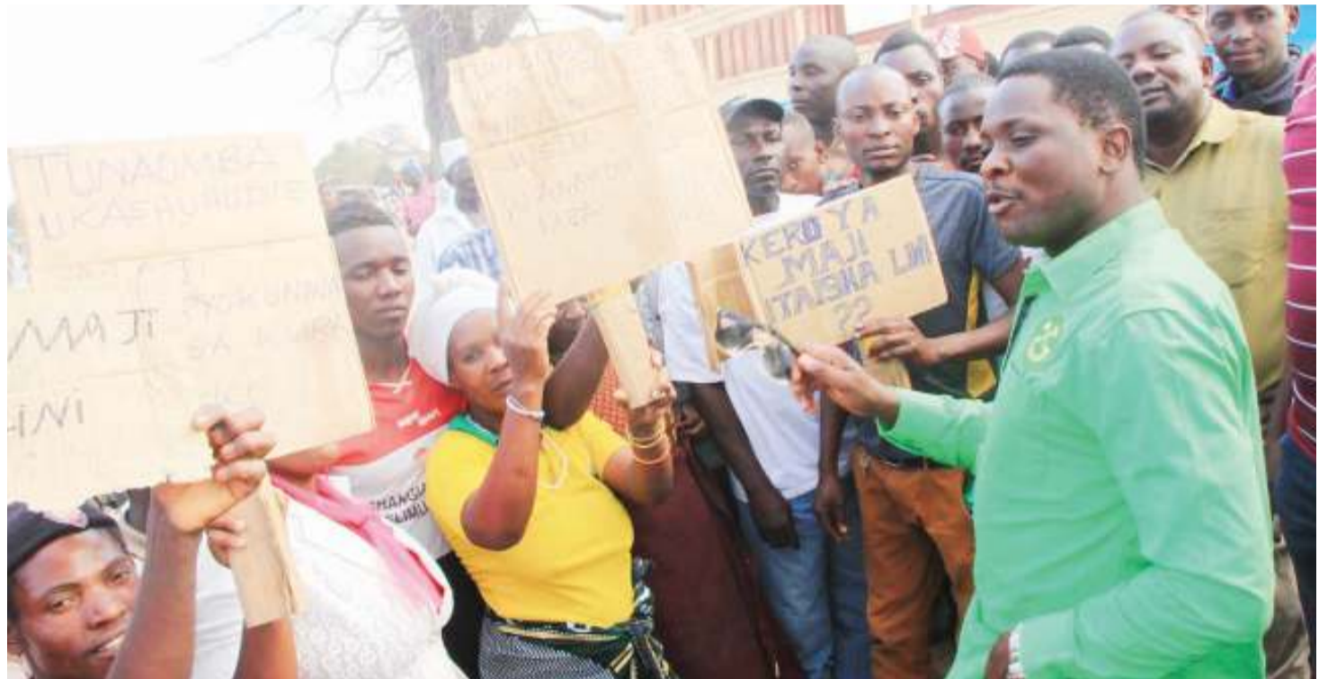
Mabango haya yanapeleka ujumbe wa aina mbalimbali kwa viongozi, lakini kama watendaji wangetimiza majukumu yao kikamilifu vilio vya shida ya maji vingetoweka.

Kwa ujumla kero kwenye mabango zipo katika uwezo wa viongozi wa maeneo haya kuzitatua.