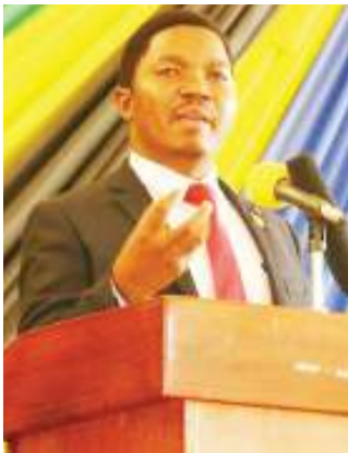
Ukurasa 14 Uchaguzi Serikali Mitaa ulivyoandika historia

Wanawake hawajaonekana kikamilifu kwenye uongozi