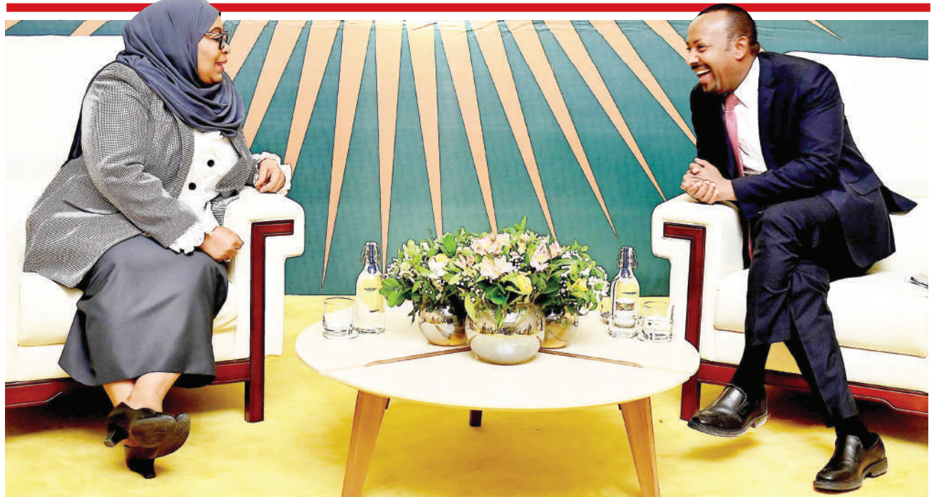
Rais Samia Suluhu Hassan akizungumza na Waziri Mkuu wa Ethiopia, Dk. Abiy Ahmed, Makao Makuu ya Umoja wa Afrika (AU) Addis Ababa, Ethiopia jana.

• Mwalimu adaiwa kunajisi mwanafunzi aliyemwita kuosha vyombo, apata ujauzito... Endelea ukurasa 4