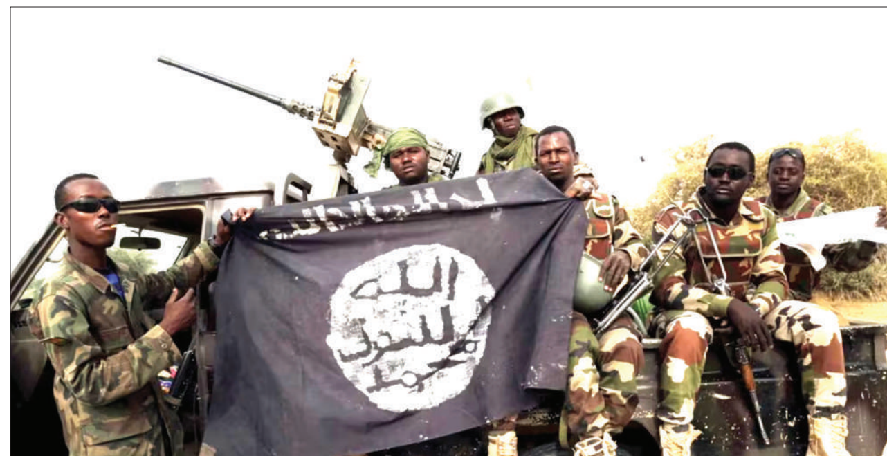
Wanajeshi wa Nigeria wakiwa wameshika bendera ya Boko Haram baada ya kuukomboha mji wa Damasak.