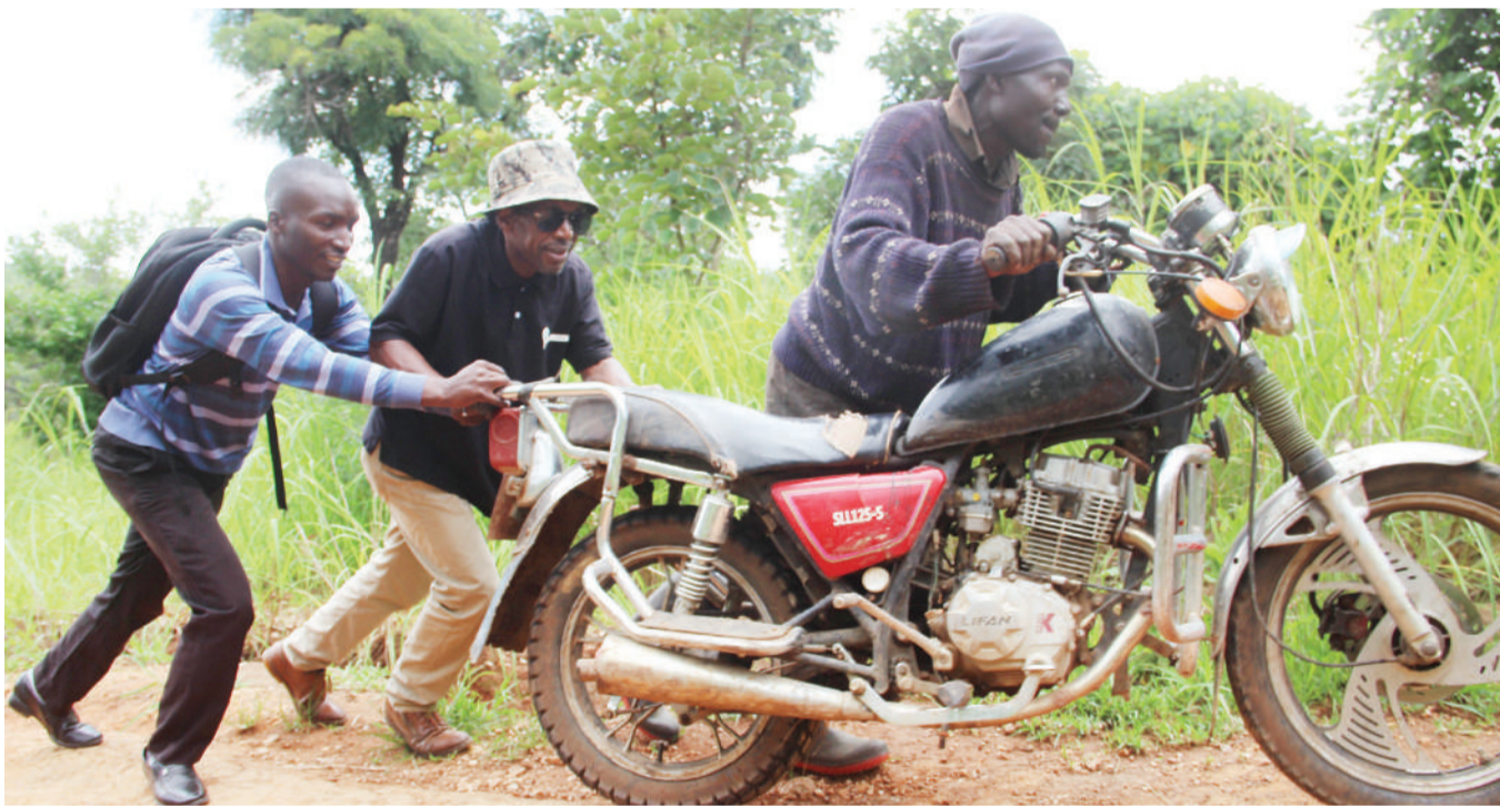
Wasamaria wema wakimsaidia dereva bodaboda kusukuma pikipiki yake baada ya kupata hitilafu kwenye moja ya milima iliyoko Kata ya Ileya Halmashauri ya Wilaya ya Mbeya mwishoni mwa wiki.

Aliwataka wakaguzi wa jeshi hilo kuhakikisha wanazingatia weledi wakati wa kukagua magari hayo na kuhakikisha magari yote yanayobainika kuwa na hitilafu yanaitishiwa safari mpaka yatengenezwe.