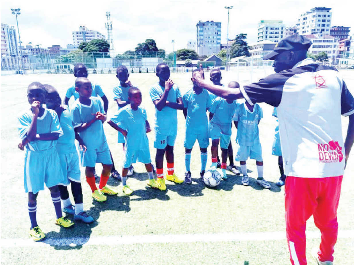
Kocha wa timu ya vijana (jina lake halikupatikana) akitoa maelekezo kwa wachezaji chipukizi wanaolelewa katika Kituo cha Michezo cha JMK Park kilichoko jijini Dar es Salaam hivi karibuni.

Matokeo hayo yanaifanya Tabora United kuendelea kujichimbia nafasi ya tano, iki-fikisha pointi 28, huku Namungo ikibaki na pointi zake 17, ikiwa nafasi ya 12.