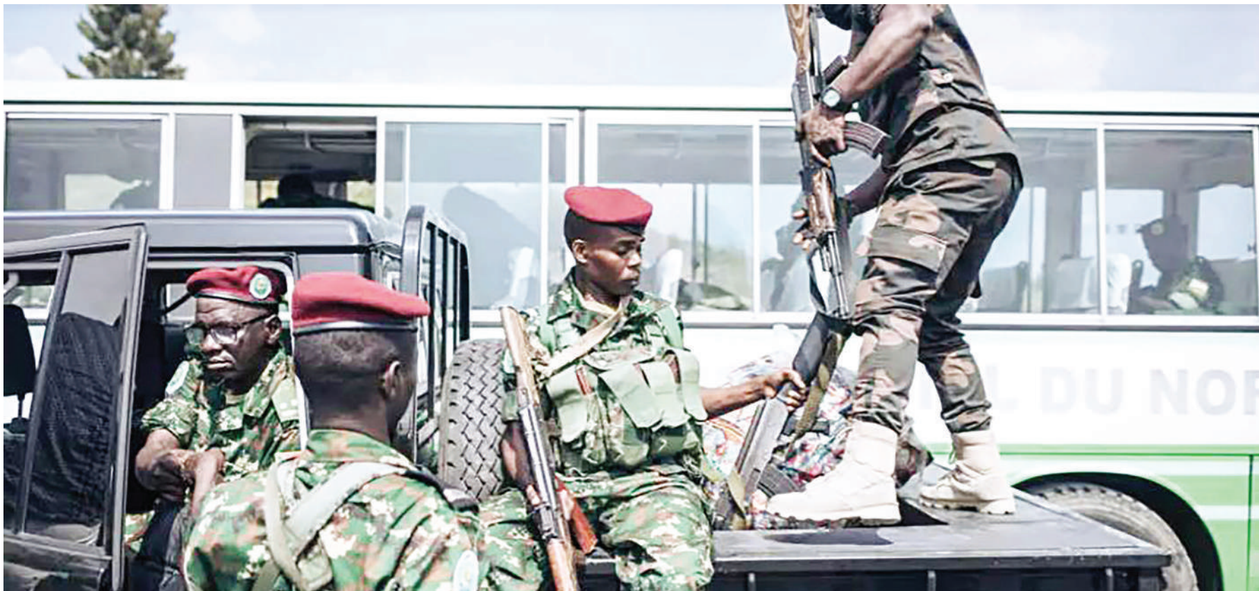
Wanajeshi wa Burundi wakiwa nchini DRC kukabiliana na waasi wa M23.