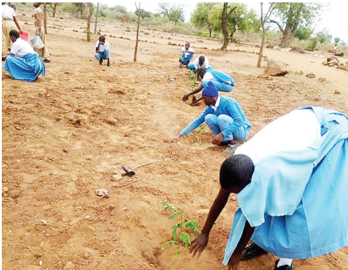
Baadhi ya wanafunzi wa Shule ya Sekondari Ewong'on, Kijiji cha Kambi ya Chokaa, Kata ya Naisinyai, wilayani Simanjoro, mkoani Manyara, wakipanda miche ya miti kwa ajili ya kutunza mazingira ya eneo hilo.