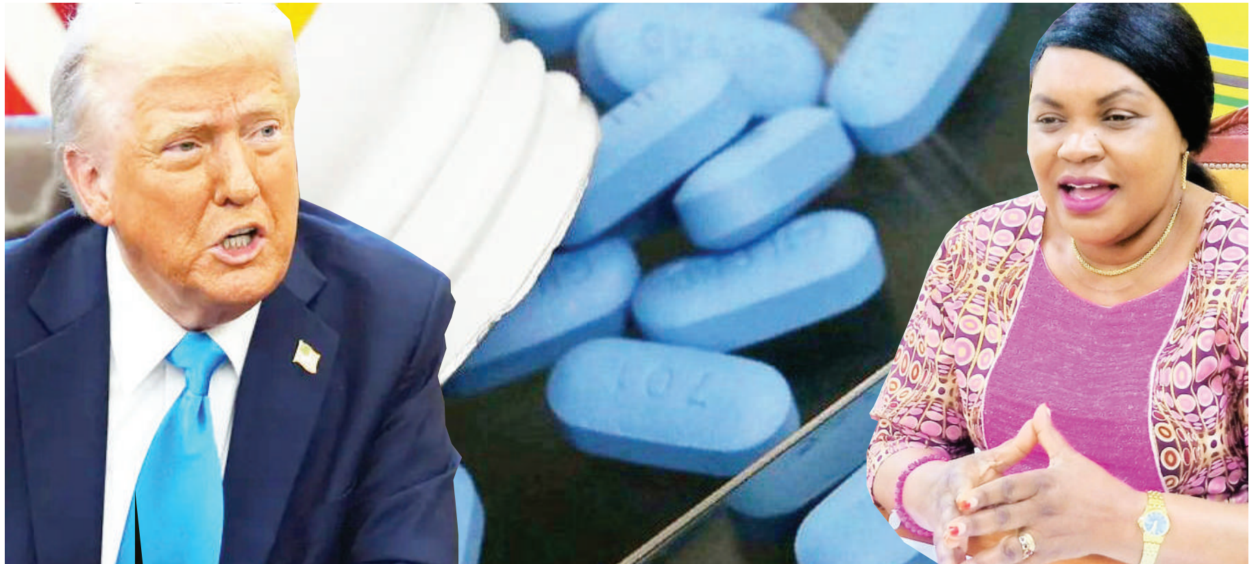
Rais wa Marekani, Donald Trump

• Watumiaji ARV sasa kununua ... Endelea Ukurasa 2