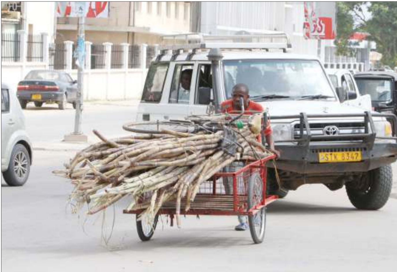
Masukuma mkokoteni ambaye jina lake halikupatikana akiwa katikati ya Barabara ya Nyerere jijini Dodoma jana, huku waendesha magari wakijaribu kumkwepa jambo ambalo linahatarisha usalama wake.