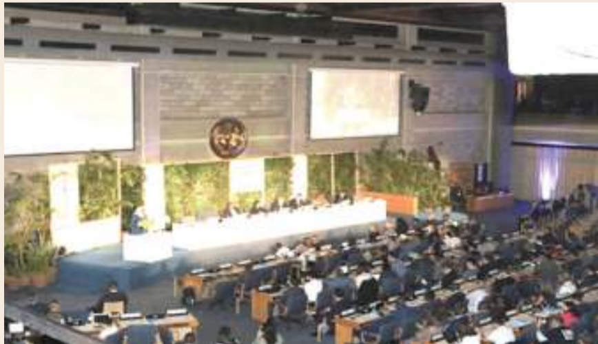
Wajumbe wa Mkutano wa Nne wa Mazingira wa Umoja wa Mataifa, jijini Nairobi, Kenya juu.

iliyopita, dunia imeshuhudia maafa mbalimbali, yakiwamo mafuriko makubwa na ukame, ambayo yamesababisha vifo vingi vya watu duniani.