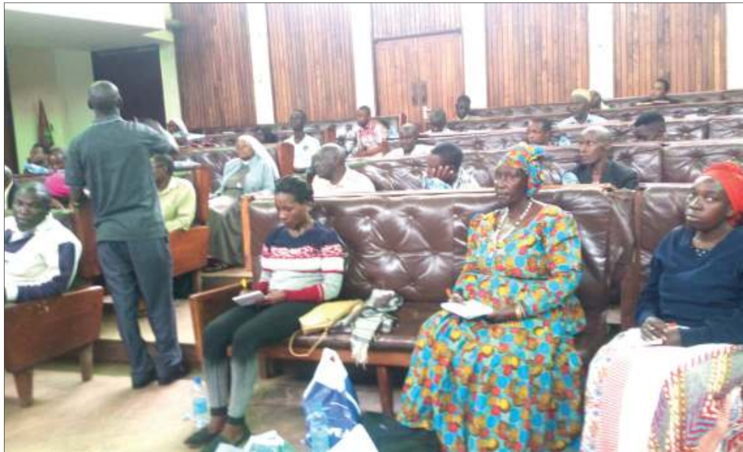
Baadhi ya wajasiriamali wa kusindika vyakula na vipodozi, wakipata elimu ya namna ya kuboresha bidhaa zao, kutoka kwa wataalam wa TFDA, katika ukumbi wa Halmashauri ya Wilaya ya Bukoba, mkoani Kagera.