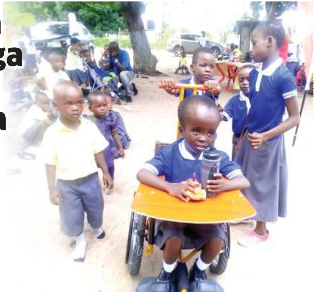
Mtoto mlemavu asiweza kutembea, akiwa katika kiti cha mazoezi.

Miya anasema mbali na Mkuranga, shirika lao linafanya kazi pia katika mikoa ya Mbeya, Njombe na Manyara, ambako wanatoa huduma kwa watoto hao wenye