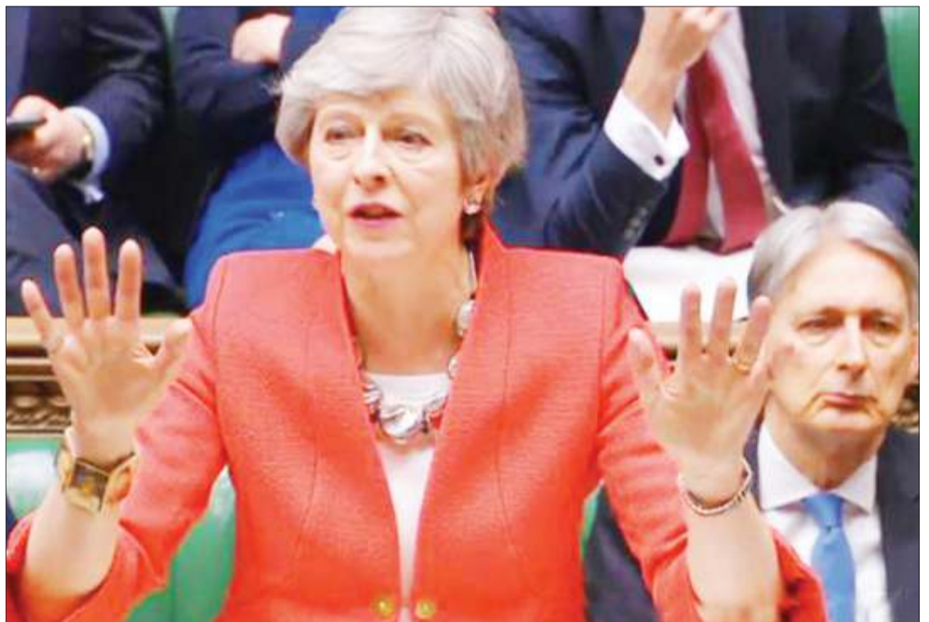
Waziri Mkuu wa Uingereza, Theresa May, ambaye amekuwa mstari wa mbele kutaka Uingereza kujiiondoe kwenye Umoja wa Ulaya (EU).

Waathirika hao ni kutoka nchi tofauti 35 ikiwa ni pamoja na wafanyakazi 22 wa UN waliokuwa wakielekea Nairobi kwa mkutano mkuu wa mazingira (UNEA), bendera kwenye ofisi za umoja huo zilipepea nusu mlingoti. VOA