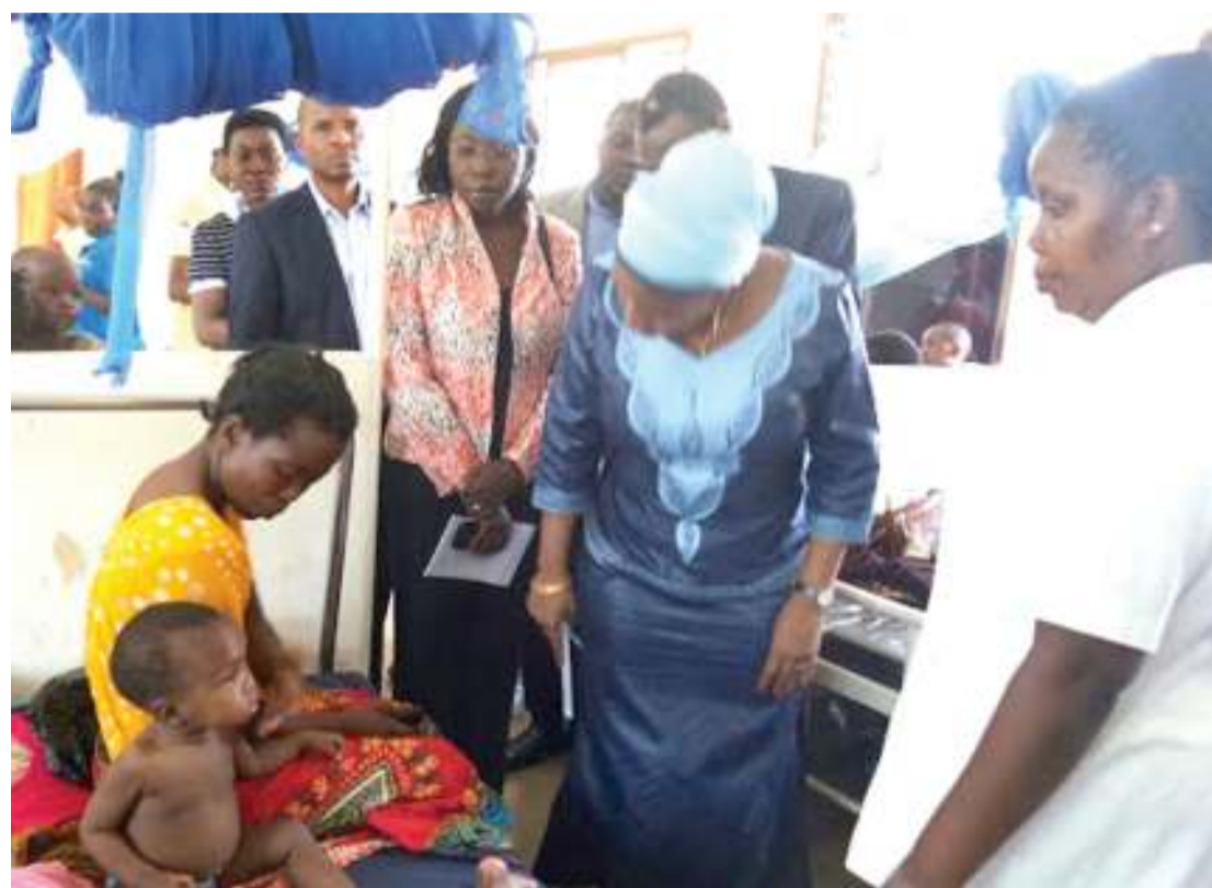
Waziri wa Afya, Maendeleo ya Jamii, Jinsia, Wazee na Watoto, Ummu Mwalimu, katika moja ya ziara zake katika Hospitali ya Rufani Mwananyamala.

Ntuli anasema, kuna umuhimu mkubwa kwa makundi mbalimbali katika jamii kujenga tabia ya kusaidia watu na makundi yenye