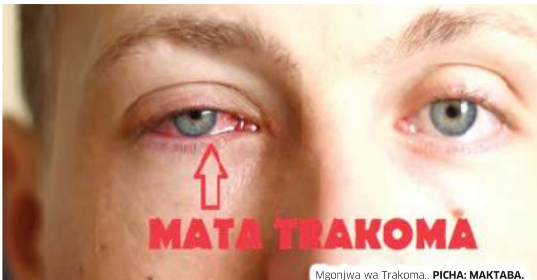
Mgonjwa wa Trakoma..