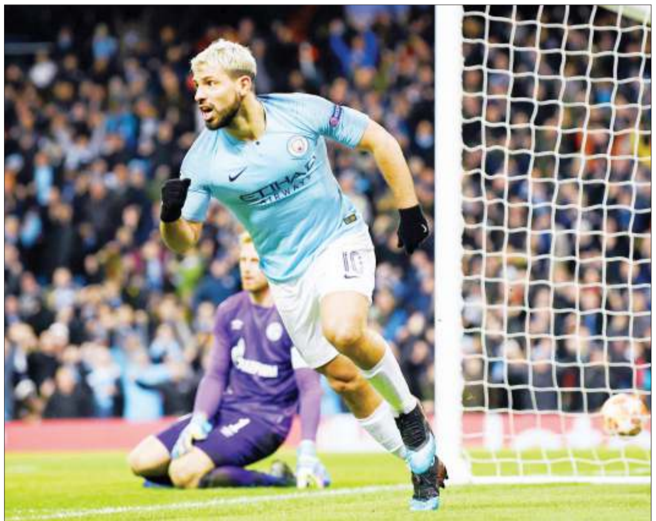
Sergio Aguero akishangilia baada ya kuifungua Man City bao la pili wakati ikishinda 7-0 dhidi ya Schalke kwenye mechi ya mkondo wa pili ya hatua ya 16-bora ya Ligi ya Mabingwa Ulaya iliyopigwa Uwanja wa Etihad juzi. City imesonga mbele kwa jumla ya mabao 10-2.

Yanga yenye pointi 67 wako kileleni katika msimamo wa ligi hiyo inayotoa mwakilishi wa Tanzania Bara katika mashindano ya kimataifa ya Ligi ya Mabingwa Afrika kila mwaka ambayo yanaandaliwa na Shirikisho la Soka Afrika (CAF).