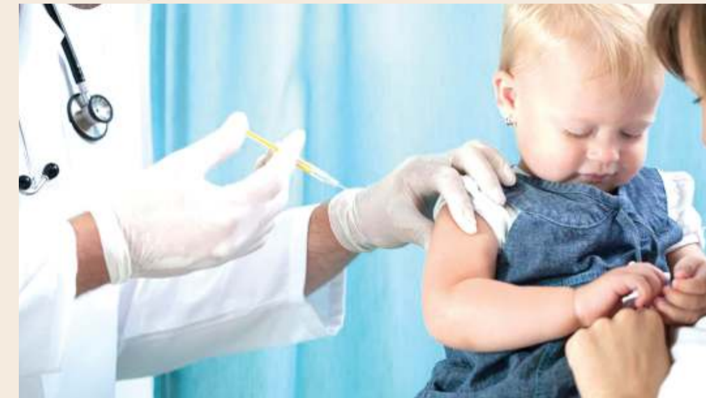
Huduma ya chanjo kwa watoto nchini Italia.

N CHINI Italia kumetangazwa iwapo atatokea mtoto yeyote ambayeb hajakamilisha chanjo zake, ni wazazi na walezi wao watakumbwa na msukosuko wa kisheria, wa kutotimiza agizo hilo ambalo ni lazima kutekelezwa.