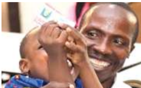
Mzazi akiwa na mwanawe wakifurahia kuwa na huduma ya bima ya afya.