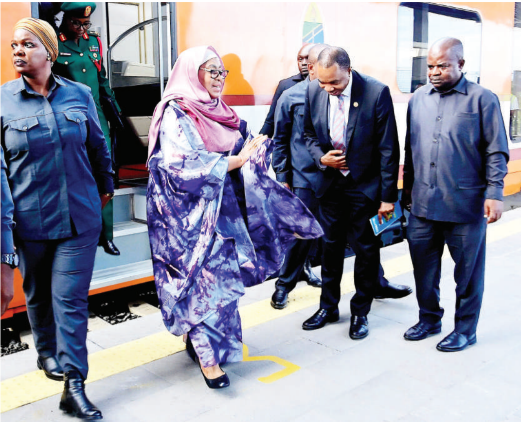
Rais Dk. Samia Suluhu Hassan akiwasili katika Stesheni ya Dar es Salaam jana, akitokea mkoani Dodoma kwa usafiri wa treni ya umeme (SGR).