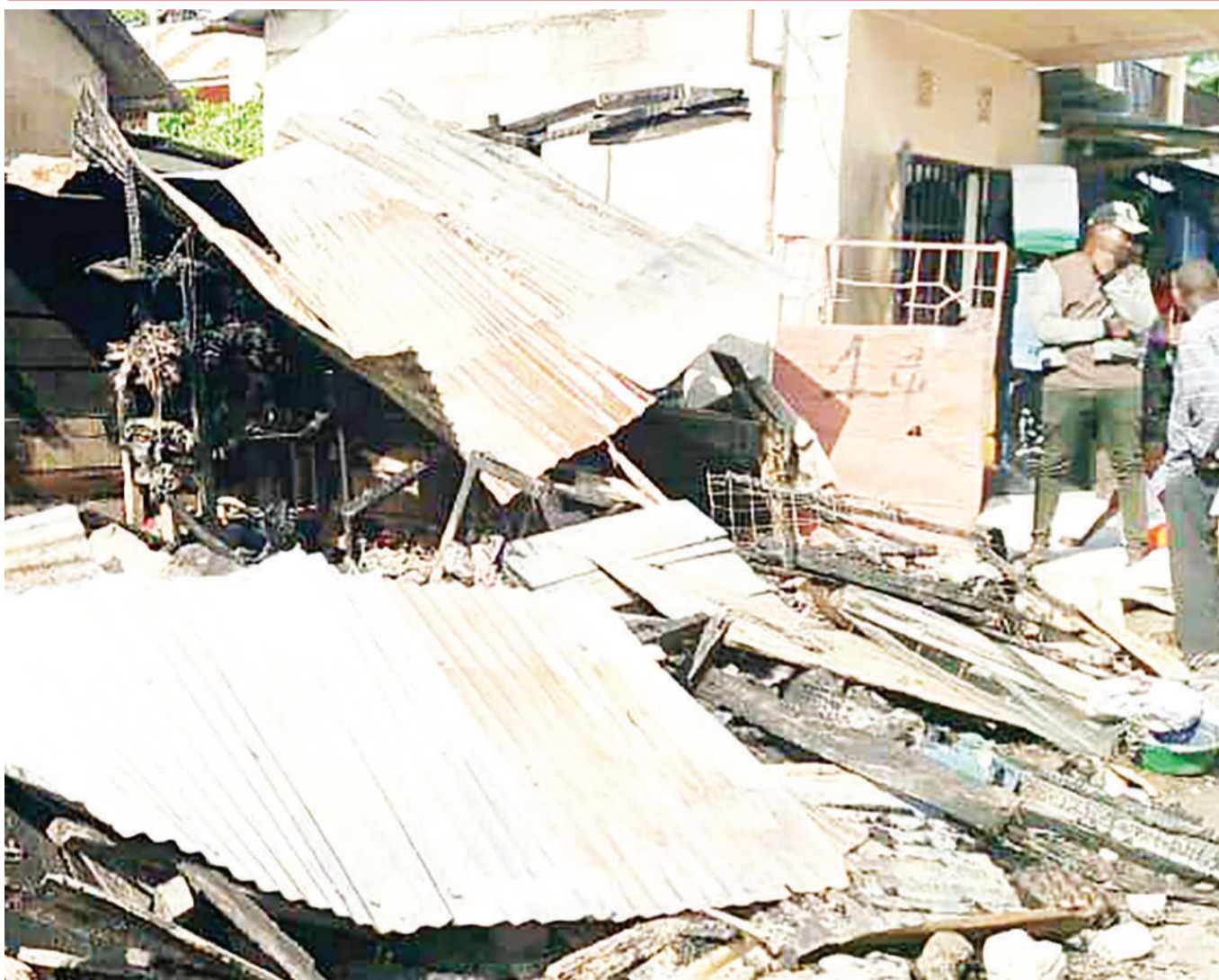
Baadhi ya wakazi wa Mji mdogo wa Mirerani, wilayani Simanjiro, mkoani Manyara, wakiangalia kibanda cha biashara kilichoteketeka kwa moto juzi na kusababisha hasara.

Tulipata msaada wa Serikali ya Japa, na fedha nyingine zilitolewa na Halmashauri yetu kukamilisha mradi huo, ingawa haujakamilika sawa sawa. Ilijengwa zahanati ya kisasa pale yenye thamani ya zaidi ya shilingi milioni 300 na kitu hivi,” alisema.