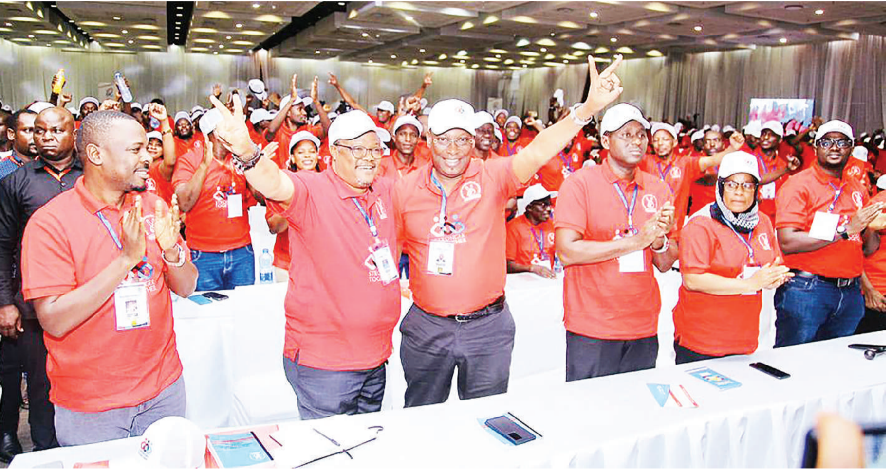
Mwenyekiti Mpya wa Chadema Taifa, Tundu Lissu na Mwenyekiti aliyemaliza muda wake, Freeman Mbowe, wakionyeshwa alama ya vidole viwili wakati wa mkutano mkuu wa uchaguzi wa chama hicho, jijini Dar es Salaam mapema wiki hii.