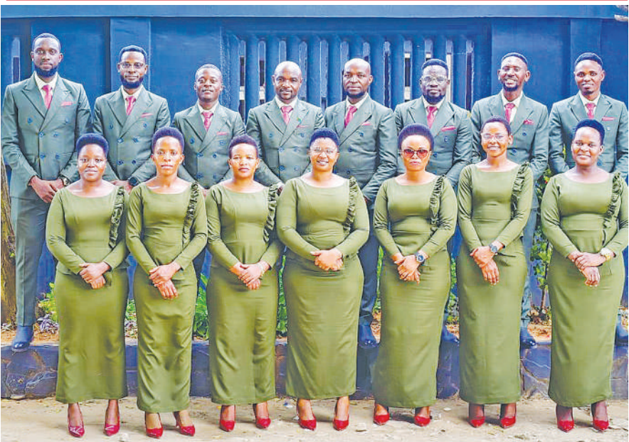
Baadhi ya waimbaji wa kwaya ya Gethsemane ya kanisa la SDA Kinondoni jijini, Dar es Salaam.

Wale wote watakao hitaji kujiunga na kozi tajwa hapo juu wanatakiwa kutuma maombi yao kwa kutumia anuani ya Posta au barua pepe zilizotolewa hapa chini au wanaweza kupiga simu kwa kutumia namba zilizotolewa kwa kupata maelezo zaidi.