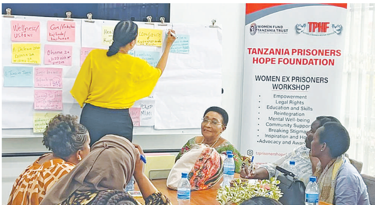
Namna darasa la waliotoka gereza lilivyoendelea.

Hiyo inatajwa, ili kuwaridhisha wanadamu pamoja na ndugu zako na moja ya