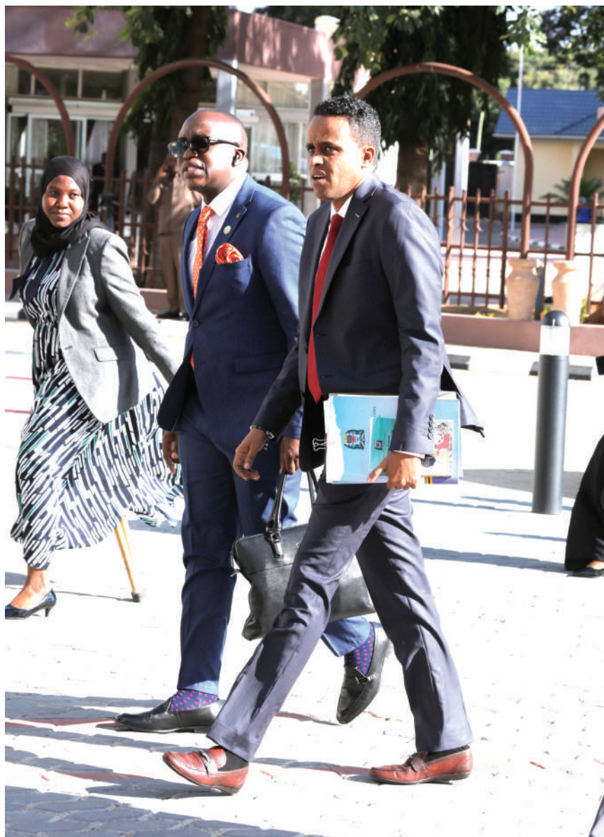
Waziri wa Kilimo, Hussein Bashe (kulia), akiwa na Naibu wake, Antony Mavunde, wakiingia bungeni kwa ajili ya kuwasilisha hotuba ya makadirio ya mapato na matumizi ya wizara hiyo, kwa mwaka wa fedha wa 2022/2023, kwenye vikao vya Bunge la bajeti vinavyoendelea, jijini Dodoma jana.

Awali, alibainisha kuwa shughuli za ujenzi na utengenezaji wa samani ambazo kiuhalisia zimekuwa ziki-kua sambamba na ongezeko la watu, zinategemea sana rasilimali ya misitu kama chanzo cha malighafi.