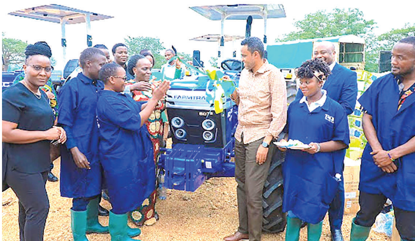
Waziri wa Kiimo, Hussein Bashe, katika mradi wa shamba darasa mkoani Dodoma, kwa vijana chini ya dira yake Rais Dk. Samia Suluhu Hassan, akiwalenga vijana na kinamama.