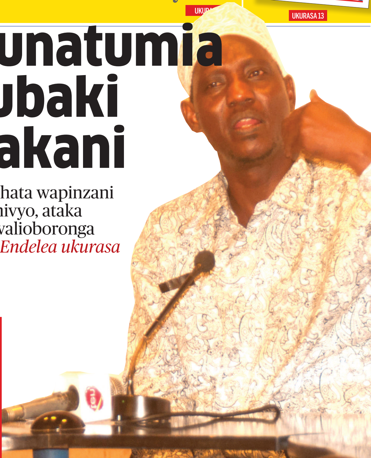
Katibu Mkuu wa CCM, Dk. Bashiru Ally.