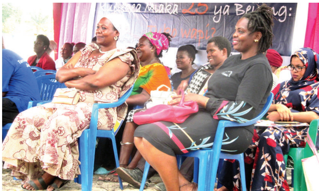
Baadhi ya wakazi wa Wilaya ya Ilala wakiwa kwenye maadhimishio hayo.