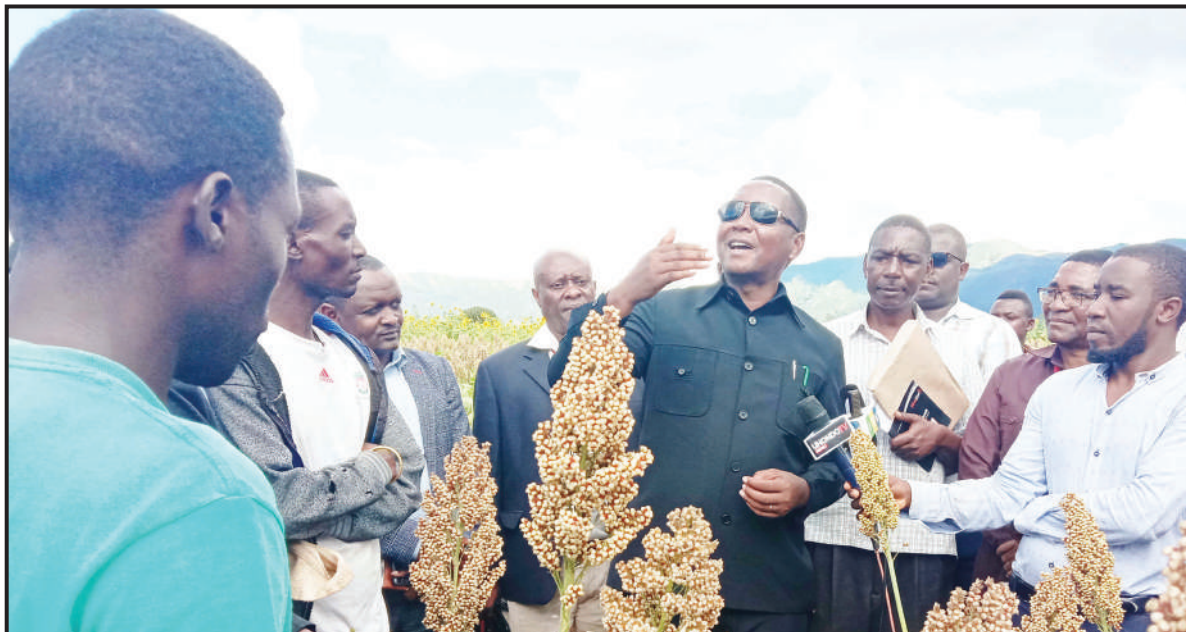
Waziri wa Kilimo, Prof. Adolf Mkenda (katikati), akizungumza na wakulima wa zao la mtama, wilayani Kongwa, mkoani Dodoma juzi, kuhusu faida ya kulima zao hilo kitaalam.

“Ninajua EWURA ina uwezo mzuri wa kufanya kazi, hivyo niwatake mfanye kazi kwa umoja na mshikamano huku mkiendelea kutafsiri malengo ya kuanzishwa kwa EWURA na malengo hayo yatafsiriwe kwa vitendo,” alisema.