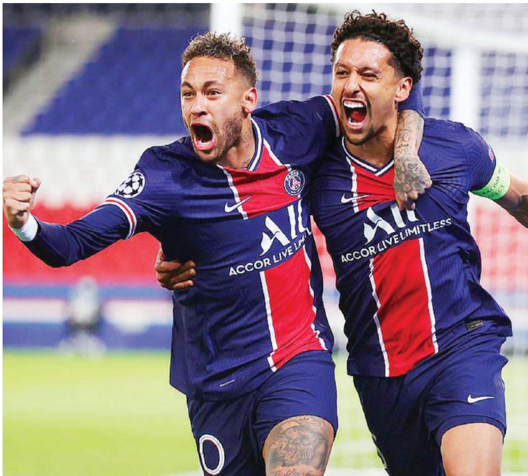
Mshambuliaji wa PSG, Neymar (kushoto) na Marquinhos, wakishangilia bao lililofungwa na nahodha huyo katika mechi ya nusu fainali ya Ligi ya Mabingwa Ulaya dhidi ya Manchester City iliyochezwa jijini Paris, Ufaransa juzi usiku. PSG ilichapwa mabao 2-1.