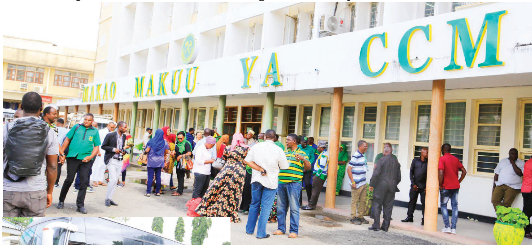
Baadhi ya wajumbe wa Mkutano Mkuu Maalum wa Chama Cha Mapinduzi (CCM), wakiwa nje ya ofisi za makao makuu ya chama hicho, jijini Dodoma jana, wakifuatilia taratibu za kuhudhuria mkutano huo unaofanyika leo. Picha ndogo: Wajumbe kutoka Mkoa wa Tanga, wakiteremka kwenye basi baada ya kuwasili jijini humo.

• Samia apitishwa kwa kishindo kugombea uenyekiti... Endelea ukurasa 2