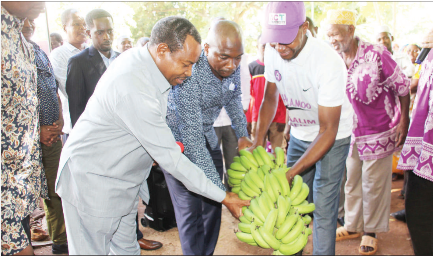
Makamu wa Kwanza wa Rais Zanzibar, Othman Masoud Othman (kushoto), akipokea mkungu wa ndizi aina ya mtwike aliopewa na vijana wa chama cha ACT- Wazalendo, Mtende Makunduchi, Mkoa wa Kusini Unguja, wakati alipotembelea baraza la vijana la chama hicho, jana.