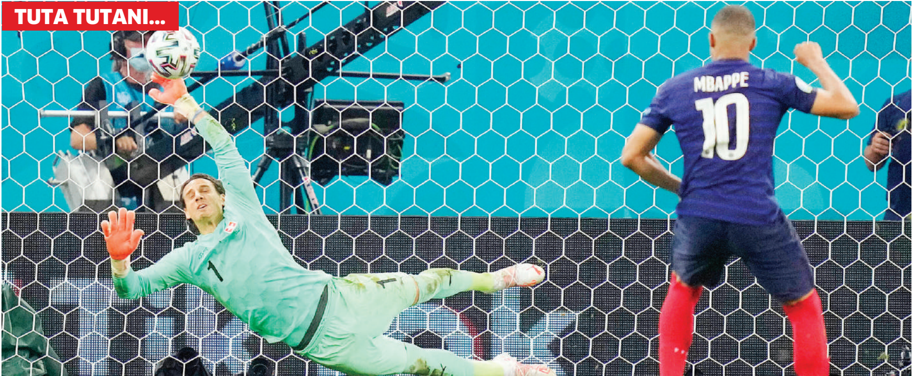
Kipa wa Uswisi, Yann Sommer, akiicheza penalti ya mshambuliaji wa Ufaransa, Kylian Mbappe wakati wa changamoto ya 'matatu' baada ya timu hizo kutoka sare ya mabao 3-3 kwenye mechi ya hatua ya 16-bora ya michuano ya Euro 2020 iliyopigwa Uwanja wa National Arena jijini Bucharest, Romania juzi. Uswisi ilisonga mbele kwa penalti 5-4.