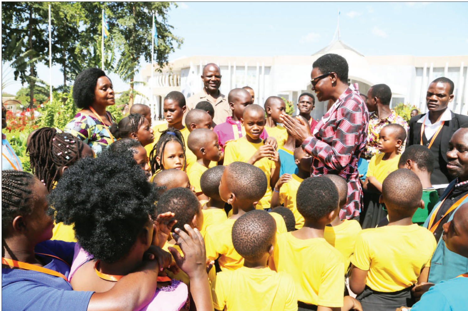
Naibu Spika, Dk.Tulia Ackson (katikati), akizungumza na watoto na walimu wa Kanisa la Moravian, Jimbo la Mashariki, Ushirika wa Uhuru, walipokutana nje ya viwanja vya Bunge, jijini Dodoma jana.

“Wito wa Serikali ya Jamhuri ya Muungano wa Tanzania kwa watendaji ambao wamekuwa wakikataa kutumia huduma zake kundenlea kuitumia shirika hilo kwa ajili ya kupata huduma za bima kama ambavyo wanalitumia Shirika la Bima la Taifa (NIC), hasa ikizingatiwa kuwa biashara ya bima nchini ni biashara huru na huria inayosimamiwa na Sheria ya Bima Na. 10 ya mwaka 2009 pamoja na kanuni zake,”