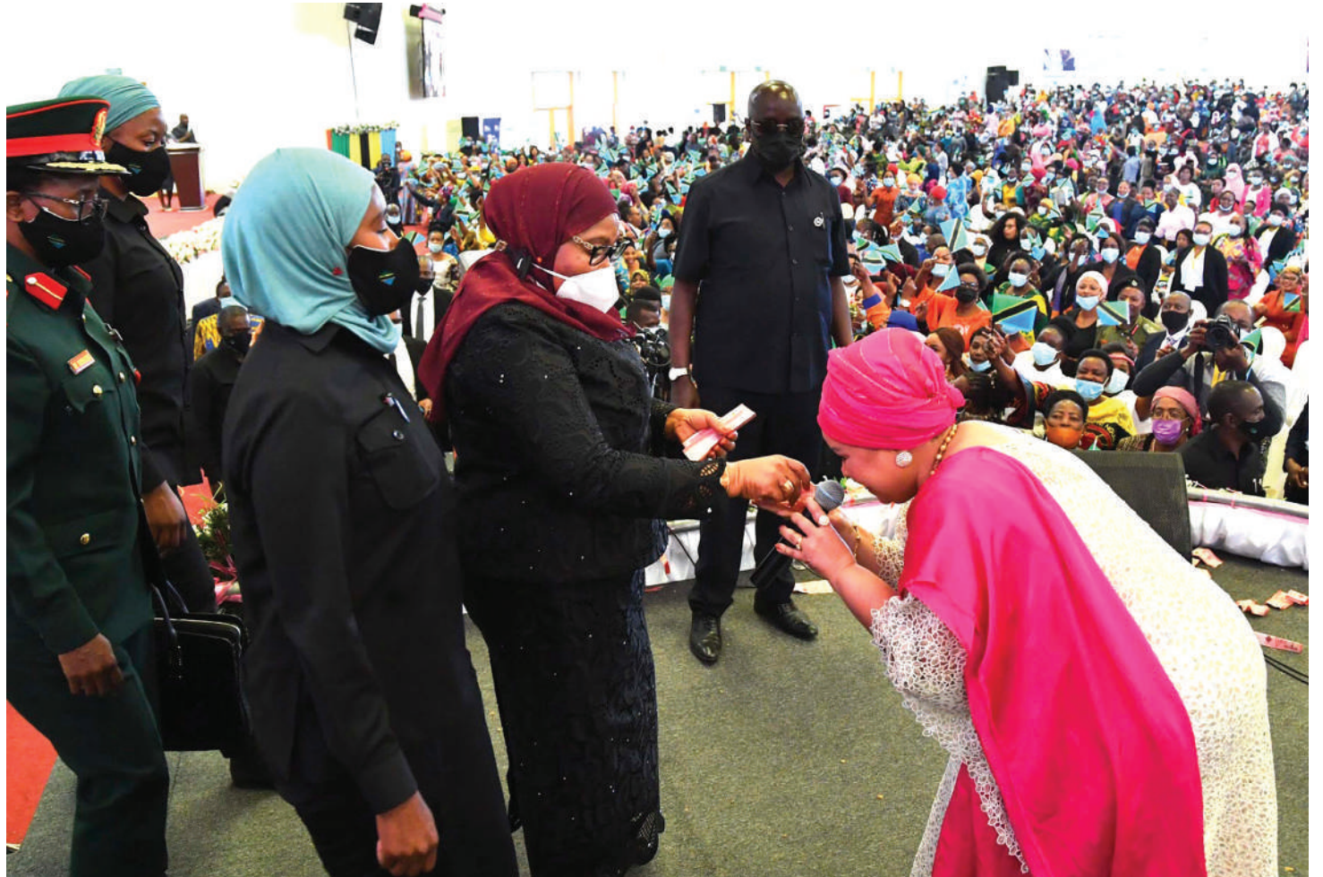
Rais Samia Suluhu Hassan, akikutana na wanawake kabla ya mkutano na kinamama jijini Dodoma.

Kwa Rais Samia, Wizara ya Maji imekuwa ikijitokeza hasa katika kutumia shughuli za usawa wa kijinsia na imefaulu zaidi katika