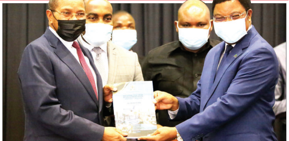
Waziri Mkuu, Kasimu Majaliwa (kulia), akimkabidhi Rais mstaafu wa awamu ya nne Dk. Jakaya Kikwete Mpango Mkakati wa Tatu wa Maendeleo wa Taifa wa miaka mitano 2021/22-2025/26, baada ya kuuzindua jijini Dodoma jana, unatarajiwa kutumia Sh. trilion 114.8.