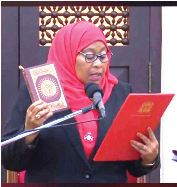
Rais Samia Suluhu Hassan, akila kiapo cha urais Machi mwaka huu. Leo ametimiza siku 104 za kuliongoza taifa.

Kubana haki hiyo kulizalisha mifumo mingine kama ukosefu wa demokrasia, uminywaji wa haki, viongozi wa umma kujichukulia sheria mkononi, kuumiza raia na ufisadi uliibuka kama alivyoripoti Mkguzi na Mdhhibiti Mkuu wa Hesabu