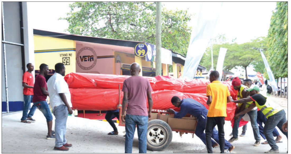
Wafanyabiashara wakiingiza bidhaa zao kwenye banda kwa ajili ya maonyesho ya 45 ya Biashara ya Kimateifa ya Dar es Salaam, Uwanja wa Mwalimu Nyerere, Barabara ya Kiliwa jana.

"Naushukuru pia uongozi wa ITV kwa kunipokea na kufanya kazi na mimi kwa zaidi ya miaka 20. Naamini kujituma na kufanya kazi kwa bidii ndiyo sababu nimeonekana, hivyo naamini tutashirikiana katika kuleta maendeleo ya taifa letu," alisema.