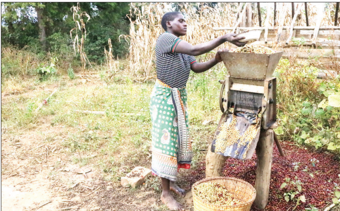
Mkulima wa kahawa katika Kijiji cha Hezya Wilaya ya Mbozi mkoani Songwe, akikobo kahawa yake baada ya kuvuna juzi.

Alisema viongozi wa ngazi zote wanatakiwa kusimamia na kuhakikisha miundombinu ya vyoo kwenye shule ili viwapo maalumu kwa ajili ya wanafunzi wenye ulemavu.