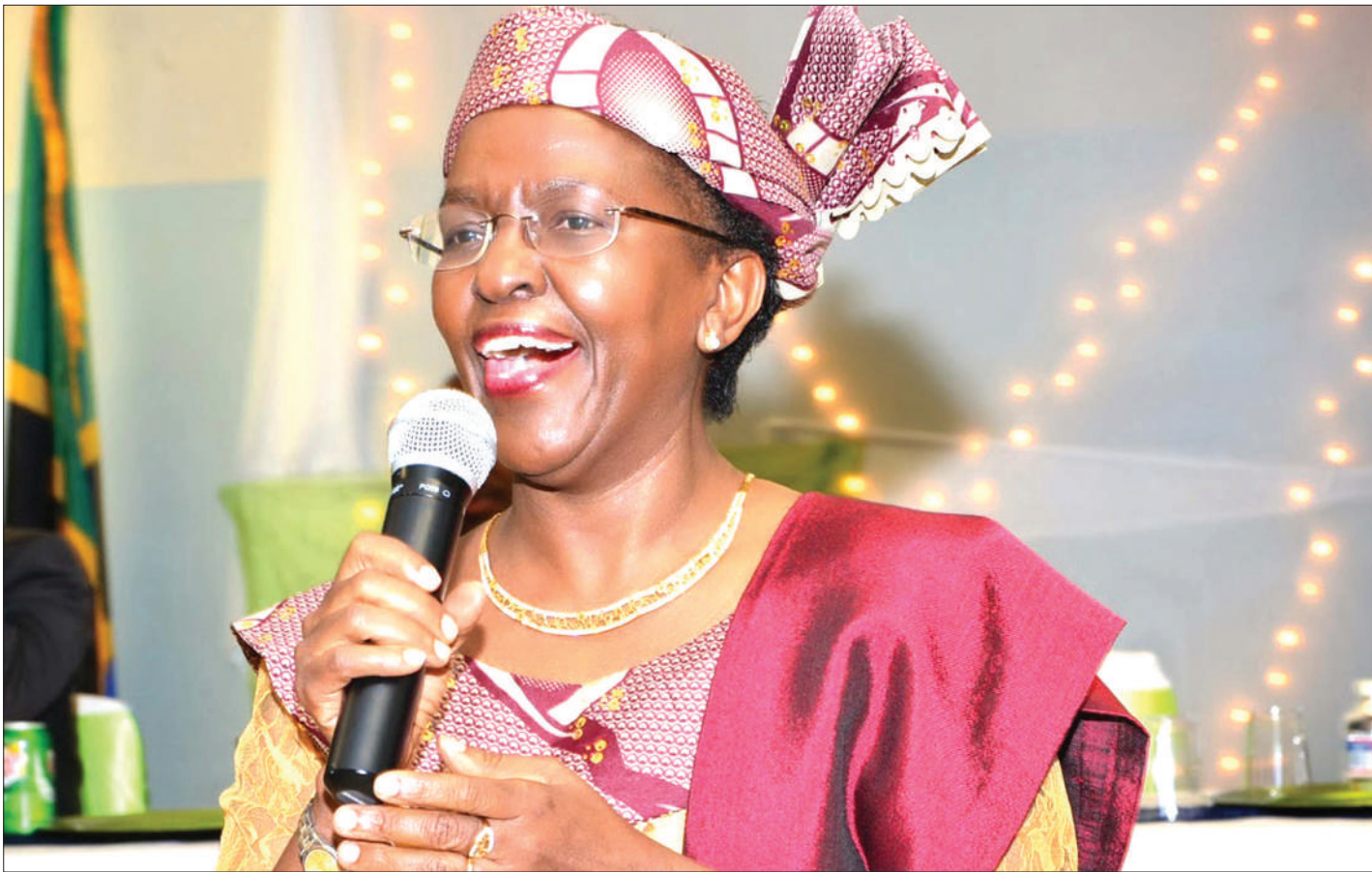
Waziri wa Mambo ya Nje, Liberata Mulamula.