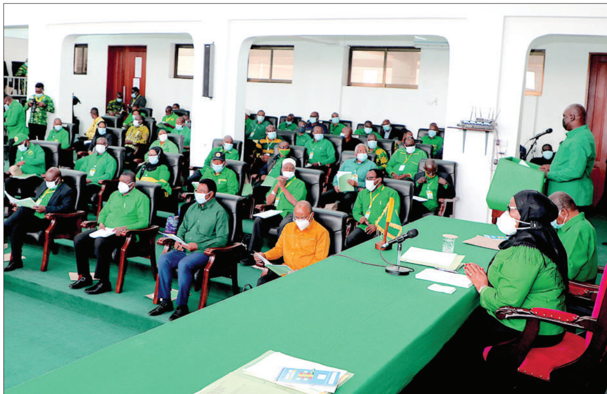
Mwenyekiti wa Chama Cha Mapinduzi (CCM), Rais Samia Suluhu Hassan, akifungua Kikao cha Halmashauri Kuu ya Taifa ya Chama hicho (NEC), jijini Dodoma jana.

Aidha, alisema husababisha ma-gonjwa mbalimbali yakiwamo ya moyo, shinikizo la damu, maumivu ya kichwa, uharibifu wa muda au wa kudumu wa masikio.