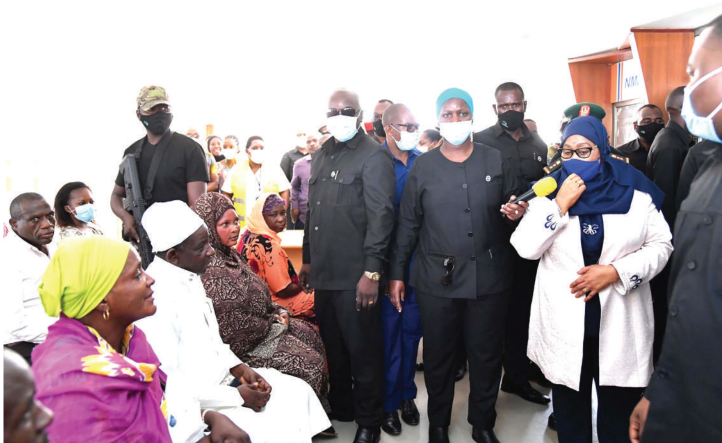
Rais Samia Suluhu Hassan, akiwa katika ziara ya kushtukiza katika Hospitali ya Rufani Mkoa ya Mwananyamala.