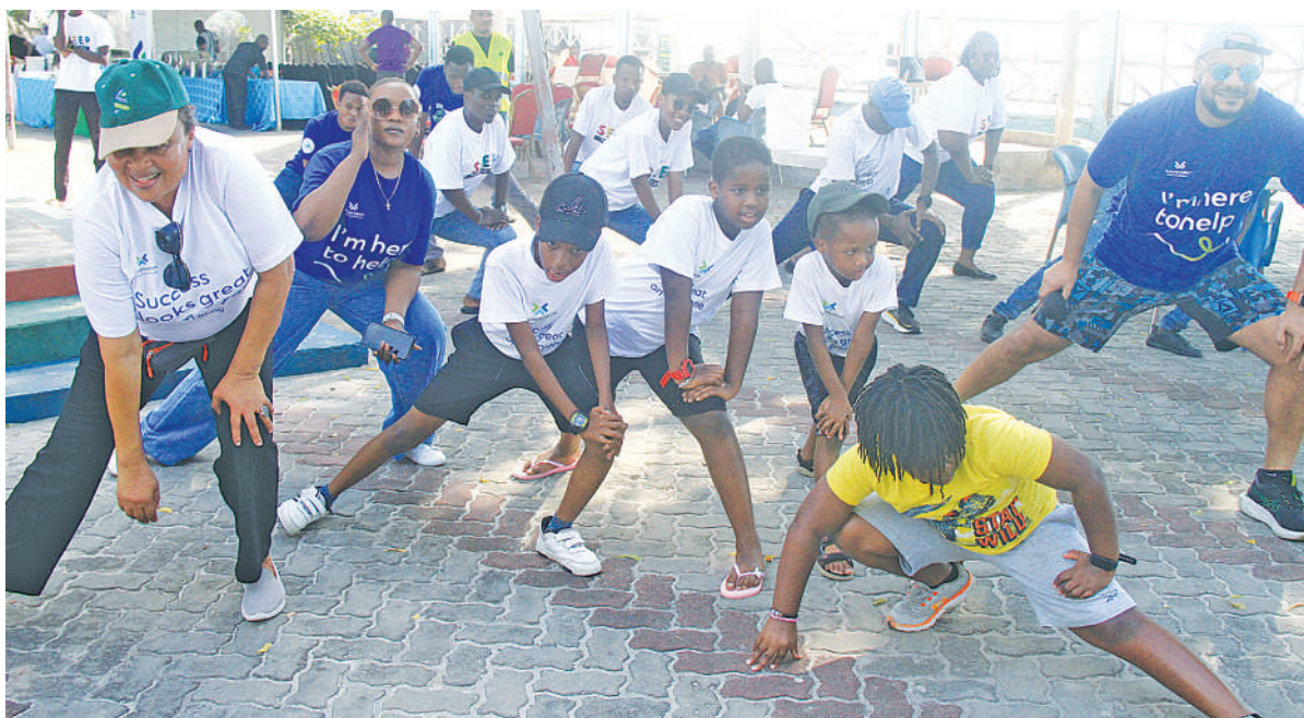
Wafanyakazi wa Standard Chartered na familia zao wakifanya mazoezi kabla ya kuanza kufanya usafi katika ufukwe wa Msasani jijini Dar es Salaam juzi.