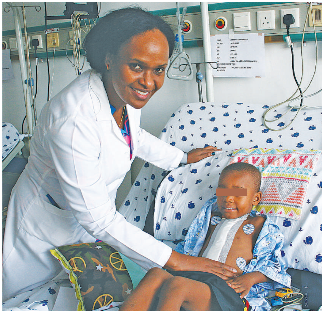
Daktari akihudumia mgonjwa wa moyo.

Akifungua mkutano wa mwaka wa Chama cha Madaktari Bingwa na Magonjwa ya Ndani Tanzania (APHYTA) jijini Dar es Salaam, Waziri wa Afya, Ummu Mwalimu anaeleza: "Serikali imeendelea kutoa kipaumbele kwa madaktari bingwa katika kuwaendeleza kitaaluma kupitia programu ambayo imetoa nafasi za ufadhili wa masomo ya ubingwa kwa mwaka wa masomo 2023/2024, kwa wanafunzi 1,109 ikiwa ni ongezeko la wanafunzi 582 ukilinganisha na mwaka wa masomo