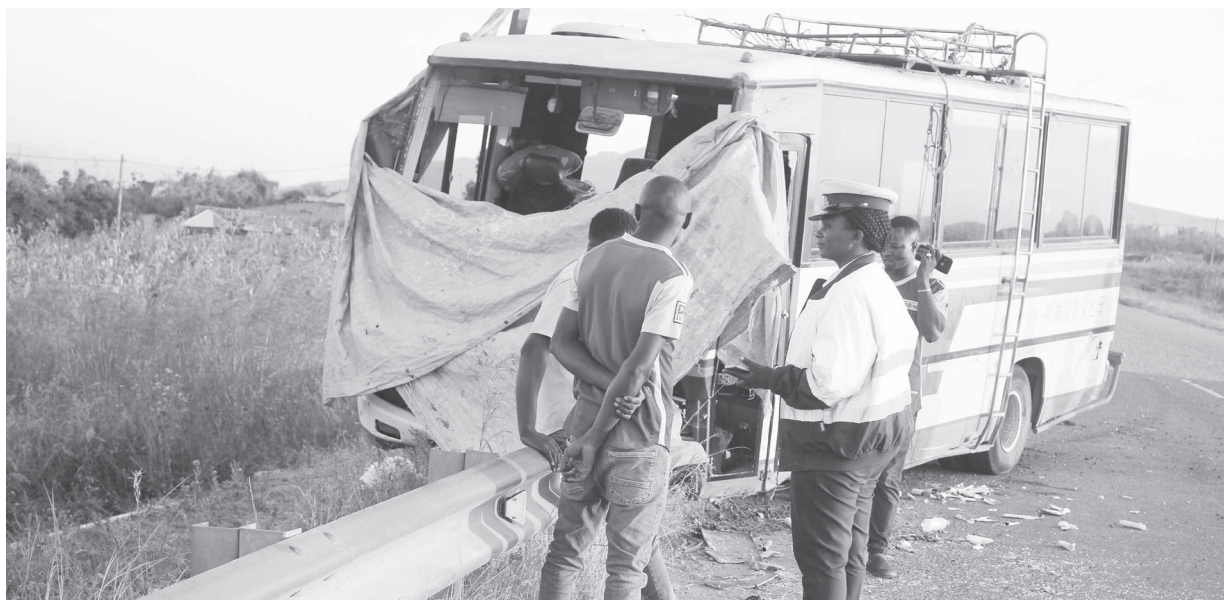
Mmoja wa askari wa Kikosi cha Usalama Barabarani Mkoa wa Mbeya, akizungumza na dereva wa basi linalofanya safari zake kati ya Jiji la Mbeya na Wilaya ya Chunya ambalo lilipata ajali katika Kijiji cha Rwanjilo, inadaiwa chanzo ni mashimo ya barabarani.

Kitabu hicho kimeandikwa kwa ushirikiano na wananchi wa Uhekule wanaoishi mikoa mbalimbali ikiwa ni kijiji cha kwanza mkoani Njombe kuandika kitabu chake chenye kumbukumbu wa historia.