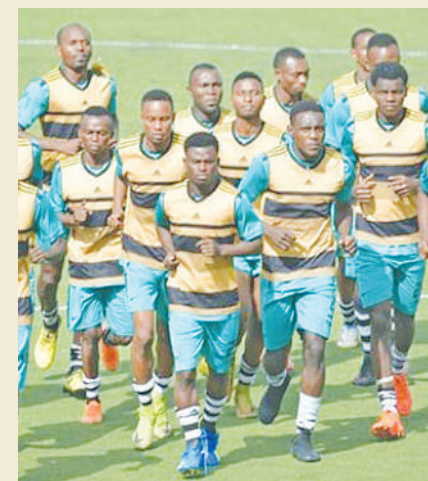
Wachezaji wa KVZ mazoezini