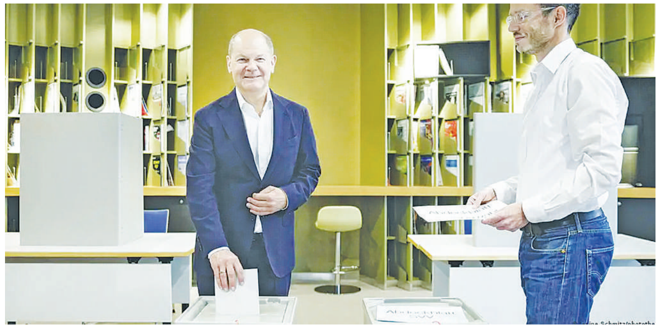
Kansela wa Shirikisho la Ujerumani, Olaf Scholz, akipiga kura yake katika kituo cha kupigia kura huko Potsdam, Ujerumani, juzi.

“Wanajua kwamba Qatar haina budi ila kuwafukuza viongozi wa Hamas ikiwa Marekani itawataka wafanye hivyo,” ofisa aliyefuatilia kwa karibu mazungumzo hayo alinukuliwa akisema. BBC