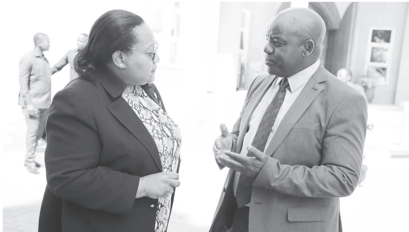
Waziri wa Katiba na Sheria, Dk. Pindi Chana, akijadiliana jambo na Mwanasheria Mkuu wa Serikali, Dk. Eliezer Feleshi, walipokutana bungeni Dodoma jana.

Alisema: "Tunapokaa hivi tukawasiliza na kutatua kero mbalimbali zinazowasumbua basi tutakuwa tumefanya jambo kubwa la kuwarejeshea wananchi furaha iliyopotea kwa kuondoa kero zao zinazowasumbua kwa muda mrefu".