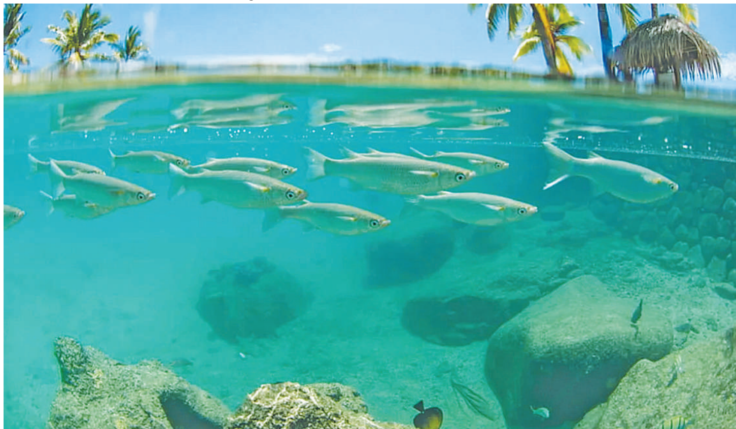
Bahari inapohofiwa kujaa 'magugu maji'.

U TAFITI wa hivi karibuni unaeleza kuwa bahari zinabadilika kuwa kijani kibichi na hilo huenda linachangiwa na mabadiliko ya tabianchi. Pengine ni matokeo ya kupenya joto kali na mwanga zaidi.