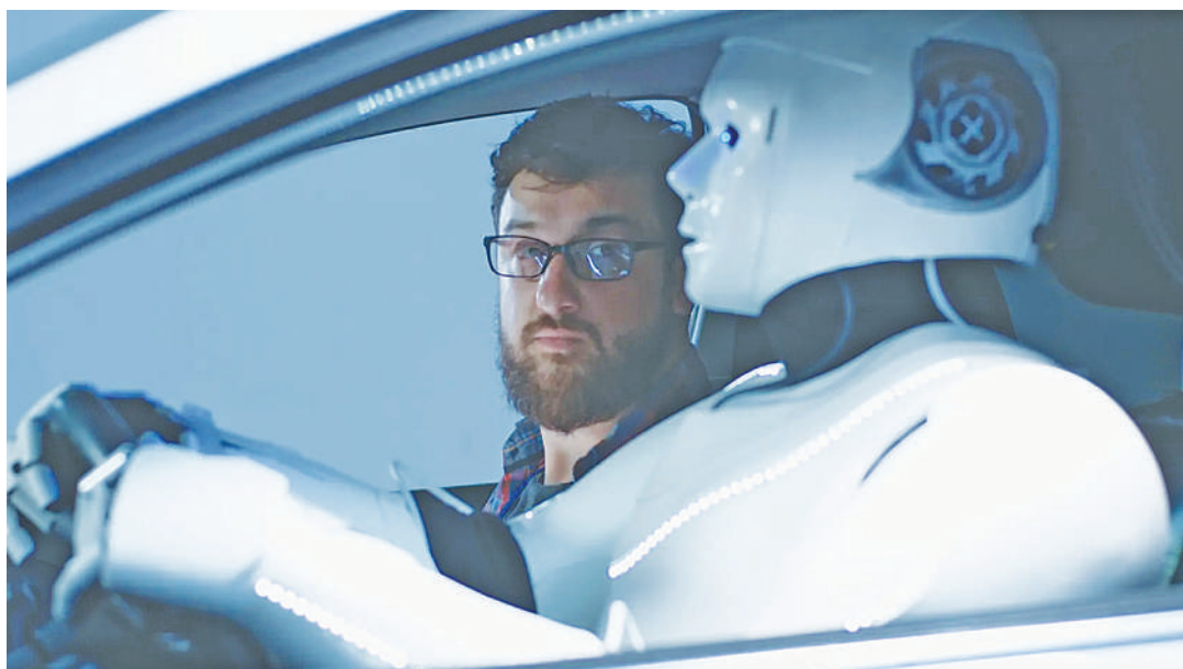
Gari roboti likiwa barabarani.

• Yana ufanisi hakuna ajali, husoma, huelewa mazingira